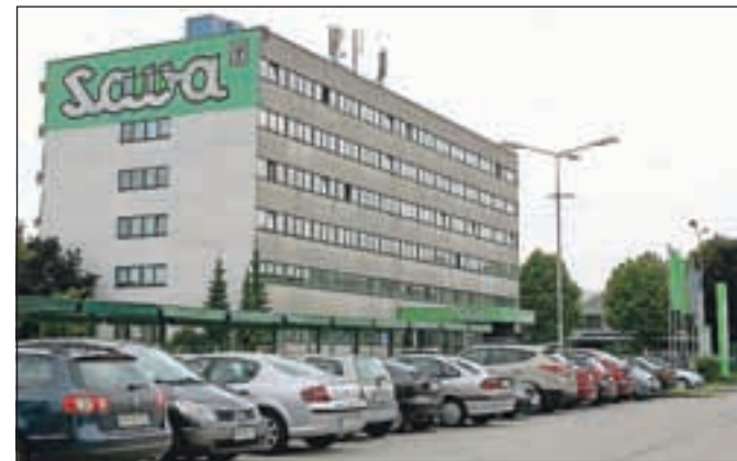
Krovna družba Sava z upravo in s približno trideset zaposlenimi, naj bi se do konca leta preselila. V Savi pravijo, da odločitev o morebitni selitvi ni bila sprejeta.