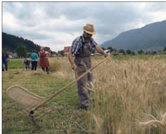
Udeleženci žetve po starem so ugotovili, da je ročna žetev mnogo bolj naporna kot tista s traktorjem ali kombajnom.

bile včasih v Ratečah s pšenico zasejane vse njive, sedaj je bila ta edina: »Pravijo, da moramo bolj poskrbeti za samooskrbo s hrano, jaz sem to tudi storil.« Sicer pa se žetve starejši udeleženci spominjajo tudi kot družabnega dogodka.