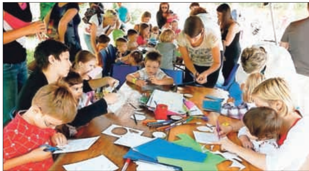
Posebej priljubljen je otroški Kranfest, ki ga znova pripravljajo na Pungartu.