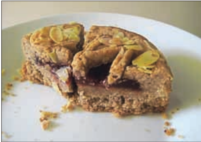
Linška torta

Mesto te zelo hitro prevzame. Sploh če imaš rad urejenost, naravo v mestu oziroma mesto v naravi. Rekreativskih površin za tek in kolesarjenje, sprehajalnih poti, parkov in drugega zelenja je