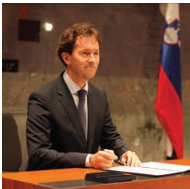
Predsednik državnega zbora Gregor Virant je razpisal predsedniške volitve.