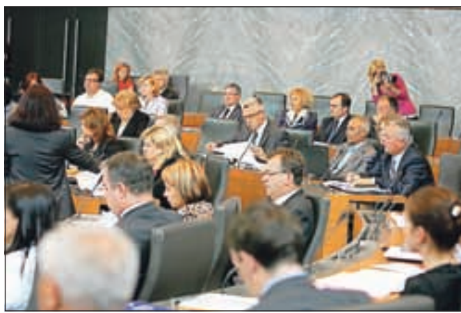
Državni zbor je doslej na petih rednih in 17 izrednih sejah sprejel 73 zakonov po hitrem in tri zakone po običajnem postopku.