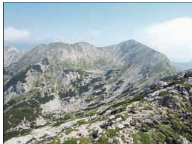
Pogled na Vogel z Žabiškega Kuka, zahodnega grebena Vogla