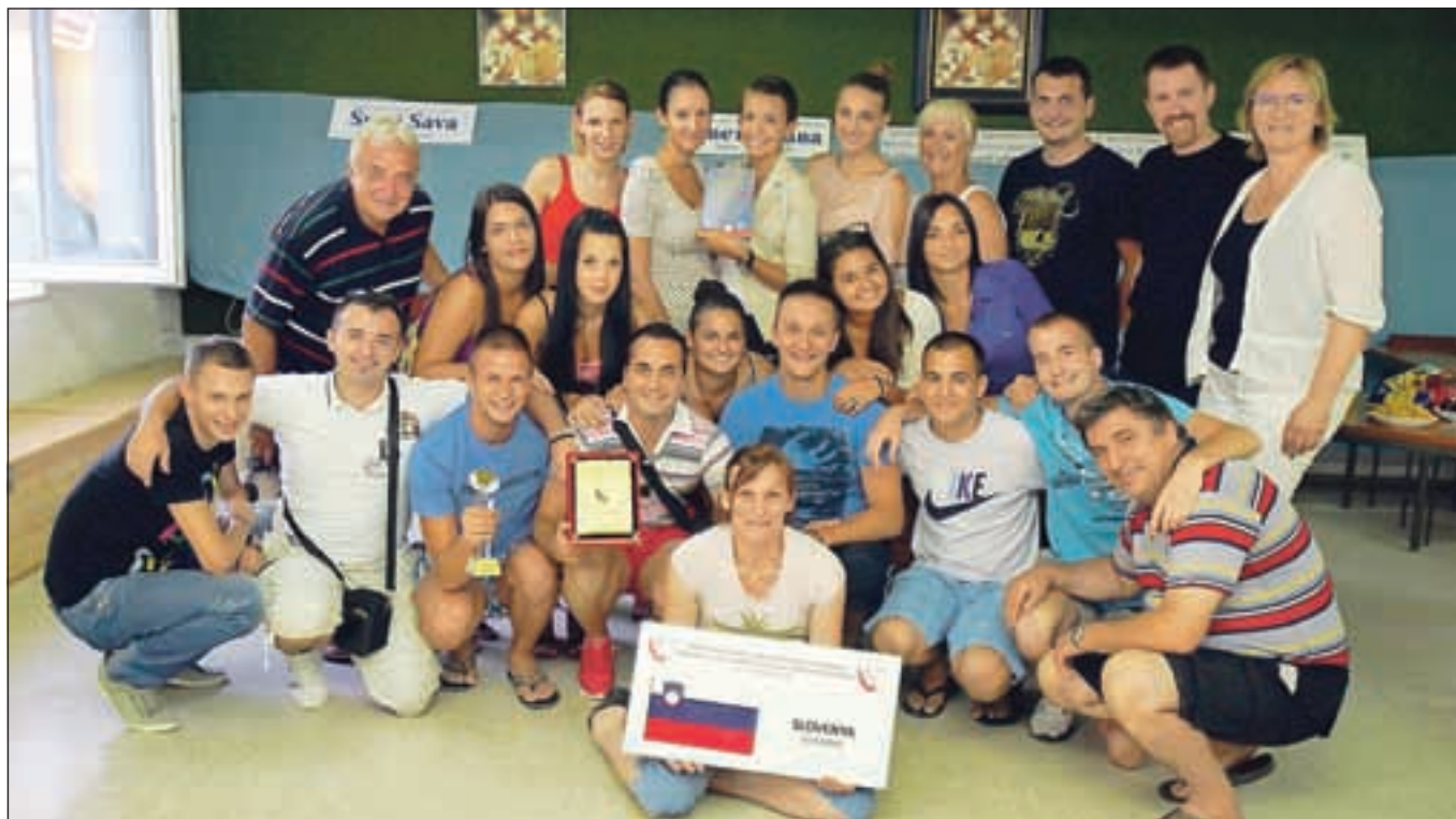
Srbsko kulturno in prosvetno društvo Sveti Sava Kranj je ob vrnitvi v Kranj za vse člane in prijatelje društva pripravilo manjše družabno srečanje, kjer so proslavili uspehe s Cipra.