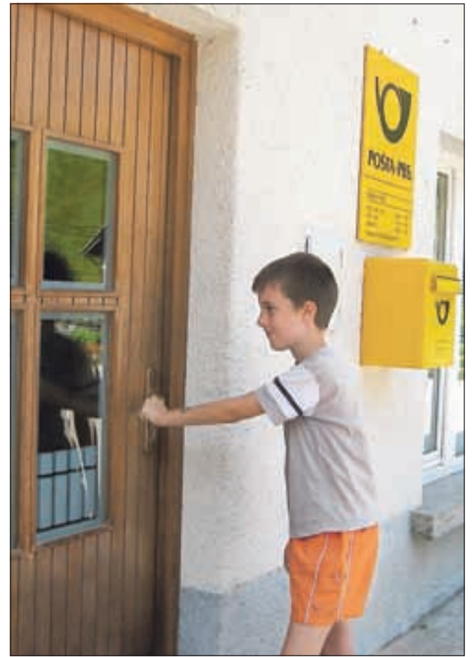
Vrata poštnega urada na Sovodnjo so večji del dneva zaprta, krajanji pa zaman pritiskajo na kljuko.

Z željo po bankomatu so že seznanjeni v Gorenjski banki: »Analizirali smo uporabniški potencial in ugotovili, da število opravljenih transakcij nikakor ne bi doseglo ravni, ki bi opravičevala namestitev bankomata.« Tako kot tudi druge banke, ki smo jih vprašali, ugotavljajo, da investicije v nakup in postavitev bankomata (med 30 in 50 tisoč evri) ne bi pokrili, še manj pa stroške rednega oskrbovanja, varovanja, komunikacij, servisiranja in podobno.