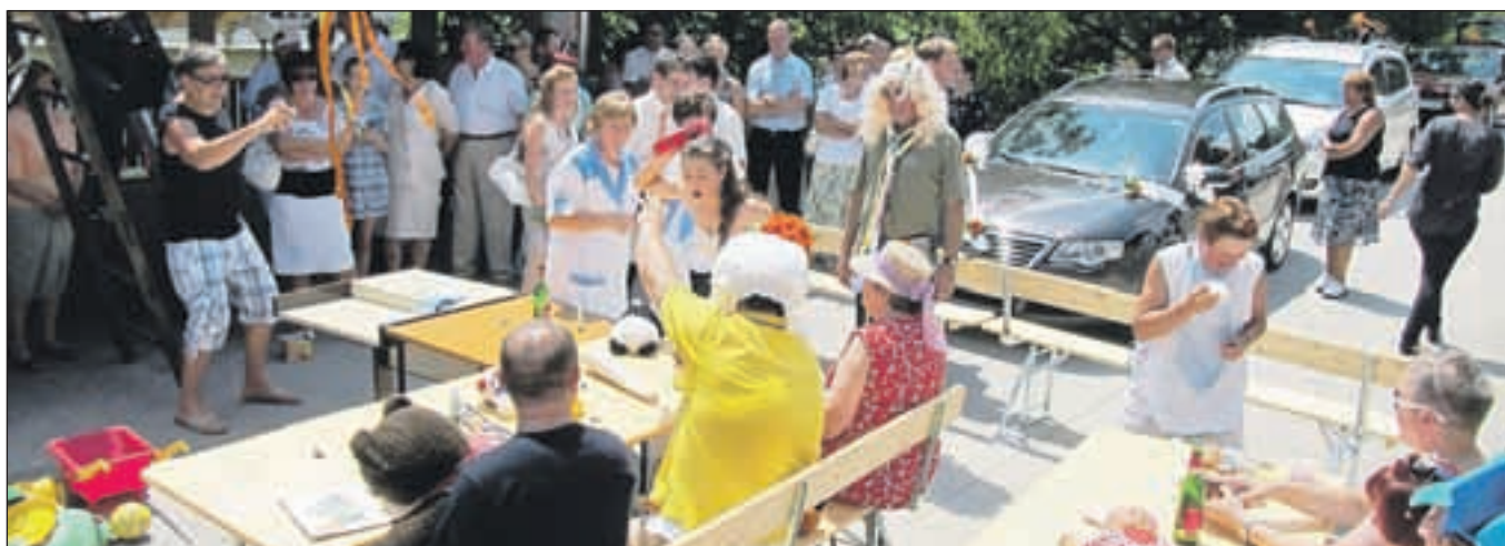
Pred novim vaškim domom na Letencah se dogodki vrstijo drug za drugim.