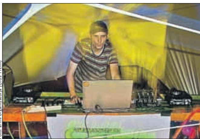
V Tenetišah se je ustavila karavana uveljavljenih DJ-jev.