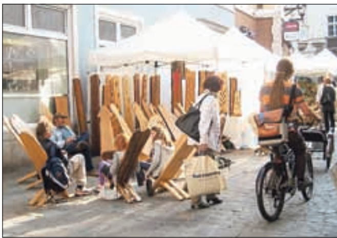
Umetniški vtis ulic