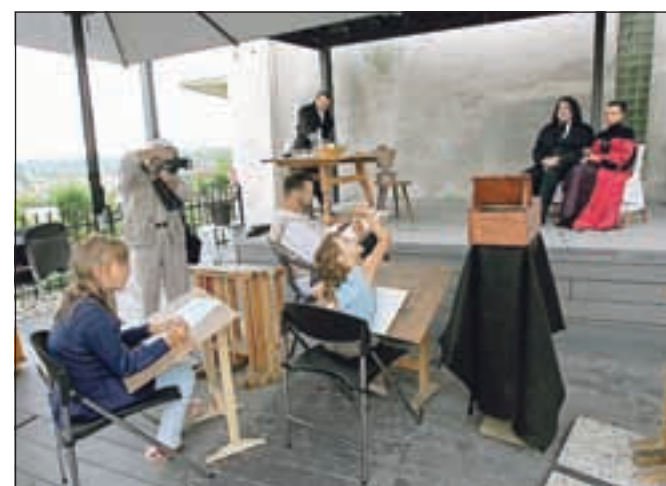
Pesnikovega portreta se je lotilo tudi nekaj obiskovalcev.