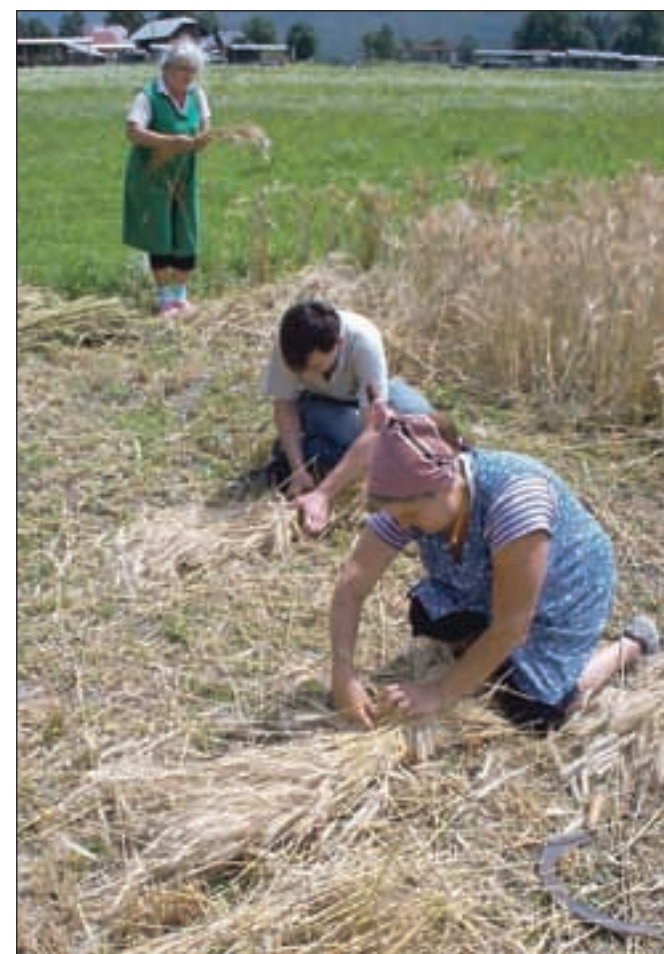
Žito se povezuje v snope s povese, ki so ravno tako narejeni iz požetega žita oziroma slame.