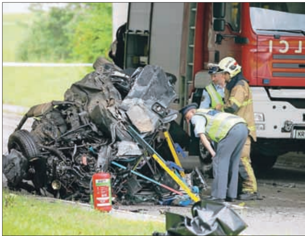
Po lanski uveljavitvi nove prometne zakonodaje se je zmanjšalo število prometnih nesreč z najhujšimi posledicami.

Število nesreč na slovenskih cestah se je v prvem letu po začetku uporabe nove zakonodaje sicer povečalo za trinajst odstotkov, vendar pa so bile posledice »blažje«. Od lanskega julija do konca prejšnjega meseca je umrlo 116 udeležencev oz. 23 odstotkov manj kot leto poprej, hudo ranjenih je bilo za 17 odstotkov manj ponesrečenec, lažje pa za 14 odstotkov manj. Največje zmanjšanje števila mrtvih so zabeležili pri kolesarjih (68 odstotkov manj), voznikih kolesa z motorjem (60 odstotkov) in potnikih (30 odstotkov). Število umrlih se je po drugi strani povečalo pri voznikih – za 11 odstotkov. Med vzroki prometnih nesreč s smrtnim izidom je znova prednjačila hitrost, za njo pa nepravilna stran oziroma smer vožnje, ki sta bili prisotni v 64