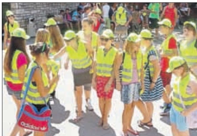
Varno do plaže ...