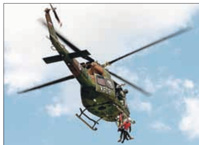
Gorski reševalci so v prvi polovici letošnjega leta že skoraj izenačili število posredovanj iz lanskega leta. Problematični so predvsem turistični planinci.

Kot še dodaja Potočnik, ne izstopajo planinci nobene narodnosti, čeprav so nekateri pogosto žrtve šal na njihov račun, vendar po besedah predsednika Gorske reševalne zveze Slovenci niso bistveno boljši. Podobna so tudi opažanja policistov gorske enote Policijske uprave Kranj. Policisti ugotavljajo, da je opremljenost obiskovalcev gora v veliki večini primerov, s posameznimi izjemami, ustrezna in dobra. Kot pa je povedal predstavnik policijske uprave Kranj Boštjan Lindav, so v soboto obravnavali pravi primer neupoštevanja nasvetov o opremljenosti: »Mlajši možki, obut v croke in oblečen v kolesarski dres se je oglasil v Češki koči, nato še v koči na Ledinah, od koder naj bi se prek Jezerskega sedla