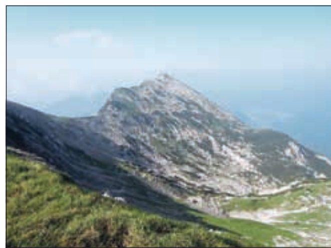
Žabiški Kuk zahodnega grebena Vogla