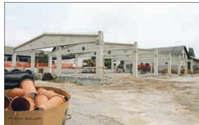
Eurospin (na sliki) bo na Trati, Spar na Grencu.