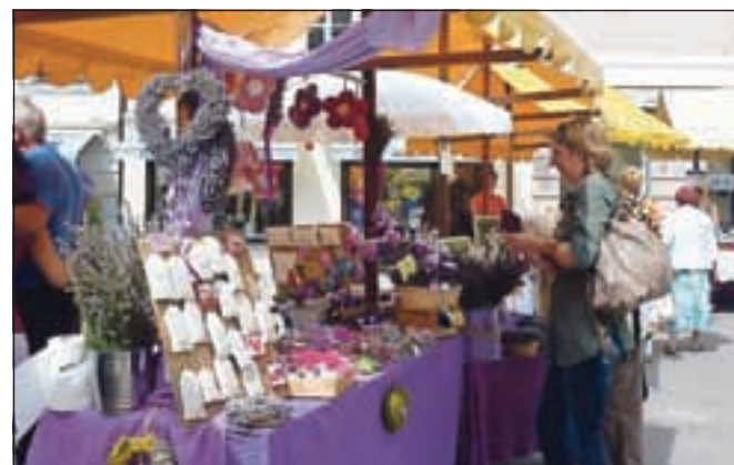
Tudi letos bo sobotno dopoldne v mestu v znamenju Kranjskega semnja.

Jutri dopoldne bo v mestu potekal že četrti Kranjski smenj, turistično ponudbo pa bodo predstavili tudi predstavniki s Kranjem pobratenih mest. Na Pungartu bo vse tri dni potekal otroški Kranfest, kot eden osrednjih dogodkov pa se na prireditev vrača tudi nedeljska kolesarska dirka Po ulicah Kranja.