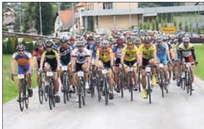
Pokal Polanskih puklov se je začel z vzponom na Stari vrh.