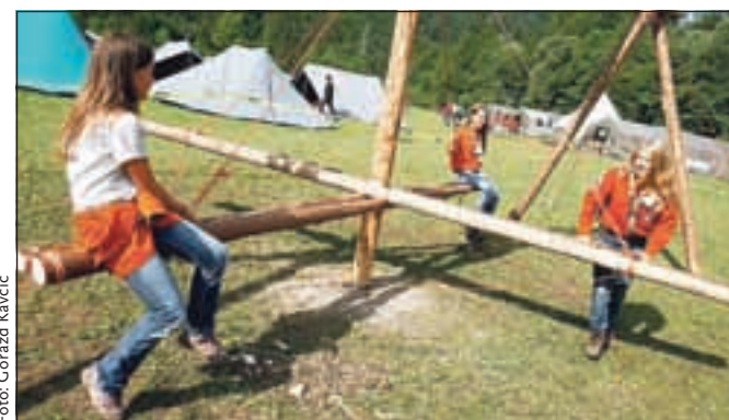
Skoraj vso taborniško infrastrukturo so skavti postavili sami.