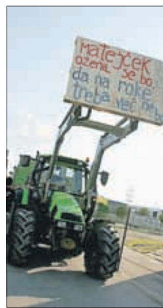
Matejček se ženi ...