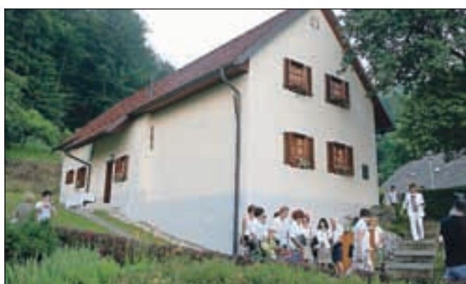
O nadaljnji usodi Aljaževe hiše v Zavrhu bodo odločali svetniki.