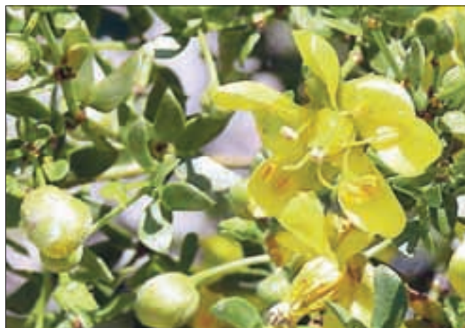
Aleksandrijsko seno lahko občudujemo na dopustu v Egiptu.

Čaj iz listov sene, ki jih dobimo tudi v naših lekarnah, pripravimo sledeče: tričetrt žličke sesekljanih listov prelijemo z dvesto mililitri vroče, vendar ne vrele vode in pustimo pokrito stati deset do dvajset minut, nato precedimo. Zvečer spijemo skodelico toplega čaja. Učinkovati začne po desetih do dvanajstih urah. Mnogi priporočajo tudi čaj v obliki preliva – isto količino