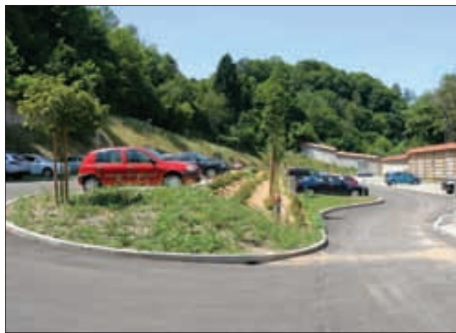
Po ureditvi parkirišča na Nunskem vrtu v Škofji Loki uvajajo celovit parkirni režim za mesto.

za »zgornji« del mesta in pri Tehniku za »spodnji«. Predlog parkirnega režima je v javni razpravi, septembra pa ga bo prvič obravnaval občinski svet, še pove župan. Z njim naj bi uvedli parkirne cone z različnimi režimi parkiranja. Že sedaj za prvo cono parkiranja veljata parkirišče pred upravno enoto, kjer je prve pol ure parkiranje brezplačno, vsako nadaljnjo uro pa znaša en evro, in pred zdravstvenim domom (ter na Stari cesti pod Petrolom), kjer sta brezplačni prvi dve uri, pozneje pa evro na uro. Druga cona bi bili parkirišči na Štemarjih in na platoju na Novem svetu, kjer bi bila prva ura parkiranja brezplačna, cena naslednje ure pa bi znašala pol evra. Na parkirišču pri šolskem centru na Podnu pa bi vsaka ura parkiranja znašala 25 centov. V vseh treh navedenih conah bo od ponedeljka do petka parkiranje plačljivo od 7. do 17. ure, v soboto pa bo parkiranje