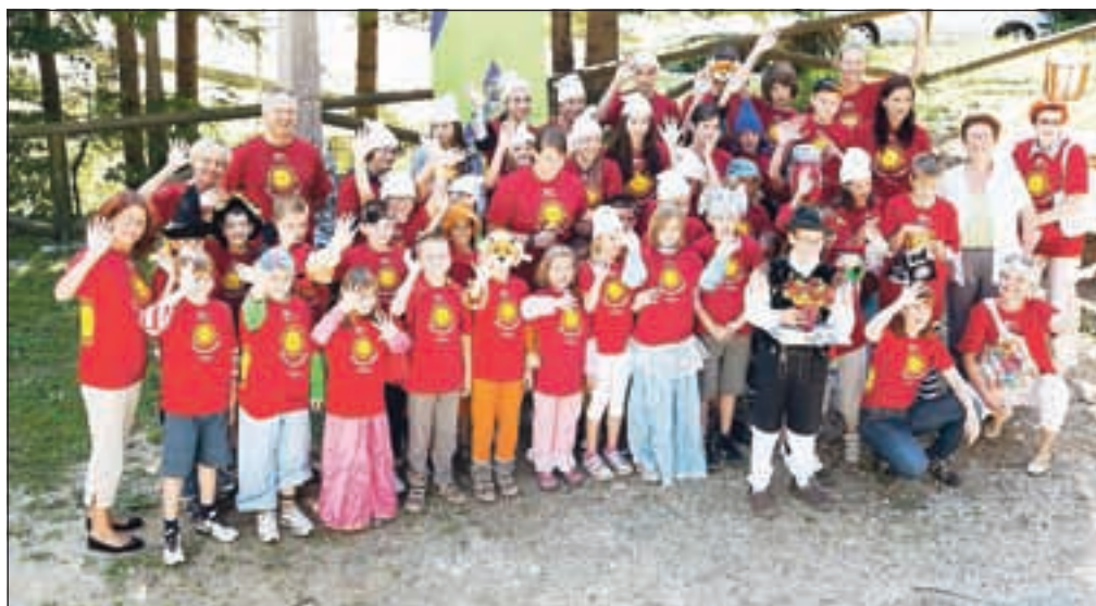
Otroke, ki preživljajo počitnice v Kranjski Gori, je v torek obiskala tudi ambasadorica slovenskega prostovoljstva Barbara Miklič Türk.

Kranjska Gora – Zveza prijateljev mladine Slovenije in farmacevtska družba Lek sta letos že štirinajsti zapored organizirala vseslovensko akcijo Pomežik soncu, s katero so tokrat zagotovili letovanje za okoli tristo otrok. Zanje so v torek v Kranjski Gori organizirali Lekov živžav, na katerem jih je pozdravila tudi ambasadorica slovenskega prostovoljstva Barbara Miklič Türk. Ker pa je akcija vzporedno organizirana tudi na lokalni ravni v okviru društev in zvez prijateljev mladine, bodo po izkušnjah na vseslovenski ravni prijatelji mladine zagotovili brezplačno letovanje približno tisoč otrokom. »Veseli smo, da je odziv donatorjev kljub kriznim časom še vedno zelo velik in da so