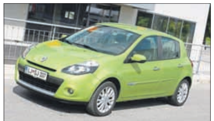
Renault Clio ostaja najbolje prodajan avtomobil na slovenskem trgu.

Med najbolje prodajanimi modeli je na prvem mestu še naprej Renault Clio s 1685 prodanimi primerki, Renaultovo pa je tudi drugo mesto, ki pripada modelu Megane (1285). Sledi Volkswagnov dvojec Polo (1033) in Golf (869), na petem mestu je Opel Corsa (688), nato pa do konca deseterice še Škoda Octavia (682), Opel Astra (677), Kia Rio (642), Škoda Fabia (583) in Citroen Berlingo (562).