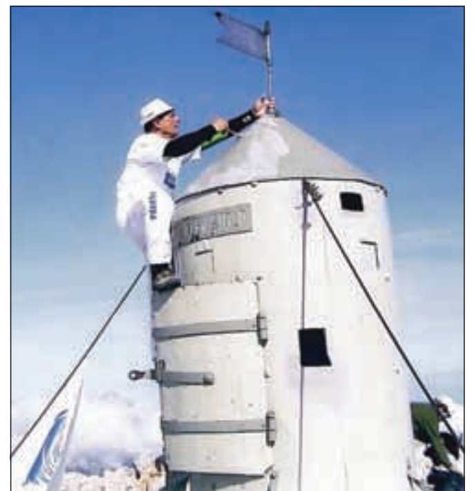
Zvone Frantar med delom na Aljaževem stolpu na vrhu 2864 visokega Triglava

Za zaključek pa Zvone Frantar še dodaja, da so za odstranjevanje nalepk z notranjosti stolpa porabili več kot dve uri in pol: Tudi pri sebi in dnevni sobi po stenah