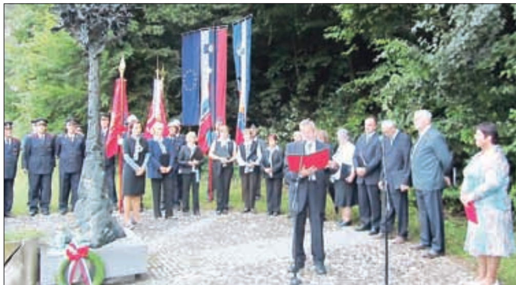
Sobotna slovesnost na vrhu Bistriškega klanca

so bile še isti večer požgane. Ker devet življenj ni bilo dovolj za maščevanje in ustrahovanje ljudi, so dva dni kasneje na vrhu klanca pobili še 50 talcev iz Begunj, večinoma iz okoliških krajev. Kri je tekla po klanecu do nekdanje Froncove hiše v Bistrici, so v spominih povedali starejši Bistričani.