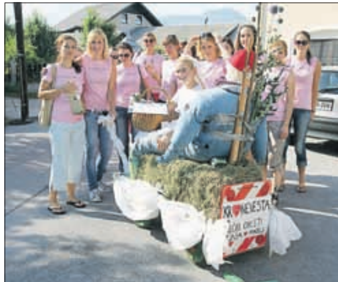
Za deklščino so se dekleta opremila z roza majicami.