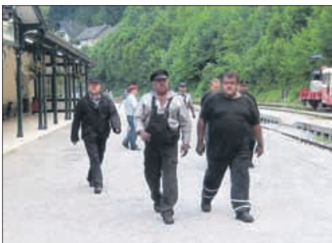
Človeška glavčina parne lepote ...