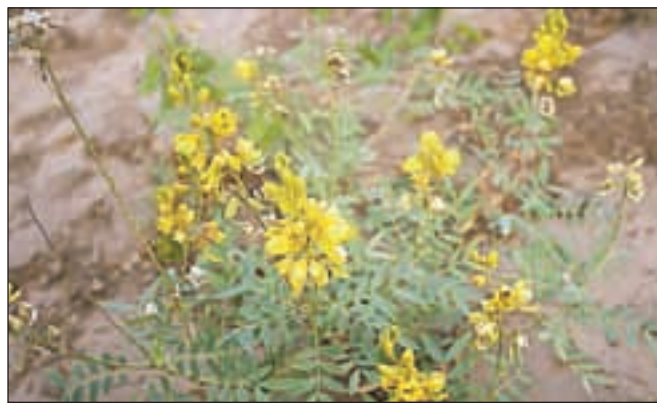
Indijska vrsta sene je zelo cenjena v tamkajšnjem ljudskem zdravilstvu.

listov namakamo v mrzli vodi 10 do 12 ur – s tem se izluži manj snovi, ki bi lahko povzročile krče. Zdravilnega čaja ne smemo uživati več kot 14 dni brez zdravniškega nadzora.