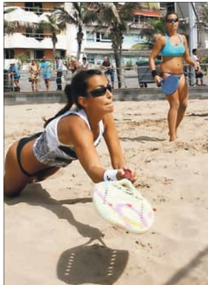
Tenis na mivki se je z italijanskih plaž preselil tudi k nam.

V Sloveniji na področju tenisa na mivki deluje Športno društvo Tenis na mivki