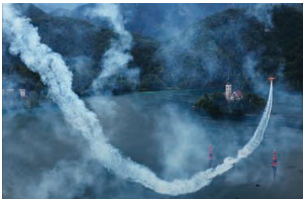
Najhitrejši pri natančni izvedbi figur je bil Tomo Poljanec , na državnem prvenstvu pa je prvo mesto osvojil Benjamin Ličer .

Medtem ko so letala na državnem prvenstvu akrobatske figure izvajala na večji višini, pa je bila za gledalce precej bolj atraktivna dirka med štirimi napihljivimi stebri na jezeru, ki so bili drug od drugega oddaljeni 450 metrov. Pri tem so letala prav tako izvajala različne akrobatske figure, hkrati pa se meri še čas, je razložil Repovž.