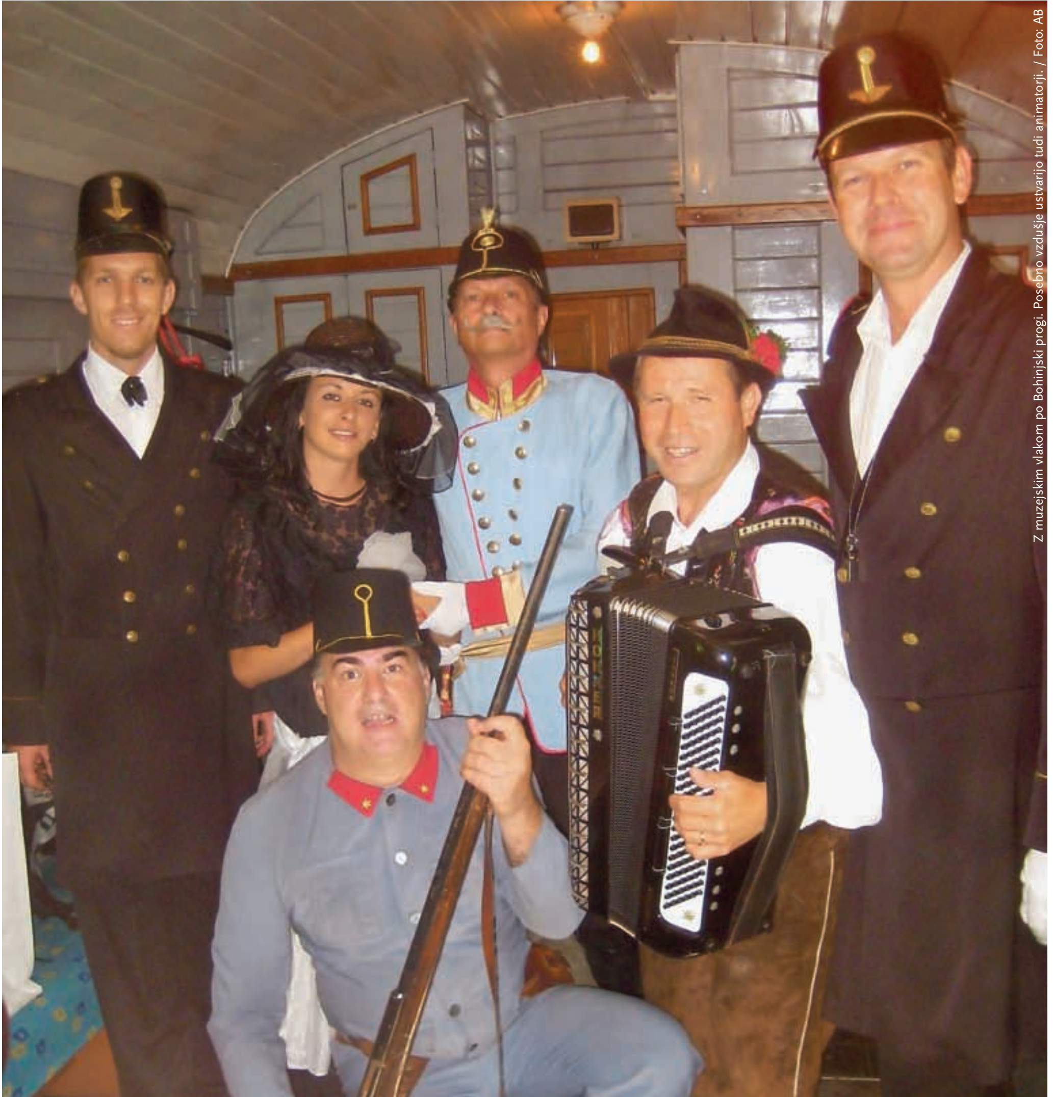
Z muzejskim vlakom po Bohinjski progi. Posebno vzdušje ustvarijo tudi animatorji.