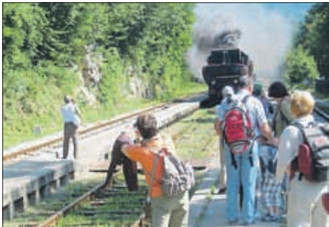
Parna lokomotiva tik pred postajo Bled-Jezero. Vedno pritegne pozornost.

Enodnevni izlet, ravno prav dolg in dovolj zanimiv, da ne veš, kdaj čas mine.