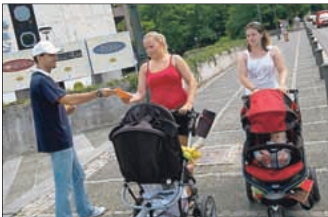
Sindikalisti so turiste opozarjali na težak položaj gostincev. Med odzivi so izvedeli, da imajo v Sarajevu skoraj enake plače kot na Bledu.

Plače niso edini razlog nezadovoljstva gostincev, saj so tudi delovne razmere slabe, velikokrat ne izpolnjujejo zakonskih zahtev. Vse zaposlene v turizmu so sindikalisti opozorili, da jim mora delodajalec tudi na višku sezone, kljub temu da tedenski delovnik morda znaša 56 ur, zagotoviti odmore in počitke. V obdobju 24 ur ima delavec pravico do 12-urnega počitka, po sedmih dneh en dan (24 ur) počitka. Razpored delovnega časa mora biti pripravljen vsaj en teden vnaprej. »Vse prenašajo, saj vedo, da bi po obisku inšpektorja ostali brez službe.