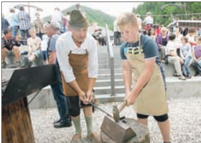
V vigenjcu so lahko obiskovalci skovali vsak svoj žebelj.