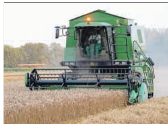
Dobra polovica gorenjske pšenice je požeta, ponekod žetev ovira slabo vreme.

Na žetvenih površinah KŽK Kranj so konec preteklega tedna želi s šestimi kombajni. Kot so povedali v Kmetijsko gozdarski zadrugi Sloga Kranj, je odkupna cena pšenice za krmo 165 evrov za tona, za krušno žito pa je glede na kakovostni razred od 175 do 205 evrov za tona. Na njivah KŽK Kranj so imeli letos na sto hektarjih pridelavo semenske