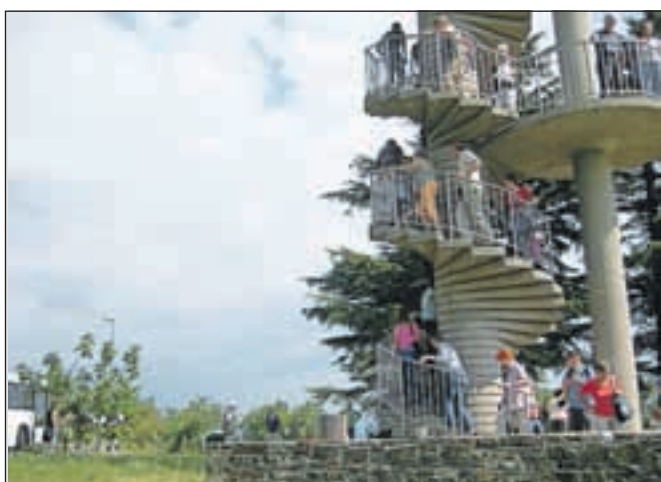
Razgledni stolp v Gonjačah