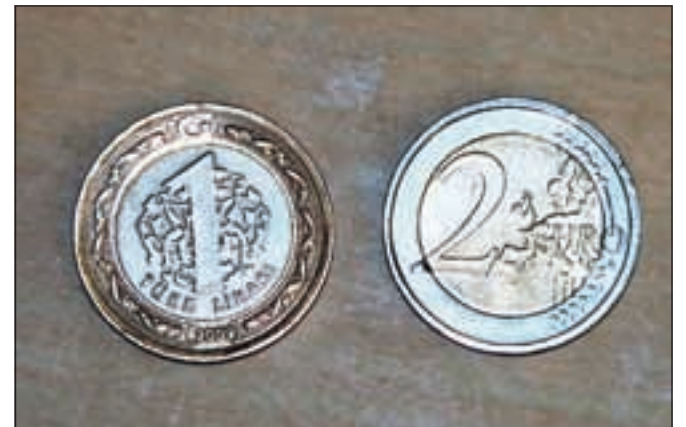
Prevare se najpogosteje pojavljajo pri dvobarvnih kovancih.