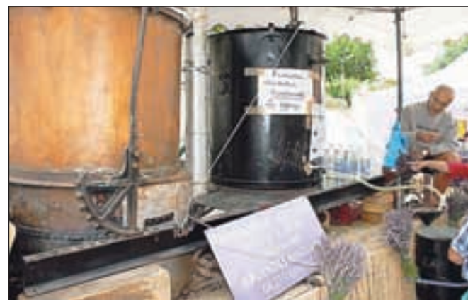
Podobno kot pri žganjekuhi si tudi od vonja sivke že malo zadet

smo s prstom ujeli kakšno kapljico lepljive tekočine iz cevke. Tisto sivkino olje, ki sem si ga pomazal na zapetje, mi je dišalo še celo popoldne. Prav hecna pa je bila gneča nekaj metrov dlje, kamor so domačini pripeljali voz sivke, najbrž nekoliko slabše kvalitete, naj si