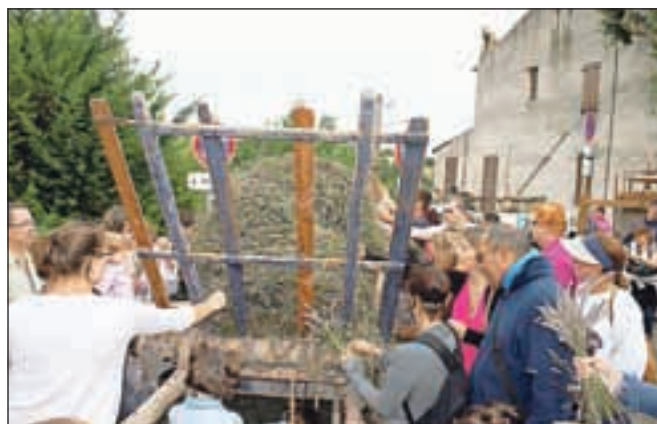
Zastoj sivka za domov. Ko tudi najmočnejši fantje niso prišli blizu.

Semenj sivke torej in na njem ta čudežna rastlina ponujana na tisoč in en način. Če sem že omenjal številne kozmetične in prehranske izdelke, ki jim Francozi na tak ali drugačen način dodajajo sivko, naj se tokrat spomnim še na drugo polovico semenjnih stojnic, ki so imele s sivko skupnega predvsem to, da so se na njej prodajali izdelki v sivo vijoličnih barvah in niso bili niti za mazati niti namazati, kaj šele za zmazati. Številne slike: na platnu, strešnih opekah, kamnu, deščicah, keramičnih ploščicah, množica malih in velikih vijoličastih blazin in blazinic, plišasti medvedki (vijoličasti seveda), lutke, ki ponazarjajo podeželska dekleta, velik izbor vaz, keramičnih krožnikov, skodelic, pa jedilni pribori, stenske ure, predpasniki. Ni da ni. Samo denarnici je treba dati nekaj svobode.