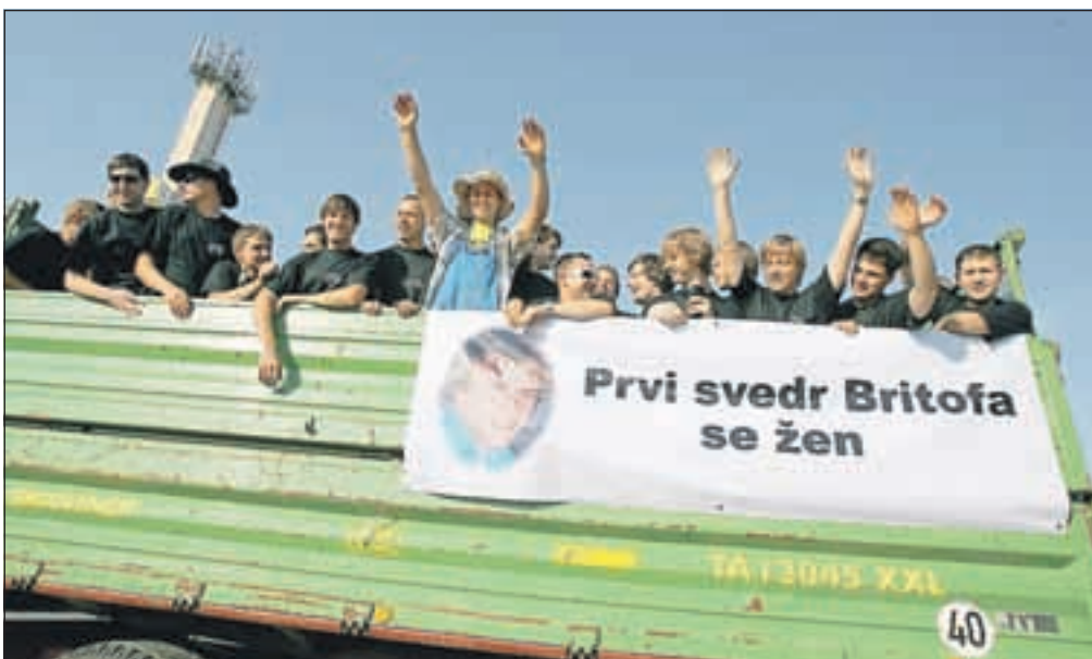
Fantje so si nadeli črne majice in poskrbeli, da se je daleč naokoli videlo, kdo se ženi.