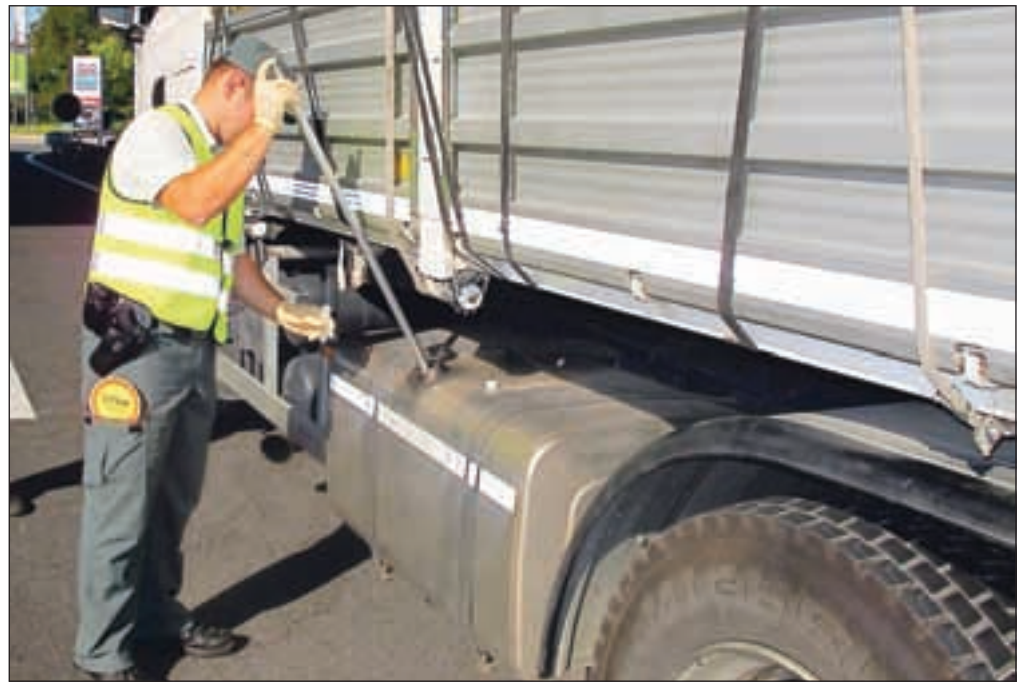
Na voznike, ki v rezervoarjih nimajo pravega goriva preži devet mobilnih oddelkov carinikov.

Neupravičena oziroma nepravilna uporaba pogonskega goriva se kaznuje po