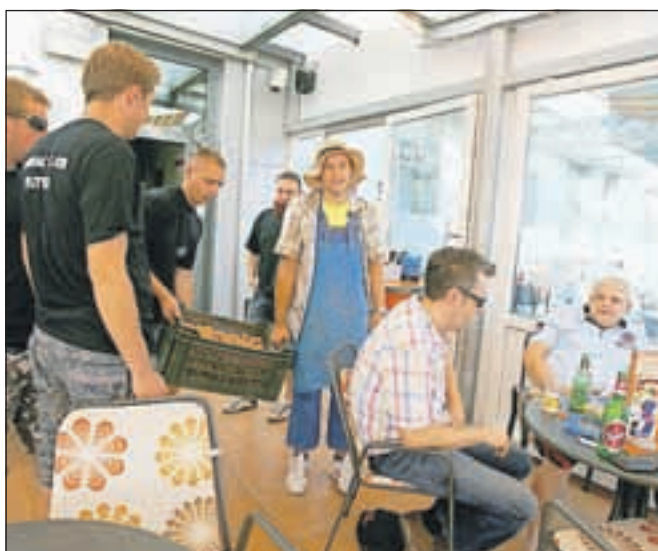
Mateju delo na fantovščini ni ušlo.