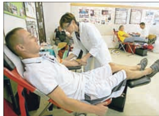
Z odvzema krvi v Škofji Loki

krvodajalcev na dan. Glede na lani je udeležba nekoliko nižja, kljub vsemu pa smo lahko na to lepo število ponosni, saj dokazuje solidarnost ljudi, ki na tak način želijo pomagati sočloveku. Ob tej priložnosti bi se zahvalila vsem krvodajalcem in seveda tudi tistim, ki so nam pomagali, da smo akcije lahko izpeljali,« dodaja Mikševa. Zakaj krvodajalsko akcijo organizirajo prav sredi poletja? Sogovornica odgovarja, da je tako že tradicionalno, poleg tega pa poleti krvi še bolj primanjkuje, zato so veseli, da lahko s prispevkom svojih krvodajalcev pomagajo v teh stiskah. Škofjeloško območje, kjer se poleti krvodajalskih akcij udeleži prek tisoč darovalcev, je po odvzemih tako »močno«, da lahko k temu občutno pripomorejo.