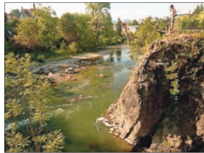
Skoki v Poljansko Soro – dovoljeni le tistim, ki poznajo vsak njen tolmun.