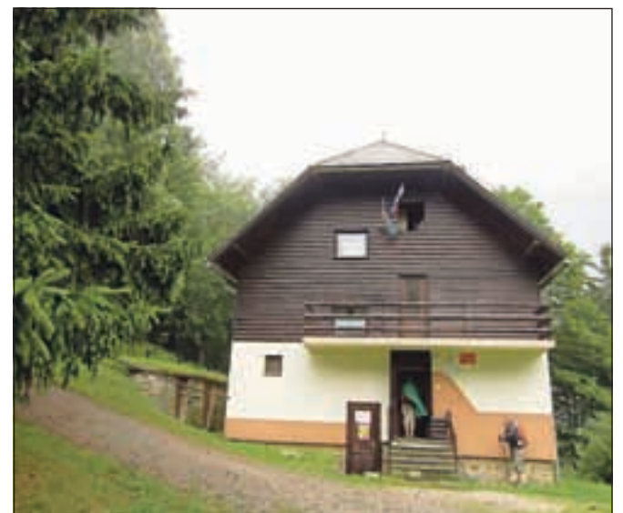
Koča pod Kremžarjevim vrhom