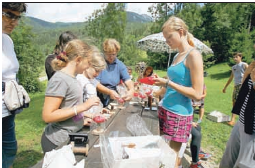
V sredo so na ustvarjalnih delavnicah izdelovali mušnice iz blaga.