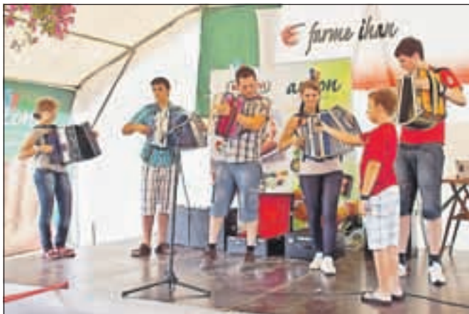
Harmonikarji Gašperja Vodlana so z glasbo popestrili tekmovalstvo žar mojstrov in mojstrice.