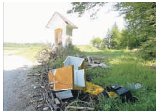
Nesnaga na poti med Škofjo Loko in Crngrobom

Na poti iz Škofje Loke proti Crngrobu nam je v oči padel tale nelepi prizor. Na kup vejevja je nekdo odložil še odpadke, ki nikakor ne sodijo v naravo. S tem ni pokazal le nespoštlivega odnosa do narave, pač pa tudi do sakralnega spomenika ob cesti. Kdor je tam stresel nesnago, pa ni tvegala samo zgražanja mimoidočih sprehajalcev, kolesarjev in drugih, ki imajo opraviti v tem koncu, pač pa tudi kazni, ki mu jo lahko naprtijo pristojne službe. D. Ž.