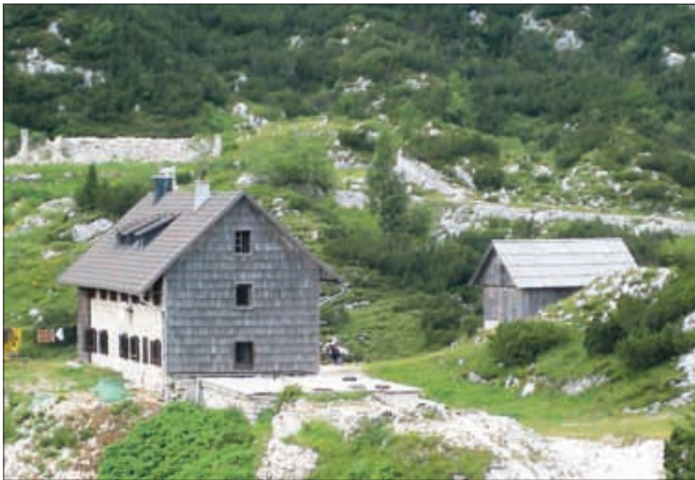
Kočica je zgradila bohinjska podružnica Slovenskega planinskega društva. Odprli so jo sedmega avgusta leta 1932 in jo do danes večkrat obnovili.

v okolico, na primer na Bogatin čez Vratca, na Mahavšček čez Vratca ali čez planino Govnjača, na Lanževico ali pa do kočice pri Triglavskih jezirih.« Nočitev na skupnih ležiščih stane vključno s turistično takso in ekološkim prispevkom 20,50 evra. Če imate člansko kratico Planinske zveze Slovenije, plačate sicer petdeset odstotkov manj, ampak, kot je povedala oskrbnica Anica, pogosto sliši prav od planincev, da se jim letne članarine ne splača plačati, ker prespijo