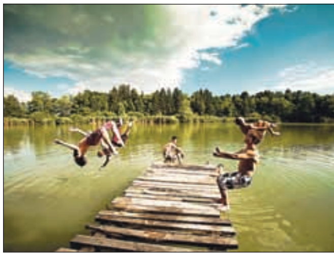
Mladina je na Čukovi jami za silo obnovila lesen pomol, ki so ga pred kratkim porušili vandali.

Preddvorsko jezero je za kopanje še vedno preveč onesnaženo, vendar je kljub temu v njem zaslediti nekaj junakov, ki se ne morejo upreti vodnim radostim. Tako kot v Puštalu tudi tu občinski veljaki obljublajo boljše čase za ta gorenjski bisser, le da se še ne ve natančno, kdaj se bosta čiščenje in prenova začela.