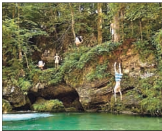
Kokrški Kosorep s kombinacijo smaragdne reke, kristalne reke ter pridihom divjine

Ob Kokrici številne obiskovalce kot vedno pritegne