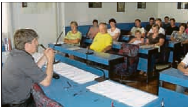
Občinska sredstva za intervencije v kmetijstvu so razdelili med petindvajset prejemnikov.

organiziral javni podpis pogodb z vsemi dobitniki sredstev iz javnega razpisa, namen srečanja s kmetovalci pa je bil predvsem seznanitev občinske uprave z aktualnimi razmerami in problemi, ki pestijo podeželje in vse aktivne obdelovalce kmetijskih površin: zaraščanje kmetijske krajine, delitve kmetij, nizke odkupne cene kmetijskih proizvodov, delitve kmetij zaradi dednih postopkov. Župan je zagotovil, da se bodo na občini še naprej zavzemali za čim bolj skladen razvoj vseh krajevnih skupnosti, za varovanje kmetijskih zemljišč pred pozidavami, izpostavil pa je nujnost povečanje deleža sa- mooskrbe v Sloveniji.