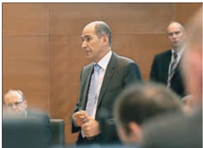
Predsednik vlade Janez Janša bi na zlato fiskalno pravilo vezal zaupnico svoji vladi.