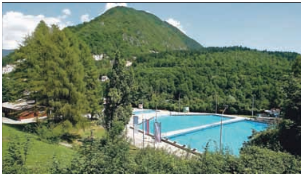
Ena največjih naložb na Gorenjskem iz naslova razvoja regij bo tudi obnova tržiškega bazena oziroma ureditev gorenjske plaže.

Gorenjska ima v aktualni evropski finančni perspektivi 2007–2013 na voljo 59 milijonov evrov, s tem, morda zadnjim pozivom pa bodo porabili skoraj vso predvideno pomoč. Skupna vrednost zadnjih 18 projektov znaša skoraj 29 milijonov evrov, od tega župani pričakujejo več kot polovico iz EU. To se bo zgodilo, ko bodo projekte odobrili na Ministrstvu za