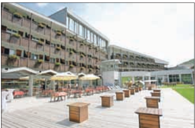
V Kranjski Gori so hoteli Hit Alpinee dobro zasedeni na račun mladih športnikov kot tudi drugih turistov, ki so željni aktivnih počitnic.

Na Bledu hkrati pospešeno razvijajo kongresni turizem, za katerega pričakujejo, da bo v prihodnje bistveno ublažil sezonska nihanja in omogočil, da hotelov izven sezone ne bodo več zapirali. Rast števila nočitev v Sloveniji je letos višja za skoraj pet odstotkov. A Miran Čurin pravi, da gre le za eno plat medalje: »Če znotraj področja turizma podrobneje pogledamo dejavnost hotelirstva, opazimo, da od leta