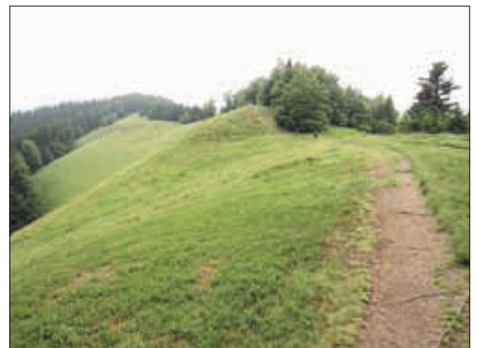
Travnato sleme proti Kremžarjevemu vrhu