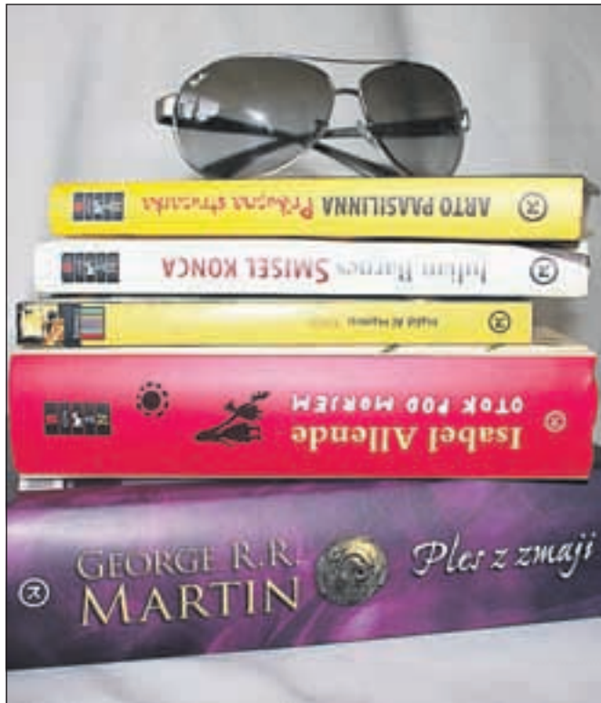
Poletno branje od Finske na Haiti, nazaj v Evropo v Anglijo in prek Egipta v izmišljene svetove

S hladne Finske na vroči Haiti. Otok pod morjem je nov roman ta čas ene najbolj znanih pisateljic s španskega govornega področja Isabel Allende . Gre za večplastno zgodovinsko pripoved, prepleteno z osebnimi zgodbo sužnje in njenega gospodarja. Toulouse Valmorain je Francoz, ki se je preselil na Haiti, da bi prevzel očetovo plantažo sladkornega trsa. Svoji ženi kupi devetletno sužnjo Tete, ki jo z