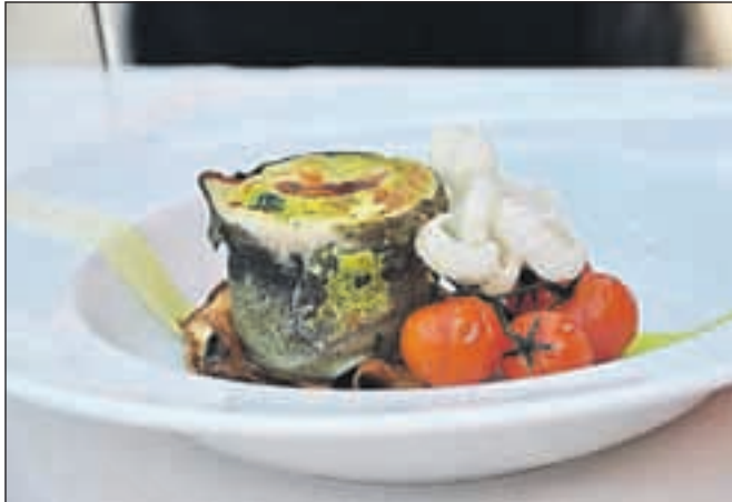
Tudi v pripravi jedi iz postrvi so tekmovalci pokazali ustvarjalno žilico.