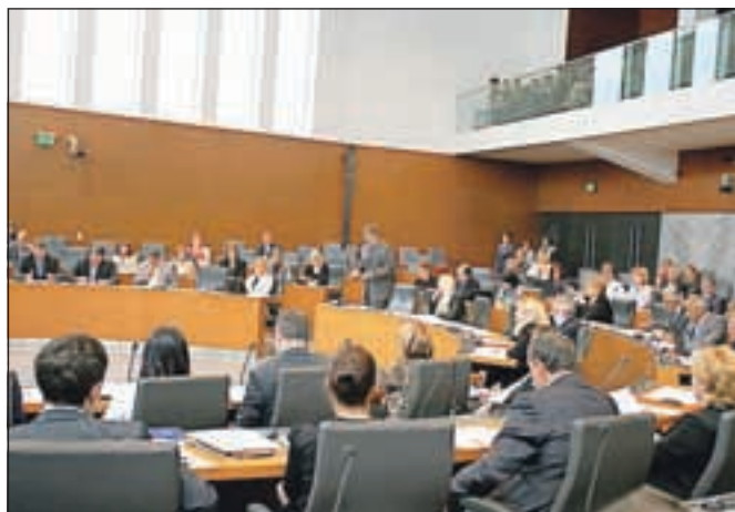
Državni zbor je te dni neutrudno zasedal in kot po tekočem traku sprejemal zakone.