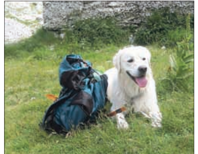
Od Kočice pod Bogatinom je več planinskih izletov v okolico. Kosmatinec si je vzel zaslužen počitek na Bogatinskem sedlu.