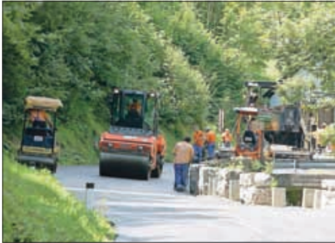
Na cesti Spodnje jezersko-Zgornje jezersko so opravili sanacijo več odsekov v prid prometne varnosti.