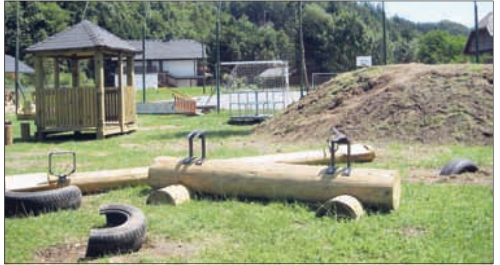
Razdejano otroško igrišče so domačini še tisto jutro za silo uredili.

Otroci so se na njem že nekaj časa igrali, zato je bil v torek zjutraj pogled na popolnoma razdejano igrišče še toliko bolj osupljiv. Domačini so bili v šoku, presenečeni, da se kaj takšnega lahko zgodi v kraju, znanem po bogati kulturni dediščini, številnih