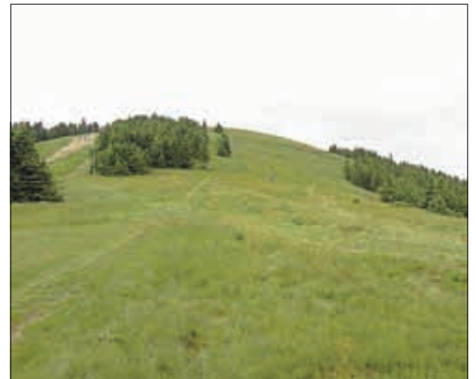
Pogled na zahodno pobočje Velike Kope

Nadmorska višina: 1543 m Višinska razlika: vzpon – 500 m Sestop – 1133 m Trajanje: 6 ur Zahtevnost: ★★★★★