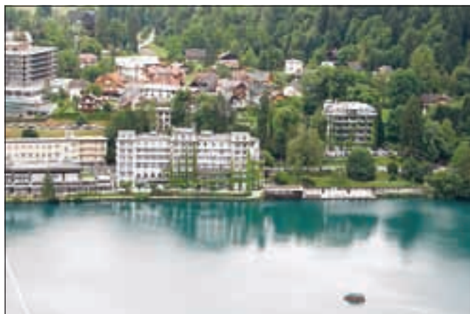
Savini hoteli na Bledu so letos bolje zasedeni kot lani, še boljše je zasedenost kampa.

»Zagotovo se tudi v turizmu poznajo posledice gospodarske krize. V hotelirstvu se posledice na prihodkovni strani kažejo skozi zmanjšano povpraševanje, zniževanje cen, zmanjšano porabo po gostu, skrajševanjem bivanja