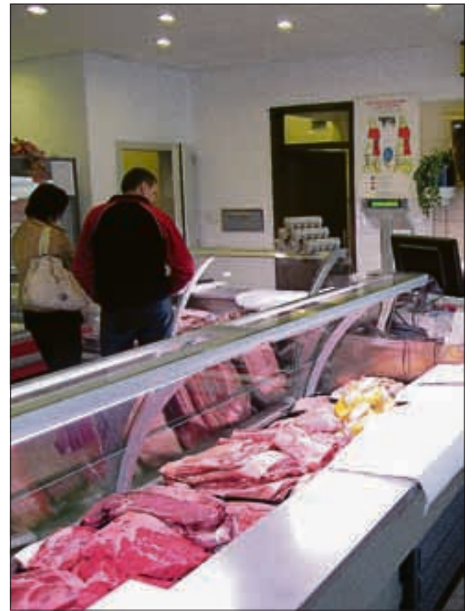
Poleg pred kratkim odprte mesnice v Kranjski Gori bodo do konca leta odprli še štiri.

Kranjski Gori, do konca leta bodo odprli še štiri. S preno- vo hladilnih kapacitet so začeli uvajati program mesa za žar, jeseni pa bodo v ponudbi tudi trajni izdelki. V vseh mesnicah bodo naprodaj izdelki Loških mesnin, mlekarne in trgovin Domači kotiček.