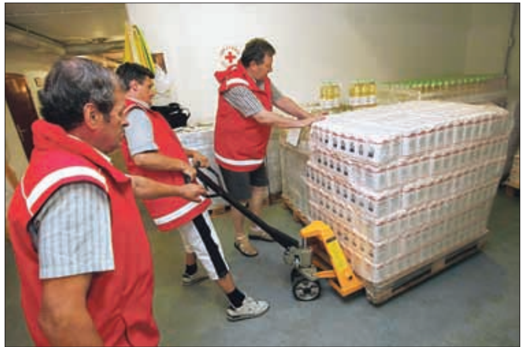
Območno združenje Rdečega križa Kranj je že prejelo prvo pošiljko hrane iz ukrepa pomoči Evropske unije Sloveniji.