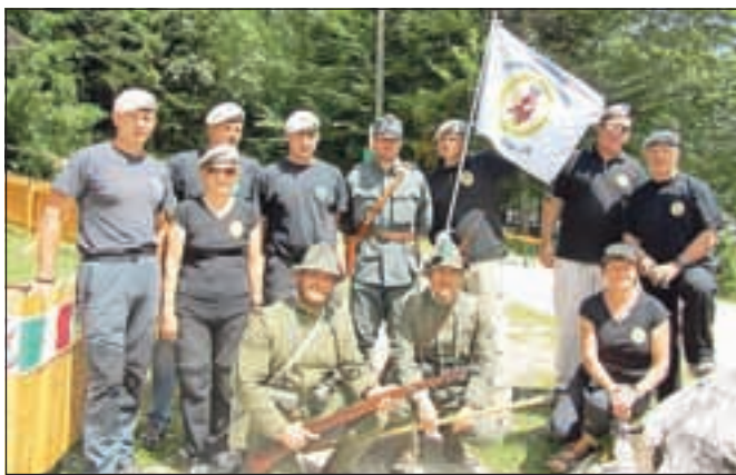
Gorenjski vojaški gorniki, tudi poveljnik in častniki Gorskega bataljona z Bohinjske Bele, z italijanskimi alpini v uniformah vojakov iz prve svetovne vojne, na slovesnosti v dolini Zajzere