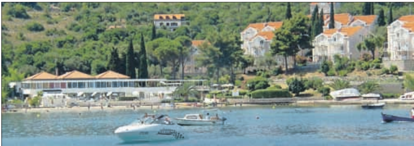
Pogled na Hotel Villas Koločep – Kalamata z morja. Hotel z recepcijo je ob obali, depandanse prav tako v bližini. Sobe so večinoma obrnjene proti morju, hlajene in lepo urejene.