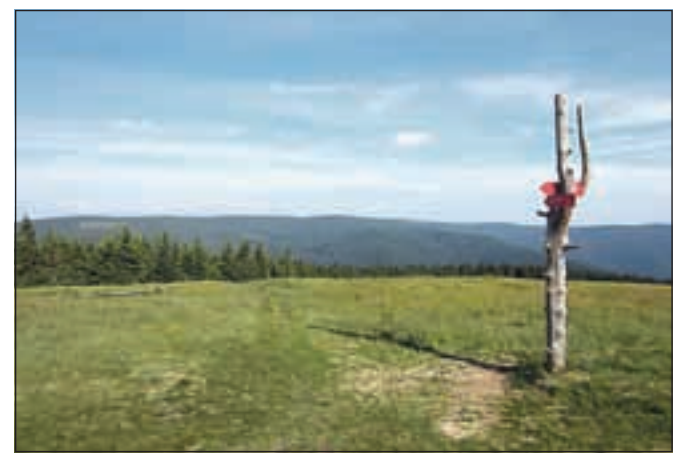
Na Ribniškem oz. Jezerškem vrhu, 1537 m

Nadmorska višina: max. 1537 m Višinska razlika: ok. 500 m Trajanje: 8 ur Zahtevnost: ★★★★★