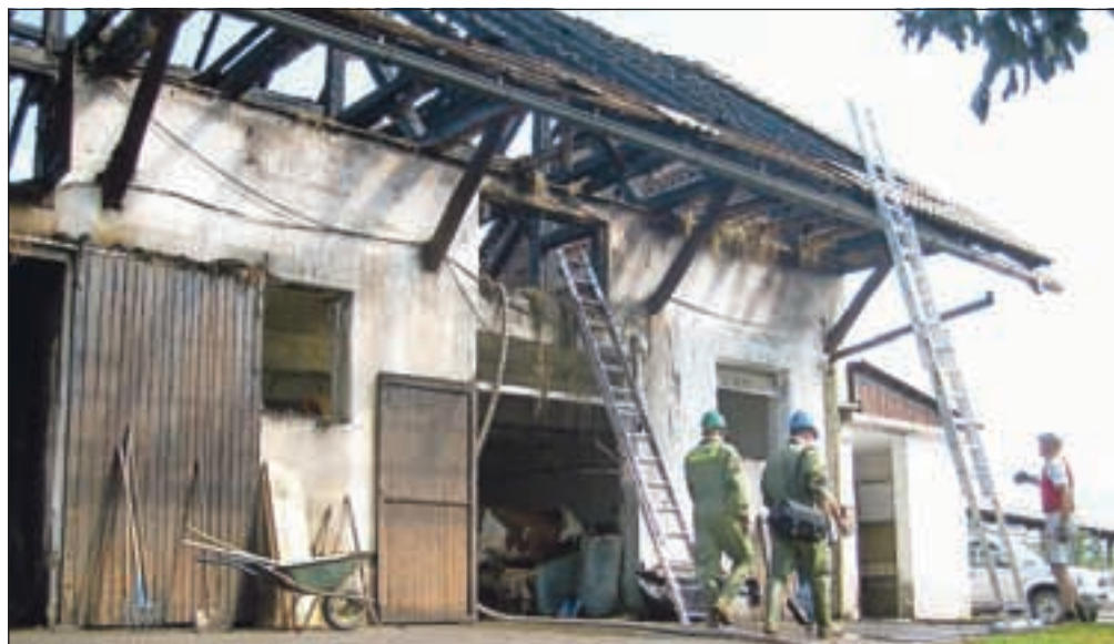
Kriminalistična komisija, ki si je naslednje dopoldne ogledala pogorišče, vzroka za nastanek požara še ni ugotovila.

»Vsi smo spali, ko je zagorelo. Nekaj po 22. uri me je prebudilo vpitje in ko sem pogledal skozi okno, je bil ogenj že v strehi. V trenutku