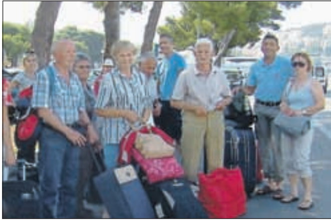
Z avtobusom do Dubrovnika, potem pa s trajektom dalje na Koločep

Glasovci so bili kar precej aktivni. Poleg rednega raziskovanja otoka, plavanja in sončenja so se nasmejali na Igrah brez meja, pripravili lastno balinado, navdušeni so bili nad Kompasovim predstavnikom Blažem in Majo. Domov so najboljši in tisti z najbolj mirno roko in ravno pravnim metom balinčkov odnesli kar nekaj lepih nagrad. (se nadaljuje)