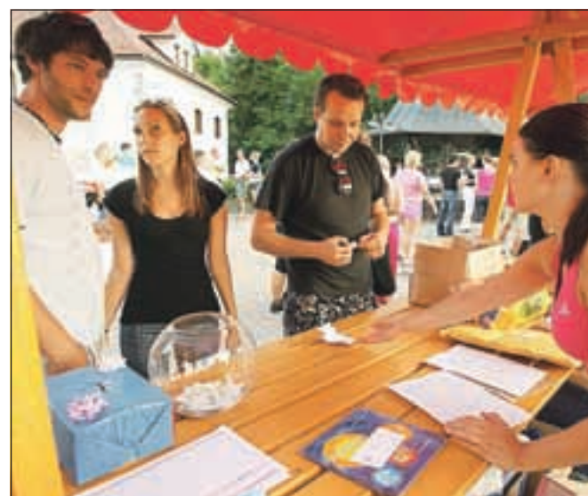
Na stojnicah so s srečkami zbrali sedemsto evrov, za cel avto oblek, obutve, konzervirane hrane, pa tudi računalnik.