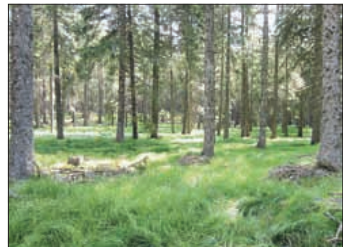
"Zeleno, ki te ljubim zeleno", g loboko v pohorskih gozdovih.