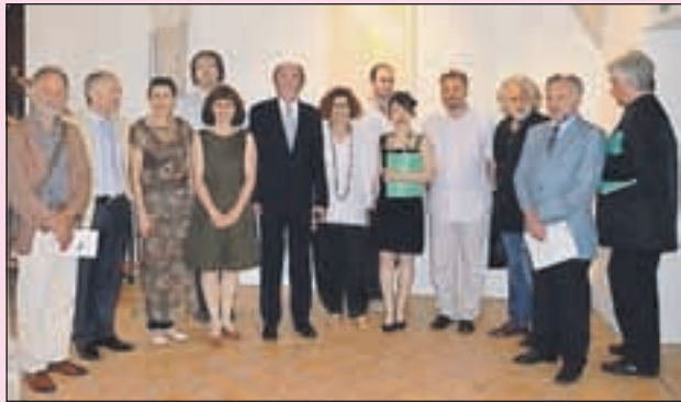
Dela umetnikov iz Benetk gosti tudi Kranj, in sicer v Mestni ter v Prešernovi hiši.