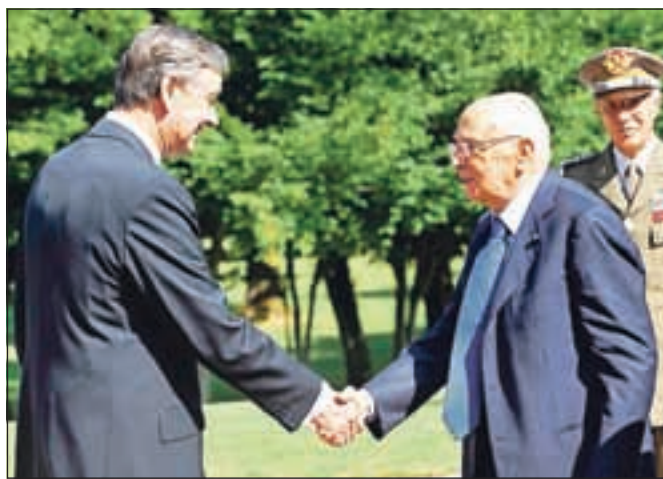
Prijateljski obisk italijanskega predsednika Georgija Napolitana v Sloveniji