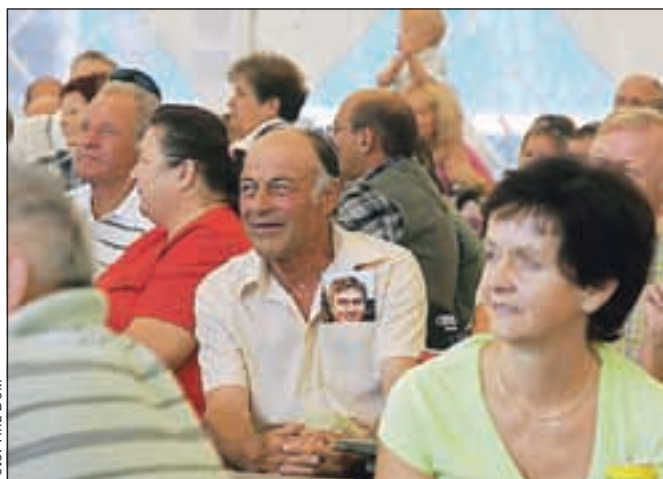
Ve se, kateri predsedniški kandidat mu je pri srcu!