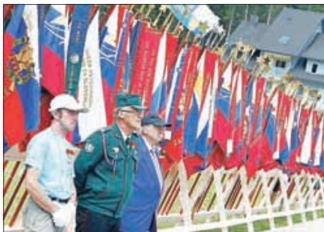
Blizu sto partizanskih praporov ob tradicionalnem srečanju na Pokljuki