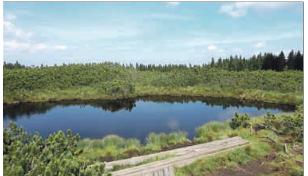
Eno od Lovrenških jezer

strani kočje je tudi žig, tretji žig, ki ga dobimo na Pohorju. Do sem smo potrebovali 3 ure oz. 4, če smo si ogledali še slap Šumik. Vrnemo se nekaj korakov v smeri prihoda, nato zavijemo desno v gozd in se v 15 minutah povzpemo do Klopnega vrha, 1340 m, globoka skritega v osrčju pohorskih gozdov, brez razgleda. S Klopnega vrha nadaljujemo proti Koči na pesku. Najprej dosežemo močvirnato območje Skrbinsko borovje, kjer prevladuje šotni mah. Pot je mestoma precej blatna, poteka pa ves čas skozi gozd, v varni senci. Ta del poti je dokaj položen, bolj kot ne izgubljam višino. Ko dosežemo cesto, ki iz Oplotnice pelje proti Lovrencu na Pohorju, se naša steza na drugi strani križišča zapodi desno v gozd. Še malo in smo pri Koči na Pesku, turistični koči, kamor se da pripeljati z avtomobilom. Od Koče na Klopnem vrhu do sem smo potrebovali dve uri. Od kočje se po asfaltirani cesti spustimo do mašinžage, kjer se iztekajo rogelska smučišča. Pri jezeru zavijemo levo, prečimo leseno brv in se začnemo vzpenjati proti vsaj meni - najlepšemu delu