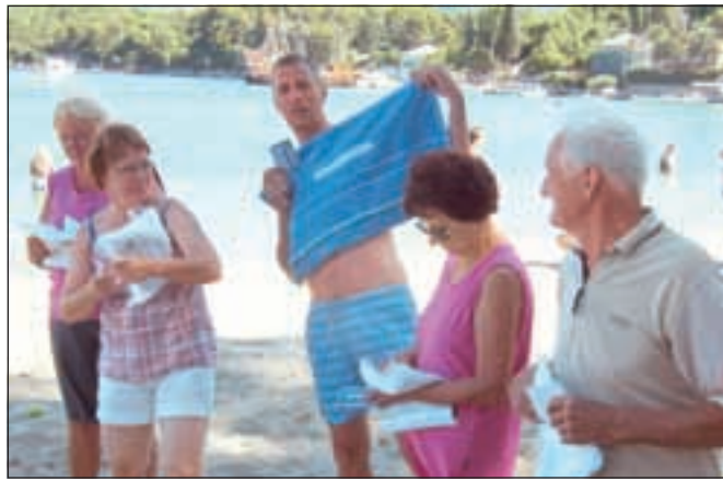
Vse dni so naše popotnike spremljale družabne igre, na katerih so najboljši dobili tudi nagrade.