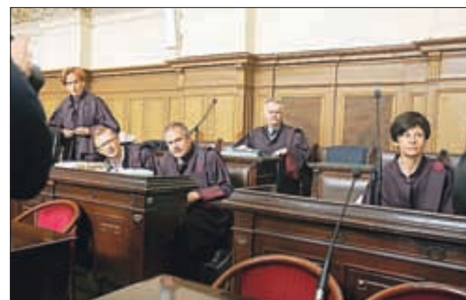
Obrambi ni uspelo z zahtevo po izločitvi predsednika sodnega senata in ljubljanskega sodišča.