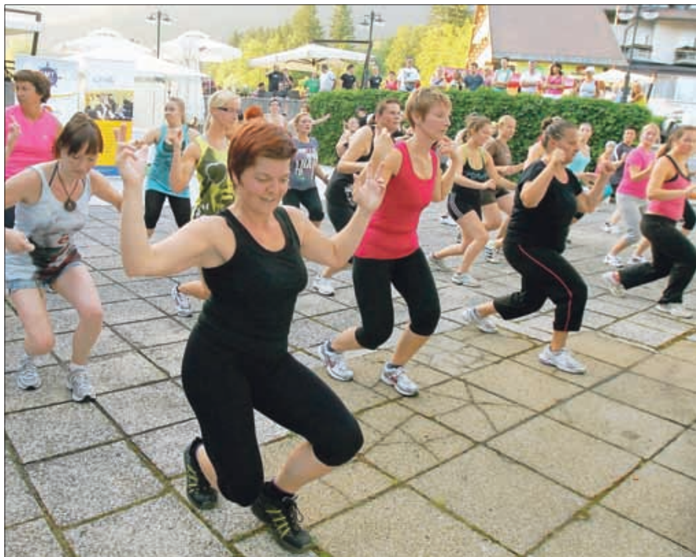
V idiličnem okolju na maratonu Zumba energičnosti in dobre volje ni manjkalo.