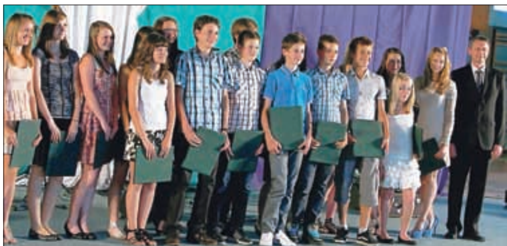
Odličnjaki iz Železnikov so bili ob prazniku deležni županovega priznanja.

tej dejavnosti jih je sodelovalo 60, najboljše tri (skupine) pa so bile na slovesnosti nagrajene. Tretje mesto je šlo skupini, ki je raziskovala igre, drugo skupini, ki se je ukvarjala z lastnostmi las, prvo pa fantom, ki so se ukvarjali z avtom na vodik in gorivne celice.