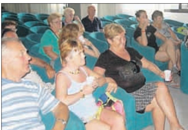
Družina Jugovic na Glasovem večeru