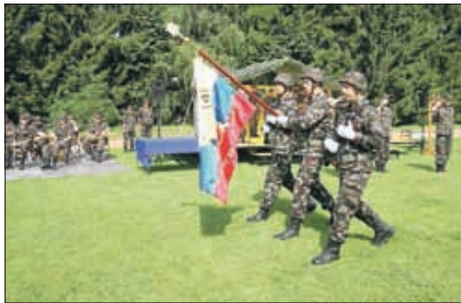
Preimenovanje nekaterih vojašnic v Sloveniji je spet sprožilo ideološka razhajanja. Z imenovanjem kranjske (na sliki) ni težav.