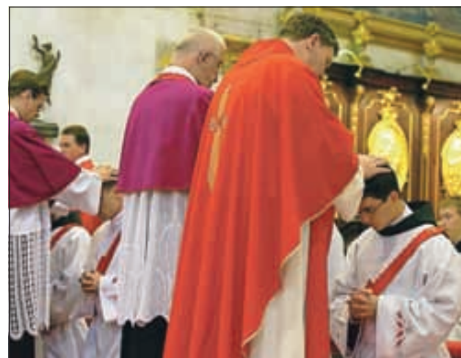
Duhovniki polagajo roke na glave novih sobratov.