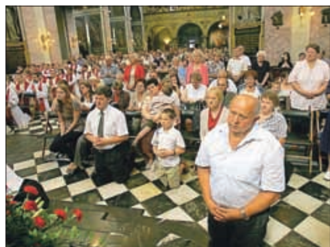
Svojci novomašnikov med molitvijo