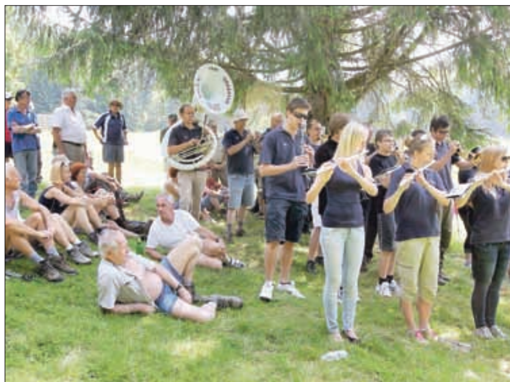
Pohodniki so prisluhnili najprej MPZ KD Bistrica, potem pa še Pihalnemu orkestru Tržič.