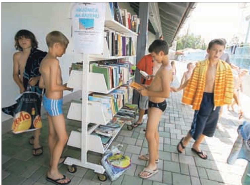
Na kranjskem bazenu si je v letošnjem poletju za prijetno krajanje časa moč izposoditi tudi knjige.

Ker ni izkaznic in plačila izposoje, tudi ni kontrole,