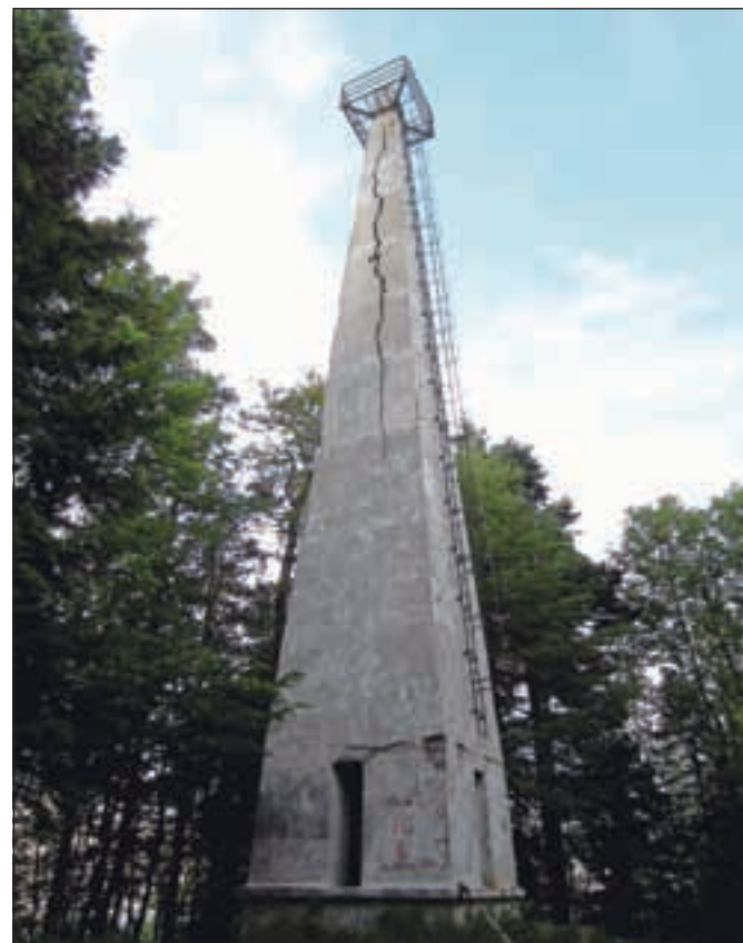
Počeni stolp na Žigartovem vrhu, namenjen le zemljemercem.

Nadmorska višina: 1346 m Višinska razlika: pribl. 400 m Trajanje: 2 uri Zahtevnost: ★★★★★