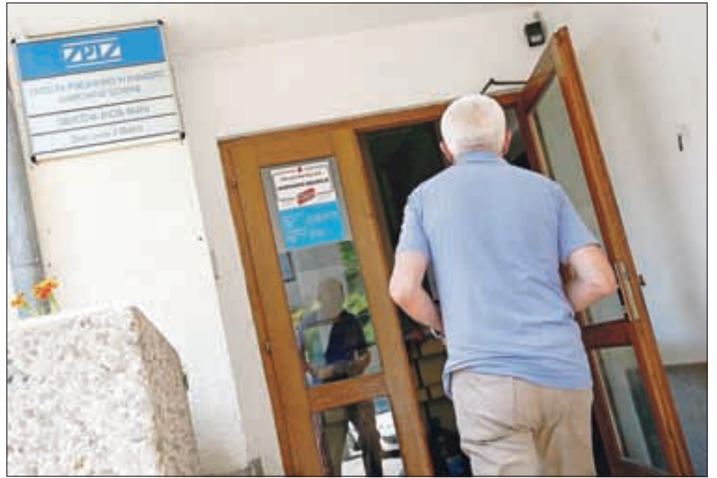
Po pojasnila na zavod za pokojninsko in invalidsko zavarovanje / Foto: Gorazd Kavčič