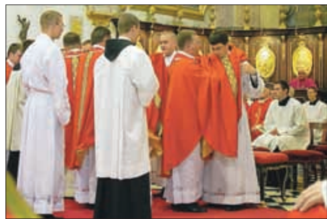
Župniki iz rojstnih župnij pomagajo novomašnikom obleči mašne plašče.