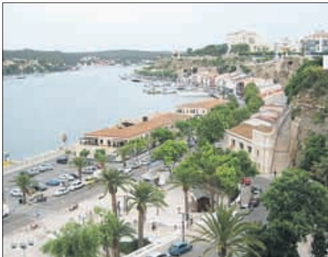
Mao je eno največjih naravnih pristanišč na svetu.