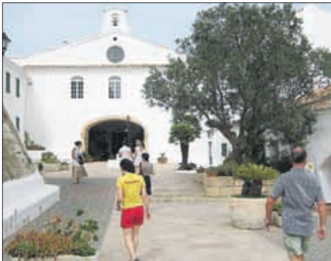
Svetišče na Monte Tora