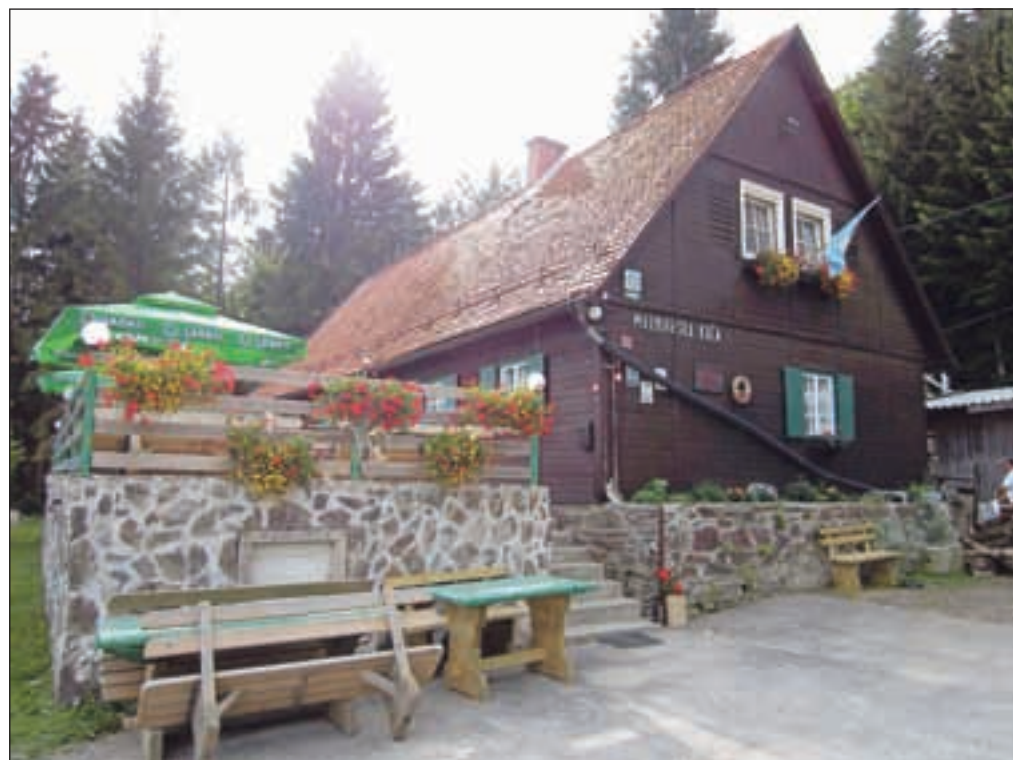
Mariborska kočja, kjer dobimo prvi žig SPP-ja.

Nadaljujemo naprej do Ruške kočje na Arehu. Pripadam, da je ta del malce dolgočasen, saj se markirana pot drži gozdnih cest in kolovozov. Od kočje sledimo cesti, dokler ne pridemo do križišča. Markacijam sledimo do prevala Pri bukvi, med Ledinekovim koglom in Reškim vrhom. Gremo mimo vlečnice Partizanka. Zavijemo levo in sledimo kolovozu, rahlo navkreber po pobočju Sedovca. Tik pod Arehom gremo mimo akumulacijskega jezera za pridobivanje snega, nato pa zavijemo levo skozi gozd in že se znajdemo na travnih poljanah por Arehom. Pred nami je romarska cerkev svetega Areha, kar v pohorskem narečju baje pomeni Henrik. Cerkev datira v 13. stoletje, v čas Henrika Rogoškega. Današnjo podobo je dobila v 17. stoletju.