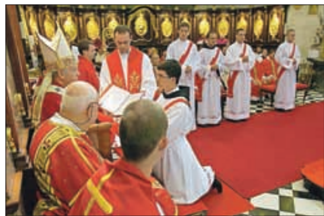
Bodoči duhovniki so se pred nadškofom izrekli, da hočejo postati duhovniki.