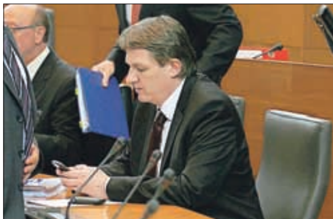
Opozicija tudi z razmišljanjem o interpelacijah zoper troje ministrov, med njimi tudi finančnemu Šušteršiču, potrjuje svoj opozicijski status.