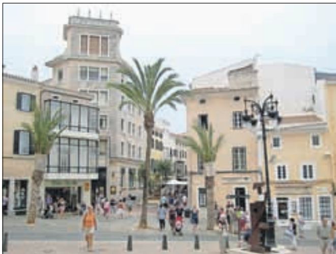
Center mesta Mao

Glasovci so imeli v sedmih dneh tudi svojo fiesto, s pomočjo Intelektine predstavnice Nine so se učili prvih korakov salse in se potegovali za simpatične nagrade. Zanimiv zaplet pa je bil ob vprašanju, kdo je najstarejši v skupini, saj se je častitljiva starost vrtela okoli 77 in 78 let, kar se ni videlo ne enemu ne drugemu fa ntu