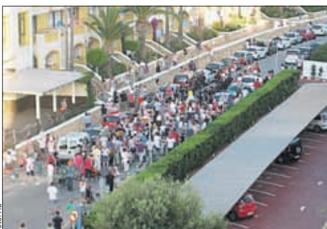
Sprevod po cestah Son Boua na Janezov dan 24. junija