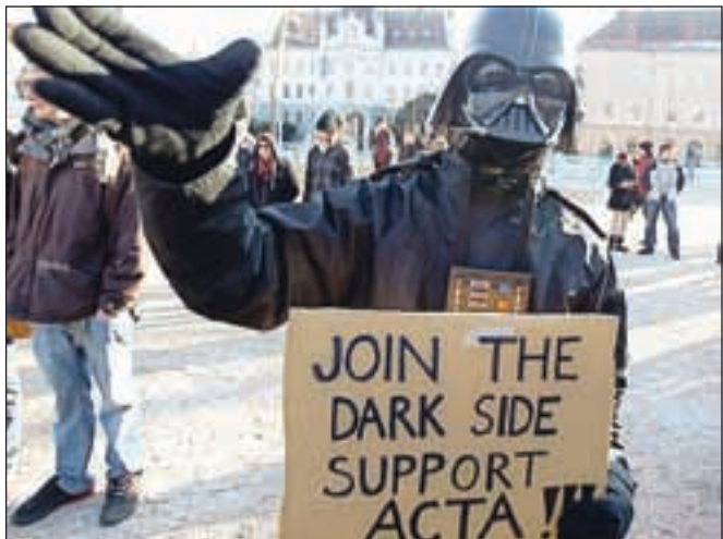
Evropski parlament je ta teden zavrnil trgovinski sporazum ACTA. Na sliki prizor s protestov proti ACTI v Ljubljani.