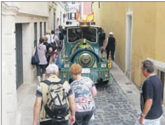
Brez turističnega vlakca tudi tu ne gre. / Foto: AB