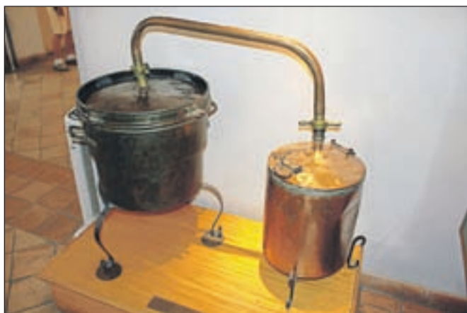
Ne, to ni novodobna naprava za kuhanje žganja, ampak vpogled v del proizvodnje parfumov, kot so jih pridobivali nekoč.