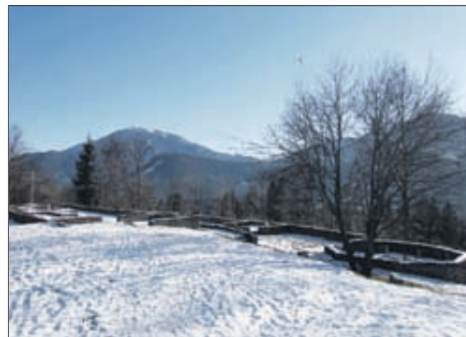
Urejen arheološki park. Najdbe so na ogled v muzeju v Globasnici.

Na Junski gori je bilo v antičnem času naselje s kompleksom več zgodnjekrščanskih cerkva, katerih ostanki so danes restavrirani. Urejen je arheološki park, ki nas popelje daleč nazaj v zgodovino. Junska gora je bila pomembno cerkveno upravno središče. Sama naselbina