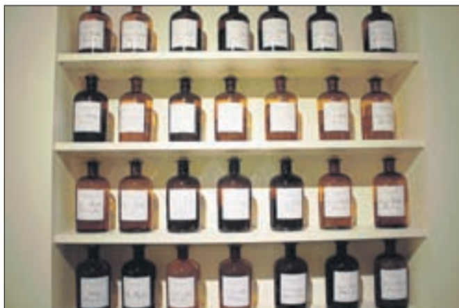
V Fragonardu so pridobili na tisoče različnih vonjev in na tej fotografiji jih je v stekleničkah le majhen, majhen delček ...

V uvod k zapisu o firmi Fragonard iz Grasseja, znani izdelovalki esenc za parfume, nekaj značilnih fotografij iz njihovega muzeja.