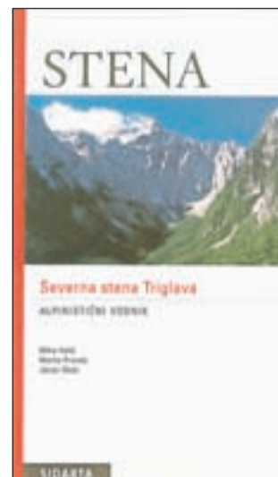
Prednja stran ovitka