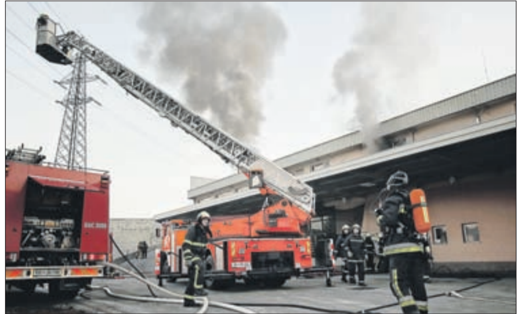
Z neposrednim javljanjem požara bi lahko preprečili ali vsaj ublažili večjo premoženjsko škodo.

Večina drugih kranjskih podjetij ima javljanje požara urejeno odvisno od stopnje interesa za protipožarno varnost. Kejžar ocenjuje, da bi v