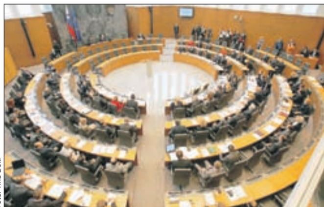
Državni zbor bo o mandatarju vnovič odločal v soboto, 28. januarja.