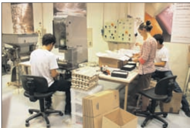
Fant za strojem ne proizvaja umetnih jajc, ampak iz preostankov sestavin, s pomočjo katerih iz cvetov pridobivajo esence, izdeluje "žajfice".