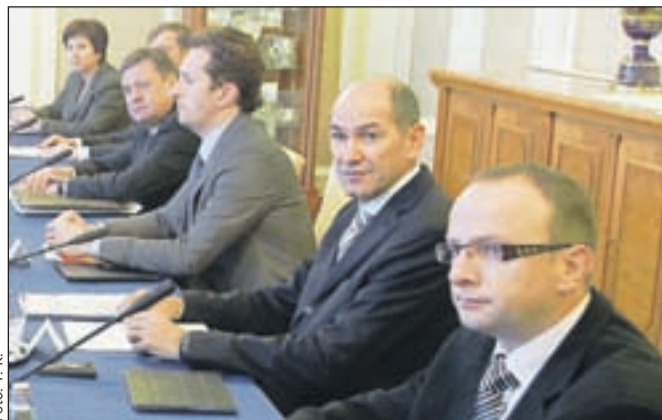
V vili Podrožnik je Borut Pahor s slovenskim političnim vrhom razpravljaj o omejitvi javnega dolga, kar naj bi zapisali v ustavo.