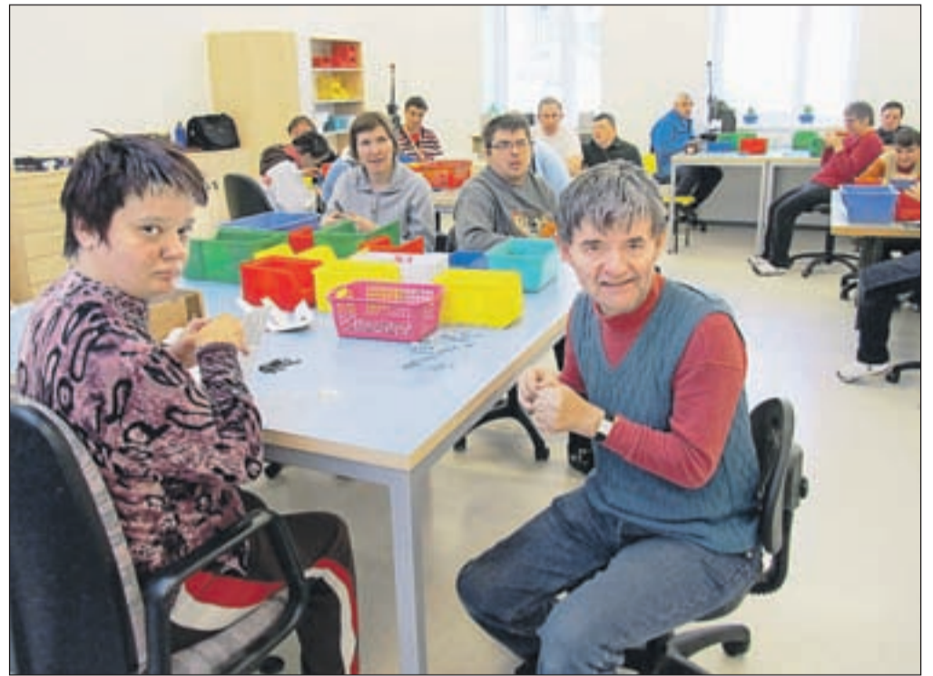
VDC obiskuje 36 uporabnikov iz jeseniške, kranjskogorske in žirovniške občine, stari pa so od 26 do 65 let. Zatrdili so, da se v novih prostorih odlično počutijo. V VDC-ju z njimi dela sedem zaposlenih.

lili tudi drugi uporabniki - skupaj jih je 36, gre pa za osebe z motnjo v duševnem razvoju, ki prihajajo iz jeseniške, kranjskogorske in žirovniške občine. Stari so 26 do 65 let, v VDC pa prihajajo vsako jutro in ostanejo do popoldneva. Po besedah vodje enote Urše Emeršič uporabniki v VDC-ju dobijo varstvo, vodenje in zaposlitev, v tem času pa opravljajo različna dela za podjetja, s