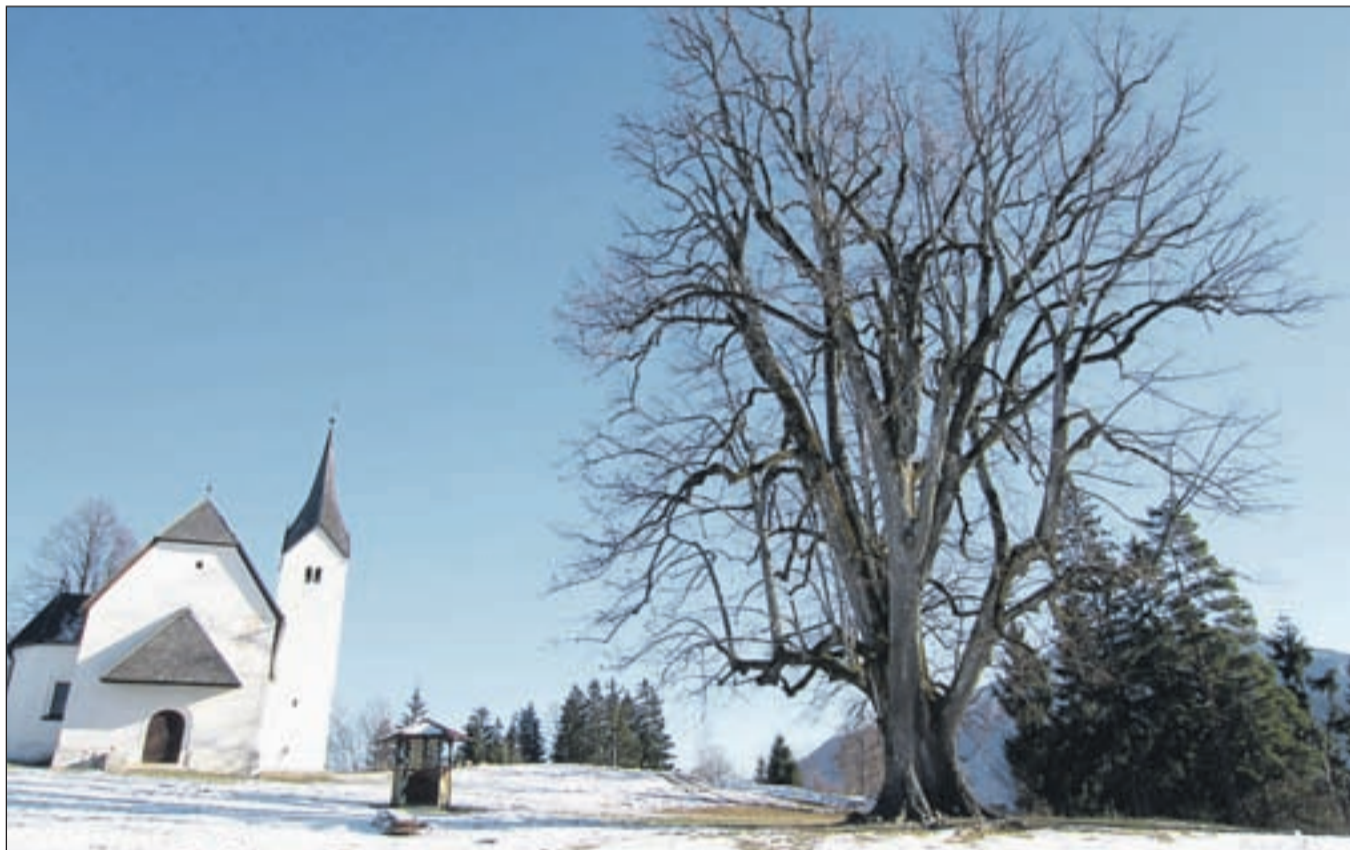
Vrh Gore svete Eme s cerkvijo in stoletno lipo

je bila opuščena konec 6. stoletja. Leta 1978 so začeli z načrtnimi arheološkimi izkopavanji, ki so dala presenetljive dokaze. Odkritih je bilo petnajst poslopij; pet cerkva, kristalnica, cisterni za vodo in prenočišče za romarje.