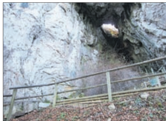
Rozalijina jama