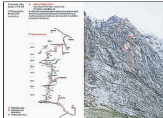
Strani iz vodnika