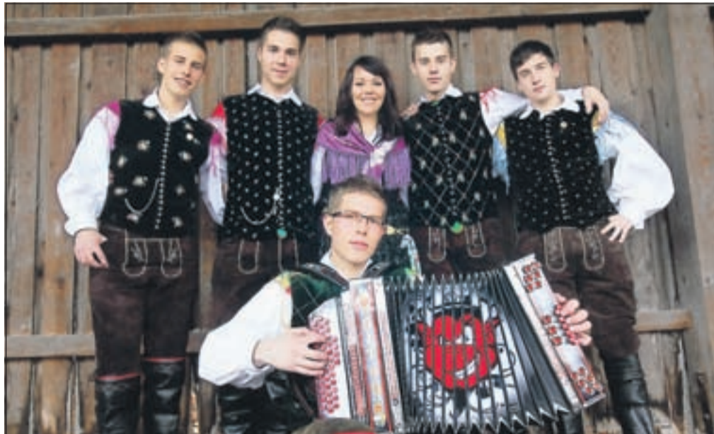
Mladi in obetavni "peklenščki", člani ansambla Peklenski muzikantje

Glasbeno pot so Peklenski muzikantje začeli aprila 2009, njihov repertoar pa zajema narodno-zabavno in zabavno-komercialno glasbo. Narodno-zabavno zvrst izvajajo v kvintetovski zasedbi kot tudi v trio zasedbi s večglasnim petjem. So gorenjsko-notranjska naveza, ki ima sedež v Ljubljani. Kot so pove-