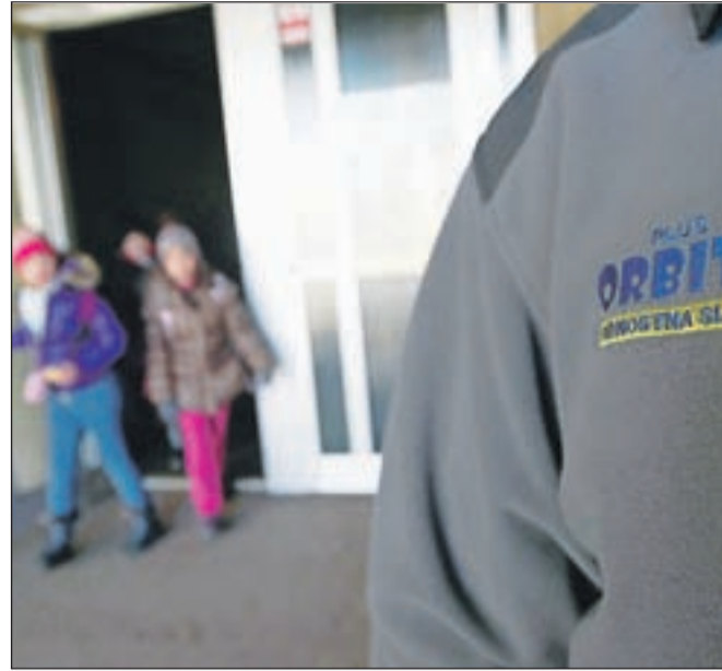
Osnovna šola Franceta Prešerna v Kranju je ena redkih osnovnih šol, ki ima trenutno še zaposlenega varnostnika, od februarja naprej pa naj bi šolo in okolico pogosteje nadzirali mestni redarji.

"Delovno mesto varnostnika ni element za sistemi-