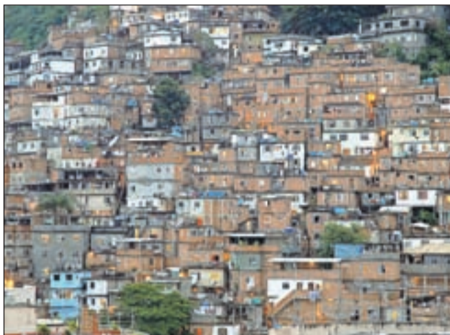
Poslovna sosesa v eni od južnoameriških držav, kjer deluje prek 1200 različnih bonitetnih hiš, med drugim ima tam svojo izpostavo tudi BH Ščuka & Krap.

Zato smo se za mnenje obrnili na bonitetno hišo Ščuka & Krap , ki ima sedež na Gorenjskem, deluje pa tudi v štiridesetih drugih državah po svetu, in jo povprašali, kakšno bonitetno oceno bi ona prisodila državi Sloveniji. Takole so zapisali: "V državi Sloveniji še vedno vlada tranzicija namesto forzicije.