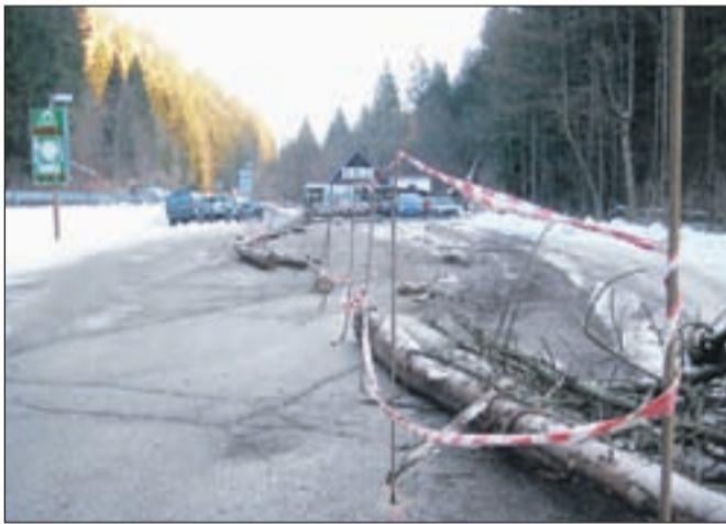
Parkirišče ob vhodu v naravni rezervat Zelenci je lastnica zemljišča, Agrarna skupnost Podkoren, zaprta.