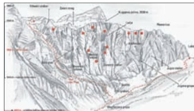
Stena na risbi Danila Cedilnika Dena