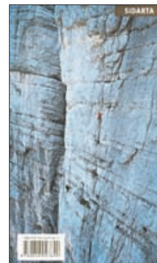
V Stebru Franca Jožefa