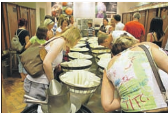
V trenutku našega obiska v tovarni je bilo v "obdelavi" kakih deset različnih rožic, ki dišijo vsaka in vedno drugače ...