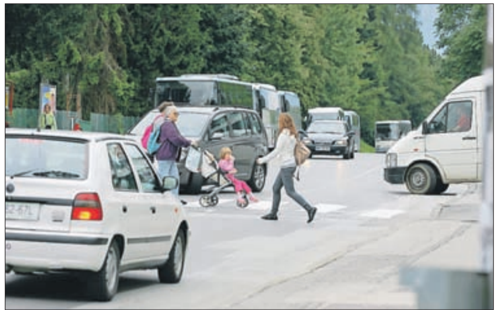
Tudi v Kranju je promet med največjimi onesnaževalci zraka z drobnimi delci.