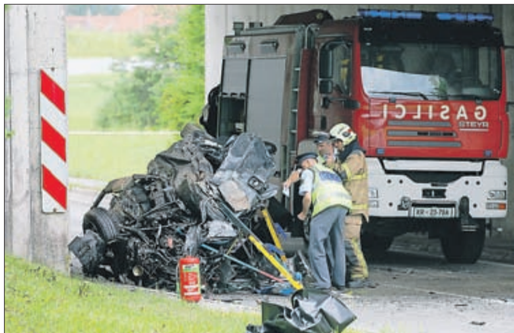
Trk v betonski podvoz avtoceste na Zgornjem Brniku je bil v soboto popoldne usoden za 46-letnega Kranjčana.

Včeraj pol ure po polnoči je v Kliničnem centru v Ljubljani za posledicami prometne nesreče umrl 28-letni Škofjeločan. V nedeljo okoli 1.20 je po poročanju policije hodil po sredini desnega voznega pasu na regionalni cesti pri Svetem Duhu. Tedaj je po cesti iz smeri Kranja proti Škofji Loki pripeljal 56-letni voznik osebnega vozila Renault Megane iz Škofje Loke, ki je pešca očitno prepozno opazil in je zato vanj trčil. Ponesrečenca so takoj odpeljali v ljubljanski Klinični center, kjer je kljub trudu zdravnikov izgubil bitko za življenje. Policisti so še ugotovili, da je 56-letni Škofjeločan vozil pod vplivom alkohola, saj je alkotest pokazal 0,84 mg alkohola v litru