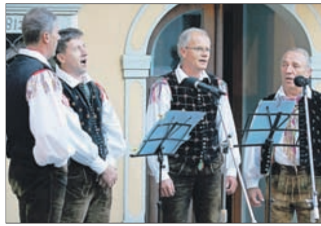
Domači pevci iz Srednje vasi z zanimivim imenom Kvartet Polži