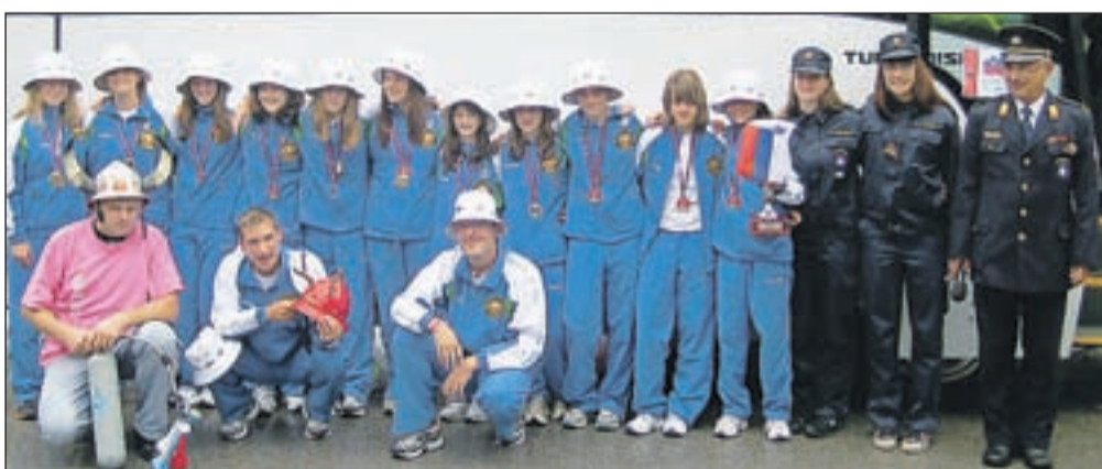
Zbiljska gasilska odprava se je v nedeljo iz Kočevja vrnila s pokalom za drugo mesto na mladinski gasilski olimpijadi.

"Naše skrite želje so se uresničile. Zlata medalja izpred dveh let se je posebrila in sije enako kot prva. Vemo, da ste dale vse od sebe. Enostavno sem presrečen," je dejal predsednik