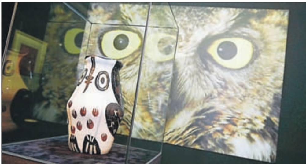
Picassovem svetu so vaze, vrči, krožniki, keramične ploščice in drugi predmeti, ki jih je oblikoval ter poslikal, dobili dimenzijo platna.

številne obiskovalce. Tokratna za enkrat večinoma tiste, ki so tudi sicer že na Bledu, organizatorji pa pričakujejo, da bodo do pozne jeseni, kolikor bo Picassova keramika