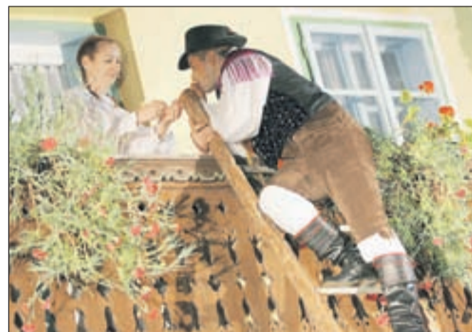
Značilni prizor z vasovanja

Odrasli člani FS KD Bohinj se vsako leto dobro spopadejo z vasovanjem, pripravijo zanimivo predstavo, ki nikoli ni podobna tisti iz prejšnjega leta. Povezovalca igre med dejanji tudi v tujih jezikih razložita vsebino, tako da tuje občinstvo oziroma turisti ravno tako vedo, zakaj France leze po 'lojtri' na balkon in čemu mu Lenka pripne nagelj.