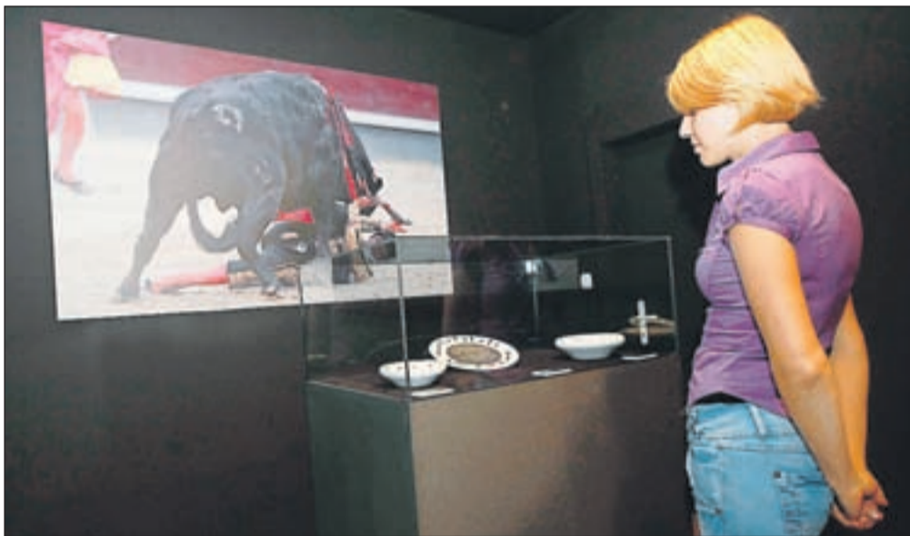
V galeriji Deva Puri na Bledu bo še vse do pozne jeseni na ogled razstava sicer manj znanih keramičnih predmetov Pabla Picassa.