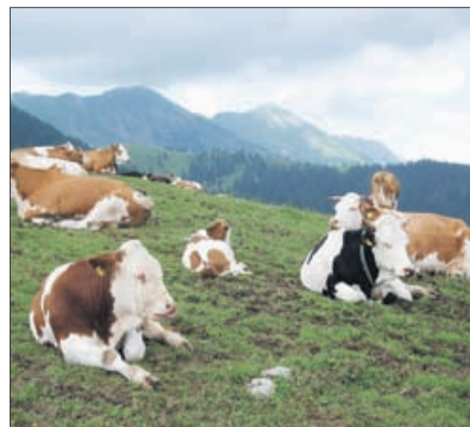
S spremembo zakona naj bi agrarnim skupnostim olajšali tudi gospodarjenje s planinskimi pašniki.

Medtem ko se kmetje pretežno zavzemajo za ohranitev skupnih površin in za zagotavljanje dobrih pogojev za pašo, se med drugimi člani pojavljajo tudi želje in zahteve po delitvi plačil za kmetijske ukrepe, za plačilo najemnine za pašo, za postavitev počitniških hišic ... Različni interesi povzročajo težave pri gospodarjenju, saj