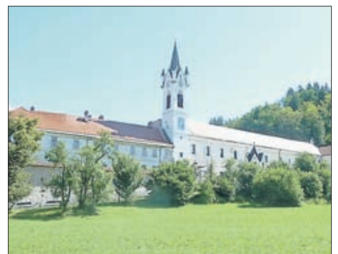
Znameniti samostan v Mekinjah, ki je bil ustanovljen že leta 1300, išče novega lastnika.

Uršulinke prodajajo samostan zato, ker ga niso več zmožne vzdrževati. Občina se je predkupni pravici odpovedala, kupca za skoraj 5 milijonov vredno stavbo pa še ni.