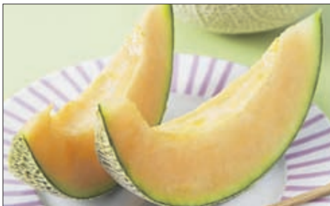
Poleti prija melona