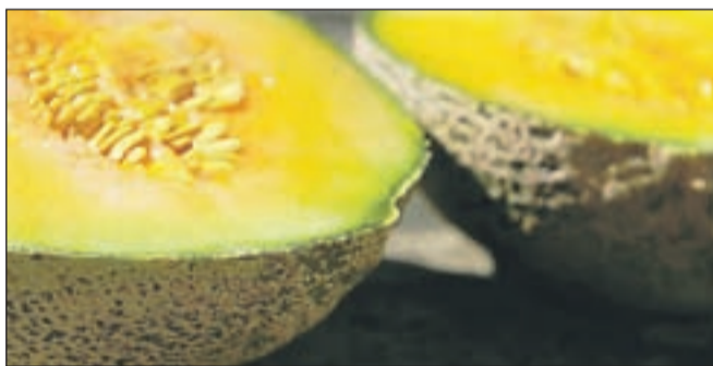
Melona gasi žejo