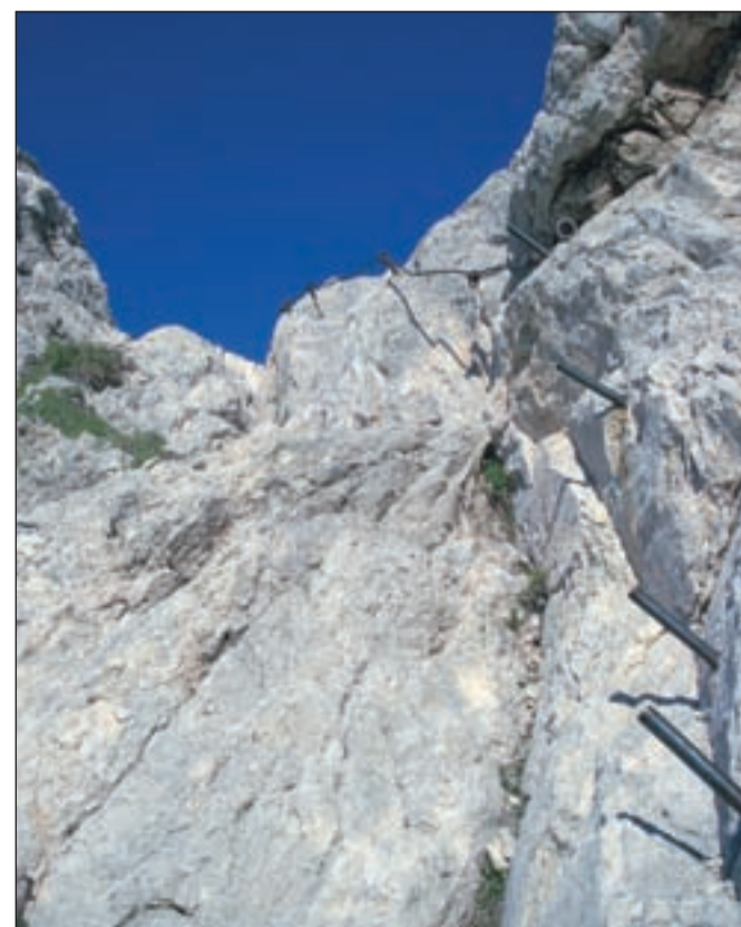
Tudi gamsi bi zavidali.