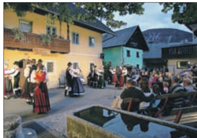
V Vasovanju spoznamo šege, navade in ples.