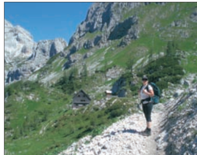
Tam nekje za hribi je odrešitev.

Naslednji dan naju je zbudilo jutro, kot na razglednici. Ne, še huje je bilo, saj sva midva v živo nastopala v njej. Ker imam rahlo izkrivljeno kaprico, da me vse, kar je povezano s Triglavom, ne zanima ter se načeloma ne vračam po isti poti, sva se že prejšnji dan odločila, da jo mahneva na Kredarico, čeprav je nekam sumljivo blizu našega očaka. Ja, lažje se diha tudi brez bronhija, če imaš ob sebi razumevajočo osebo. Pot preko Rži je sicer kratka, a te nagradi s prečenjem čez snežišča, malce plezanja in gamsovega pogleda čez strmine. Kredarica, razočaranje. Pa ne zaradi običajne gneče. Ne pozabite, da sem glede tega dogovorjena z višjo silo, ampak zaradi celotne zgodbe. Z lahkoto bi ga lahko poimenovali najvišji hotel v Sloveniji. Pa tudi kakšna zvezdica mu ne bi ušla. V bistvu lahko tik pod najvišjim vrhom dobiš vse, kar si srce poželi. Moram reči, da mi v božansko okolje gora bolj sodi kočica v starem stilu samo z ričetom in joto. Pa tudi stranišče na štrbunk je veliko bolj prijazno prebavi. Ker sva dosegla najvišjo točko mojega dome-ta, naju je čakala samo še pot navzdol. Pri Vodnikovem domu spet obvezno polnjenje bidona z vodo in nato spust preko Velega polja do Voj. Če bi vedela, kaj me čaka, bi raje še enkrat ali pa dvakrat skočila na Kredarico, kot pa se brezupno prebijala skozi gmajno, ki ji nikakor ni bilo videti konca. Na cilju sem ob mrzli pijački prišla do zaključka, da imam vse tako rada, da nikogar ne bi poslala po tej poti navzdol. Ma je blo fino!