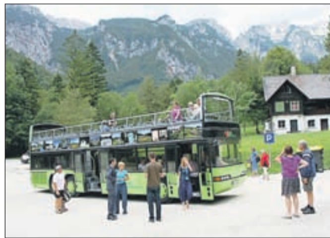
Panoramski avtobus se je ustavil tudi pri izviru Kamniške Bistrice.