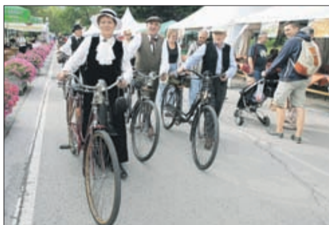
Starodobni kolesarji vedno pritegnejo pozornost. Lahko je njihova oprava vedno ista, ljudje vsakič opazimo kaj drugega.