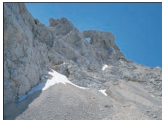
Slabo voljo odpihne skozi okno.