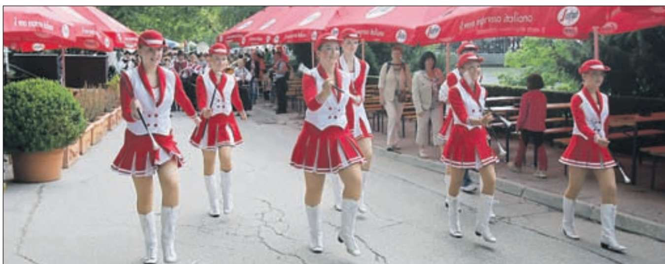
Po Blejski promenadi so takole gor in dol korakale in izvajale svoje vragolije članice Mažoretnega in twirling kluba Radovljica , za njimi pa Godba Gorje .