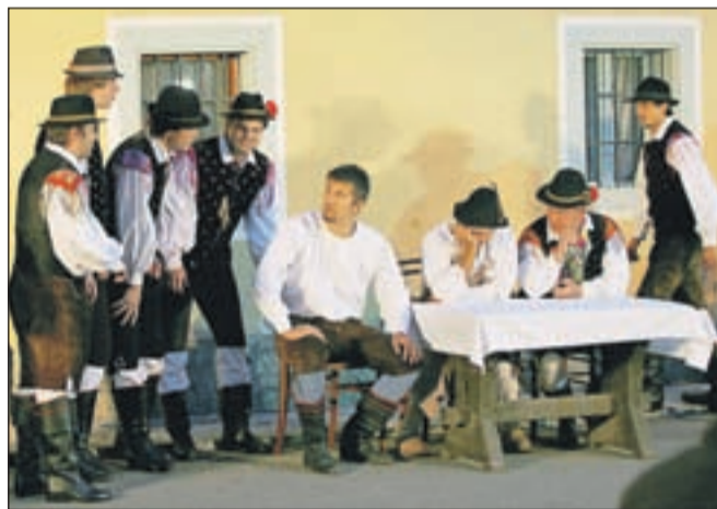
Bohinjska tradicionalna igra ima tri dejanja: fantovske pogovore pred gostilno, vasovanje in 'fantovšno'.