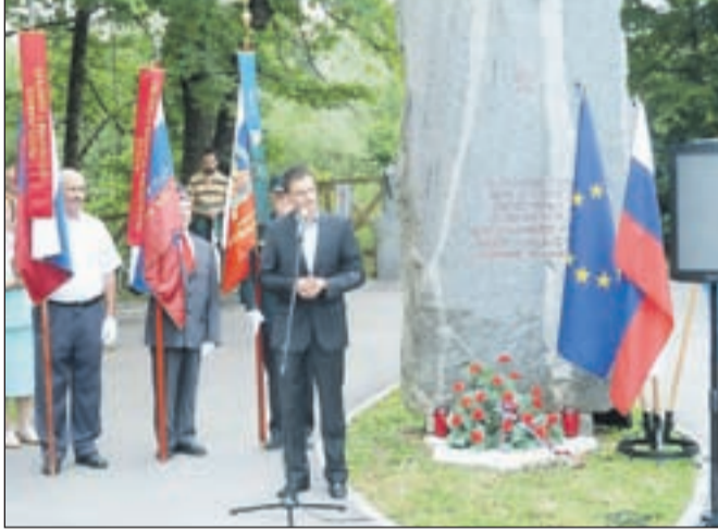
Obležje ob Titanovi brvi spominja na začetek upora proti okupatorjem na Kamniškem pred 70 leti.