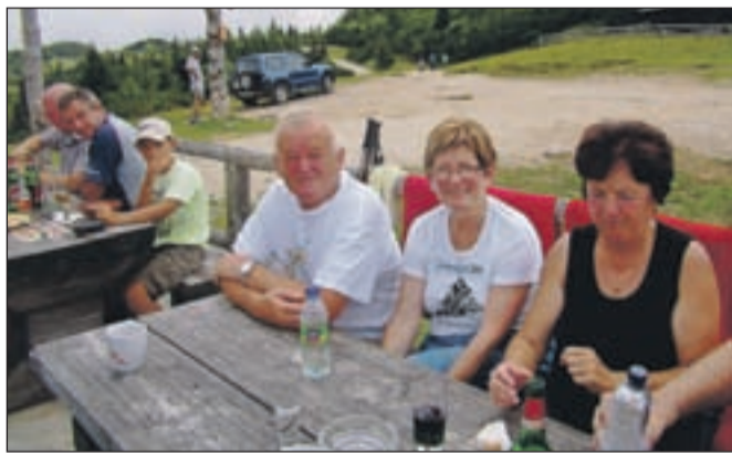
Vreme sicer ni bilo najlepše, počitek se je prilegel, ...