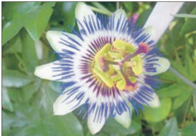
Modro pasijonko pogosto srečamo ob morju.

Južnoameriški in severnoameriški Indijanci, zlasti Algonkinci, so s pasijonko zdravili vse mogoče težave. Najbolj pogosto so z njo pomirjali živčno napetost, nespčnost, epilepsijo, paniko, občutek tesnobe ter razdražljivost. Pomagala jim je