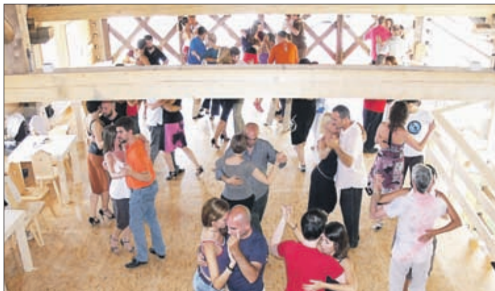
Nova dvorana pod kozolcem je dodatna turistična ponudba za celoten Stari Vrh. Ta konec tedna se je v njej na ritme tanga sukalo kar 120 plesalcev.