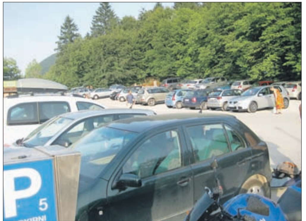
Tik ob jezeru so na voljo parkirna mesta, za katera je treba odšteti en evro na uro. Bolj oddaljena parkirišča so brezplačna. Imetniki kartice Gost Bohinja parkirajo brezplačno in imajo cenejši avtobusni prevoz.