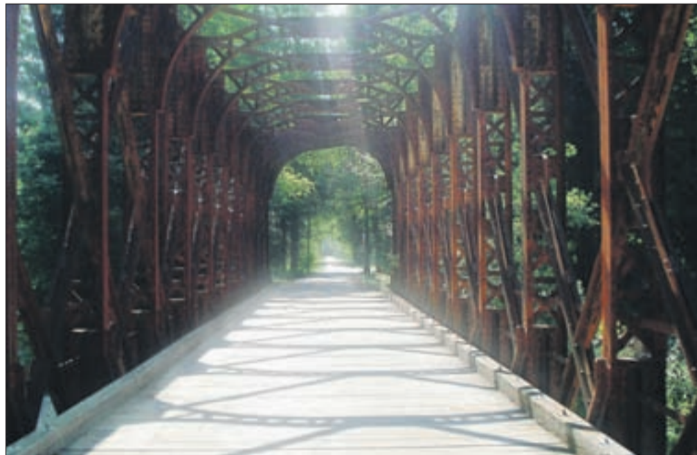
Od Mojstrane do Trbiža boste kolesarili po bivši železniški progi.

da bi se bali pločevine na štirih kolesih.