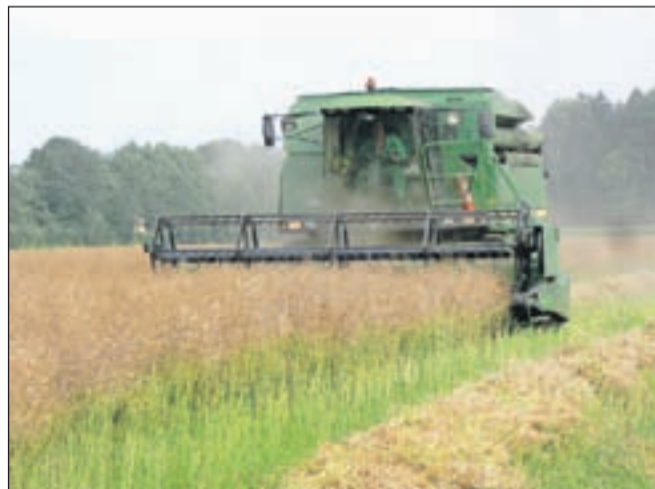
Na Gorenjskem so prejšnji teden končali žetev oljne ogrščice, skupno je je bilo nekaj več kot 90 hektarjev, pridelki pa so bili zaradi bolj redke setve nekoliko nižji, od 3 do 3,5 tone na hektar.

Kranj - "Ozimni ječmen na Gorenjskem je požet. Pridelki so glede na težave pri setvi kar dobri, od 4,5 do 5,5 tone na hektar, zaradi aprilske suše je bilo le nekaj manj slame, ki jo na kmetijah potrebujejo za potrebe živinoreje," je dejala Marija Kalan , specialistka za rastlinsko pridelavo v Kmetijsko gozdarskem zavodu Kranj, in dodala, da so na peščenih, prodnatih tleh zaradi prisilnega zorenja začeli žeti že tudi jari ječmen in pšenico. "Ohladitev je žetev ustavila in se bo nadaljevala po 20. juliju, pridelek pšenice bo verjetno dokaj podoben lansnemu, od 5 do 5,5 tone na hektar, kakovost pa je zdaj še prezgodaj napovedovati," je dejala Kalanova, ki pričakuje, da bo letos zaradi višje odkupne cene več zanimanja za prodajo kot prejšnja leta, ko so kmetje pšenico raje porabili za krmljenje,