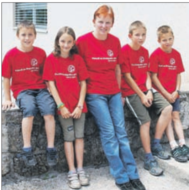
Najuspešnejši tim Dražgoške gore

In kaj sta o pohodih povedala zagrizena alpinista? "V tem šolskem letu smo že tretje leto imeli tekmovanje v pohodih na Goro. Uspešni smo bili štirje učenci in ena učiteljica, med katerimi sva