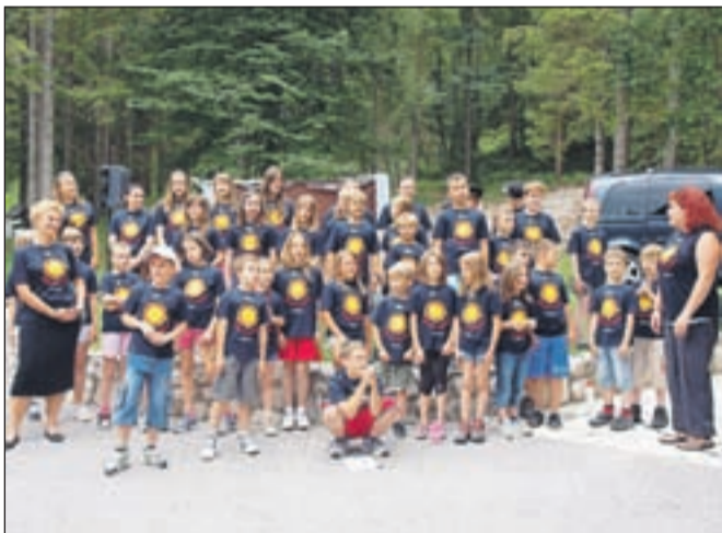
"Kranjska Gora je otroški raj. Naj, naj, največ je zabave. Kranjska Gora hrup in direndaj. Daj, daj, dajmo skupaj glave," so otroci prepevali "kranjskogorsko himno".

V letoviščih Zveze prijateljev mladine počitnice trenutno preživlja okoli 2500 otrok. Med njimi je sto otrok s posebnimi potrebami in več kot sedemsto tistih, ki jim je letovanje omogočila humanitarna pobuda Pomežnik soncu, ki jo Zveza prijateljev mladine Slovenije vsako leto organizira skupaj s farmacevtsko družbo Lek, članico skupine Sandoz. Lek je letošnjemu, že trinajstemu Pomežniku namenil sedemnajst tisoč evrov.