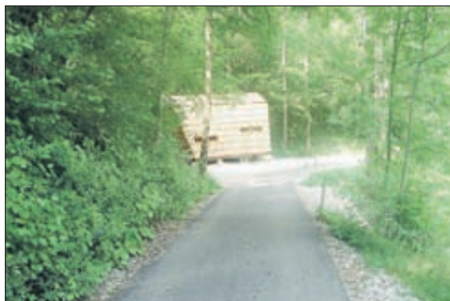
Pred slabim vremenom boste v Bohinju našli tudi zavetišče.

Obe opisani kolesarski stezi si zaslužita najvišjo možno oceno prav tako kot obe občini, Bohinj in Kranjska Gora z obema županoma na čelu. Vse pohvale s strani Gorenjskega glasa!