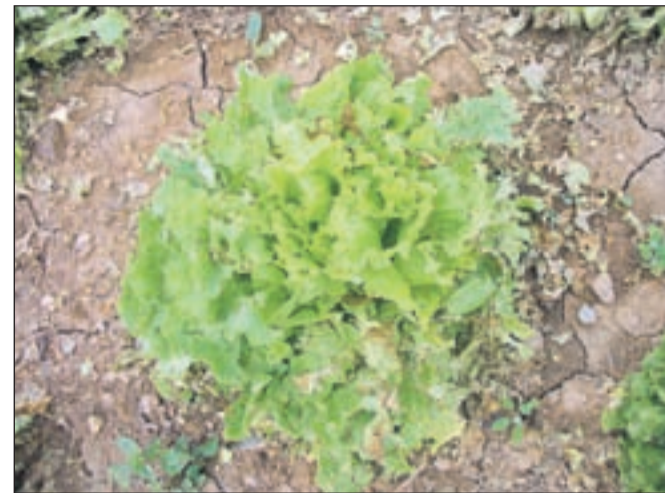
Solata se od daleč zdi v redu, a od blizu se ji vidi, da je poškodovana in da takšne ni možno prodati.

Pristojne državne ustanove zdaj vedo za škodo v trži-