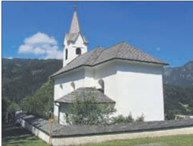
Cerkev sv. Križa v Kortah je stara 150 let.