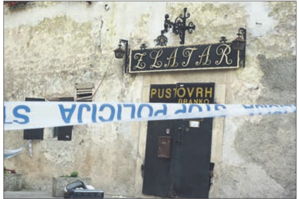
Roparji so iz škofjeloške zlatarne Pustovrh odnesli za okoli sto tisoč evrov nakita.

Po prvih ugotovitvah kriminalistične policije so se osumljeni roparji, stari od 20 do 22 let, v četrtek popoldne z dvema voziloma pripeljali v Škofjo Loko. Parkirali so na Spodnjem trgu, kjer sta se dvajset- in 21-letnik preoblekla v druga oblačila in se oprtala z nahrbtnikom, v katerem sta bila lepilni trak in orožje, za katerega so kasneje ugotovili, da je šlo za imitacijo plinske pištole. S Spodnjega trga sta se peš odpravila do zlatarne na Mestnem trgu v Škofji Loki, po naših podatkih gre za zlatarno Pustovrh. Pred njo sta si zamaskirala še obraza, nakar sta vstopila v zlatarno, v kateri tedaj razen zlatarja ni bilo strank. "Storilca sta za seboj zaklenila vrata, z uporabo orožja pa zaposlenega prisilila, da se je pustil zvezati. Medtem ko je eden z lepil-