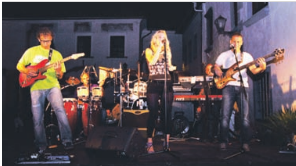
... in nadaljevalo s Pando. Prihodnji četrtek nastopajo The 80's band in zadnji četrtek v juliju še "talentovska" zasedba EightBomb.

Zadnji četrtek v juliju (avgusta se na Linhartov trg z 29. Festivalom Radovljica vrača stara glasba) bo nasto-