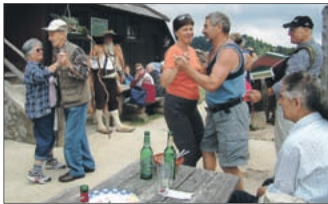
... vendar so marsikoga zasrbele pete.