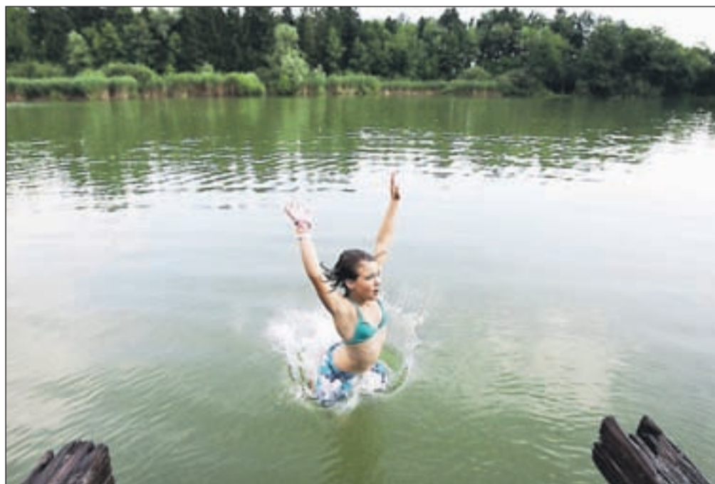
Na Gorenjskem je večina vzorčenj pokazala, da je voda primerna za kopanje. Tako se kopalci brez skrbi lahko namakajo tudi v Čukovem bajerju.

"Vsako leto v spomladanskem času vsem občinam pošljemo obvestila oziroma ponudbe, vendar se na našem koncu druge občine zadnja leta ne odzivajo. Storitve