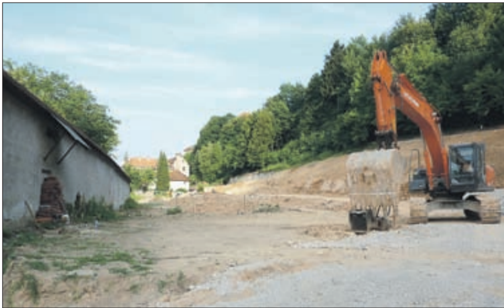
Na nekdanjem Nunskem vrtu že potekajo dela za ureditev parkirišča s 176 parkirnimi mesti, zgradili pa bodo tudi otroško igrišče.

"Večkrat sem že odgovarjal na te očitke in povedal, da načrtovane gradnje nisem dobro poznal, ko pa sem natančno pregledal projekt in ugotovil, da gre za degradirano območje v bližini mestnega jedra in da bodo lepo urejena parkirišča rešila tako zadrego s parkiranjem v starem mestnem jedru kot varno pešpot iz Vincarij, ob njih pa bo še otroško igrišče, ki ga na tem delu mesta težko čakajo, sem mišljenje spremenil. Kot nov župan sem projekt prevzel po prejšnjem, da ga uresničimo, pa sem se odločil zlasti na pobudo številnih meščanov pa tudi zato, ker bomo za ureditev parkirišč dobili sredstva iz strukturnih skladov," na očitke odgovarja župan Miha Ješe , ki odločitve komi-