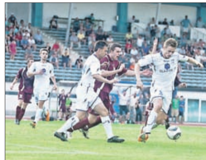
Nogometaši Triglava so si prvo prvenstveno zmago priborili v podaljšku.

Po porazu 1 : 2 na domačem igrišču ekipo Domžal v 2. krogu kvalifikacij za evropsko ligo v četrtek čaka povratna tekma v Splitu. Že jutri, v sredo, pa bodo nogometaši Triglava odigrali zanimivo prijateljsko tekmo na nogometnem igrišču v športnem centru Kranja. Njihov nasprotnik bo nemški prvak iz leta 2009 Wolfsburg , tekma pa se bo začela ob 18. uri.