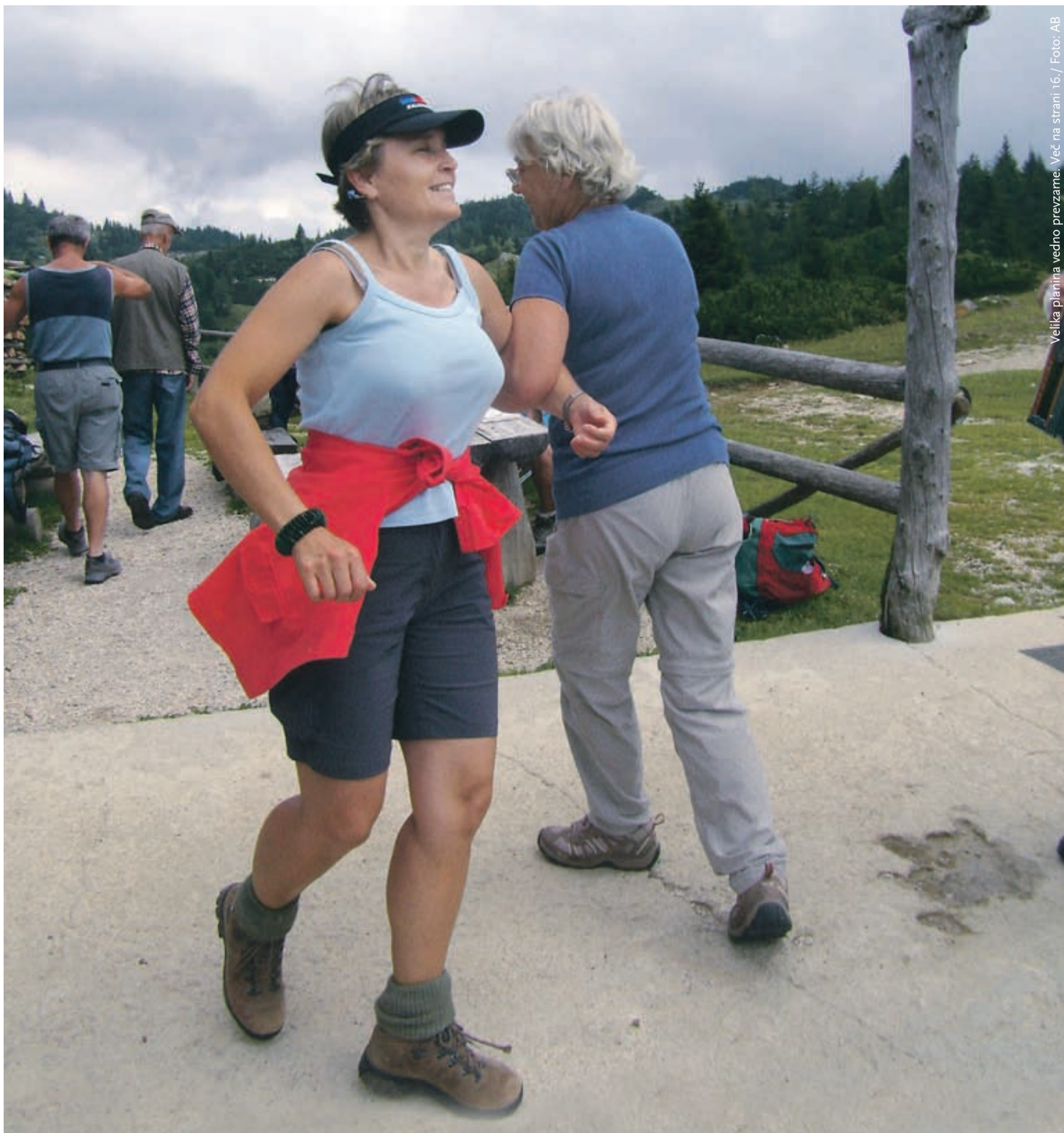
Velika planina vedno prevzarne. Več na strani 16.