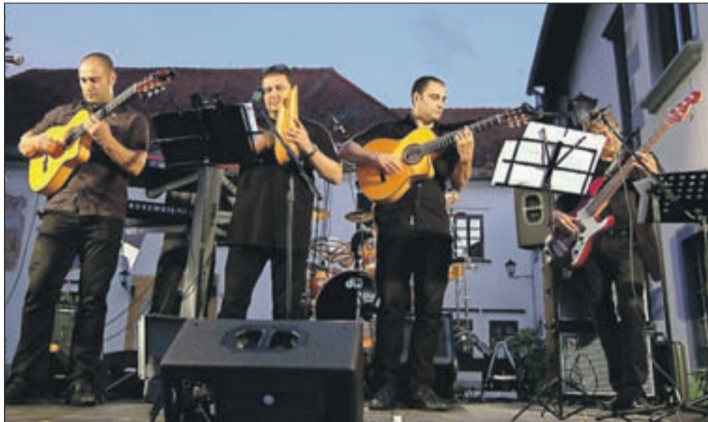
Glasbeno poletje na Linhartovem trgu se je začelo z Latino.si ...

Teden dni za tem je v jasnem, vročem poletnem večeru navdušila skupina Panda, ki se je na slovenski pop sceni kot originalen, prepoznaven, samosvoj in inventiven slovenski bend uspela obdržati vse do danes. Ta četrtek se Radovljica spet vrača v osemdeseta. The 80's band izhajajo iz zasedbe Supernova, v Radovljici pa bodo, kot pravijo organizatorji, ki obljublajo edinstveno časovno-glasbeno popotovanje, izvajali največje pop & rock hite iz glasbeno neponovljivo spektakularnega desetletja.