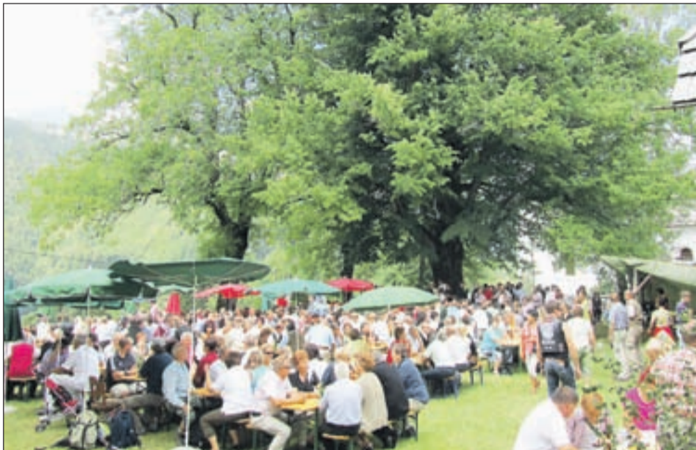
Praznik pod lipo

Da bi cerkev ostala srce vasi in združevala ljudi, ki