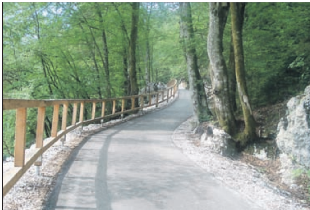
Bohinjska kolesarska steza je najlepše urejena v Sloveniji.

Bohinjsko kolesarsko stezo boste opazili na desni strani tik pred mostom nad Savo Bohinjko nekaj sto metrov pred Bohinjsko Bistrico ali ko boste že prevozili Bistrico in boste po enem kilometru na desni strani opazili tablo za vas Brod. Videli boste tudi nov "toplar". Tam lahko parkirate in začnete uživati. Vsekakor priporočam, da startate pri mostu, saj boste zato izkoristili dobre tri kilometre steze s prekrasnimi razgledi. Steza pelje čez Brod naprej proti Stari Fužini. Ima vse, kar mora prava kolesarska steza imeti. Torej: vozili se boste po lepem novem asfaltu po gozdu, ob njivah, čez travnike in polja. Lahko boste počivali na več počivališčih. Prav tako si boste lahko natočili izvirske vode ali se skrili pred neurjem, saj sta ob stezi kar dve zavetišči. Prvi del steze se konča v Stari Fužini, kjer pa lahko nadaljujete pot naprej proti Srednji vasi, kjer vas čaka še nekaj krasnih kilometrov. Tam lahko obrnete nazaj ali pa sledite znakom, ki označujejo kolesarsko pot in ne več kolesarske steze. Bohinjska kolesarska steza je enkratna za družinske izlete. Seveda pa je dobrodošla tudi vsem tistim kolesarjem, ki so končno dočakali, da se v okolici Bohinja lahko vozijo, ne