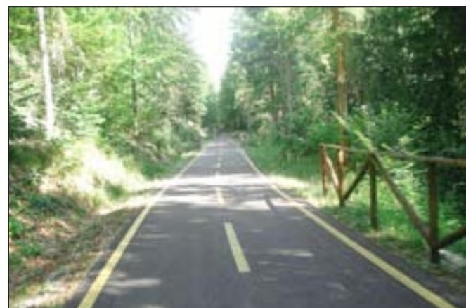
Kolesarska steza je idealna za družinske kolesarske izlete.