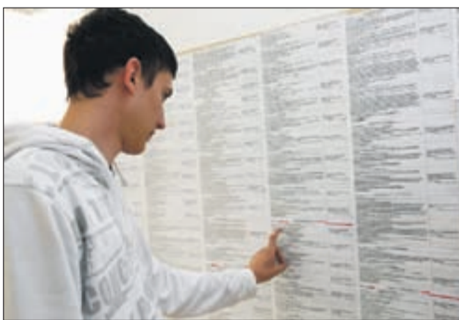
Hudega navala na delo v Avstriji in Nemčiji v prvih dneh po odprtju trga delovne sile na Gorenjskem ni. Slika je simbolična.

Avstrijce zanimajo delavci s področja kovinarstva (varilci, cevarji, upravljalci CNC strojev, oblikovalci kovin, kleparji, ključavničarji, monterji), zdravstva (medicinske sestre, negovalci), gradbeništva (zidarji, fasaderji, tesarji), občasno pa iščejo tudi voznike tovornjakov z vozniškim izpitom kategorij C in E. "Postopek zaposlitve slovenskih državljanov v Avstriji je podoben kot pri zaposlitvi do-