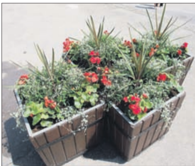
Mesto bodo letos okrasili s še več cvetličnimi koriti.