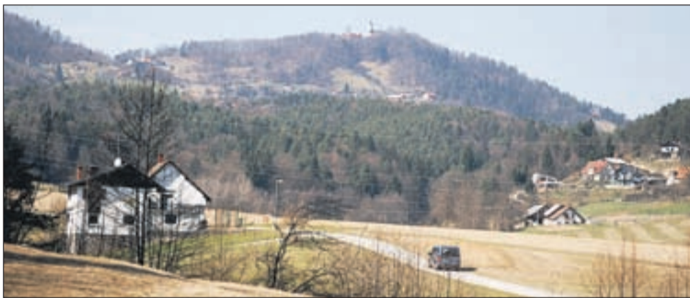
Pogled na Šentjungert / Foto: Jelena Justin

Ko sem se iz Celja peljala proti Lopati, sem daleč pred seboj zagledala simpatično cerkev na enem od okoliških hribov. Odpeljala sem se do Gorice pri Šmartnem. Ko sem prišla do strnjene naselja, bi morala parkirati avto, a ker ni bilo primerne prostora, sem se odpeljala še naprej, v desni smeri naselja. Spustila sem se po cesti navzdol, ki se je spremenila v makadam, še vedno sem se držala desno, ko sem pred seboj, na križišču poti, zagledala kapelico. Ob kapelici sem zavila levo in parkirala avto ob potoku. Ena makadamska pot je šla naravnost, druga pa je zavila desno. Šla sem po desni poti, mimo stare hiše, ki mi je delovala opuščeno, ampak mislim, da ni bila. Makadamska cesta zavije bolj v desno, se zmerno vzpenja, nato pa sledi oster ovinek v desno, pa še eden v levo. Pred seboj sem zagledala kovinsko lovsko opazovalnico. Sledim utrjenemu makadamu,