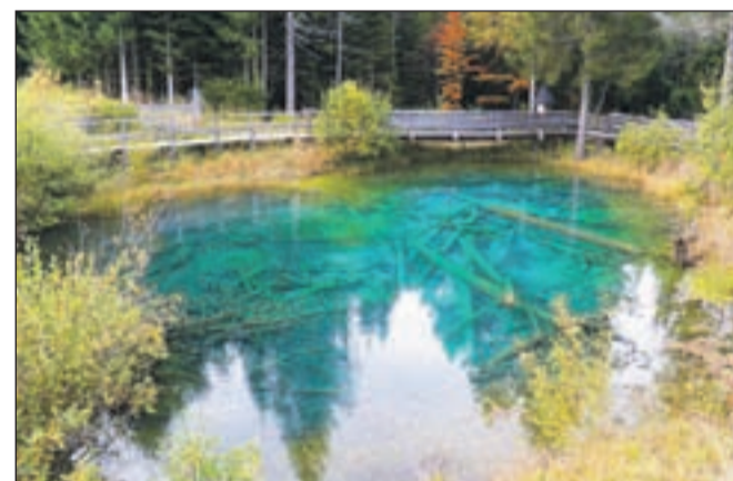
Jezerce ("Morsko oko"), v dolini Poden (Bodental) pod Vrtačo