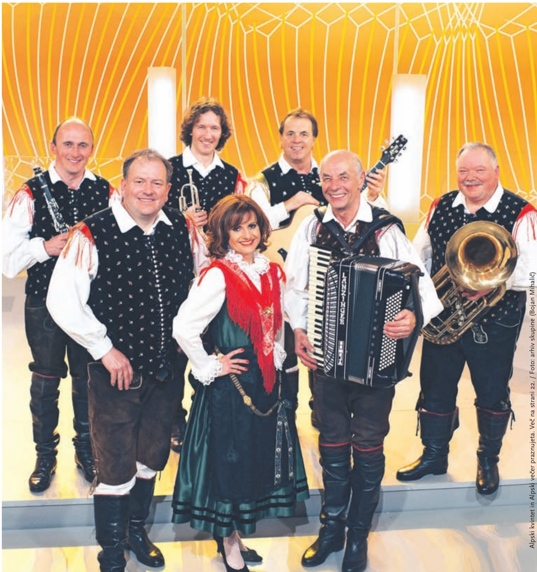
Alpski kvintet in Alpski večer praznujeta. Več na strani 22.