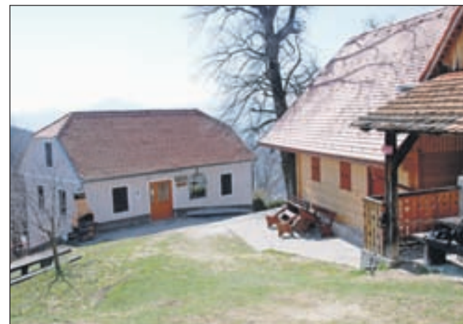
Planinski dom je urejen v nekdanji mežnariji.

Nadmorska višina: 565 m Višinska razlika: 300 m Trajanje: 1 ura Zahtevnost: ★★★★★