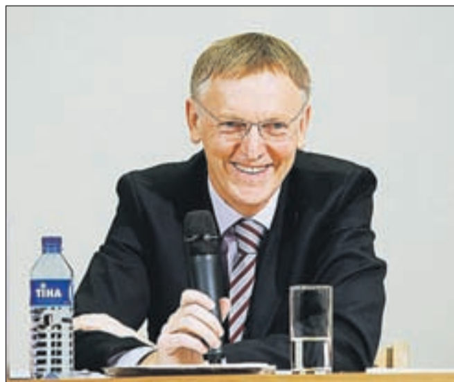
Evropski komisar Janez Potočnik, ko je bil gost Glasove preje.

Dogajanja v Sloveniji pozorno spremlja in ga tako kot številne druge državljanke in državljane skrbi. "Gremo v napačno smer. Bojim se, da bi ob nadaljevanju današnjih trendov mladi, odgovorni, inovativni ljudje lahko izbirali le med odločitvijo za pot v tujino ali tihim umikom v zasebnost doma. Škoda bi bila generacijsko nepoprav-