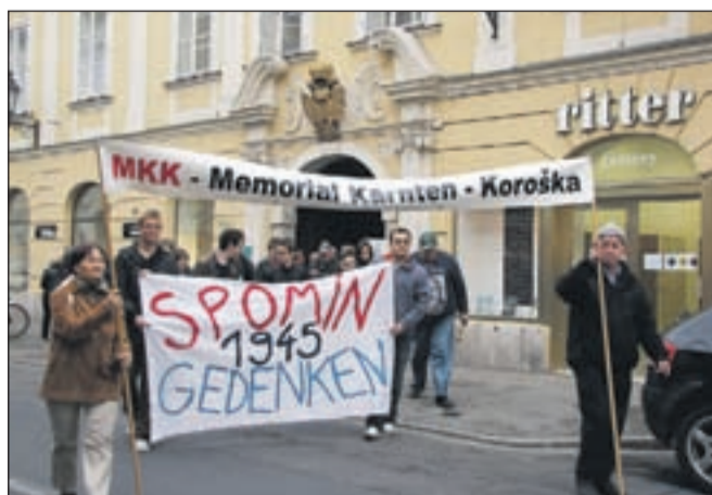
Pohod se je začel pred celovškim muzejem moderne umetnosti.