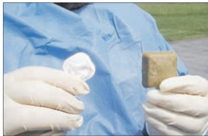
Vabe s cepivom se ne smemo dotikati.

V času cepljenja lisic je prepovedano prosto gibanje psov na javnih mestih, treba se je izogibati stikom s potepuškiimi in divjimi živalmi. Ker so vabe namenjene divjim živalim, na upravi prosijo lastnike psov, da vodijo svoje ljubljence na sprehode privezane. Vaba je za pse neškodljiva in se z njo po zaužitju zagotovi le imunizacija. Po zakonu morajo biti psi v naši državi obvezno enkrat letno cepljeni proti steklini (vsakih 12 mesecev). Mladi psi morajo biti proti steklini cepljeni takoj, ko dopolnijo tri mesece starosti.