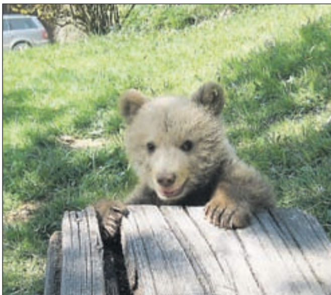
Mali Medo v Podvrhu privablja številne radovedneže.