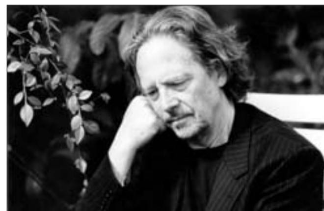
Pisatelj Peter Handke, po materi Slovenec