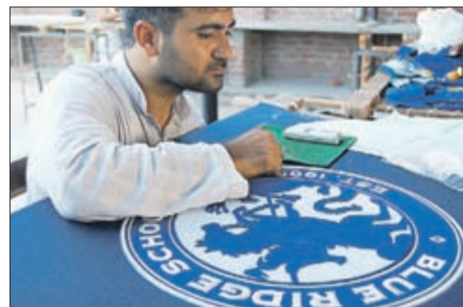
Pakistanski delavec, ki za majhen denar šiva velik našitek.