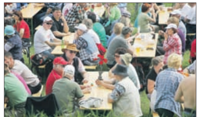
Nedeljski dopoldan bodo zaznamovala prvomajska srečanja na Sv. Joštu nad Kranjem, Križni gori nad Škofjo Loko, na Pristavi nad Javorniškim Rovtom in v Kamniški Bistrici. Na sliki: lansko zborovanje na Križni gori.

Bralkam in bralcem čestitamo ob 1. maju, mednarodnem prazniku dela.