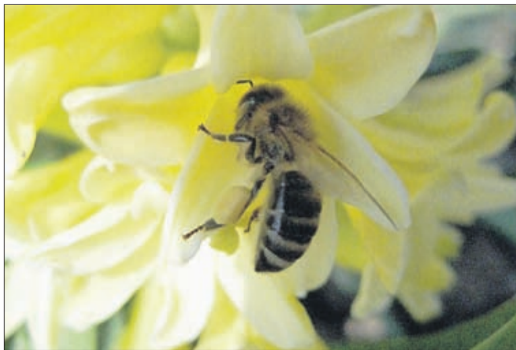
V Pomurju je bilo prizadetih več kot dva tisoč čebeljih družin.

"Gre za katastrofo," je pomore čebel v Pomurju komentiral Žirovničan Boštjan Noč, predsednik Čebelarstva Slovenije (ČZS). "Krivec za pomore čebel naj bi bilo spet, kot leta 2008, tretirano seme koruze. Sprašujemo se, ali kmetje tretirano