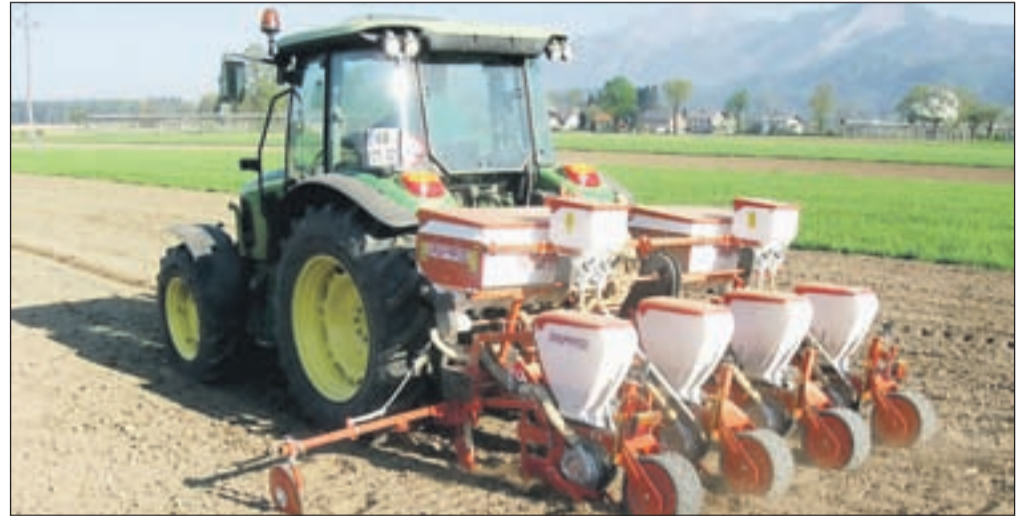
Sredi prejšnjega tedna so prvi kmetje opravili setev koruze, ki je letos zgodnejša kot lani.

Približno trideset do štirideset odstotkov koruze bo letos posejane v maju po spranilu trav ter mešanice trave