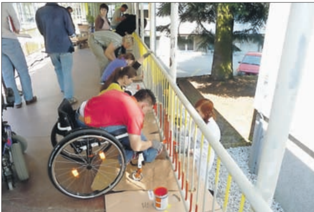
Razlik med dijaki obeh šol pri barvanju ni bilo, rezultat druženja pa je pisana ograja.

"Želeli smo si polepšati hodnik z ograjo ob glavnem vhodu, ki je središče srečanja in druženja v našem centru. K sodelovanju smo povabili mlade strokovnjake iz Srednje šole za oblikovanje in fotografijo Ljubljana in podjetje Helios, kjer so nam velikodušno darovali barvo. Bistvo akcije pa je predvsem v tem, da dosežemo dva cilja - da tiste, ki imajo posebne potrebe, vključimo v družbo, da jih bo sprejela, a pot je tudi obratna. Naj tudi družba pride v naš zavod in spozna naš način življenja. Sporočilo današnjega srečanja je v tem, da imamo vsi posebne potrebe, eni bolj izrazite, drugi pa manj, in šele ko se tega zavedamo, lahko razvijemo občutek za soljudi. Če vidimo samo sebe, je svet poln prepira, ko pa vidimo tudi drugačne, razumemo, da nismo sami in da mora-