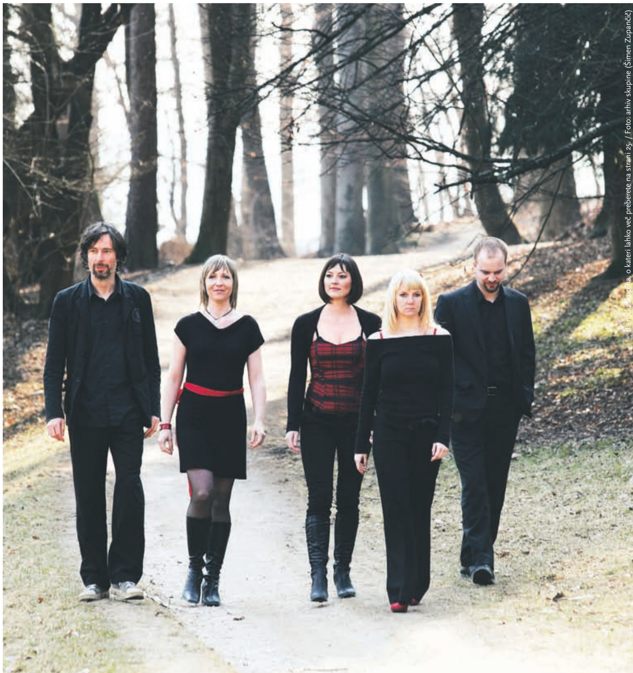
Ba-rock, skupina, o kateri lahko več preberete na strani 25.