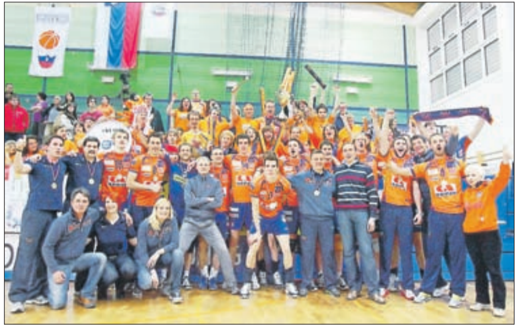
Blejski odbojkarji so se v sredo zvečer skupaj z navijači veselili že sedmega zaporednega naslova državnih prvakov.