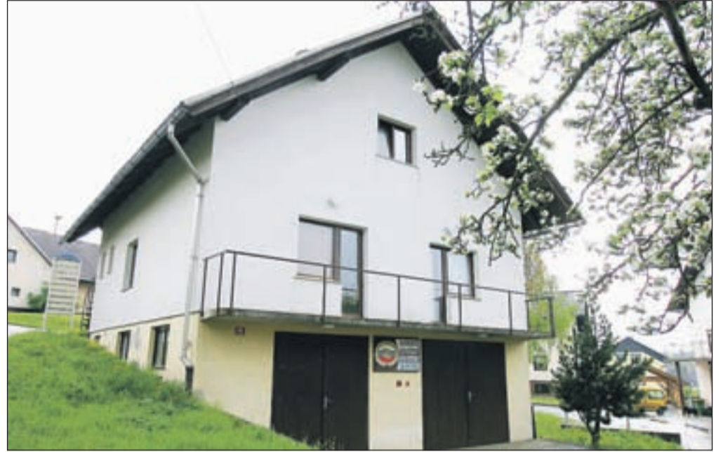
Obstoječi gasilski dom v Hotemažah je brez uporabnega dovoljenja.

Gasilski dom v Hotemažah, zgrajen pred dobrimi štiridesetimi leti, je brez uporabnega dovoljenja, zato si je Prostovoljno gasilsko društvo Hotemaže že vrsto let prizadevalo za pridobitev zahtevanih dovoljenj. "Po dolgih letih prigo-