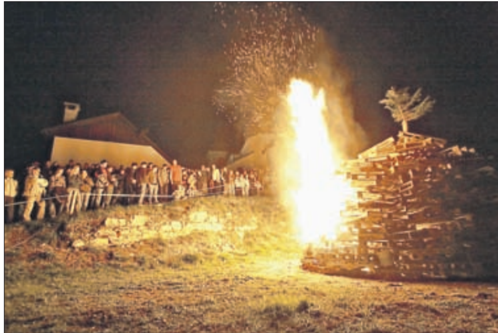
Kurišče kresa je treba zavarovati in nadzorovati ves čas kurjenja.

pomočke, kot so smodnik, petarde, večje kose karbida, kovinske posode z železnimi pokrovi, bencin in drugo," navaja Leon Keder s Policijske uprave Kranj. Po zakonu o eksplozivih in pirotehničnih izdelkih je uporaba ognjemetnih izdelkov 2. in 3. kategorije, katerih glavni učinek je pok (petarde najrazličnejših oblik in moči), prepovedana, medtem ko je uporaba pirotehničnih izdelkov kategorije 1, katerih glavni učinek je pok, dovoljena le od 26. decembra do 2. januarja. Za kršitev zakonskih določil je predpisana globa od 400 do 1200 evrov, za pravne osebe, ki bi prepovedano pirotehniko prodajale, pa od 3000 do 50.000 evrov.