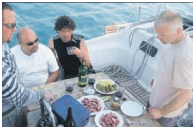
Brez prave kranjske klobase na naši barki ni šlo.