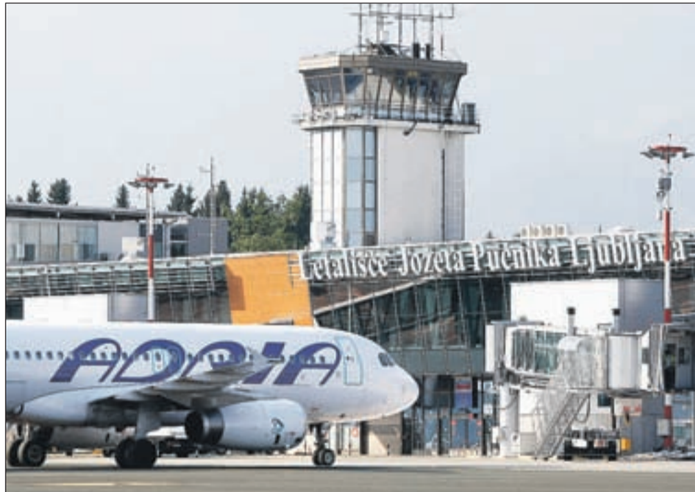
Eden od možnih virov nizkofrekvenčnega hrupa je tudi Letališče Jožeta Pučnika Ljubljana.

časno v pomladanskih mesecih, od jeseni naprej pa je pojav stalen in vse bolj moteč, še posebej zoprn pa