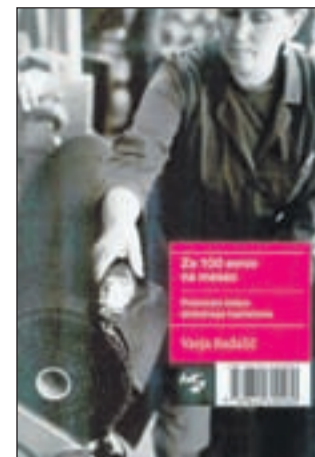
Naslovnica knjige, oblikoval Boris Balant, fotografija Mete Krese