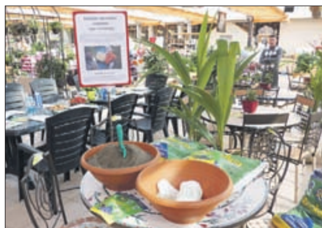
Vulkanski prah izboljšuje rodovitnost tal.