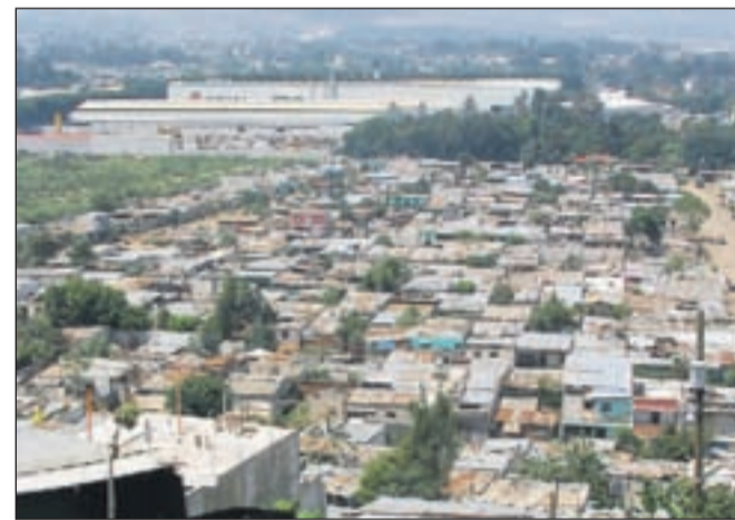
Alioto, Gvatemala. V ospredju delavsko naselje, za njim tovarna, "makila"