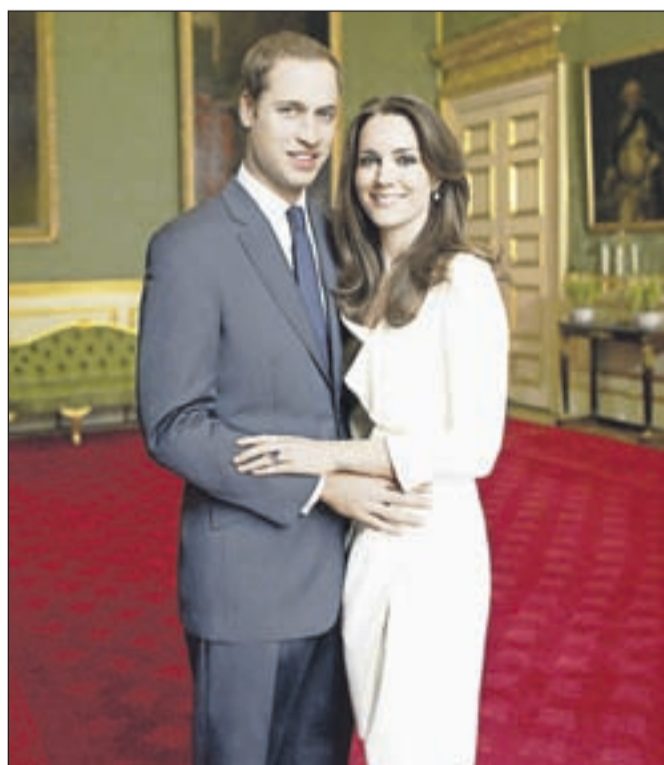
Princ William in njegova Kate