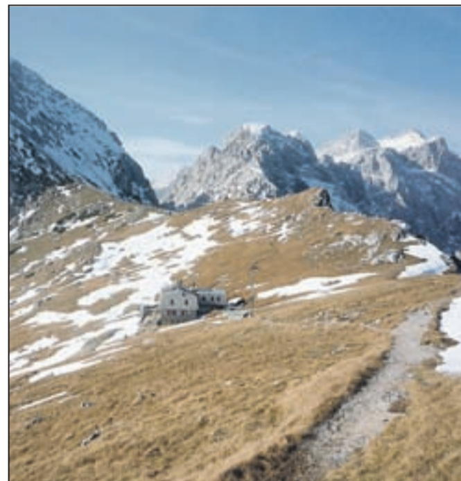
Kočica na Kamniškem sedlu je zaradi temeljite prenove tudi med prvomajskimi prazniki zaprta.

Med prvomajskimi prazniki so vrata odprle številne planinske kočice. Iz PD Jesenice tako sporočajo, da je kočica pri izvihu Soče že stalno odprta, kočica na Golici bo od 30. aprila, Tičarjev dom na Vrščicu od 13. maja, Erjavčev dom na Vrščicu pa od 15. maja (do takrat obratuje med vikendi in prazniki). Roblekov dom na Begunjskih bo med prazniki odprt še do nedelje, Valvazorjev dom pod Stolom je od minulega vikenda že stalno odprt, Pogačnikov dom na