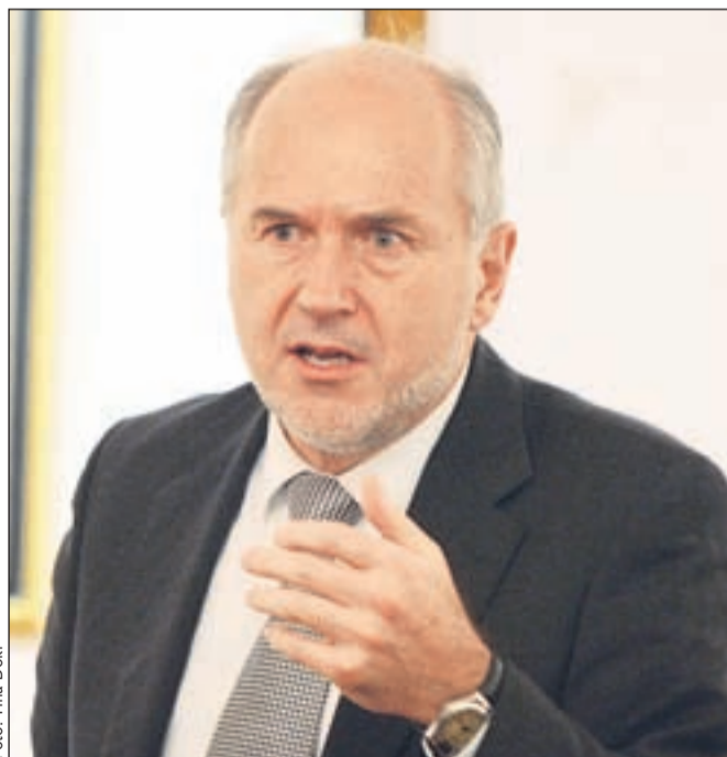
Valentin Inzko se je izkazal kot spreten in potrpežljiv pogajalec.

Torkov "finalni" pogovor o določitvi števila krajev v južnem delu Koroške, kjer naj bi postavili dvojezične krajevne napise, ter o rešitvi drugih, tudi gmotnih vprašanj delovanja slovenske manjšine na Koroškem je bil uspešen. Predstavniki treh krovnih organizacij Slovencev na Koroškem, deželne vlade in zvezne vlade na Dunaju so sklenili, da bodo dvojezične krajevne napise postavili v 164 krajih v južnem delu Koroške, med katerimi so tudi kraji, kjer table že stojijo (teh je 91) in kjer so jih že ali jih bodo morali še postaviti po odločitvi avstrijskega ustav-