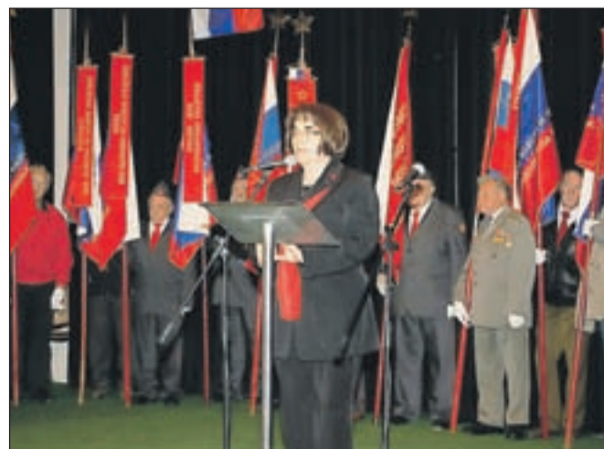
Slavnostna govornica na osrednji proslavi v občini Domžale je bila ministrica Ljubica Jelušič.

"Skrbimo, da se bo iskra narodovega domoljubja razplamtela, ko nam bo kdorkoli skušal nadeti okove nesvobode. Fašizem ni samo vojna, streljanje talcev, zapiranje v taborišča in prepoved slovenskega jezika. Tudi desetisoči brezposelnih, vsi, ki so v strahu za svoje delo, ki ne dobijo plačila, ki so odvisni od socialne pomoči, vsi mladi, ki nimajo prave perspektive ... Tudi to je neke vrste fašizem - ekonomski fašizem! To ni svoboda, za kakršno smo bili boj pred sedemdesetimi leti, niti demokracija, za kakršno smo gla-