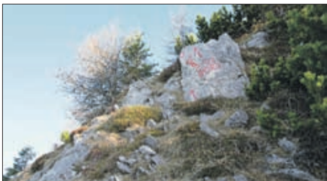
Razpotje, kjer nadaljujemo v smeri Psice.

Odpeljemo se do Trstenika in nadaljujemo naprej do vasi Povelje. Peljemo se skozi vas, na koncu katere se cesta strmo dvigne. Parkirišče na desni strani nam da vedeti, da bomo tukaj pustili jeklene konjička. Smerokaz nas usmeri v gozd. Spodnje višinske metre hodimo po t. i. Dolenčevi poti , ki pelje na Veliko Poljano. Pot je že na začetku precej strma, a se strmina občasno unese. Dvakrat bomo prečili cesto, nato pa bo pot kmalu zavila ostro levo in naravnost navzgor. Ko bomo pri prvi okrepčevalnici, kakor je zapisano na leseni tabli, bomo na razpotju. Zavijemo levo in sledimo markacijam. Takoj po razcepu teče pot naravnost, brez vzpona, nato pa se začne spet strmo dvigovati. Kmalu zavije ostro desno