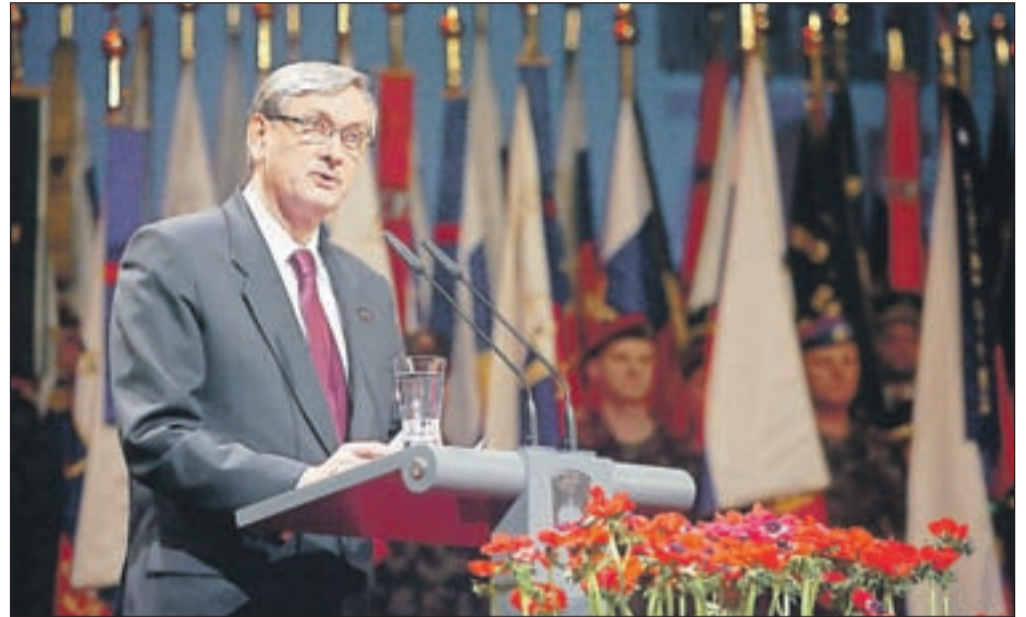
Slavnostni govornik ob 70-letnici ustanovitve Osvobodilne fronte slovenskega naroda, predsednik države Danilo Türk

Drugi prelom se je zgodil leta 1991, ko se je Slovenija razšla s takratno Jugoslavijo in se odločila za lastno samostojno državo. A tudi danes bi potrebovali prelom, in sicer prelom z zablodami naše tranzicije. Kot pravi predsednik Türk, moramo prelomiti z nebrzdano gra-