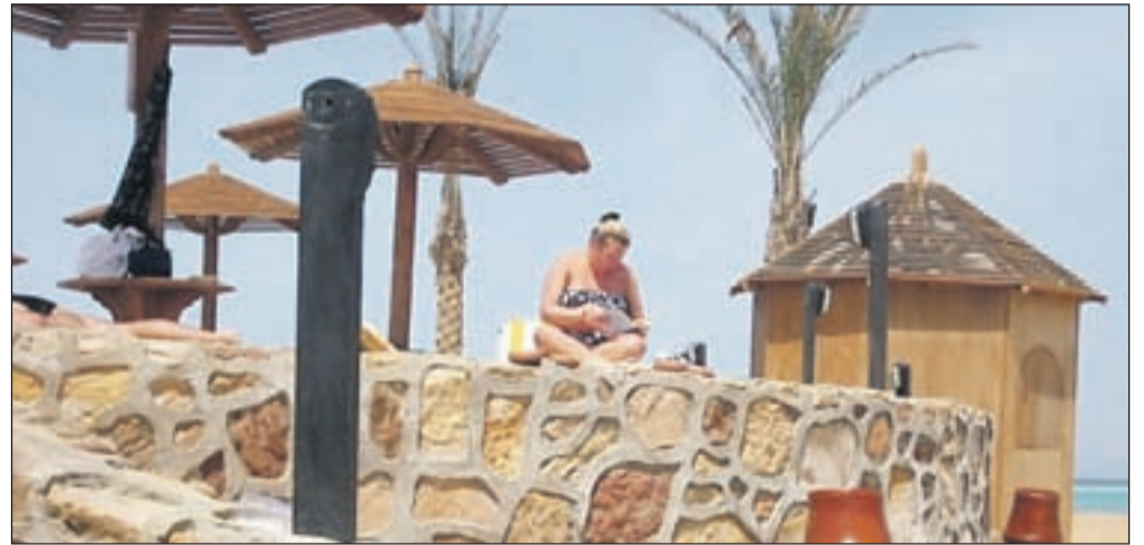
V Egipt se turisti vračajo počasi.

V kranjskem Travel Pointu opažajo, da so za prvomajske praznike prodali največ Turčije, sledijo pa Tunizija, Egipt in Tenerifi. Stranke so se odločile tudi za obisk turističnih destinacij, kot so Rim, Beograd, Barcelona, Azurna obala, Korzika, Sardinija, Toskana; pa tudi Hrvaške, kjer se je mladina zaradi organizirane zabave odločala predvsem za Rovinj. Podoben vzorec so opazili tudi pri Intelekti . Prevladuje obisk manj oddaljenih turističnih destinacij, obisk domačih toplec, obale, Hrvaške, izleti v evropske prestolnice. Kar se tiče cen, pa stranke ne želijo najnižje, ampak pametne cene. Pri Potuj nekam pa se je za prvomajske praznike dobila polovica njihovih strank odločila za počitnice v toplejših krajih, kot so Dominikanska republika, Maldivi, Kuba in Mehika ter Egipt, Turčija in Tunizija. Egipt je bil za čas prvomajskih praznikov rela-