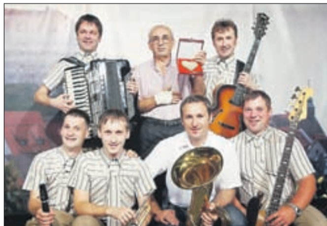
Lani je nagrado Škofje Loke za najboljši in najbolj všečen nastop v celoti osvojil kvintet Dori.