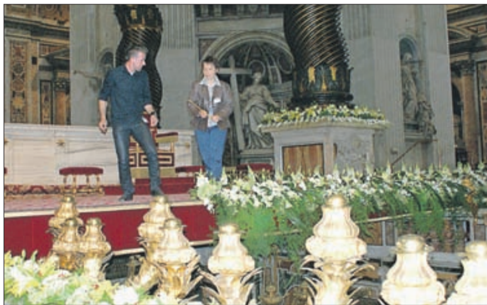
Pri cvetlični okrasitvi bazilike sv. Petra v Vatikanu sta tudi tokrat prevladovali bela in rumena barva, ki sta simbolni za velikonočni čas.

okoli dvajset, so uporabili spomladi cvetoče čebulnice, denimo tulipane, narcise, ter cvetoče rododendrone, azaleje in posamezna drevesa v loncih, na primer breze, mimoze, sofforo ... V dveh dneh so uporabili približno 25 tisoč lončnic in še enkrat toliko rezanega cvetja. Nizozemski cvetličarji trg krasijo že od leta 1985, ko jim je to nalogo zaupal pokojni papež Janez Pavel II.