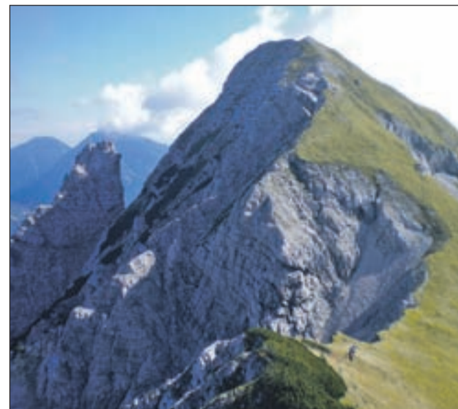
Pogled na Užnik, levi stolp pa je zloglasni Cjajnik.

V mesecu oktobru, svetovnem mesecu boja proti raku na dojkah,