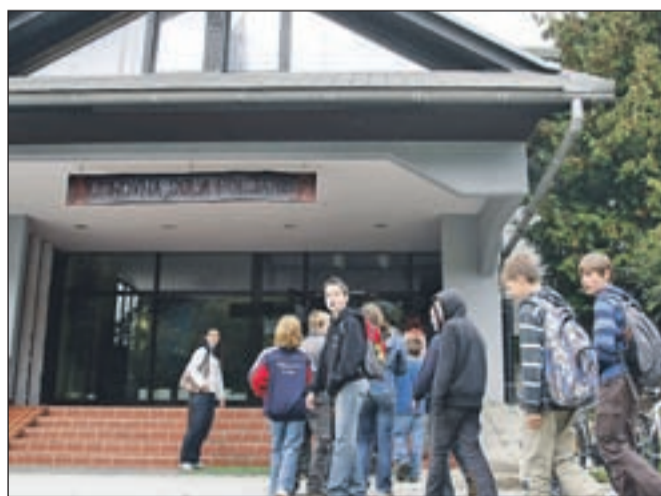
Po sredinem množičnem izostanku je včeraj pouk na OŠ Poljane že potekal normalno.

na, solate, majoneza, perutnina, kreme, mlečni proizvodi, sladoledi in slaščice. Kontaminirana živila imajo normalen videz, vonj in okus," so včeraj sporočili iz Zavoda za zdravstveno varstvo Kranj. Katera jed je bila okužena, uradno še niso sporočili, po nepreverjenih informacijah pa naj bi bil krivec za nastale težave krompirjeva solata s kumamicami. Po podatkih pristojnih služb so bile zastropitve poljanskih otrok in odraslih blage in so večinoma že izzvenele, polovica obolelih pa je poiskala pomoč in nasvet pri zdravniku. V zadnjih petih letih na gorenjskih šolah niso obravnavali izbruhov stafilokokne zastropitve.