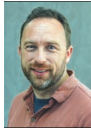
Jimmy Wales, ustanovitelj Wikipedije

"Je bil v Butalah župan in je imel pastirja in je gnal pastir županove ovce na pašo. Devetnajst jih je gnal na pašo, osemnajst jih je prignal zopet domov. Ga vpraša župan: 'Ena manjka, kam si jo dal?' Odgovori pastir: 'Saj so vse.' Jih župan prešteje še en pot: 'Osemnajst jih je!' Pastir: 'Nak, devetnajst!' Reče župan: 'Ali si tako zabit, da ne ločiš števila, ali si tako trmast! Daj, stopi po občinske može, naj pridejo. Šestnajst jih je in še policaja pokliči, jih bo sedemnajst; midva sva dva, nas bo vseh skupaj devetnajst. Pa bomo zgrabili vsak svojo žival in če bo vsakemu svoja v rokah in ne bo nobeden brez ovce, jih je devetnajst, drugače jih ni.' Tako se je zgodilo. Prišli so občinski može, šestnajst jih je bilo, in prišel je tudi policaj in jih je bilo z županom in pastirjem vseh skupaj devetnajst. Pa je dal župan znamenje: 'Zdajle!' in je vsak hitel in zgrabil najbližjo ovco in so bili može zanesljivi in pošteni, nikdo ni zgrabil dveh. Pa se je pokazalo. Vsak je imel v rokah eno ovco, le policaj je ostal brez nje. 'No, ali vidiš, trma trmasta,' pravi župan pastirju, 'policaj je brez ovce, osemnajst jih je!' Pa se je zakregal pastir: 'Kaj me briga policaj! Devetnajst jih je! Policaj je šema, zakaj ni zgrabil ovce prej in v pravem času, dokler jih je še kaj bilo!'"