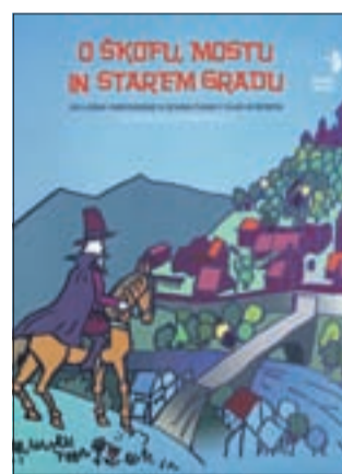
Tri loške zgodbe za vse generacije