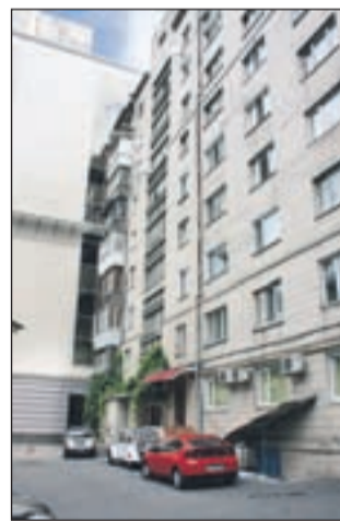
Blok je bil od zunaj videti bolje, kot v notranjosti. No, v spodnjem nadstropju, kjer so vidne tri klimatske naprave, je bila neka zdravstvena ordinacija.

Kar peš smo se odpravili po ulici kakšna dva semaforja naprej pogledat, kje je stanovanje. Stolpnica iz osemdesetih let je bila na zunaj videti kar v redu, znotraj pa "bog pomagaj". V dvigalu je zaudarjalo, kot bi nekdo v njem gojil kokoši. Vhodna vrata v blok so se odpirala na šifro. Veseli, da zadaj lahko parkiramo oba avtomobila, smo pohiteli v šesto nadstropje in bili lačni, utrujeni in primerni za pralni stroj, več kot zadovoljni s stanovanjem. Prvi se zagrebem za