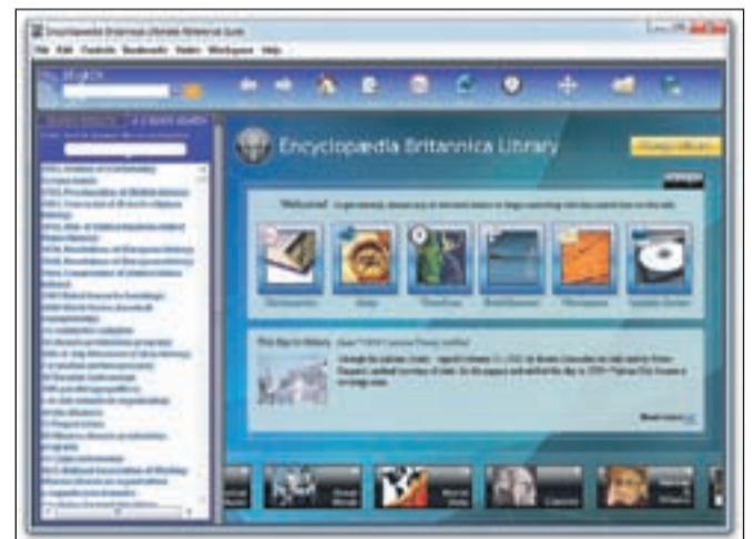
Spletna Encyclopaedia Britannica