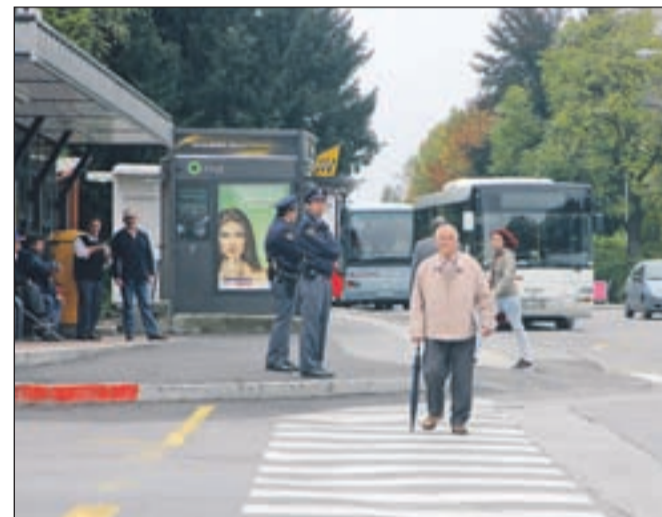
Gorenjski policisti do 22. oktobra izvajajo nadzore nad pravilnim ravnanjem pešcev v prometu, pa tudi nad upoštevanjem pešcev s strani voznikov.

Na varnost pešcev v prometu so gorenjski policisti te dni še posebej pozorni. Od 1. do 22. oktobra namreč poostreno nadzirajo pešce in tudi obveznosti voznikov do njih. Nadzirajo predvsem pravilno hojo pešcev in prečkanje vozišča ter tudi, kako so označeni ob zmanjšati vidljivosti oziroma ali uporabljajo odsevna telesa za boljšo vidnost. Policisti hkrati nadzirajo tudi voznike, ali ustavljajo pred prehodi za pešce in