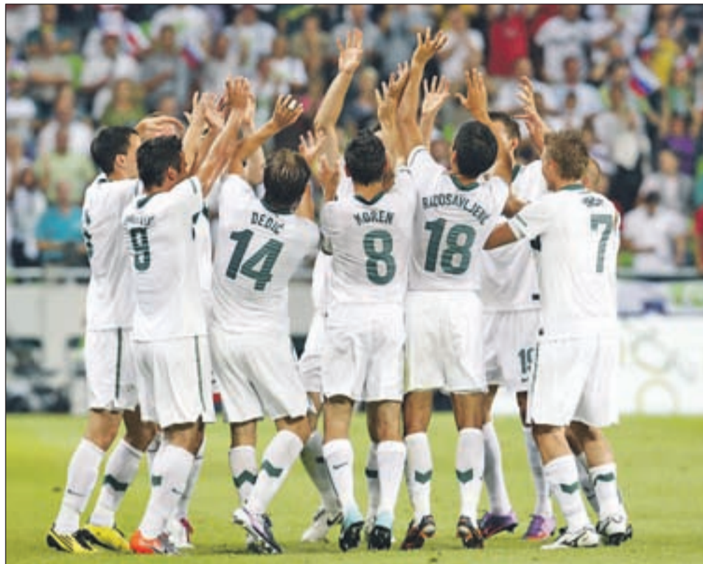
Na prvi prijateljski tekmi v Stožicah so naši nogometaši premagali reprezentanco Avstralije, danes zvečer pa bo šlo zares, saj jih čaka kvalifikacijska tekma za EURO 2012 z reprezentanco Ferskih otokov.