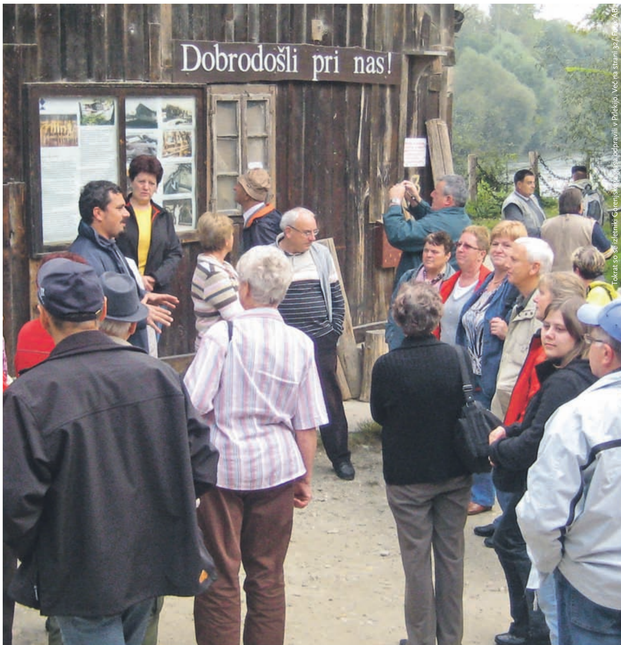
Tokrat so se izletniki Gorenjskega glasa odpravili v Prlekijo. Več na strani 32