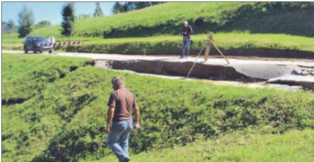
V kamniški občini so zemeljski plazovi v nedavni vodni ujmi povzročili za več kot dva milijona in pol evrov škode.

Čeprav je bilo od poplav leta 2007 pa do danes v različne investicije na področju poplavne varnosti vloženi približno milijon evrov in pol in jo je občina Kamnik tudi zaradi tega v zadnjih poplavih relativno dobro odnesla, je škoda še vedno velika - po grobih ocenah prek 2,8 milijona evrov, kar je bistveno več kot pred tremi leti. Veliko škode je na cestni infrastrukturi, osem lokalnih cest ima še vedno popolno zaporo. Sprožilo se je 45 zemeljskih plazov, od tega deset večjih, in prav ti še vedno predstavljajo veliko grožnjo za šest objektov, ki jih morajo pristojne službe reševati prednostno. Zgolj plazovi so po prvih ocenah povzročili za 2,6 milijona evrov škode. "Gre za ze-