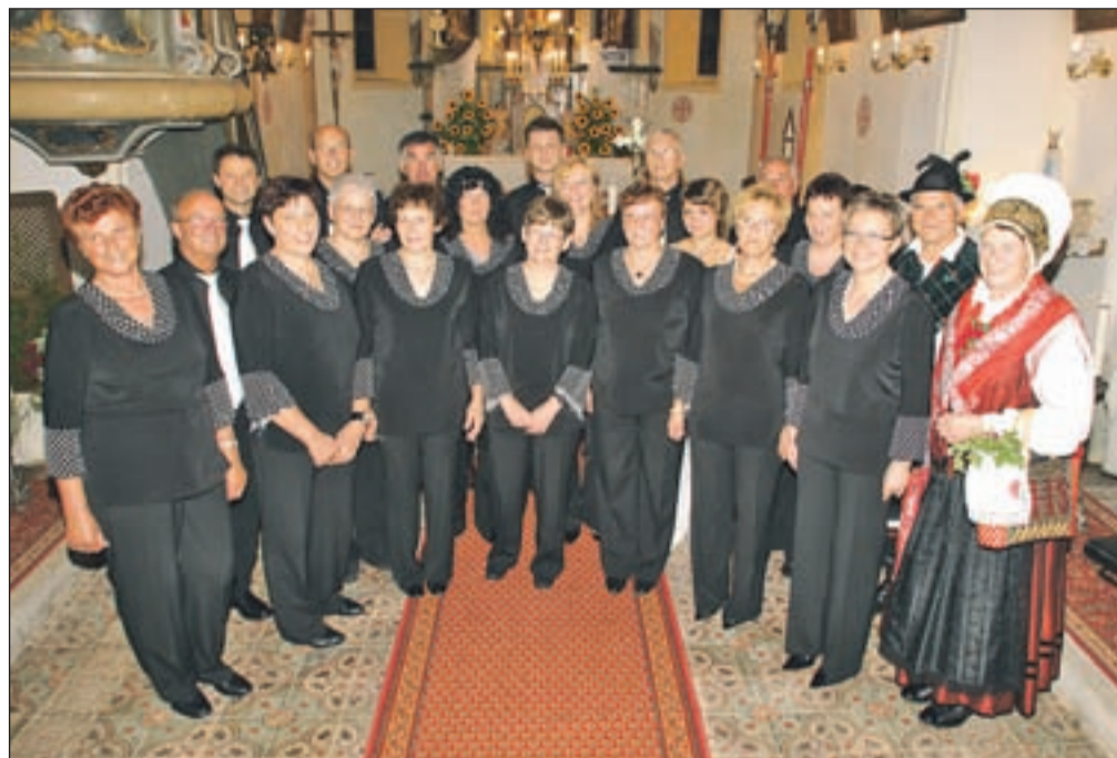
Korenine Šenčurskega zvona, vrsto let znanega pod imenom Sv. Jurij, segajo na kor šenčurske cerkve.