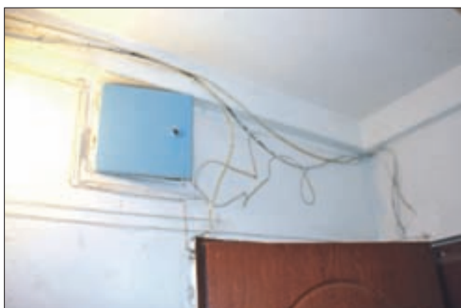
"Inovativna" električna napeljava na hodniku