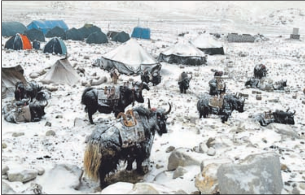
Tako imenovana "avtobaza" na 5200 metrih pod Everestom nekje na kitajski strani. Fotografija je nastala leta 1996, ob prvem poskusu Dava Karničarja, da bi smučal z vrha najvišje gore sveta.

Velik del bogatega opusa fotografij, ki jih je alpinist in fotograf Stane Klemenc posnel na odpravah po svetovnih gorstvih in na polarnih odpravah, je avtor pred časom podaril Gorenjskemu muzeju, kjer so jih uvrstili v zbirko Kabineta slovenske fotografije , ki v okviru muzeja deluje že štirideset let. "Fotografije sem podaril iz dveh razlogov. Zbirka je preprosto prevelika, da bi jo hranil doma, hkrati pa je pri meni tudi ne more videti toliko ljudi, kot je to mogoče v muzeju. Zdi se mi prav, da so fotografije lahko na ta način občasno na razpolago ljudem, ki jih zanima tovrstna tematika," je povedal Stane Klemenc in dodal, da se je za Gorenjski muzej odločil predvsem zato, ker v njem deluje Kabinet slovenske fotografije, ker je večkrat tvorno pri različnih razstavah sodeloval s sodelavci muzeja, ker je tematika, ki jo po večini obravnava na svojih fotografijah, povezana z gorami, te pa tudi z Gorenjsko in konec koncev je na Gorenjsko, kjer tudi živi, zelo navezan. "Muzej ima tudi primerne prostore za hrambo fotografij, zanje