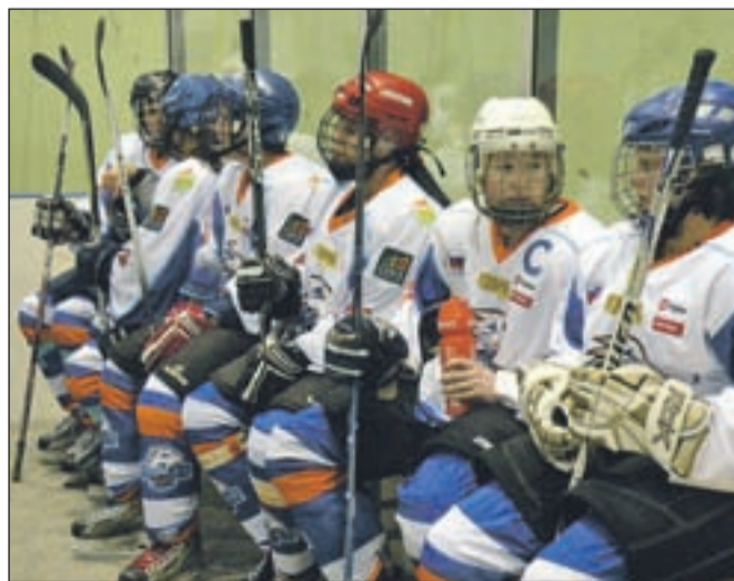
Hokejistke Triglava so jubilejno sezono začele z zmago nad Celjankami in zgodovinskim uspehom nad ekipo Term Maribor.