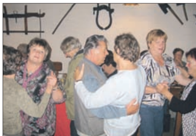
... in najbolj pogumni so se zavrteli.