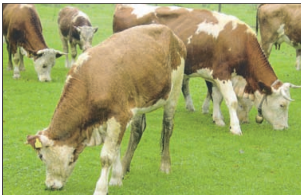
Prvi začasni podatki letošnjega popisa kažejo, da je vse več kmetij brez živine, hkrati pa se krepi delež (za naše razmere) velikih kmetij, ki redijo več kot dvajset glav velike živine.

Kmetijska gospodarstva upravljajo 888.664 hektarjev vseh zemljišč, od tega 56 odstotkov kmetijskih, 42 odstotkov gozda in dva odstotka nerodovitnih zemljišč. Od 499.260 hektarjev kmetijskih zemljišč jih dejansko obdelujejo 466.941 hektarjev, razliko pa predstavljajo neobdelana zemljišča oz. zemljišča v zaraščanju. Raba kmetijskih zemljišč se glede osnovne sestave v zadnjih desetih letih ni bistveno spremenila (57 odstotkov zemljišč predstavljajo trajni travniki in pašniki, 37 odstotkov njive, drevesnice, trsnice in matičnjaki, šest odstotkov pa trajni nasadi), premiki pa so bili pri velikostnih razredih. Kmetij-