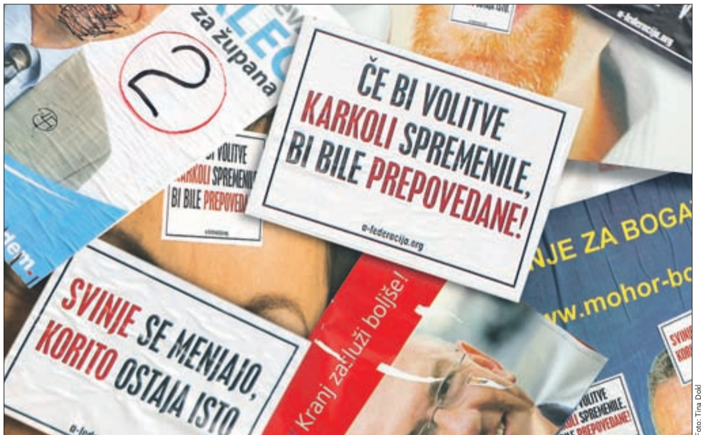
V Kranju so se na volilnih plakatih pojavile nalepke z zgovornimi gesli (na sliki), pod katere se je podpisala Federacija za anarhistično organiziranje. Na kranjski policiji do včeraj uradne prijave zaradi poškodovanja volilnih plakatov niso prejeli, pojasnili pa so, da vse morebitne prijave posredujejo pristojnemu Inšpektoratu RS za notranje zadeve.

ni molk. Župane volimo po večinskem sistemu, obkrožimo torej številko pred imenom izbranega kandidata. Občinske svete pa v večini občin volimo po proporcionalnem sistemu in obkrožimo številko pred imenom liste kandidatov za občinski svet. Ker po tem načelu velja, da v občinski svet pridejo kandidati, ki so napisani pri vrhu svojih list, volivci pa si morda želijo, da je izvoljen tudi kdo z nižjih mest liste, imamo možnost podeliti preferenčni glas. V tem primeru na črto ob listi napišemo številko kandidata, ki mu želimo dati preferenčni glas.