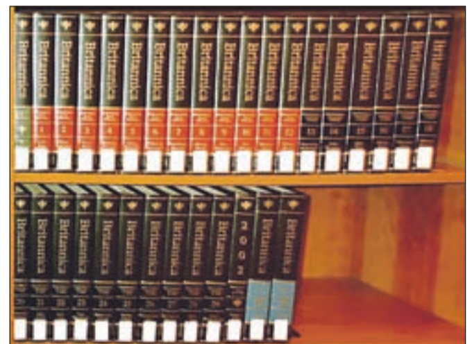
Klasična Encyclopaedia Britannica, aktualna 15. izdaja v 32 zvezkih, 1985-2002