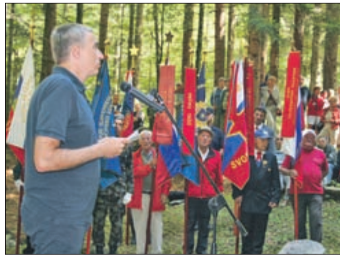
Slavnostni govornik ob spomeniku pod Storžičem je bil minister Aleš Zalar.

V gozdu nad planinskim domom stoji spomenik na