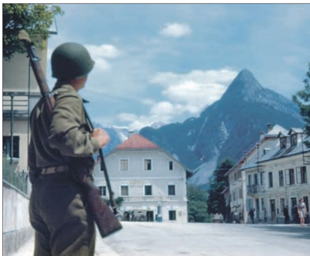
Bovec maja 1945