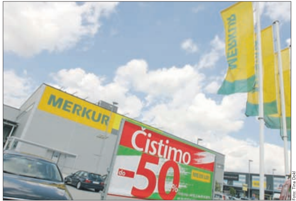
V petek bodo bankam upnicam predstavili prve načrte, kako sanirati nakelski Merkur.