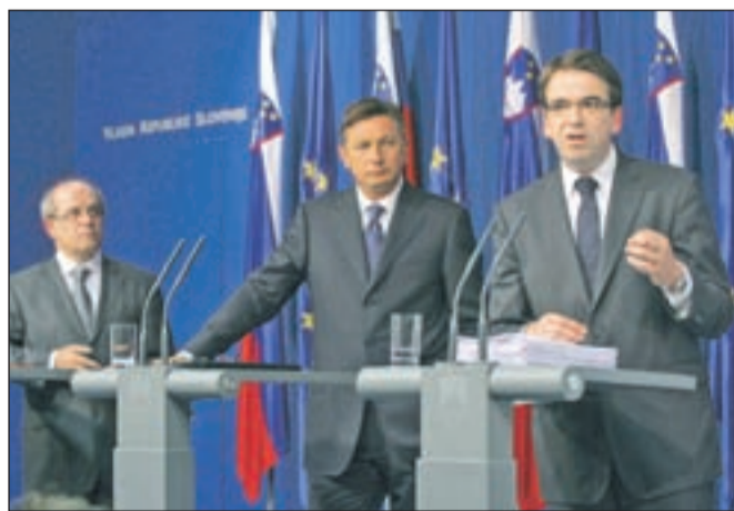
Minister Ivan Svetlik, premier Borut Pahor in Peter Pogačar z ministrstva za delo (od leve) so predstavili predlog pokojninske reforme.

pokojninskega sistema, so poudarili, da je marsikateri predlog iz socialnega dialoga