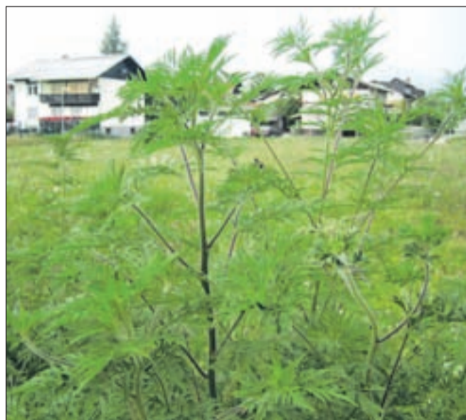
Pelinolistna ambrozija se je pojavila že tudi na Gorenjskem. Posnetek je s Primskovega.

"Ambrozija na gorenjskih njivah še ne predstavlja večjega problema, problem pa bo nastal, če jo ob poteh, cestah, železnici, raznih odla-