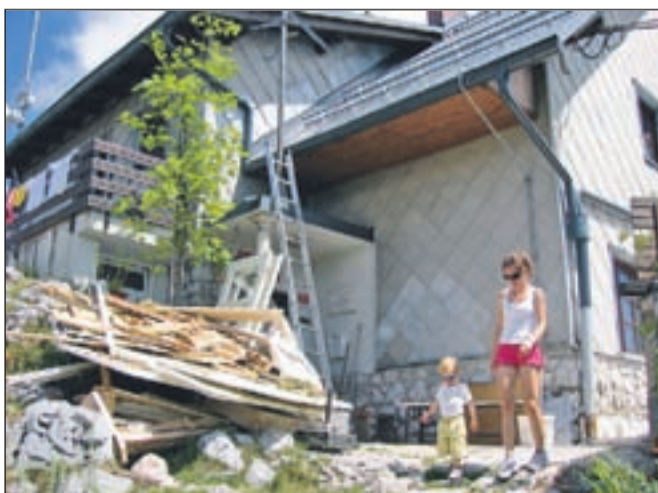
Obisk Lubnika se zaradi obnove ni zmanjšal, nasprotno, v koči ocenjujejo, da je celo za tretjino večji kot običajno v poletnih mesecih.