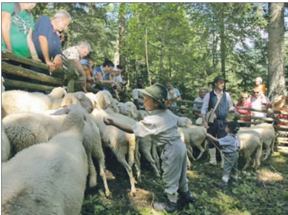
Ovčarskega bala ni brez ovac, pastirjev in radovednih obiskovalcev.