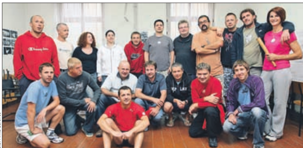
Ekipe tekačev in tekačev ter spremljevalcev na zadnjem sestanku pred četrtkovim tekom