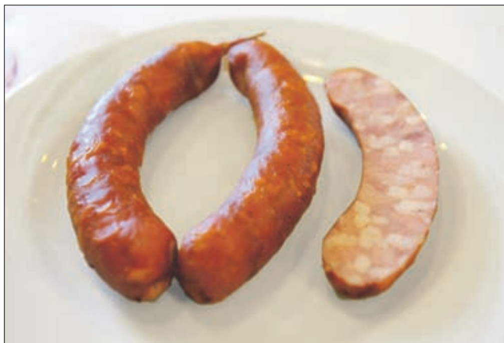
Kranjska klobasa iz ene od gorenjskih mesarij

V kuharskih knjigah in priložnikih, zlasti še od konca 1. svetovne vojne in po 2. vojni, najdemo vrsto odstopanj od izvirnega recepta. To se stopnjuje tudi v spremenjanju naziva, ki se z uvajanjem novih tehnologij izdelave (dodajanje mesnega testa ali celo dodajanje govedine!) odraža zlasti še v današnji ponudbi nekaterih velikih proizvajalcev. Vsa ta prizadevanja so seveda sistema-