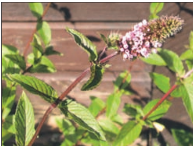
Poprova meta je v pomoč pri potovalni bolezni.

Pri pripravi čaja iz poprove mete se navadno odločimo za poparek: dve do tri žličke svežih ali posušenih listov poparimo s skodelico vrele vode in pokrito pustimo pet do deset minut, nato čaj precedimo. Pijemo tri do štiri skodelice sveže pripravljene čaja na dan med obroki. S tem čajem bomo pomirili žolčne napade, pregnali vetrove, sprostiti krče in spodbudili prebavo. Dobro nam