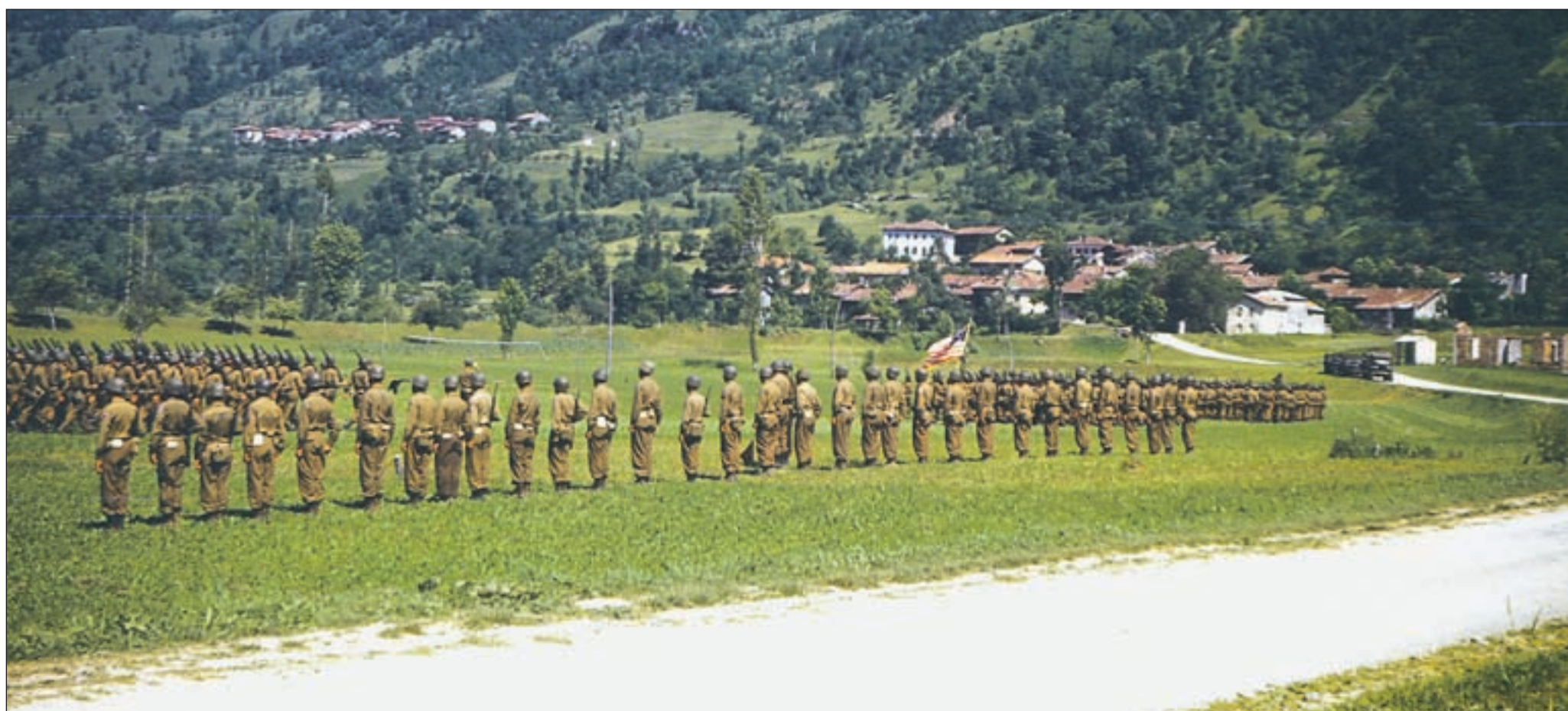
Vojaki 87. polka ameriške 10. gorske divizije pri Robiču, junija 1945