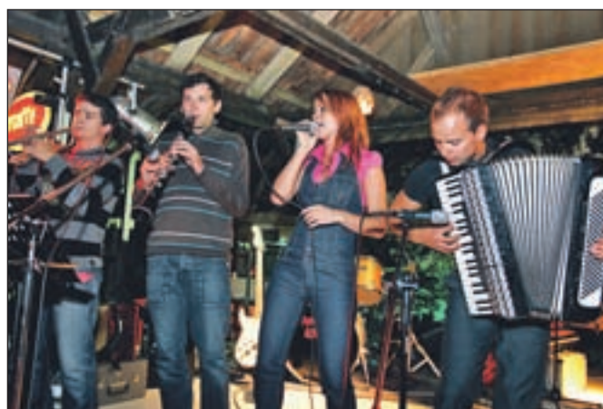
Disco kreiners