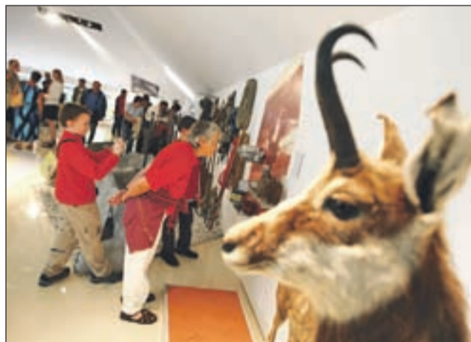
Vsebinski del projekta je pripravljalo več kot sto sodelujočih iz 20 javnih zavodov in društev. Na stalni razstavi je od 2100 zbranih predstavljenih več kot 450 eksponatov.

"Osnovni cilj muzeja bo tudi v prihodnje zbirati gradivo in opažati dogodke ter jih primerno umeščati v zgodovino. Drugi cilj pa je vzgojni za mlade rodove, pri čemer je muzej treba dopolniti z dogajanjem v neposredni okolici," je še dejal Eržen in poudaril, da so se tu-