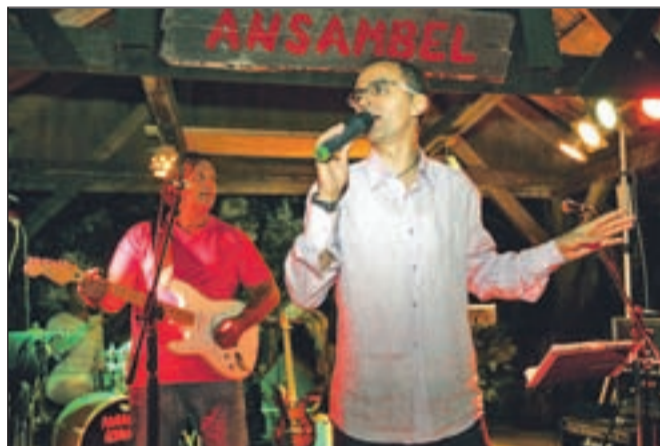
Petkov narodnozabavni žur je odpadel, so pa s sobotnim nastopom Mambo Kingsi zadovoljili glasbeni okus obiskovalcev.