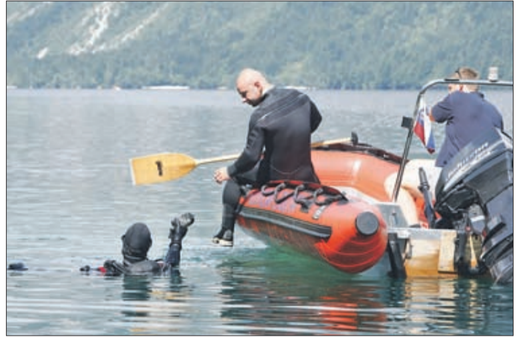
Jezero je pregledalo osem potapljačev državne enote za varstvo pred neeksploziranimi ubojnimi sredstvi.

Znano je, da je mimo Bohinjskega jezera nekdanja potekala železniška proga. Med prvo svetovno vojno, ko je Bohinj predstavljal zaledje soške fronte, so tudi po tej progi oskrbovali vojsko na bojišču. Proti koncu vojne je v bližini sedanjega počitniškega doma MNZ nesrečno iztiril transportni vlak in v jezeru je tedaj ostal tudi voz, poln granat in minometnih min. "Ta vlak je še vedno v jezeru. Ko so konec 90. let raz-