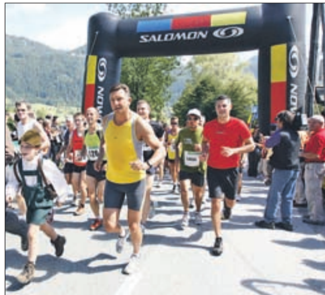
Predsednik vlade Borut Pahor na startu teka po obrobjih dolin Vrata, Krma in Kot