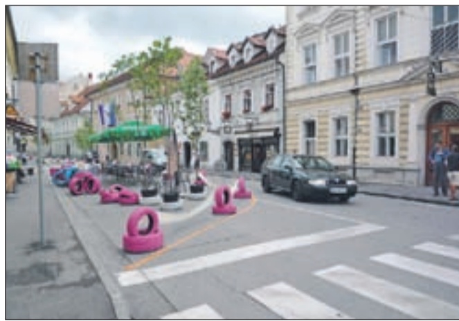
Površine, ki so po novem namenjene pešcem, so mladi arhitekti opremili z domiselno ulično opremo.

A na festival letos ne spominjajo le glasbeni ritmi in dogajanje okoli številnih odrov, ampak tudi nova prometna ureditev v središču mesta, s katero kamniški arhitekti želijo odvzeti nekaj prostora prometu in ga nameniti pešcem. Ulično opremo so v okviru mednarodne delavnice cel teden oblikovali člani skupine mladih kamniških arhitektov Štajn, zamisel o enosmernem prometu sko-