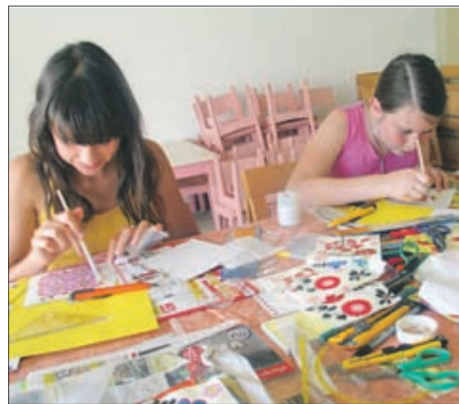
Eko-ustvarjalnice: izdelovanje okvirjev

V času poletnih počitnic smo za otroke in mlade pripravili dva projekta aktivnega preživljanja prostega časa, ki temeljita na varstvu okolja in spodbujanju okoljske odgovornosti. Eko-Ustvarjalnice so sklop kreativnih delavnic, namenjen mladim med 11. in 25. letom. Vse do konca septembra bomo v Knjižnici A. T. Linharta iz naravnih materialov in odpadne embalaže izdelovali različne uporabne predmete. Za malo mlajše smo pod imenom Eko-Poletnice pripravili cikel poletnih delavnic. Znotraj šestih srečanj se bodo otroci skozi delavnice, ki bodo udeležence spodbujale h kreativnosti in domišljiji, veliko naučili o naravi in ekologiji ter odgovornosti do okolja. Skupaj bomo risali, rezali in lepili, barvali in packali; ustvarili svoj prvi cvetlični lonček, v katerega bomo posejali čisto prave rastline, si izdelali denarnico, poslikali skodelice in prečudovite nakupovalne torbe, se polepšali z zapescnicami in domov odnesli knjigo eko-nasvetov, ki smo jo oblikovali in napisali prav sami. Otroci bodo spoznali tudi svet čebel, obiskali Čebelarški muzej in se srečali s čebelarjem. Da bo program bolj zabaven, smo vključili razne animacijske programe, tekmovanja v znanju in spretnostih ter delavnico žongliranja. Za več informacij o aktivnostih društva lahko obiščete našo spletno stran ali pišete na društvo.erudit@gmail.com in pokličete na 040/753 696 (Katarina Kožel).