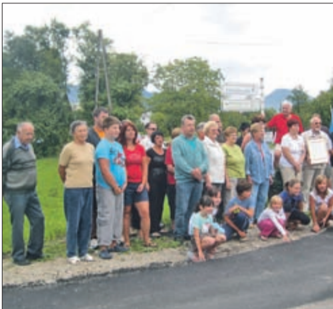
Na podelitvi priznanja najlepše urejene ulice se je zbralo veliko stanovalcev.