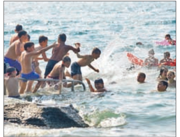
Marsikateri otrok zaradi socialne stiske družine poletnih počitnic ne bi preživel na morju, če jim tega ne bi omogočile humanitarne organizacije.

Z Rdečim križem Slovenije bo brezplačno šlo na Debeli Rtič 147 gorenjskih otrok, območna združenja pa v sklopu razpisa Zavoda za zdravstveno zavarovanje Slovenije in drugih razpisov ter s svojimi sredstvi organi-