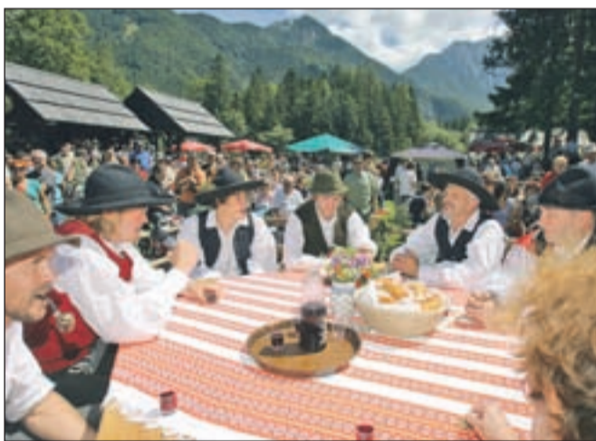
Pastirji in gospodar med pogovorom