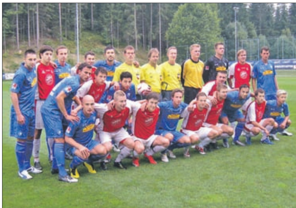
Nogometaši NK Kranj (v rdečih dresih) so na prijateljski tekmi igrali z nemškim Bochumom.