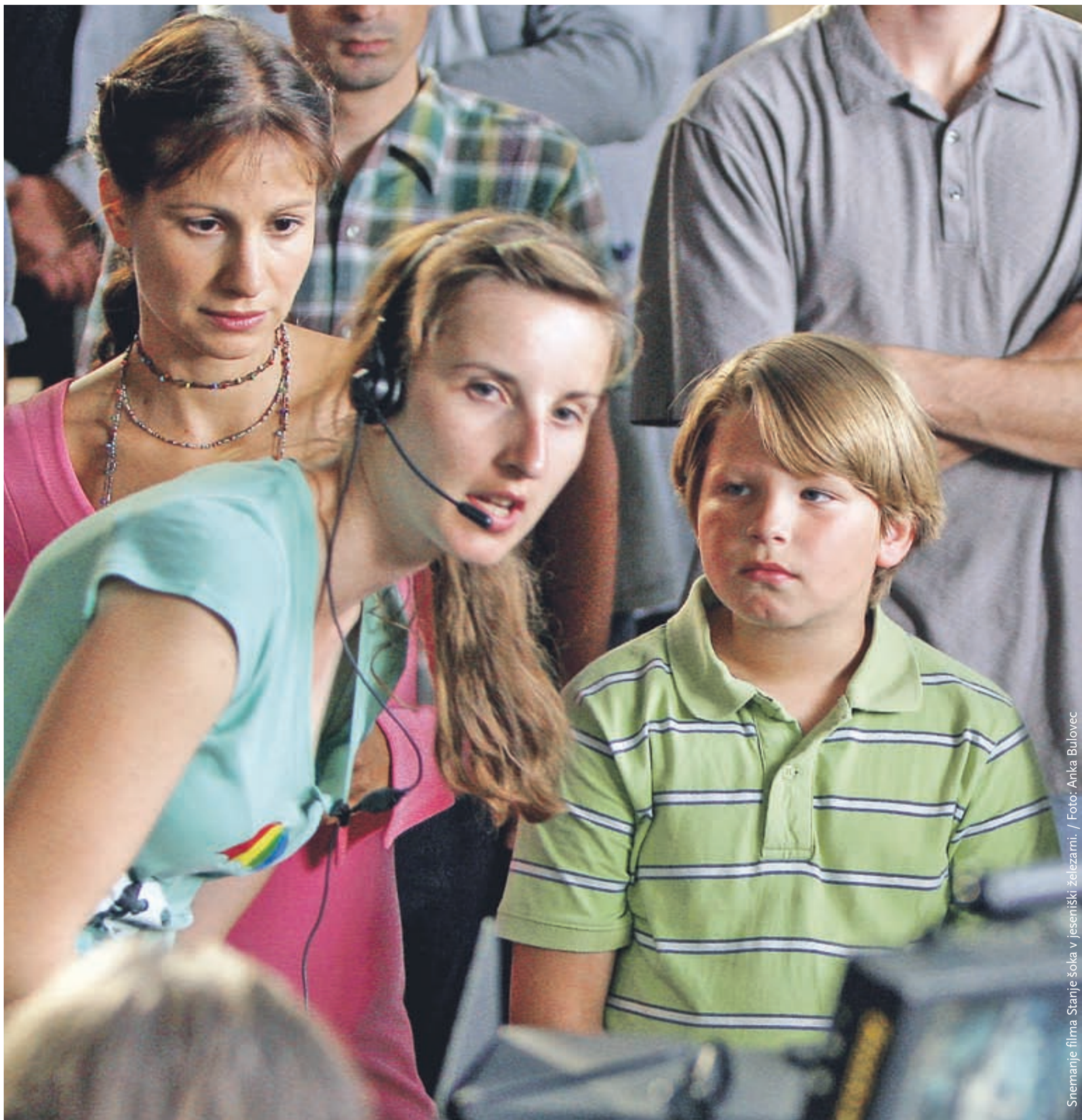
Snemanje filma Stanje šoka v jeseniški železarni.