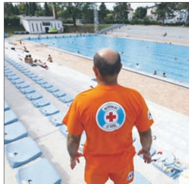
Policisti so tudi letos preverjali varnost na gorenjskih kopališčih.

Upoštevanje opozoril je še posebej pomembno za otroke. Starši naj med kopanjem otrok ne puščajo brez nadzora, pripetijo se jim lahko tudi drugačne neprijetnosti, kot so padci, zvin ali zlomi okončin, odrgrnine in podobno. Zato priporočajo stalen nadzor; če svojega otroka ne