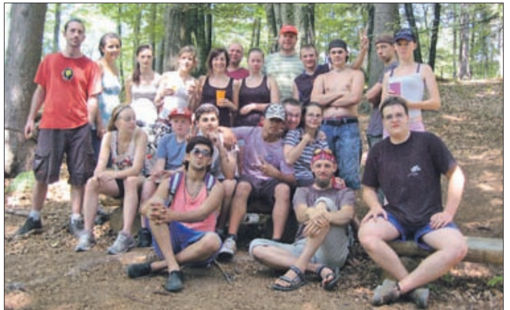
Udeleženci mednarodne mladinske izmenjave so večino časa preživali v naravi.