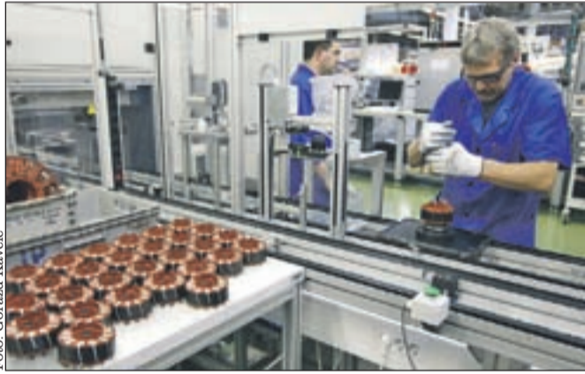
Bodo moški v prihodnje delali do 65 let in ženske do 63 let?

tem, da mora štirideset let delovne dobe za moške in 38 let za ženske zadostovati za polno pokojnino brez odbitkov. Kar zadeva obračunsko obdobje za odmero pokojnine, vlada predlaga podaljšanje s sedanjih 18 na 34 let, sindikati pa podaljšanje z 18 na 24 najugodnejših let. Socialni partnerji bodo pogajanja o pokojninski reformi nadaljevali jutri, v sredo. Na petkovi seji ekonomsko socialnega sveta so obravnavali tudi problematiko slavnatih podjetij in poklicnih pokojnin, pri tem pa je minister za delo, družino in socialne zadeve Ivan Svetlik napovedal, da bodo problematiko slavnatih podjetij uredili z dopolnitvijo predlaganih sprememb zakona o delovnih razmerjih.