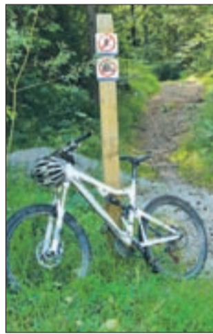
Kjer se ne sme, se tudi s Tomacem ne sme.

znana znamka, vendar v svetu spada med prestižne, ker nosi ime kolesarskega "Franza Klammerja", gorskokolesarske legende, ki se je po končani tekmovalni karieri odločil izdelovati kolesa pod lastnim imenom. Menda mu gre dobro. Njegovo kolo si želijo imeti poznavalci in tudi tisti, ki nekaj dajo na prestiž. Sodelavec je določil, da spadam med tiste druge, čeprav dobro ve, kolikš-