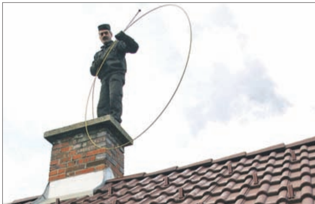
Ne dimnikarji ne civilna pobuda Dimnik z novimi cenami niso zadovoljni.

Do sedaj veljavni Sklep o ceniku dimnikarskih storitev ni natančno določal, kdaj se smejo uporabniku obračunati tudi stroški prevoza. "Nekateri koncesionarji so izkoristili to nedorečenost ter uporabnikom obračunavali nesorazmerno visoke stroške prevoza, v najbolj skrajnih primerih je to rezultiralo celo tako, da so bili stroški prevoza celo višji od stroškov same storitve," so v obrazložitve določitev cen zapisali na ministrstvu za okolje in prostor. V novem ceniku je opredeljeno, v katerih primerih se zaračunajo stroški prevoza in v kakšni višini, črtane pa so storitve, ki se ne izvajajo. Po drugi strani so navedene nove storitve, odpravljen je tudi določilo, da se cene