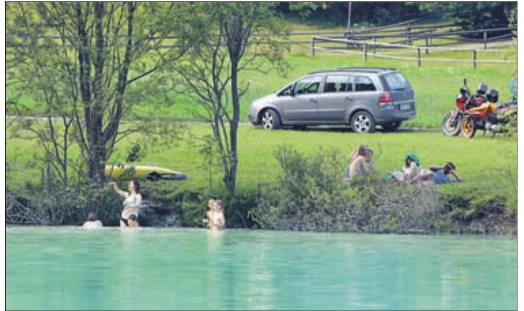
Ob jezeru Kreda nekateri brezobzirni kopalci parkirajo, kurijo, puščajo smeti, zato inšpektorji, nadzorniki TNP in policisti napovedujejo skupne nadzore.