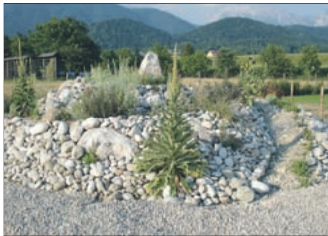
Spiralna greda iz peska in kamenja