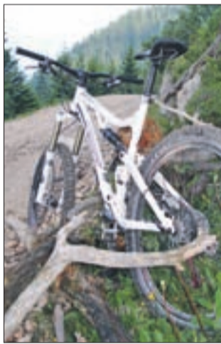
Tihožitje mojega užitka v Tihi dolini

znana znamka, vendar v svetu spada med prestižne, ker nosi ime kolesarskega "Franza Klammerja", gorskokolesarske legende, ki se je po končani tekmovalni karieri odločil izdelovati kolesa pod lastnim imenom. Menda mu gre dobro. Njegovo kolo si želijo imeti poznavalci in tudi tisti, ki nekaj dajo na prestiž. Sodelavec je določil, da spadam med tiste druge, čeprav dobro ve, kolikš-