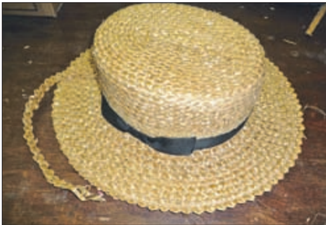
Domžalski slannik - znan je bil po svoji značilni obliki, sešit pa iz cikcakastih slamnatih kit.