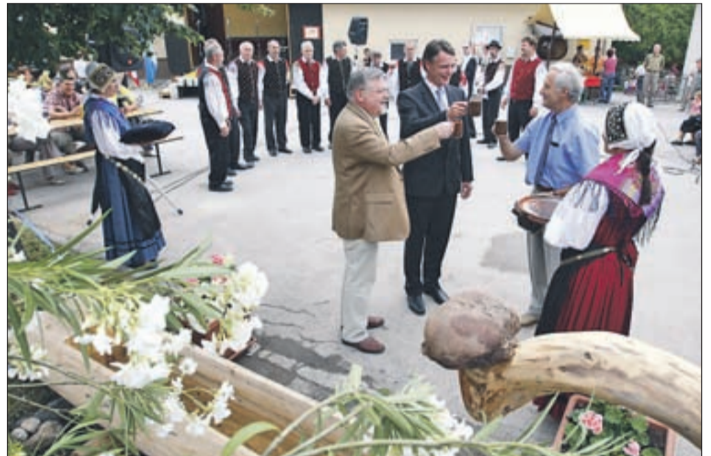
V nedeljo so se na Bohinjski Beli veselili dokončanja gradnje kanalizacijskega omrežja in obnove vodovoda.

Stojan , ki mu je župan ob tej priložnosti podelil posebno priznanje občine, je poudaril, da jim obnova vodovoda v prihodnje zagotavlja nemoteno preskrbo s pitno vodo, saj so imeli zlasti v času poletne suše včasih precej težav. Oktobra naj bi po njegovih besedah začeli na kanalizacijsko omrežje priključevati prve objekte. V dveh letih naj bi tako priključitev na kanalizacijski sistem zagotovili 393 prebivalcem, vodo iz kakovostnejšega in varnejšega vodovodnega sistema pa bo uporabljalo 562 prebivalcev.