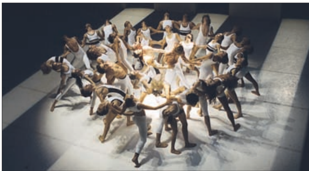
Predstava skupine Béjart Ballet temelji na glasbi skupine Queen in W. A. Mozarta, kostumi pa so delo Gianniija Versaceja.