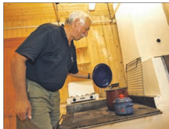
Spretno se suče za štedilnikom pastirske kočice, skuhati zna tudi ajdove žgance.