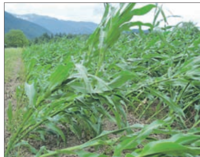
Takole je veter upognil koruzo na polju med Zgornjo Belo in Bašljem.

Kranj - Poletni čas je tudi čas neviht in visokih temperatur. To dvojje smo občutili minuli konec tedna tudi na Gorenjskem. V soboto je bilo čez dan zelo vroče, v noči na nedeljo pa je na nekaterih območjih pihal močan veter, ki je očitno povzročil tudi nekaj škode v kmetijstvu. Ponekod je tako nagnil koruzo za siliranje, da se bo le stežka še postavila pokonci in bo verjetno nekaj težav pri jesenskem spravilu. Kolikšna je dejanska škoda, je za zdaj še težko oceniti.