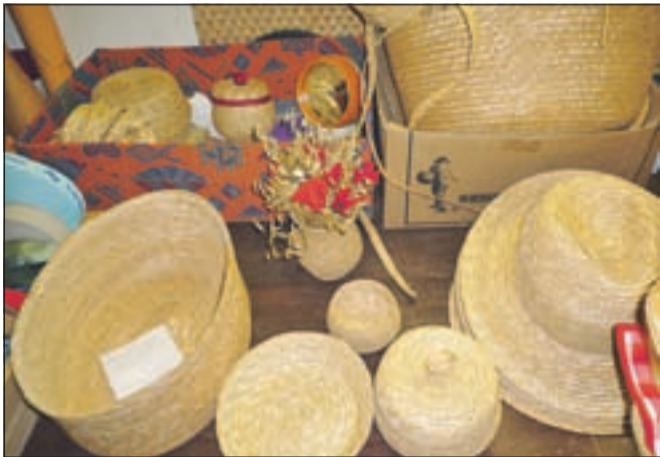
Različni slamnati izdelki