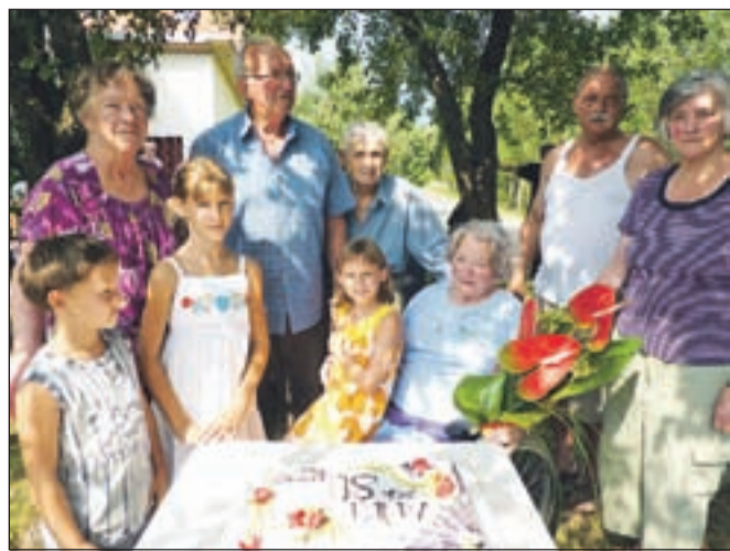
Sorodniki in sosede so Aniki ob jubileju pripravili veselo praznovanje in jo presenetili tudi s torto.