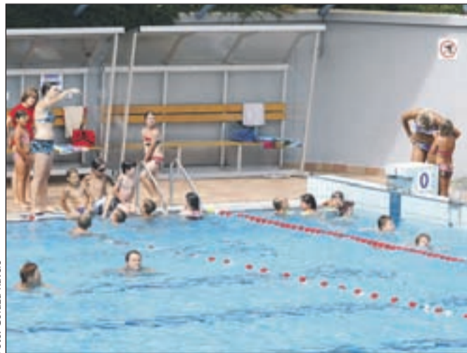
Ob letošnji vročini so gorenjska kopališča dobro obiskana.

Tudi na kopališču v Kamniku so zadovoljni z obiskom, cena dnevne vstopnice pa je med tednom za odrasle 3,50 evra, za otroke pa dva evra. Dražje je konec tedna, ko morajo odrasli odšteti 4,50 evra. Na kopališču Ukovala na Jesenicah je za dnevno vstopnico za odrasle treba odšteti štiri evre, za popoldansko pa tri evre. Otroci za dnevno vstopnico plačajo 2,5 evra, ceneje pa je tudi za skupine. Prav tako je te dni živahno na letnem kopališču v Kropi. Cena vstopnice za odrasle je pet evrov, za otroke do sedmega leta je dva evra, za otroke do 14 leta tri evre, za študente in dijake pa štiri evre.