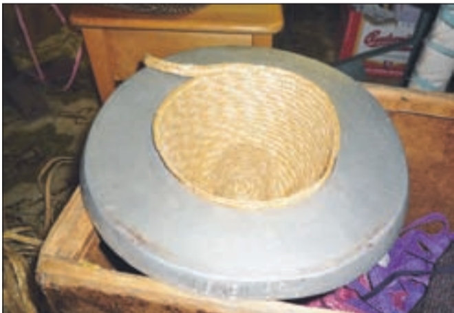
Pri oblikovanju slannikov so si pomagali z različnimi modeli, ki so omogočali, da se je pokrivalo lepo prilagalo glavi.