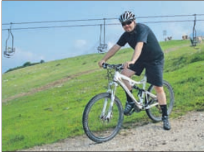
Jaz in John Tomac na Krvavcu

kondicijo. Srce je poskušalo izstopiti iz ležajev, vendar ga je trma potiskala nazaj. Sledil je spust od hotela navzdol. Jaz, neizkušen kolesar na vrhunskem ameriškem izdelku, ki nosi ime po legendi gorskega kolesarstva Johnu Tomacu. Sem mislil, da je ta šport bolj nevaren. V dolino sem se peljal kot gospod. Res, bili so momenti, ko sem samo po naključju ostal na sedežu, a so me poznavalci kasneje opomnili, da bi se s slabšim kolesom v takih primerih ubil. No, no ... sem si mislil, ko sem že skoraj pomislil, da sem tako spreten na kolesu. Tako pa ne bi rad končal. Varnost ponuja diskaste zavore, sem ugotavljal. Udobnost pa vzmeti spredaj in zadaj, mehak sedež, široko krmilo in široke gume. Počutil sem se odlično. Pravzaprav je iz mene namesto znoja šprical adrenalina. Nisem pričakoval, da bom tako užival v kolesarjenju. Dokaz za to je dvakrat z gondolo na Krvavec in dva super spusta ter naslednji dan obisk Tamarja in Kranjske Gore. Tam je drugi kolesarski raj. Kakšne gozdne poti! Kakšen užitek jih je prekolosariti! Ne znam opisati, ker pisun nisem, jaz sem tisti, ki vam Gorenjski glas oblikujem, tako da ga lažje in z užitkom berete. Tehnik torej. In ker sem tehnik, me je zanimala tudi kvaliteta Tomaca. Sodelavec pravi, da spada med vrhunska kolesa, in ko mi je povedal ceno, sem ga imel ves vikend v stanovanju in ne v kleti ali garaži. To je dragulj, madonca! Vendar je vreden vsakega evra. John Tomac je pri nas še ne