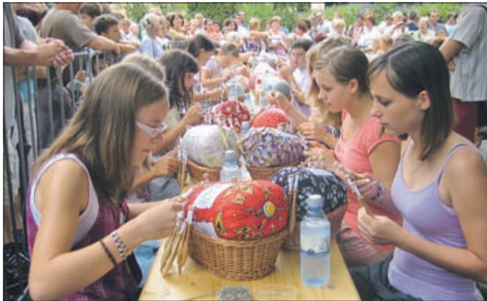
Mlade klekljarice, ki obiskujejo čipkarsko šolo, so zagotovilo, da ena od tradicij Železnikov ne bo odšla v pozabo.

Namen čipkarskih dni je ohranjanje klekljarske tradicije v Železnikih, kjer so potem, ko so ugasnili plavži, predvsem s to obrtjo ohranjali življenje pod Ratitovcem. "Danes živimo v hitrem tempu, ko se mladi sicer naučijo klekljanja, potem pa klekne za vrsto let odložijo. Z upokojitvijo je nekaj več časa, osvežujejo svoje znanje in ga nadgrajujejo,"