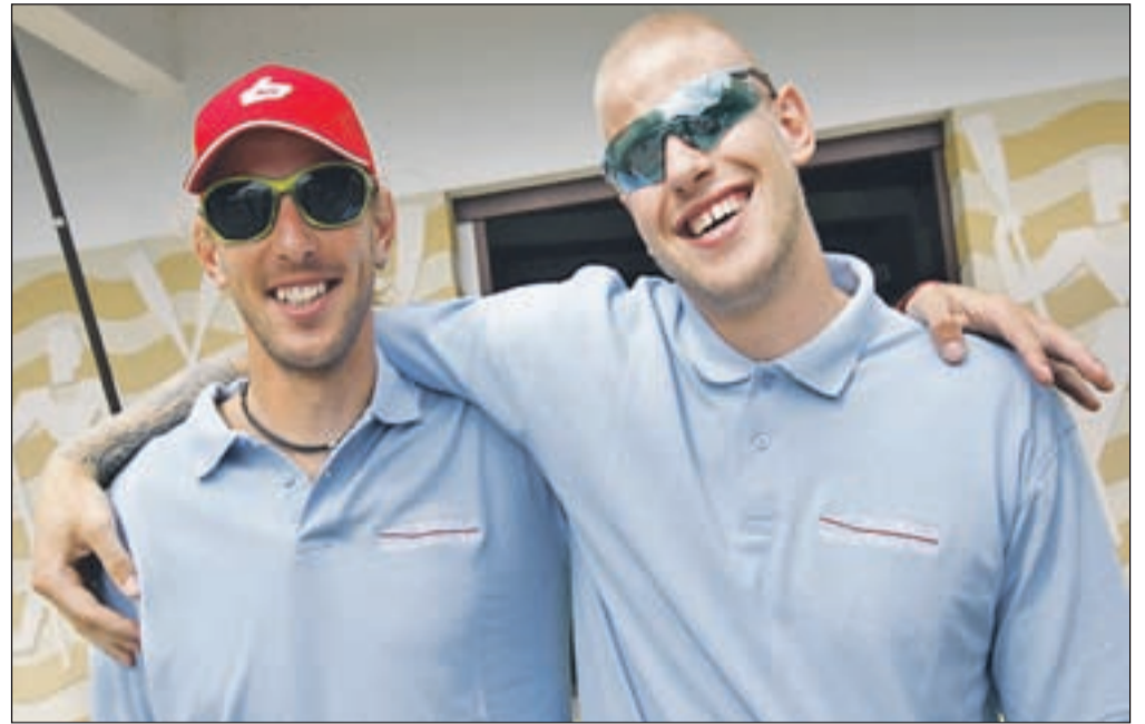
Bratoma Špik letos še ne gre po načrtih, najpomembnejša tekma sezone, nastop na svetovnem prvenstvu, pa ju čaka šele v začetku novembra.

"Nastopi članov niso šli po načrtih, saj naj bi se dvojni dvojec in četverec uvrstila v