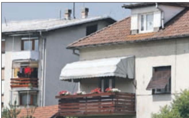
Lastniki bodo jeseni prejeli od geodetske uprave podatke o vrednosti nepremičnin.

skupine nepremičnin - stanovanjske, poslovne in industrijske nepremičnine, nezazidana stavbna zemljišča, kmetijska in gozdna zemljišča ter druge nepremičnine, vendar pa ne bo smela biti nižja od zakonsko določene, ki po predlogu zakona znaša 0,03 odstotka. Za prvo leto od uveljavitve zakona naj bi davčne stopnje za stanovanjske nepremičnine za posamezne občine določila država, pri tem pa naj bi upoštevala sedanje obremenitve z nadomestilom za uporabo stavbnega zemljišča in z davkom od premoženja.