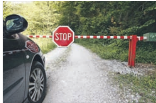
Nekatere gozdne ceste so do sredine oktobra zaprte, poleg prometnega znaka vožnjo preprečujejo zapornice.

Kljub predlogom upravljalcev gozdov, da bi zapornice ostale zaklenjene vse leto, so se pristojni odločili, da bodo te ostale odklenjene. Pri tem navajajo, da se tisti, ki se odločijo, da na vsak način želijo z vozilom na gozdno cesto, pogosto zapornice lotijo tako, da jih poškodujejo. Za zgled navajajo sosednjo Avstrijo, kjer zapornice, kakršne so na naših gozdnih cestah, sploh nimajo. Zapornice ostajajo odklenjene tudi zato, ker bi zaklenjena zapornica v primeru nesreče v gozdu ali višje v hribih ovirala reševanje ponesrečenih in njihov prevoz do ustrezne pomoči.