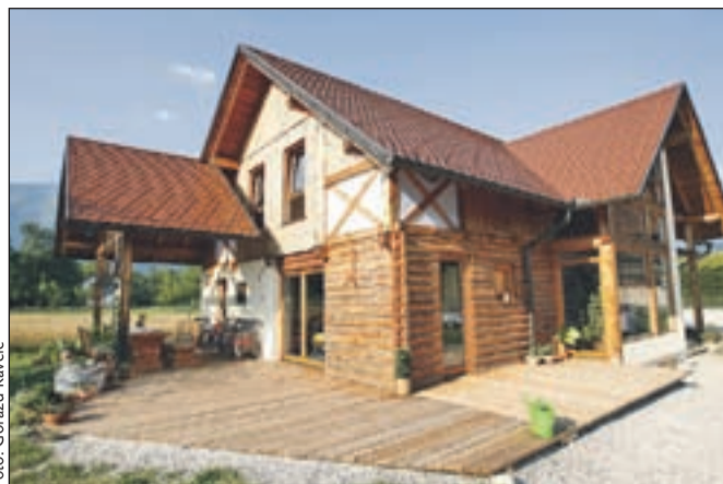
Ekološka hiša: za ogrevanje porabijo na leto le 180 evrov.