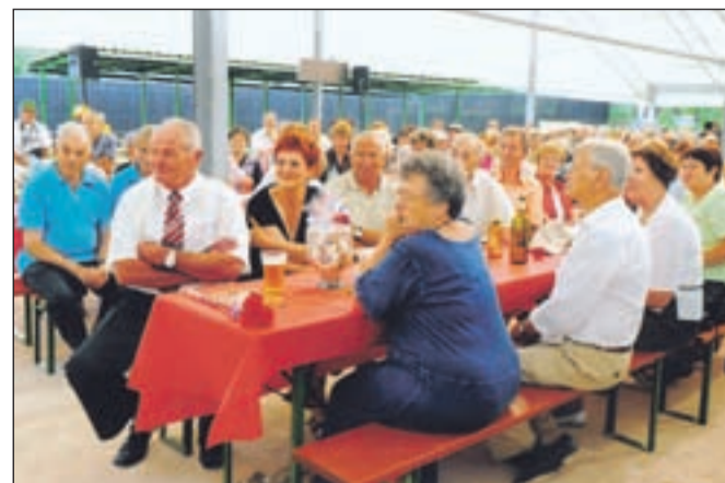
Veliko praznovanje častitljive obletnice žirovskega društva so praznovali na pokritem balinišču.

Društvo šteje 1088 članov ali skoraj četrtnino vseh Žirovcev. Uspešni so pri številnih dejavnostih, velikokrat se skupaj odpeljejo na izlete.