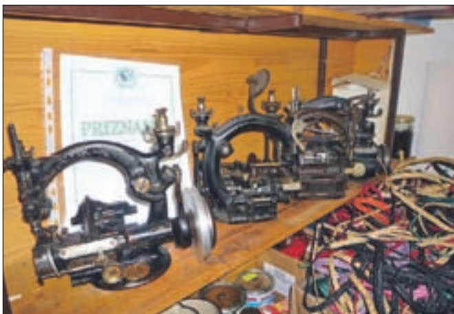
Šivalni stroji, ki jih uporablja pri svojem delu, so stari 130 let.