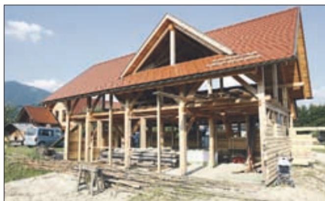
V kašči bo tudi razstavno prodajni prostor. / Foto: Gorazd Kavčič