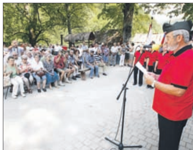
Na slovesnosti v Kokri so se spomnili pobitih talcev in požiga vasi pred 68 leti.