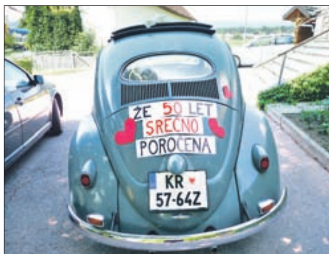
Na zlato poroko sta se, tako kot prvič, peljala s hroščem.