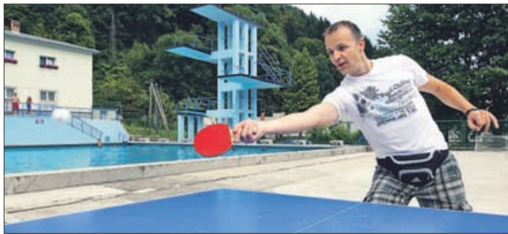
Mladinski center Jesenice na bazenu Ukova pripravlja različne dejavnosti za mlade, med drugim tudi igranje namiznega tenisa.