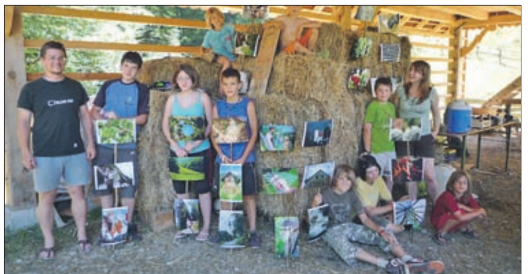
Udeleženci fotografskega otroškega tabora v Motniku s svojimi izdelki

"Otrokom smo predstavili osnove digitalne fotografije, največji poudarek pa namenili praktičnemu delu, ki je vključeval terensko fotografiranje po Motniku in okolici, da se bodo najmlajši tudi na družinskih izletih sami znašli s fotoaparatom. Nastalo je več tisoč fotografij, najboljša pa smo izbrali za razstavo, ki