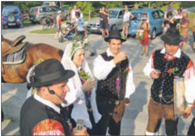
Po končani šrangi sta ženin in nevesta nazdravila z vaškimi fanti.

tudi tokrat pri cerkvi sv. Janeza paru pripravili tako imenovano šrango, na kateri so se člani Kulturno umetniškega društva Triglav iz Srednje vasi trdo pogajali za nevesto. Sprva so zanjo zahtevali kar dva tisoč goldinarjev, a so se po prepričevanju ženina najprej omehčali za eno ničlo, potem pa še za eno. "Daj deset goldinarjev, pa je tvoja," so se pogodili na koncu. Ženin pa ni opazil, da so mu vmes nevesto ugrabili, zato je moral primakniti še deset goldinarjev, da so jo pripeljali nazaj. Tako se je vse srečno izteklo in sta ženin in nevesta lahko nazdravila s fanti iz vasi ter se oženila v cerkvi. Poročni spreved je nato krenil proti ženinovemu domu, ki so ga postavili na prireditvenem prostoru Pod skalco. Končalo se je z veseljačenjem pozno v noč, pri čemer je za dobro voljo poskrbel ansambel Triglavski muzikantje.