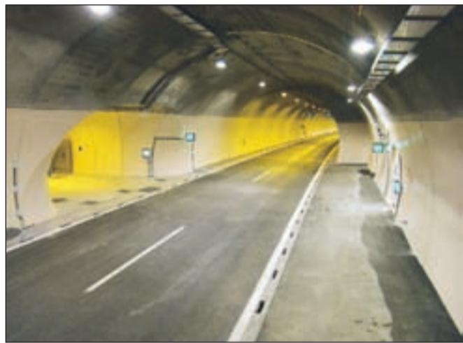
Avtocestni predor Šentvid je na evropskem preizkusu dobil oceno zelo dobro.

meril dobil najvišjo oceno zelo dobro, za ocenjevalno merilo krizni menedžment pa je prejel oceno dobro. S tem se predor Šentvid uvršča med zelo varne predore. Predor Šentvid je dolg 1493 metrov, osrednji predorski cevi sta bili dograjeni leta 2008. Konec lanskega leta sta bili dograjeni tudi dodatni predorski cevi. Vsak dan ga prevozi 36.600 vozil. Delež tovornih vozil je kar 17 odstoten. To pomeni, da predor Šentvid velja za predor s srednjim varnostnim tveganjem.