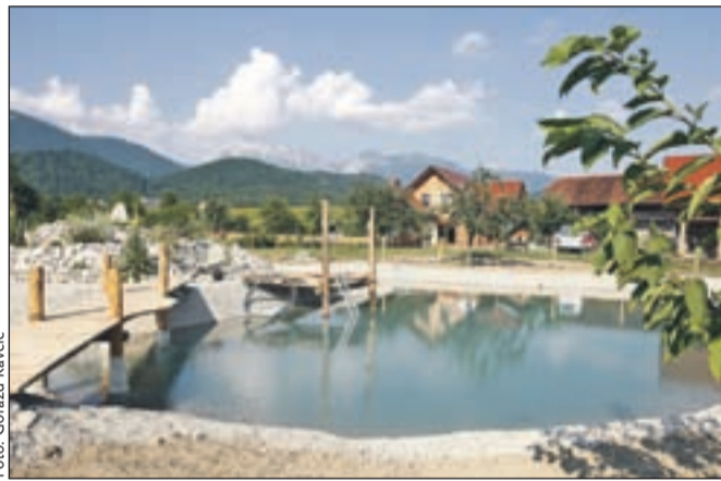
Plavalni ribnik z vodo za namakanje, osvežitev ...