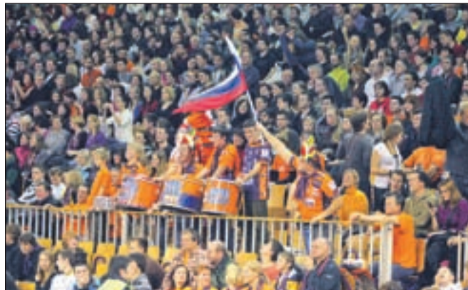
Navijači v oblačilih Indijancev so pripravili izvrstno vzdušje.