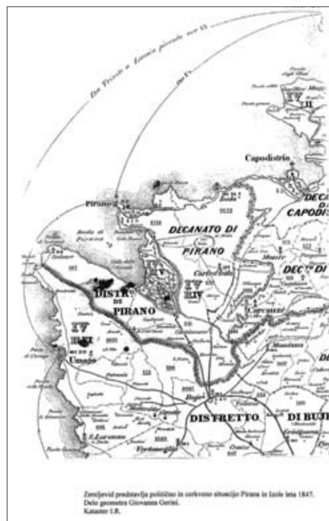
Zemljevid iz leta 1847, ki kaže, da sta bila Savudrija (Salvore) in celotni Piranski zaliv (Rada di Pirano) v okraju Piran.