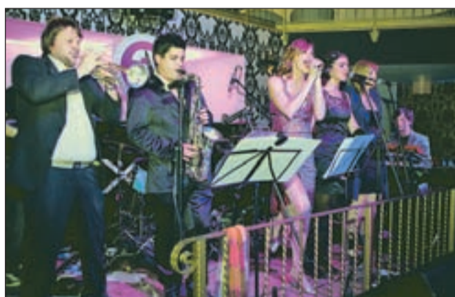
Devetčlanska novost, skupina Xequitfz, ki je pred kratkim izdala single Daleč stran.