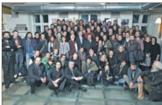
Enooki žal ne gredo v dvokolonsko sliko. Tokrat smo jih na fotografiji našli več kot petdeset. Novoletno druženje je vsako leto bolj obiskano.