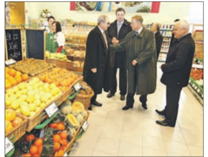
Supermarket v Lescah je druga Sparova trgovina v občini Radovljica in osemdeseta v Sloveniji.

gih pogojev lokalne skupnosti, ki je od investorjev zahtevala, da arhitekturo objekta prilagodijo gorenjskemu okolju. Radovljiški župan Janko S. Stušek pa je ob odprtju spomnil, da novi Spar predstavlja edino večjo trgovino na zgornjem delu Lesc, zato se po njegovem prepričanju kljub veliki konkurenci na trgovskem področju ni bati za posel. Investor je v izgradnjo novega supermarketa vložil 3,5 milijona evrov, ob odprtju pa občini Radovljica izročil tudi donacijo v višini 4 tisoč evrov, ki jo je dobil Nogo-metni klub Lesce.