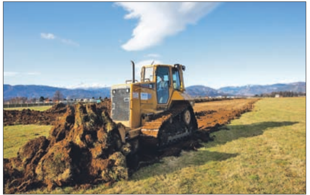
Prestavitev in asfaltiranje vzletno-pristajalne steze v Lescah bosta po zagotovilih izvajalcev dokončani v šestdesetih delovnih dneh.

kot obstoječa travnata, ki je dolga 1270 in široka 60 metrov. Zamaknjena bo za 13 stopinj, tako da bo tekla vzporedno z novo avtocesto. Ob njej ob še krajša, šeststo metrov dolga travnata steza, namenjena pristajanju ja dralnih letal. Za projekt je Občini Radovljica sredstva v višini 2,4 milijona evrov zagotovil DARS, saj prestavi-