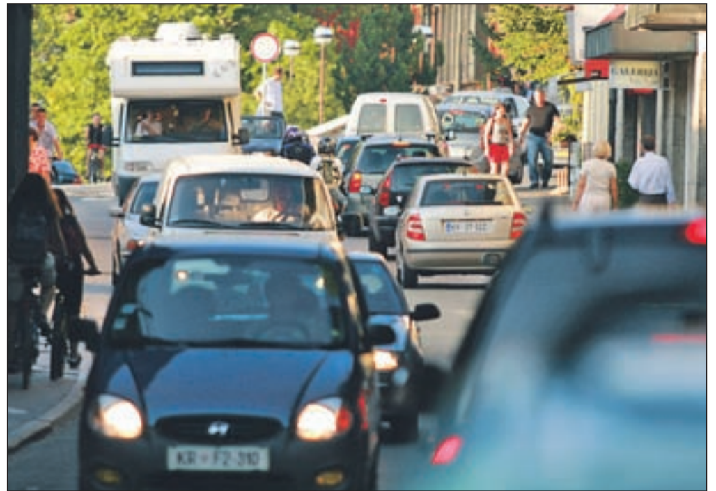
Kot kaže, se bo središče Bleda še nekaj časa dušilo v pločevini.