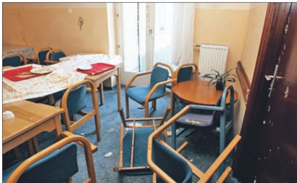
Prevrnili so mize in stole, s hrano popackali stene in tla, razbijali krožnike ...

Jesenice - V sredo nas je zgrožen poklinal Aleksander Ažman, lastnik jeseniške restavracije Kazina, kjer pripravljajo dijaške malice za dijake bližnje Srednje šole Jesenice. Okrog pol desetih dopoldne, to je v času dijaške malice, je namreč skupina dijakov povsem uničila jedilnico v restavraciji - prevrnili so mize in stole, s hrano popackali stene in tla, razbijali krožnike ... Spravili so se tudi na steno pred vhodom v restavracijo, ki so jo popolnoma razbili in vanjo naredili več kot meter veliko luknjo ... Lastnik restavracije, v kateri vsak dan pripravljajo dijaške malice za petsto do petsto petdeset dijakov, je zgrožen. "Začelo se je pred kakšnim mesecem dni, ko smo opazili, da se v času malice dijaki obmetavajo s hrano, uničujejo inventar. O problemu sem takoj obvestil ravnatelja šole in policijo, prosil sem tudi, naj v času malic šola zagotovi učitelje, da bodo nadzirali dijake. A ukrepal ni nihče, gre za mladoletne osebe, starši si zatiskajo oči, učitelji pa naj ne bi bili zadolženi za to, da nadzirajo dijake v času malice," je povedal Aleksander Ažman.