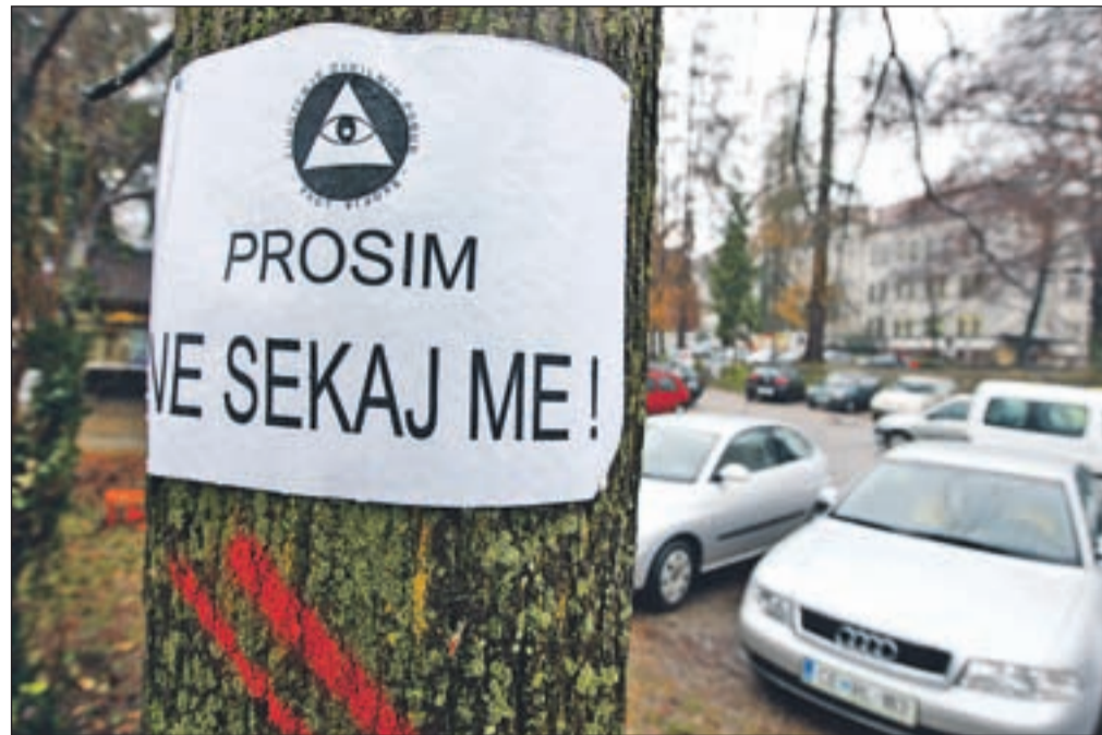
Civilni pobudniki so želeli drevesa obvarovati z napisi: Prosim, ne sekaj me.