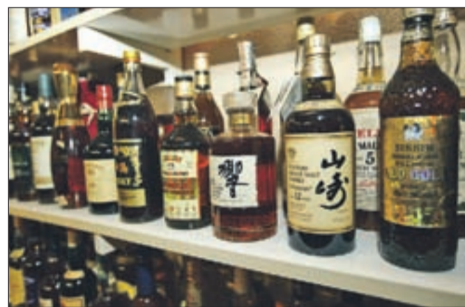
Posebej ponosen je na svojo mini zbirko slivovk iz bivše države v ploščatih steklenicah.