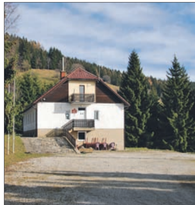
Planinski dom na začetku poti

Vrnemo se po poti pristopa. V vsakem primeru vam svetujem še ogled cerkve svetega Janeza Krstnika. Farna cerkev datira v 15. stoletje. Zgrajena je v gotskem stilu. Okrog cerkve je pokopališče s kamnitim obzidjem. Po letu 1958, ko je cerkev pogorela, so jo popravili in stolp precej znižali, pred leti pa so jo v celoti obnovili. Nadmorska višina: 1522 m Višinska razlika: 480 m Trajanje: 1 ura in 30 minut Zahtevnost: ★★★★★