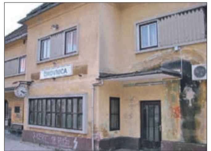
Železniška postaja v Žirovnici žalostno propada.

Pritličje postaje (prometni urad, tehnični prostori...) je sicer v uporabi po potrebi. V nadstropju so tri stanovanja; dve sta oddani, eno pa je prazno in ga je treba obnoviti, zanimanja zanj pa ni veliko. "Možnost, da bi objekt v nekaj letih lahko spremenil podobo, vidimo tudi v sodelovanju z občino. Če bi bila ta zainteresirana, da prazno stanovanje obnovi s svojimi sredstvi za potrebe neprofitnih stanovanj, ga lahko dobi v najem. Na tak način denimo že sodelu-