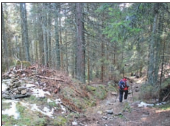
Delček gozdne poti na Košenjak