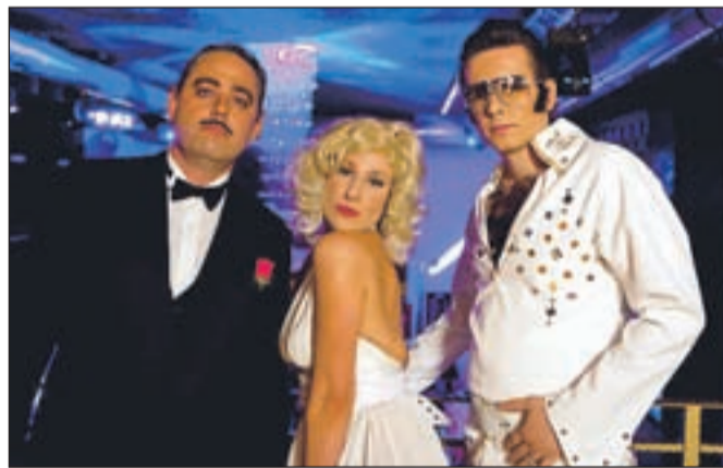
TV3 Star Party. Dress code: zvezda. Naleteli smo na številne znane obraze iz filmskih platen.