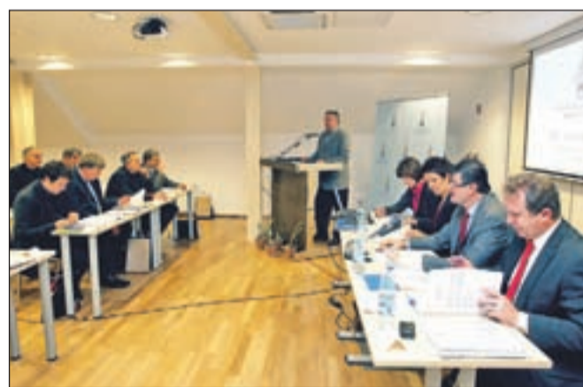
Državni svetniki so tokrat zasedali na Jesenicah.