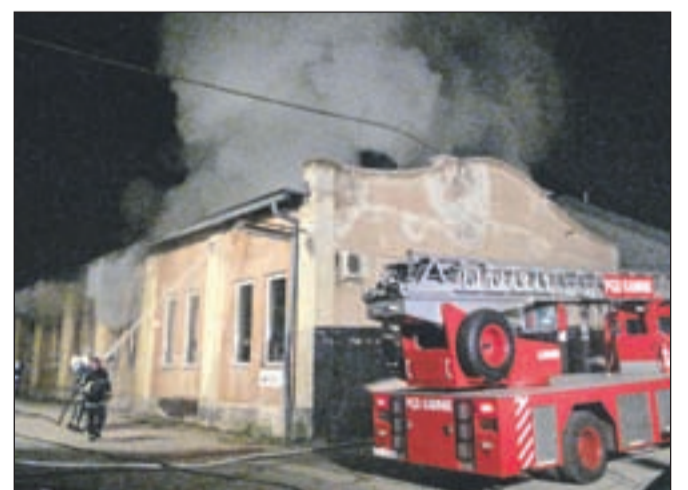
Kamniški gasilci so se z ognjenimi zublji borili pozno v noč.

klicu, a če ne bi bilo v naših vrstah nekaj gasilcev, ki delajo na območju Titana, ne bi vedeli, kako in kje gasiti, saj stavba ni bila primerno opremljena s požarnim redom. Prav tako smo naleteli na neuporabno hidrantno omrežje, saj je deloval le en hidrant pri vrtarnici, nekaj jih je bilo celo zasutih. Vodo smo zato vozili s cisternami in črpali iz bližnjega potoka. V stavbi ob našem prihodu ni bilo nikogar, zato smo morali zaklenjena vhodna vrata razbiti. Zagorelo je v skladišču, ker pa ni bilo požarne stene, so deloma uničene tudi pisarne. Delavnica je ostala nepoškodovana, prav tako nam je uspelo zaščititi vse sosednje stavbe," je povedal po-