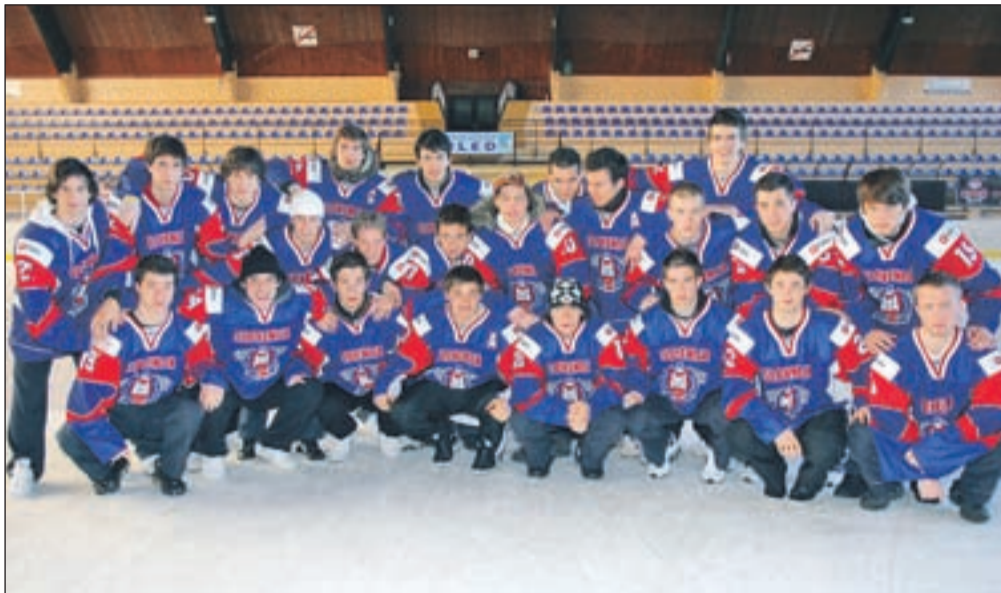
Naši hokejski upi so se pred odhodom na svetovno prvenstvo zbrali na Bledu.

Reprezentanca je sestavljena iz fantov, ki igrajo v različnih slovenskih klubih, nekaj pa jih je prišlo tudi iz tujine.