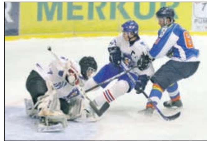
V gorenjskem derbiju so Triglavani šele v zadnjem delu tekme strli odpor blejskega moštva.

V ženski ligi DEBL so že sedem tekem zapovrstjo neporažene hokejistke Triglav, ki so v nedeljo z 1 : 3 slavile v Beljaku, jutri, v soboto, ob 18. uri pa v domači dvorani Zlato polje gostijo ekipo Vienna Flyers z Dunaja.