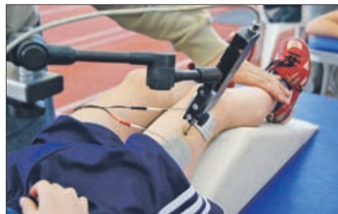
Eden izmed testov je tenziomiografija, metoda za diagnostiko mišic, ki poda informacije o tipu mišic (hitre, počasne) in njenih sposobnostih, tako trenutnih kot o potencialu.