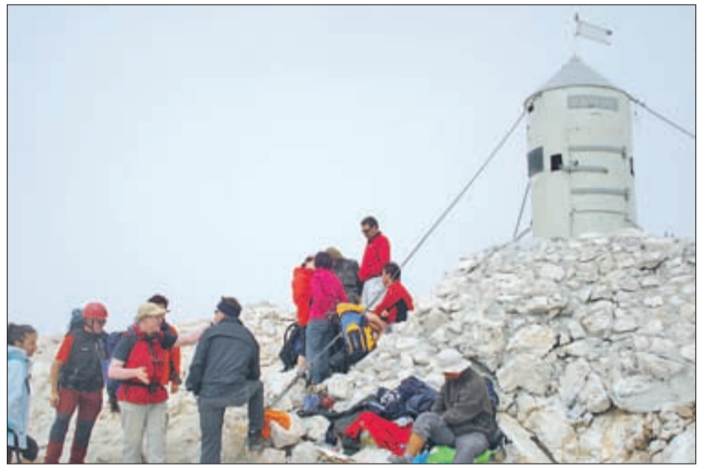
Na vrhu Triglava naj bi že naslednje leto stala kopija Aljaževega stolpa.