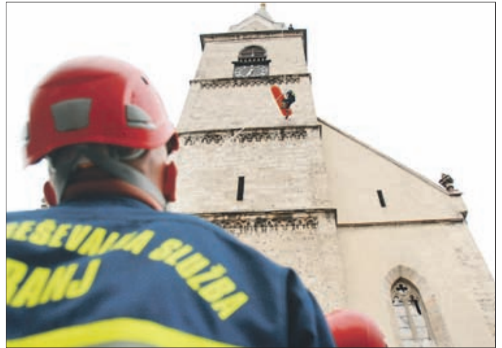
Ker do vrha zvonika gasilska lestev ne seže, si morajo gasilci pomagati z vravo.

Po besedah strokovnega vodja Gasilske reševalne službe Kranj Mateja Kejžarja , kranjski gasilci vsako leto pripravijo več specialnih reševalnih vaj, med njimi tudi reševanja z visokih objektov, do katerih je otežen dostop bodisi zaradi njihove višine bodisi zaradi zasedenih intervencijskih poti. "Posebej v naselju Planina stanovanjci avtomobile parkirajo na intervencijskih poteh, tako