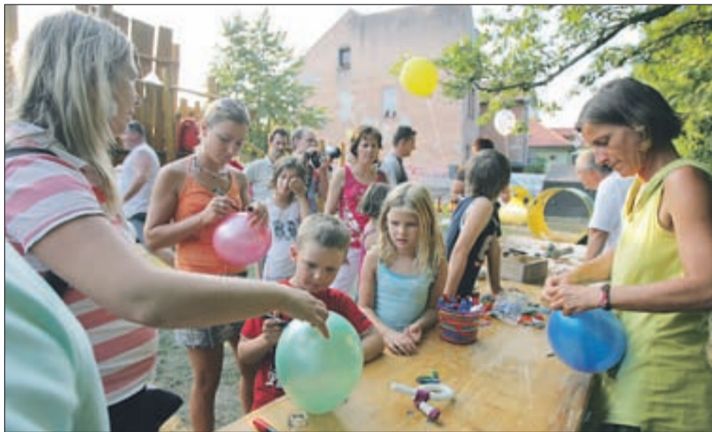
Za poslikavo helijevih balonov je bilo veliko zanimanja.