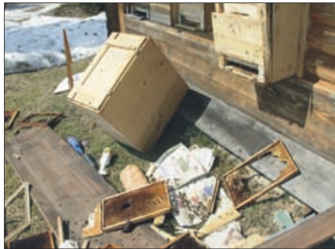
Letos medved še ni povzročil večje škode, bilo je le nekaj napadov na čebelnjake. / Foto: arhiv ZGS-OE Bled

V Gorenjskem lovsko upravljavskem območju se