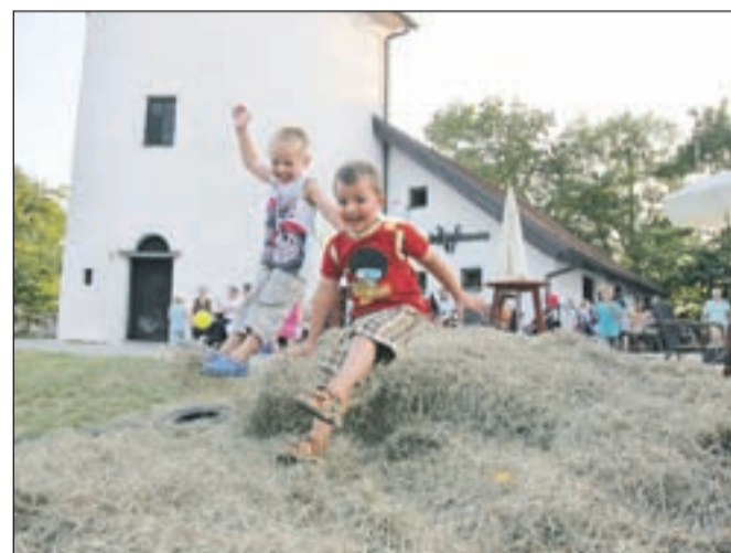
Energijo so otroci sproščali tudi s skakanjem po senu.

Še več vrveža je bilo na Pungertu v soboto. Otroci so izdelovali lutke, z zanimanjem so si ogledali predstavo Od zemlje do zemlje, posladkali so se s palačinkami, ki so si jih prislužili z risanjem slik (jeseni bodo razstavljene v centru Krice Krace), popoldansko dogajanje pa sta popestrila klovna, izdelovanje jadralnih letal ter poslikava obrazkov in helijevih balonov. Svojo energijo so malčki sproščali tudi s skakanjem po senu in čofotanjem v bazenčkih.