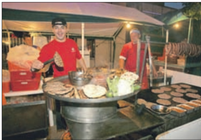
Brez pleskavic Kranjska noč ni prava noč.