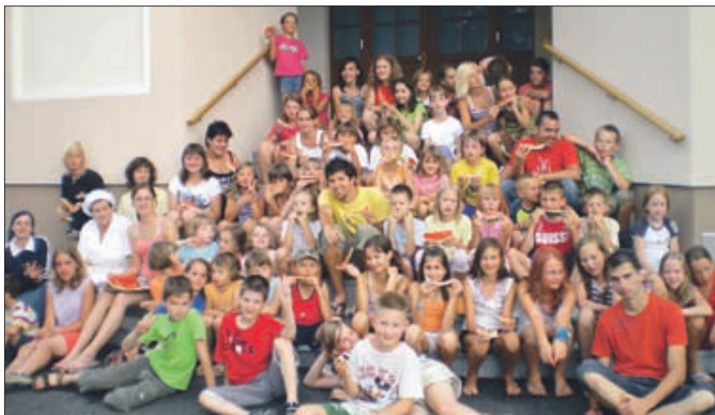
Na počitniških dnevih v uršulinskem samostanu v Svetem Duhu se je zbralo več kot 60 otrok.