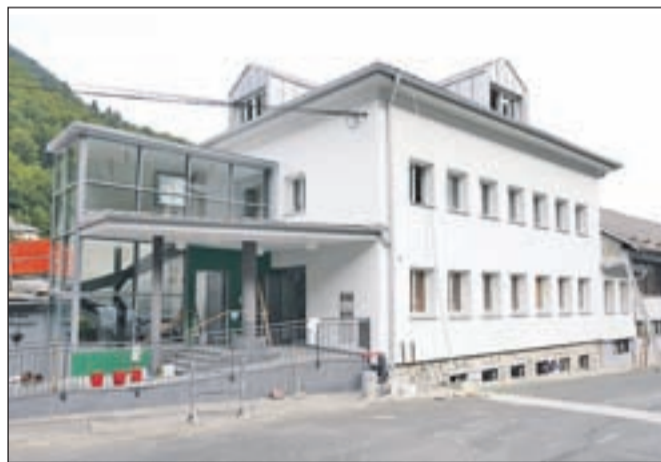
Nekdanja Plamenova tovarniška ambulanta se iz prvega nadstropja skupaj z lekarno seli v primernejše pritličje.

Kropa, Radovljica - V okviru praznovanj ob občinskem prazniku so včeraj v Kropi odprli obnovljene prostore zdravstvene postaje, kjer delujeta splošna ambulanta družinske medicine in lekarna. Novi prostori obsegajo lekarno ter ambulanto s čakalnico in drugimi prostori. Prenova zdravstvene postaje, ki se sedaj iz neprimernih prostorov v prvem nadstropju seli v precej lažje dostopno pritličje, se je začela pred dvema letoma. Investicijo v vrednosti 415 tisoč evrov vodi Občina Radovljica, s po dvajsetodstotnimi deleži pa sta jo sofinancirala še Osnovno