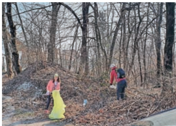
Počistili so gozdček v smeri proti Hrastjam.