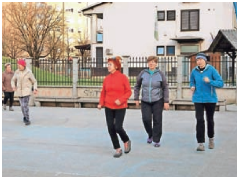
Za ogrevanje pretečejo tri kroge okoli igrišča.