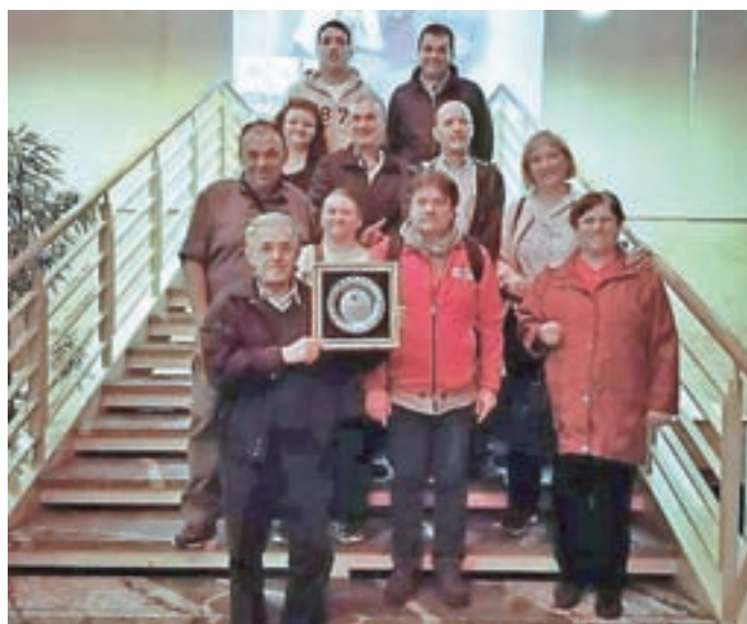
Člani naj športnega društva 2021