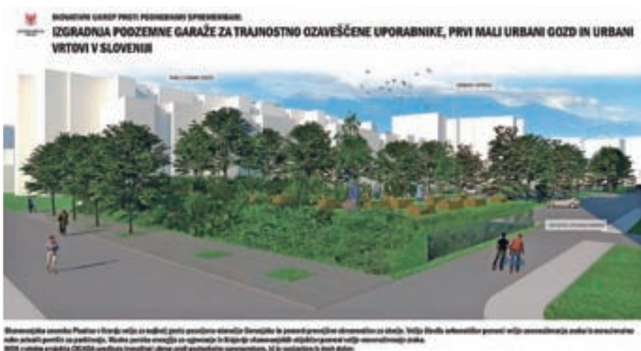
Načrt za mini tržnico

V času gradnje prizidka k OŠ Staneta Žagarja Kranj se je izkazalo, da je pri projektiranju prišlo do nekaterih odstopanj, zaradi katerih je bilo treba projektno dokumentacijo v manjšem obsegu dopolniti, so še pojasnili na MO Kranj. »Spremembe na samo izvedbo niso imele takšnega vpliva, da bi gradnja zaradi tega obstala, tako da ta z manjšim časovnim odstopanjem od sprejetega terminskega plana uspešno napreduje. Skupaj z izvajalcem se trudimo, da bo zamuda pri izgradnji čim manjša in da se bo pouk v novih prostorih z novim šolskim letom lahko začel čim prej nemoteno izvajati.«