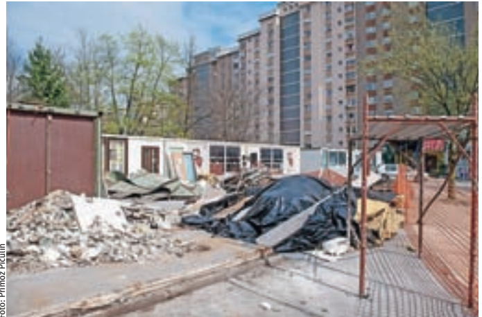
Prva dela pri odstranjevanju mini tržnice so se že začela.