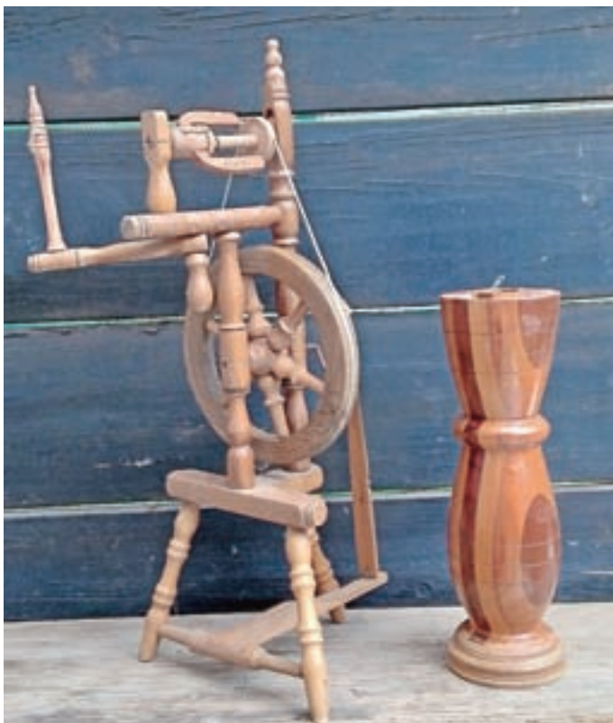
Spretni prsti ustvarijo tudi manjši kolovrat, ki prede volno, lesene vaze ...