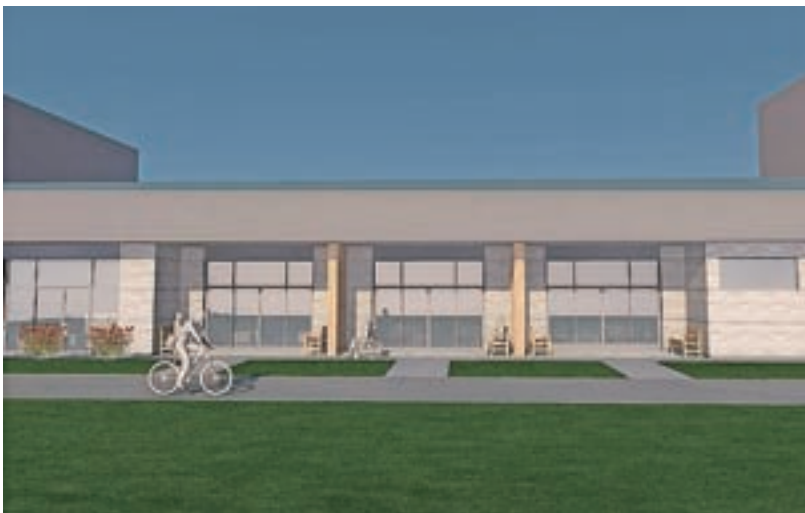
Enota za dnevno varstvo starejših