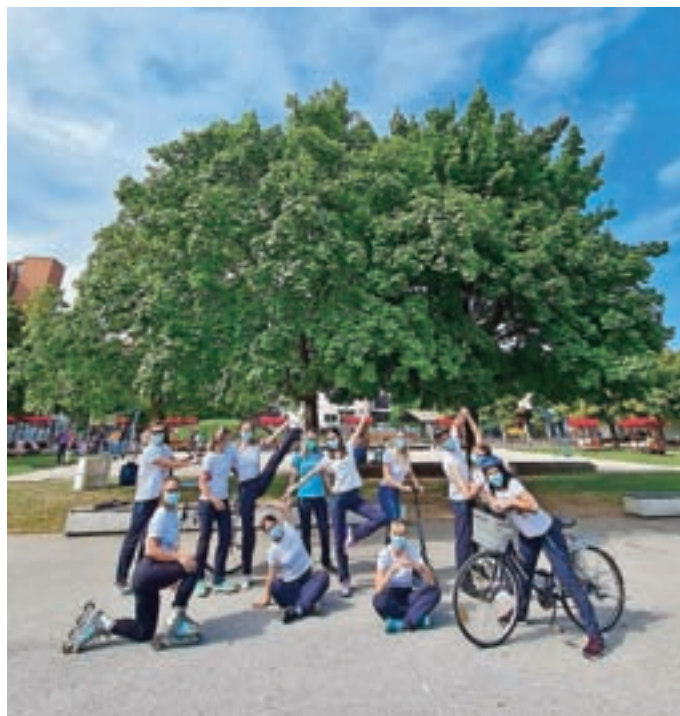
Ekipa Centra za krepitev zdravja Kranj

Znova so začeli tudi serijo preventivnih delavnic za zdravje, gibanje, prehrano in upajo, da jih covid več ne bo ustavil. Največ delavnic na Gorenjskem imajo v Centru za krepitev zdravja v ZD Kranj, kjer so na voljo programi, ki so usmerjeni v ohranjanje in krepitev zdravja ter pridobivanje zdravih življenjskih navad. Programe izvajajo strokovnjaki s specialnimi znanji (diplomirane medicinske sestre, dietetiki, fizioterapevti, kineziologi, psihologi ...). »Problematična je neaktivnost. Odsotnost gibanja je tista, ki povzroča težave. Nastavite si uro, da vas vsakih 30 minut spodbudi, da prekinete sedenje. Pokličite ali pišite v Center za krepitev zdravja v Kranju, kjer se boste gibalili skupaj z nami na delavnici Ali sem fit, sproščali na delavnici Tehnike sproščanja, učili o zdravem življenjskem slogu in dejavnih tveganja ali pa