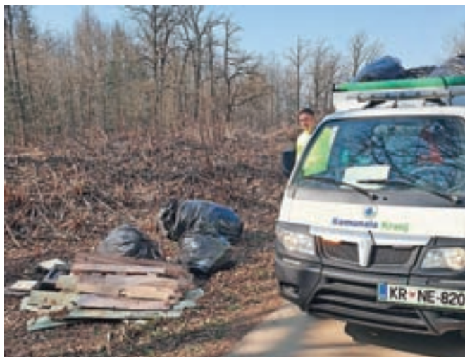
Vreče z odpadki so odpeljali delavci Komunale Kranj.