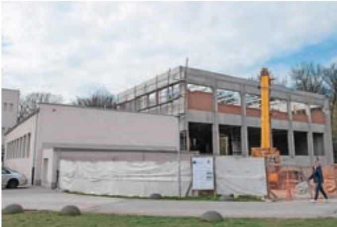
Gradnja prizidka k OŠ Staneta Žagarja

Na MO Kranj smo (po)iskali odgovore glede urejanja mini tržnice, posodobitve igrišča pri OŠ Jakoba Aljaža Kranj in poteka gradnje prizidka k OŠ Staneta Žagarja Kranj.