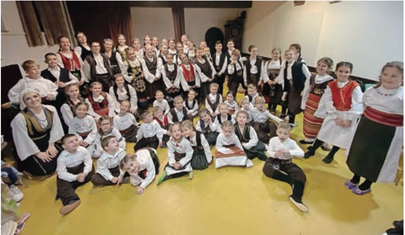
Otroška folklorna skupina Kulturnega društva Brdo

Kulturno društvo (KD) Brdo vse od ustanovitve leta 1994 v Kranju neprekinjeno deluje na področju kulture, združevanja ljudi in ohranjanja tradicije svojih prednikov. Njihovi člani prihajajo tudi iz krajevnih skupnosti Planina in Huje.