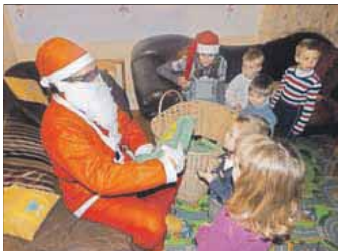
Obisk Božička v Dupljah