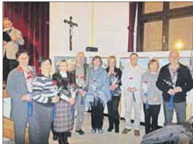
Likovniki, ki so »naslikali« dvanajst narodnih pesmi.