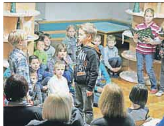
Nastopi učencev so pričarali zadovoljstvo in nasmeh v oči obiskovalcev.

ru zapeli nekaj pesmic, Zaž pa je zaigral na saksofon. Zaplesala so tudi dekleta iz plesne skupine Studio ritem. Program sta povezovali sošolki, Anita in Nika. Učiteljica Mateja Jarc pa je na koncu vsem zaželela lepe praznike in srečno novo leto. Ob koncu uspešne prireditve so nas pogostili s piškotki in bonboni. Ta prireditev je zame zadnja v podbreški šoli, saj jo bom drugo leto pričakala v centralni šoli, zato mi bo še posebej ostala v spominu.