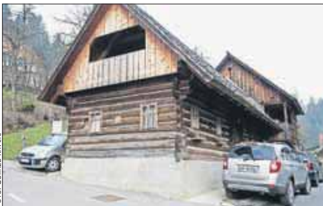
Vogvarjeva hiša je odprta po dogovoru s KTD pod Krivo jelko oziroma na številki 040/204 458.