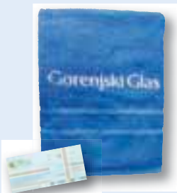
ali kopalna brisača s celodnevno vstopnico za Terme Snovik