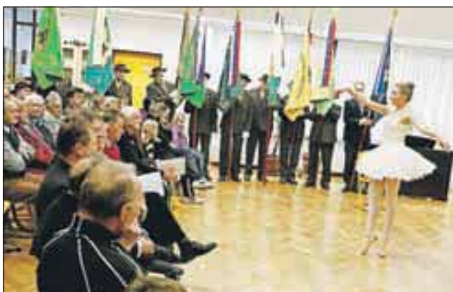
Čebelarstvo društvo Naklo je praznovalo 80 let (na sliki), načrte za prihodnost pa bodo dorekli na občnem zboru v februarju oziroma marcu.

In kaj dobrega so v občini storili najmlajši? Zbirali so star papir. Res je, da ni ravno jubilejno, je pa vsekakor pohvale