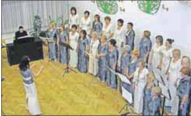
Zlate Dupljanke trenutno pripravljajo program za Območno revijo pevskih zborov, ki bo v začetku marca v Cerkljah.

jubileju v OŠ Naklo pripravili pester program. Dan pa ni bil pomemben le za čebelarje, izkazali so se tudi naklanski osnovnošolci, ki so pred tem šolsko avlo okrasili s fotografijami folklorne skupine Podku-