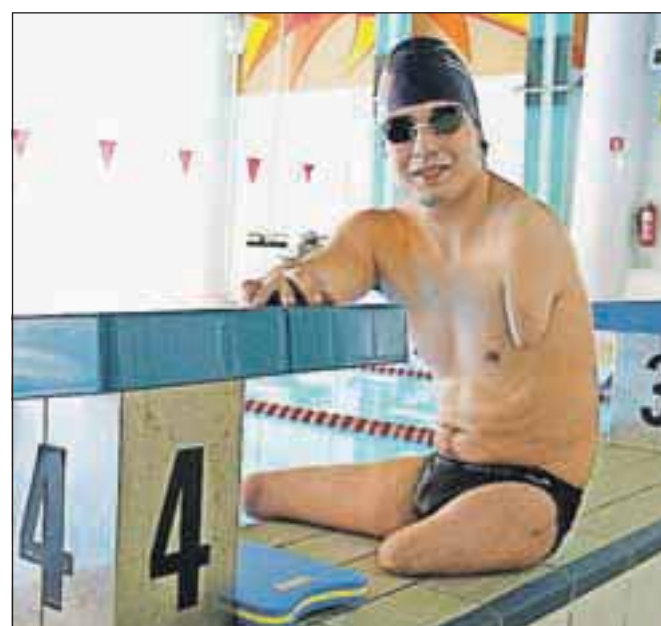
Ob bazenu ...