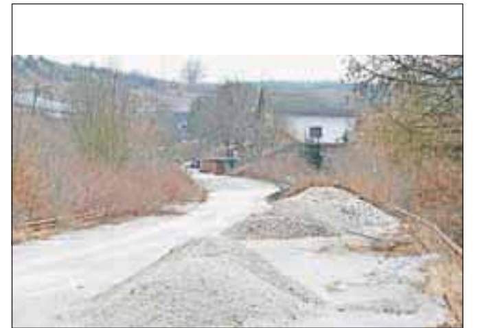
Tudi za območje stare hitre ceste na Bistrici je v načrtu sanacija.