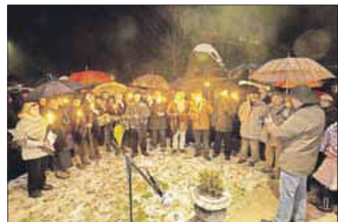
Koledniki Folklorne skupine Društva upokojencev Naklo