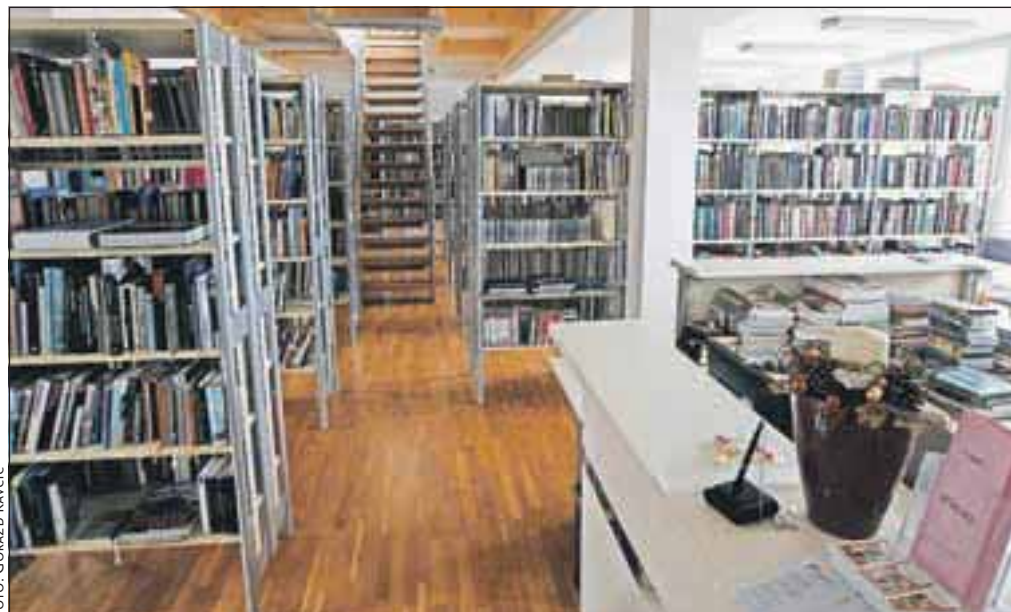
V krajevni knjižnici Naklo so v pripravi tudi bralna srečanja, namenjena starejšim.

Še kot zanimivost: najbolj izposojene knjige v letu 2012 so bile za odrasle bralce biografski roman Cavazza, kriminalni romani Harlana Cobena ter romantično ljubezenske romance Lise Kleypas, Jude Deveraux in Susan Elizabeth Phillips. Najbolj izposojene knjige za najmlajše so bile knjige iz serij Grozni Gašper in Mišek Tip. Osnovnošolci so si največ izposojali knjige Dnevnik nabritega mulca, Butalci in Matilda.