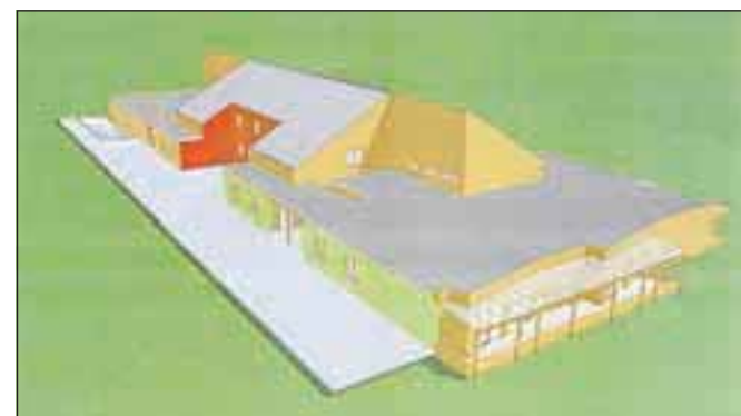
Vrtec še kot projekt, kmalu tudi v gradnji

za obdobje 2007 – 2013, za obdobje 2012 - 2014, razvojne prioritete: Razvoj regij, prednostne usmeritve: Regionalni razvojni programi. Za gradnjo vrtca je že izdelan idejni projekt, ki ga bo v prihodnjih dneh obravnaval tudi gradbeni odbor. Izdaji gradbenega dovoljenja bo sledil razpis za izvajalca del, župan računa, da bodo gradnjo začeli v začetku poletja. Otroci naj bi prvič prestopili prag novega vrtca septembra 2014.