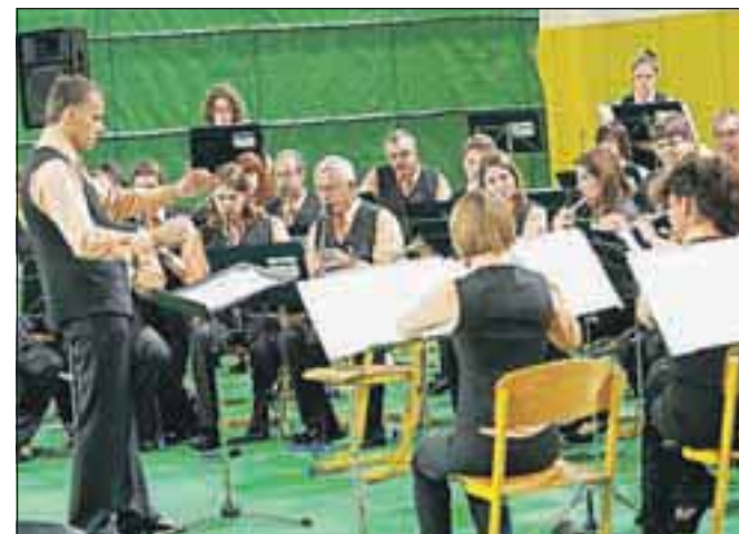
Tržiški pihalni orkester, ki je prvič javno zaigral leta 1928, zadnja leta pa posega po najvišjih godbeniških priznanjih, med koncertom v Naklem.