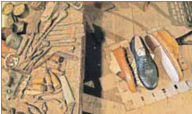
Čevljarstvo je bilo nekoč v Dupljah močno razvito, skoraj v vsaki hiši se je vsaj eden izučil tega poklica.