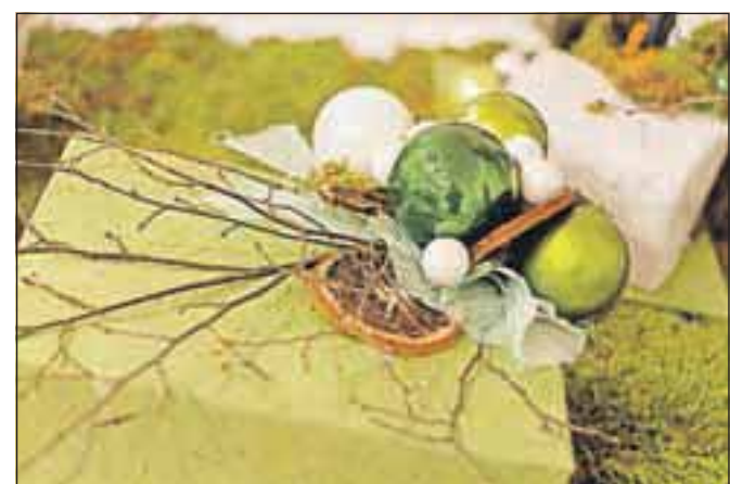
Utrinek iz božično-novoletne razstave