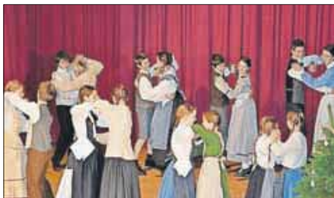
Na odru se je na božično-novoletnem koncertu predstavilo kar 112 nastopajočih.