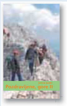
ali knjiga Pozdravljene gore II