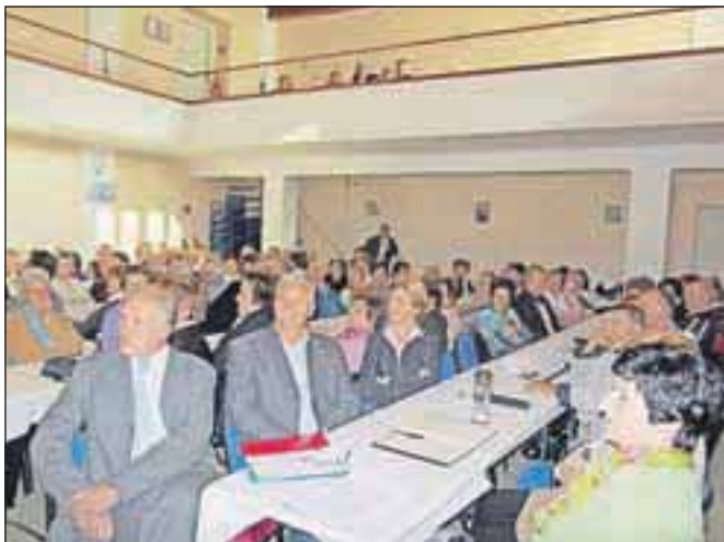
Občni zbori društva so vsako leto dobro obiskani.

Društvo upokojencev Naklo, ki je s skoraj 1000 članicami in člani najmnogičnejša organizacija civilne družbe v občini, praznuje letos 60-letnico delovanja. Kot samostojno društvo je začelo delovati decembra leta 1975, pred tem, od marca leta 1953 dalje, pa je bila v Naklem podružnica kranjskega društva, zato se leto 1953 upravičeno šteje za ustanovno leto. Društvo vsa leta krasi delavnost in skrb za člane in druge starejše in pomoči potrebne v občini. Zato društvo vsa leta veliko prispeva k razvoju celotne občine Naklo. J. K.