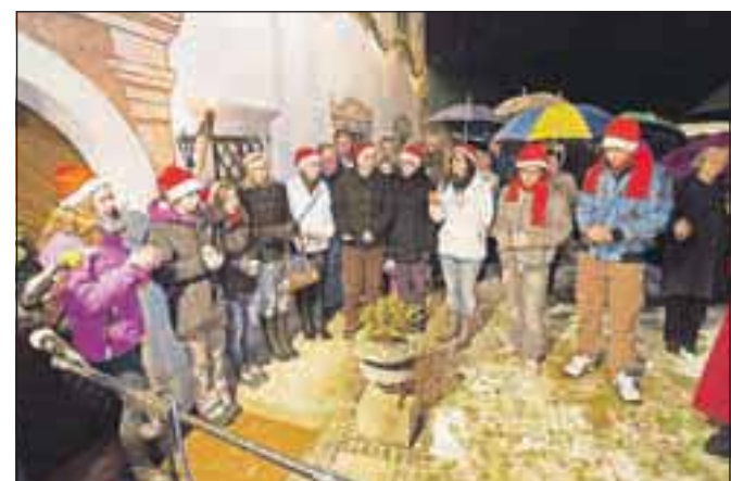
Mladinski pevski zbor Biotehniškega centra Naklo