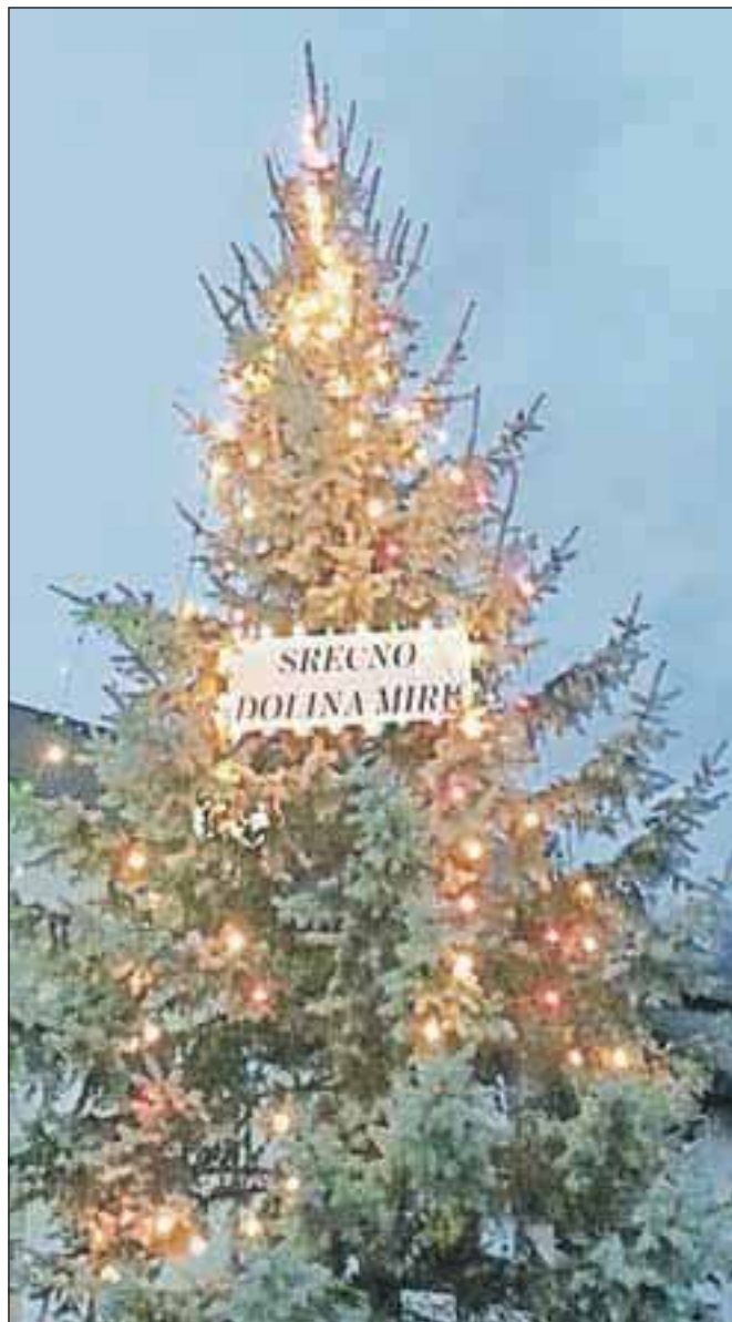
Lepo okrašena novoletna jelka, postavili so jo prebivalci Doline miru.