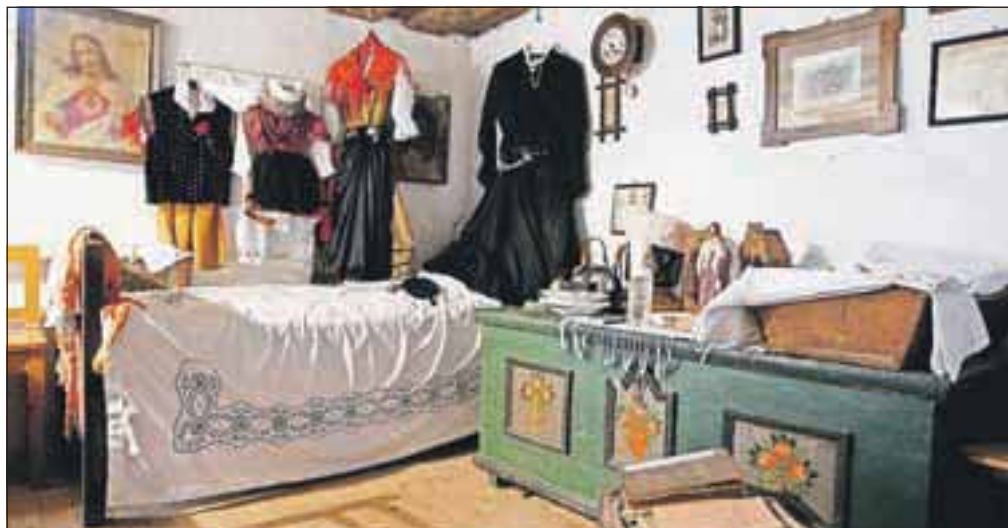
Večino predmetov in drugih eksponatov so tudi za etnografsko zbirko podarili domačini.