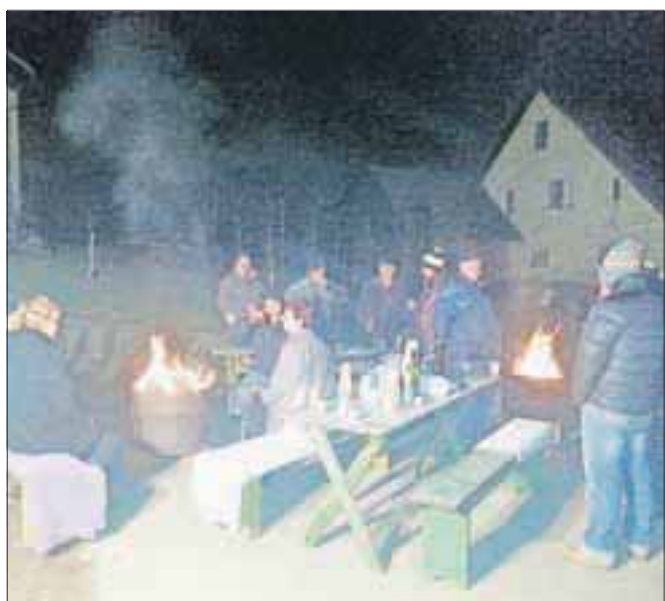
V Strahinju so sosedje iz Doline miru polnoč pričakali pod novoletno jelko.