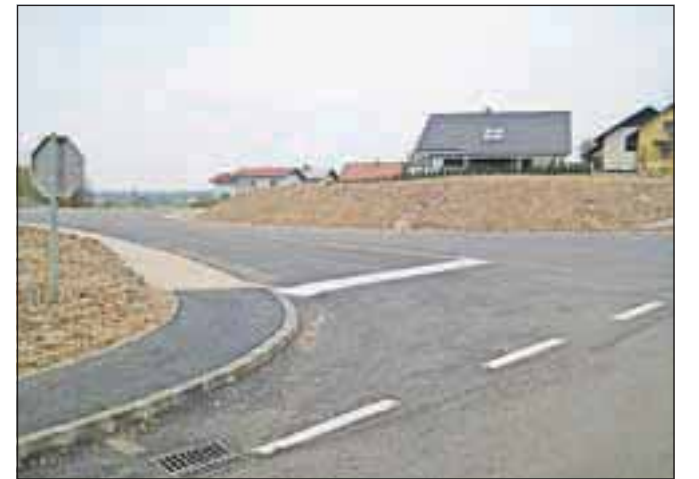
Urejen predel Cegelnice čaka še na igrišče.

Za predel Cegelnice, kjer je Družba RS za avtoceste podrla zapuščene hiše ob avtocesti, je občina poskrbela za ureditev brežine in spodnje ceste, v načrtu je tudi postavitve igrišča, je dejal župan Marko Mravlja in dodal: »Prizadevamo si, da bi od DARS-a pridobili v lastništvo tudi zemljišče ob stari hitri cesti skozi Bistrico. To območje je nujno potrebno sanirati, saj so zdaj tam kupi peska, zbirajo se preprodajalci drog. Tudi cesta skozi Bistrico je prepotrebna obnove. Projekti so šli v recenzijo, v letu 2014 pričakujemo, da bi lahko začeli z deli na tem območju.« S. K.