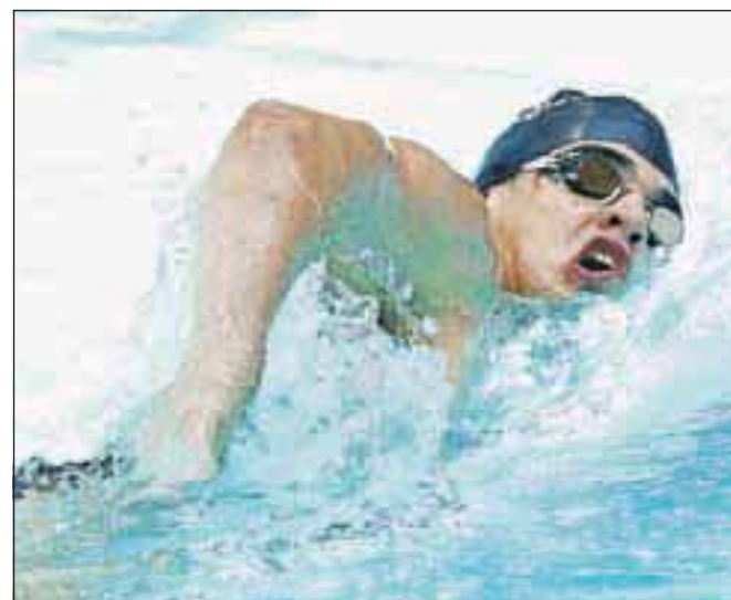
... in med plavanjem / FOTO: GORAZD KAVČIČ