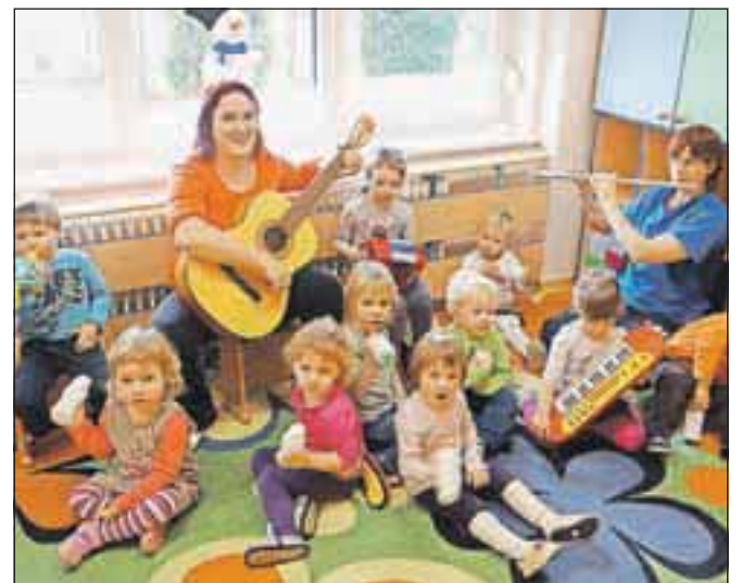
Čas za praznovanje

Ogledali smo si dve lutkovni predstavi. S prvo, ki je nosila naslov Egon, sta nas razveselili igralki Gledališča Tri, z drugo, z naslovom Medenka, pa Plesno društvo Netopir. Obiskal nas je tudi dedek Mraz z enim od svojih škratov. Otroci so se ga zelo razveselili, še bolj pa daril, ki jih je prinesel s seboj. Tako kot vsako leto, smo se tudi letos spomnili naših ba-