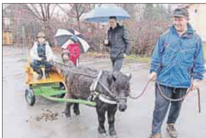
Tudi najmanjši konjič je prišel po Štefanov blagoslov.