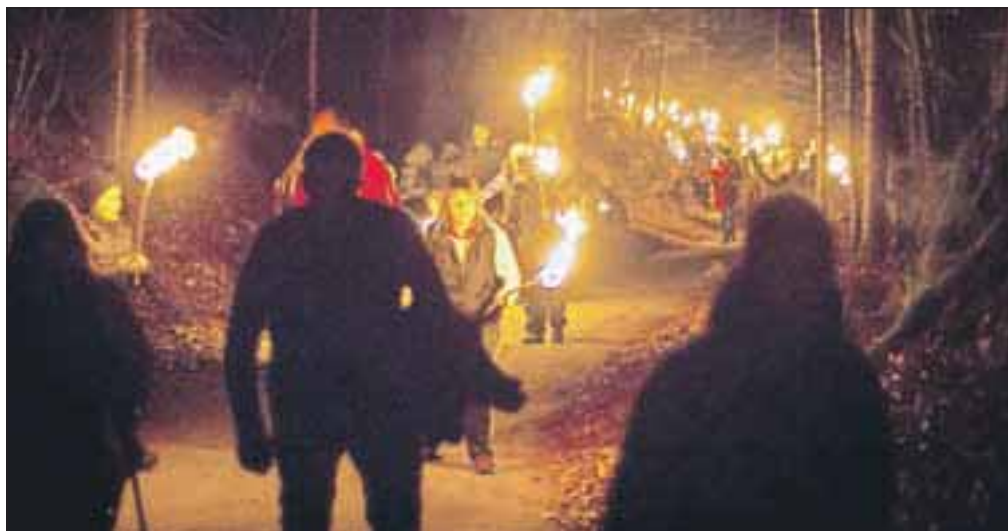
Po oceni organizatorjev se je pohoda udeležilo več kot 1200 pohodnikov.

Po približno pol ure hoje so pohodnike pri Krivi jelki, kjer je tudi vpisna knjiga, postregli s čajem, kuhanim vinom, krompirjem v obličah in domačo zaseko, ki so jo naredili pri Trnovcu. Program so popestrili koledniki Folklorne skupine Društva upokoencev (DU) Naklo in Rokovnaška muzika DU Naklo. Letošnja posebnost je bil obisk svetih treh kraljev, ki so s seboj prinesli vsak po eno darilo; zlato, kadilo in miro. Za varnost so poskrbeli gasilci Prostovoljnega gasilskega društva Duplje.