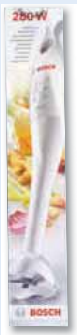
ali palični mešalnik BOSCH