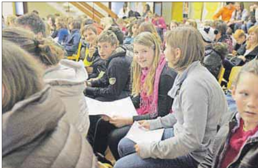
Državno tekmovanje iz biologije na OŠ Naklo