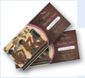
ali darilni bon za refleksoterapijo v vrednosti 20 EUR