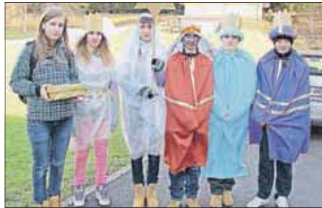
Trikraljevski koledniki dupljske župnije

Letošnji trikraljevski koledniški akciji s sloganom »Veselo daruje, da osrečujem« so se pridružili tudi birmanci iz dupljske župnije in pred nedeljskim praznikom Svetih treh kraljev voščili srečo in mir po domovih, na vhodna vrata napisali trikraljevski napis »20 + G + M + B + 13« ter prosili za pomoč našim misijonarjem na Madagaskarju, v Ukrajini, v Braziliji, v Malaviju, v Ruandi in v Gvajani. Organizator koledniške akcije je Misijonsko središče Slovenije. J. K.