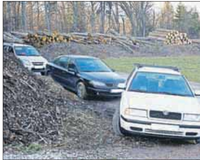
Vozila, parkirana pri gramozni jami v Bistrici pri Naklem, so pogosto tarča vlomilcev.

Varnostna slika v občini Naklo je bila v letu 2012 ugodna in primerljiva z letom poprej, saj policisti niso obravnavali posebej izstopajočih dogodkov, so pojasnili na Policijski postaji Kranj (PP). Na ugodno stanje kaže tudi podatek, da so policisti na območju občine Naklo obravnavali 156 kaznivih dejanj (142 v letu 2011), kar je majhen delež v primerjavi z več kot tri tisoč kaznivimi dejanji, ki so jih kranjski policisti obravnavali v vseh šestih občinah, ki so v njihovi krajevni pristojnosti. Največ kaznivih dejanj je bilo s področja splošne kriminalitete; tatvin je bilo skoraj za polovico več (43 v letu 2012 in 30 v 2011), število vlomov pa je primerljivo s predhodnim letom (18 v 2012 in 17 v 2011). »Največ tatvin se zgodi na javnih mestih, torej v trgovinah in gostinskih lokalih, nekaj dogodkov pa je bilo povezanih