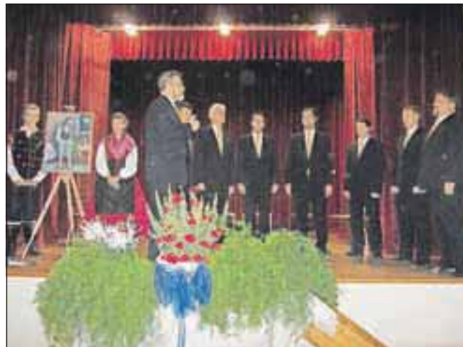
Kranjski okteti na podbreškem odru