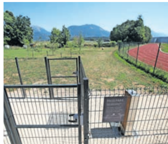
Park so na zemljišču med atletskim stadionom in Oblo gorico za uporabnike odprli v začetku meseca.

Ureditev parka je bila izglasovana kot eden od projektov radovljiškega participativnega proračuna, predlagateljica pa je v obrazložitvi predloga poudarila, da ima Radovljica sicer veliko zelenih površin, a da sprehajanje psov brez povodca ni varno, urejenih površin za prosto sprehajanje in igranje psov pa doslej ni bilo. Zato je predlagala ureditev ograjenega parka, ki psom omogoča prosto giba-