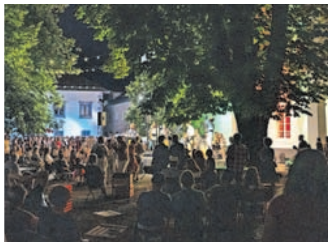
Tradicionalni juljski četrtki so na trg pripeljali tudi rokodelski sejem in večerne koncerte z lokalno kulinariko Okusov Radol'ce.