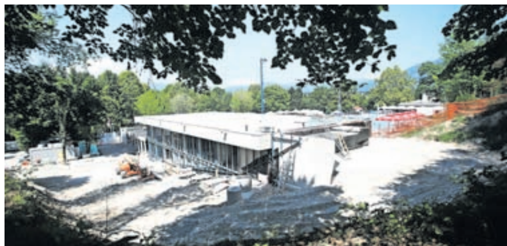
Na mestu porušenih stavb gradijo nov objekt, v katerem bodo recepcija, garderobe, sanitarije, restavracija in terapevtski bazen.

V drugi fazi bo bazen dobil drsno streho, velnes in fitness center na mestu, kjer je trenutno restavracija, ter