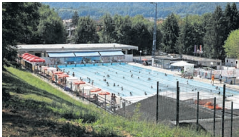
Bazen je ločen od gradbišča, nove sanitarije v kampu so že v uporabi.

Pojasnil je še, da delo, glede na to, da je Oblo gorica, v katero je delno vkopano radovljiško kopališče, zavarovana kot naravna vrednota, redno spremlja Zavod za varstvo narave. Zagotovil je, da bodo