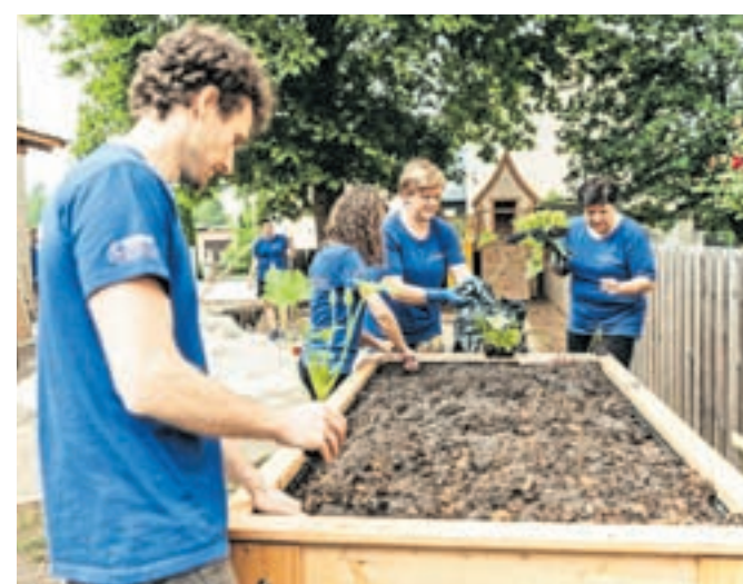
Otroci in vzgojiteljice so bili seveda najbolj veseli nove visoke grede, saj so tako dobili priložnost za raziskovanje rastlinskega sveta in učenje pravilne vsakodnevne skrbi, ki jo potrebujejo rastline.

V sklopu družbeno odgovornega projekta, ki spodbuja zaposlene k aktivnemu delovanju v lokalnem okolju, so ekipe Goodyearjevih prostovoljcev v zadnjih dveh mesecih izvedle že devet družbe-