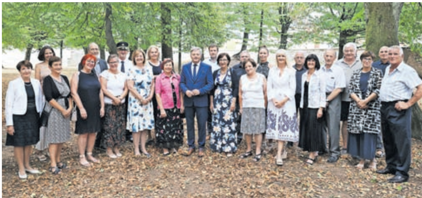
Prejemniki občinskih priznanj z županom Cirilom Globočnikom