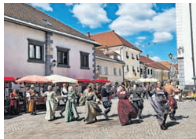
V privlačnem programu so navdušili člani Igralske skupine Gašperja Lambergarja.

S srednjeveškim dnevom je Radovljica vključena v mednarodni turistični projekt Venerina pot, katerega na-