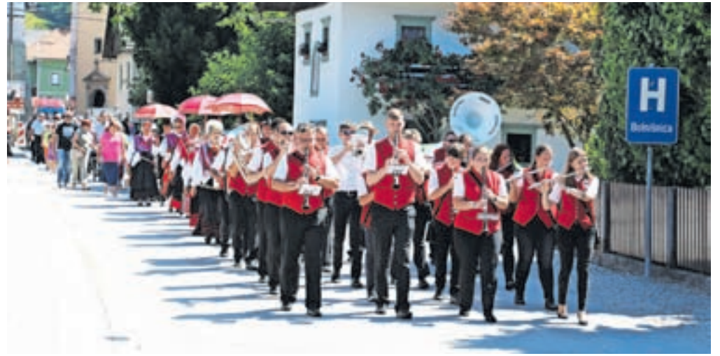
Po maši so obiskovalci v sprevedu z narodnimi nošami pod vodstvom Pihalnega orkestra Lesce odšli na prizorišče v centru Begunj, kjer se je nadaljeval kulturni program.

Sodelovali so še domače kulturno društvo, folklorni skupini in plesna skupina Country č'bele. Razstava na prostem, ki so jo odprli ob tej priložnosti, pa je bila posvečena turizmu v Begunjah nekoč. Sejemske dogajanje so zaokrožile stojnice z dobrotami in izdelki domače obrti, kulinarika pa je bila tako kot v preteklih letih