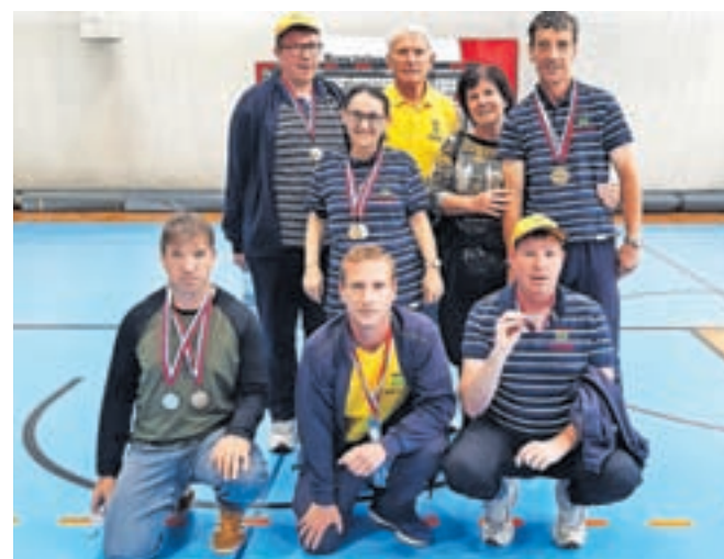
Ekipe državnih iger specialne olimpiade

»Na državnih igrah, turnirjih, je najpomembnejše, da tekmujejo skupaj, da spoštujemo druge in da spoznavamo prijatelje. Tako se bomo vsi dobro počutili,« pri tem poudarja Markelj, ki je izrazil tudi zahvalo trenerjem in drugim delavcem, ki s športniki oziroma društvom sodelujejo na različnih področjih, pa seveda tudi staršem, spremljevalcem in navijačem.