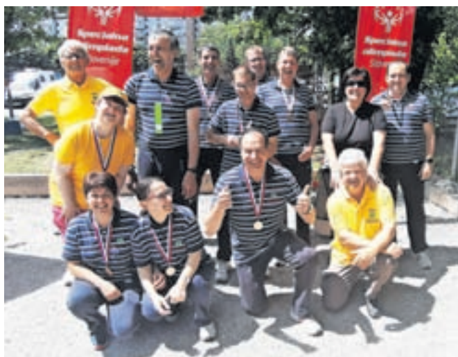
Udeleženci državnega balinarskega turnirja Specialne olimpiade Slovenije