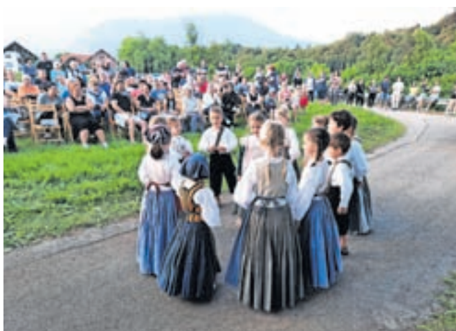
Tradicionalna prireditev z naslovom O kresi se dan obesi je na slikovito prizorišče pri arheološkem najdišču Villa rustica v Mošnjah tudi tokrat privabila številne obiskovalce.

Turistično društvo Mošnje sicer tradicionalno vse leto