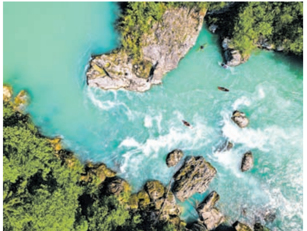
Brzica Kredar na Savi pri Radovljici