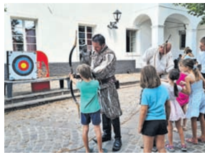
Obiskovalci so se lahko pomerili tudi na lokostrelskem turnirju.

men je oživljanje spomina na pot, ki jo je v 13. stoletju prepotoval Ulrik Liechtensteinski. Popotovanje po 52 mestih sedanje Češke, Avstrije, Italije in Slovenije je opisano v avtobiografski pesnitvi Ženska služba. Ulrik je bil med potovanjem namreč preoblečen v boginjo ljubezni Venero. Slavni vitez je nekaj časa preživel tudi na gradu Kamen pri Begunjah.