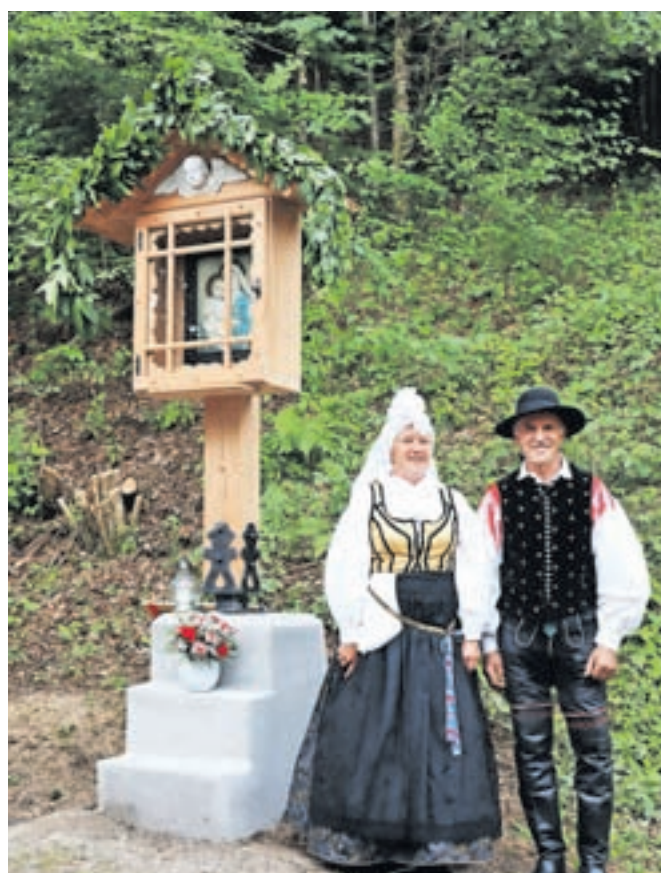
Obnovljeno znamenje v Kamni Gorici

Brezje in znamenje ob cesti skozi Kamno Gorico, ki ga je poslikal pranečak Matevža Langusa.