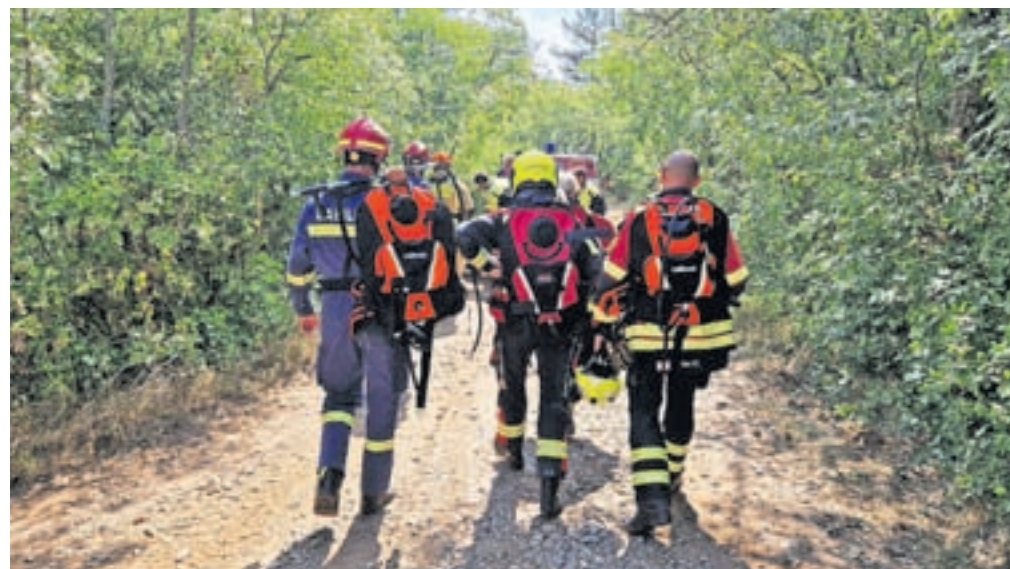
Tudi radovljiški gasilci so se pridružili številnim kolegom iz vse Slovenije, ki so priskočili na pomoč ob nedavnem uničujočem požaru na Krasu.

Pri gašenju je pomagala policija, ki je zaprla vse ceste za lažje bojevanje z ognjenimi zublji, pri delu pa je uporabila tudi vodni top, ki se je, kot