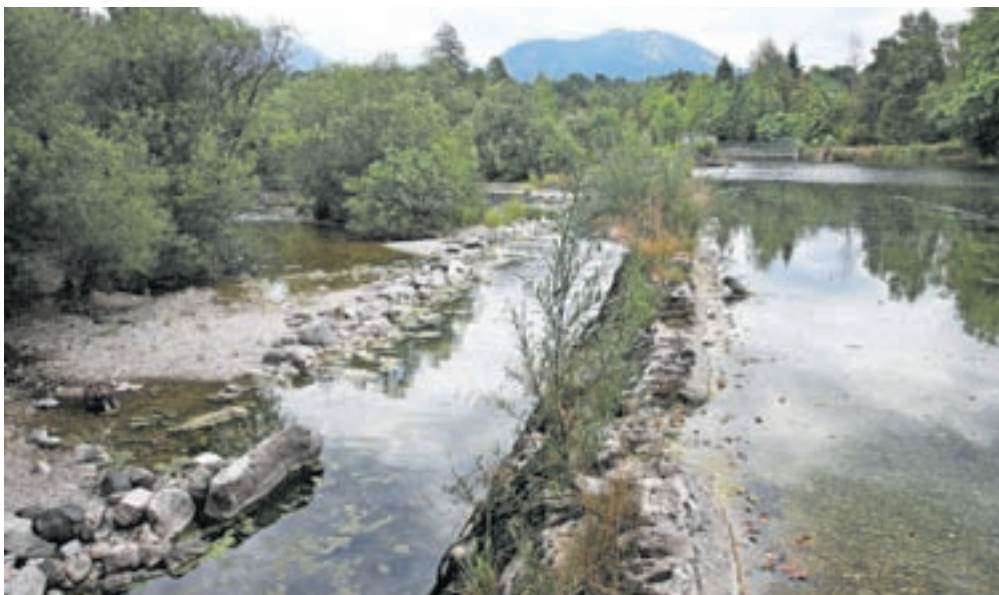
Tako kot pred nekaj leti se iz Save Bohinjke nad sotočjem pri Lancovem spet širi smrad, na jezu se nabira gošča.

O stanju so obvestili občinsko redarstvo in inšpektorat, ki se je odzval s prijavo na okoljsko inšpekcijo. Na okoljskem inšpektoratu ugotavljajo le, da informacija, ki so jo prejeli o onesnaženju Save Bohinjke na Lancovem, nakazuje na to, da težava verjetno nastaja zaradi tre-