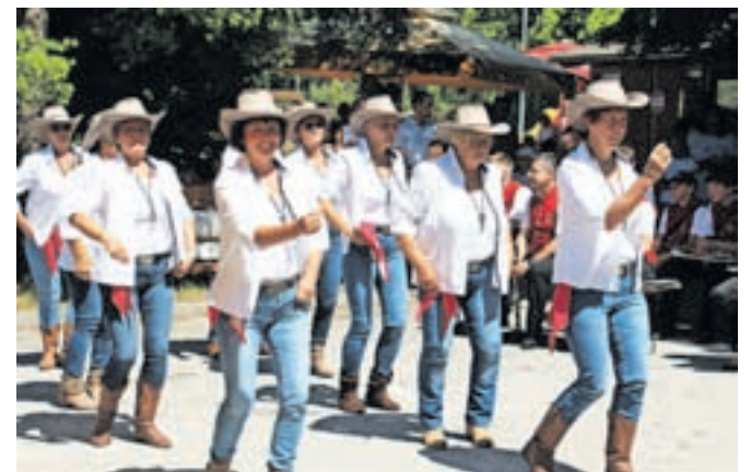
Sodelovali so še domače kulturno društvo, folklorni skupini in plesna skupina Country č'bele.

V sklopu prireditve je Turistično društvo Begunje pripravilo že deveto Begunjsko avanturo – rekreativno, pohodniško in zabavno prireditev z zanimivimi in sproščujočimi točkami na poti, povezanimi s spoznavanjem kraja in okolice, popoldan pa se je Urhov semenj na prizorišču nasproti Avsenikove domačije nadaljeval z druženjem ob glasbi ansambla Gorenjski kvintet.