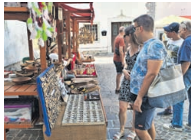
Na stojnicah je bil razstavljen in naprodaj pester izbor izdelkov znanih in priznanih rokodelcev.