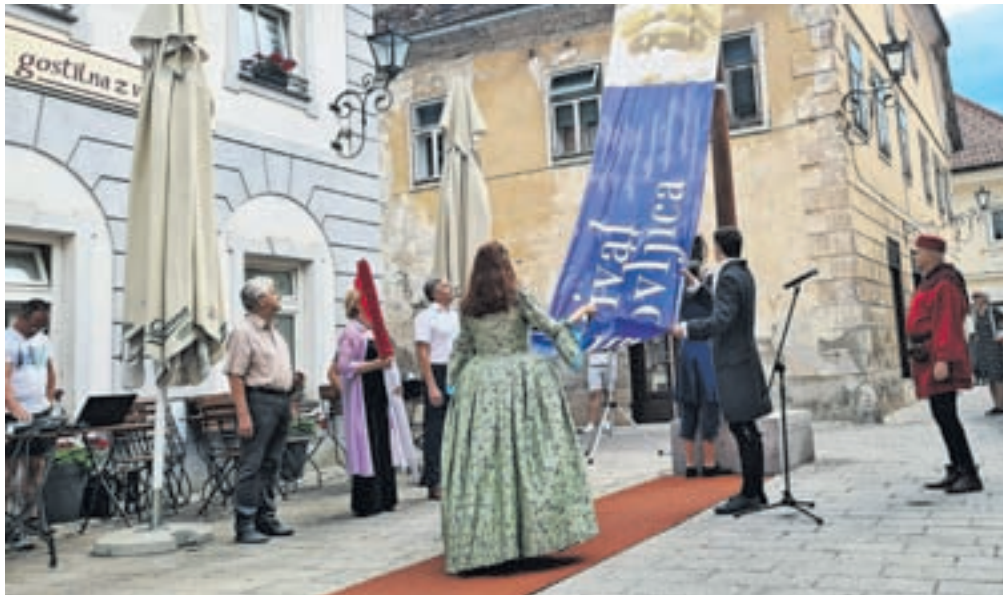
Z dvigom festivalske zastave na Linhartovem trgu se je prejšnji petek začel jubilejni, 40. Festival Radovljica 2022.