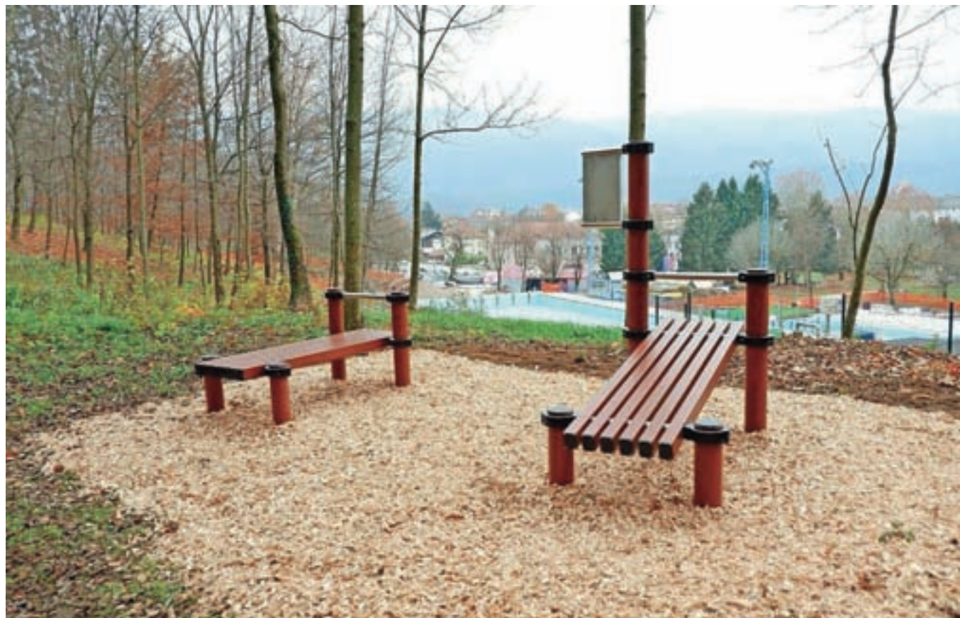
Na Obli gorici je že nameščenih šest telovadnih točk in informacijske table z opisi vaj. Osnovna informacijska tabla ob vstopu na območju Oble gorice bo zaradi bližnjega gradbišča postavljena spomladi.

Opis projekta: Na križišču Dežmanove ceste in Hraške ceste pri OŠ F. S. Finžgarja Lesce je prehod za pešce, ki ga uporabljajo otroci, ki prihajajo v šolo, pa tudi krajani. Ker je območje prometno obremenjeno, je predlagano,