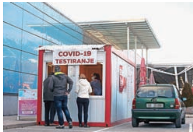
Testiranja opravljajo v Zdravstvenem domu, pa tudi po nekaterih drugih lokacijah po občini.

Za nosečnice je priporočljiva uporaba cepiv mRNA, ker je za ta cepiva trenutno na voljo največ podatkov o varnosti in učinkovitosti pri nosečnicah, pojasnjuje Leskovarjeva. "Tveganje za hujši potek covid-19 je pri nosečnicah do štirikrat večje kot v skupini enako starih nenosečih žensk. Tako tuja kot slovenska perinatološka stroka je enotna: priporočajo cepljenje nosečnic, doječih mater in žensk, ki načrtujejo nose-