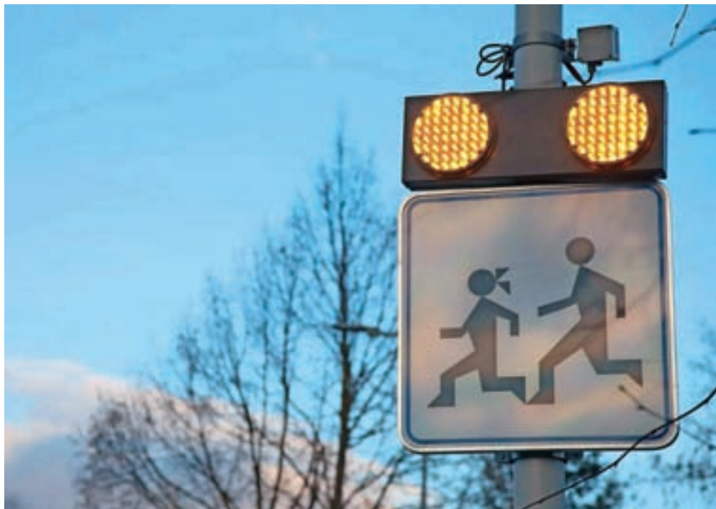
Osvetlitev in sistemska označitev prehoda za pešce na Dežmanovi ulici v Lescah sta bili izvedeni novembra lani.

da se na prehodu postavi utripajoč znak za prehod za pešce, s čimer bo zagotovljena večja varnost pešcev in varnejša šolska pot.