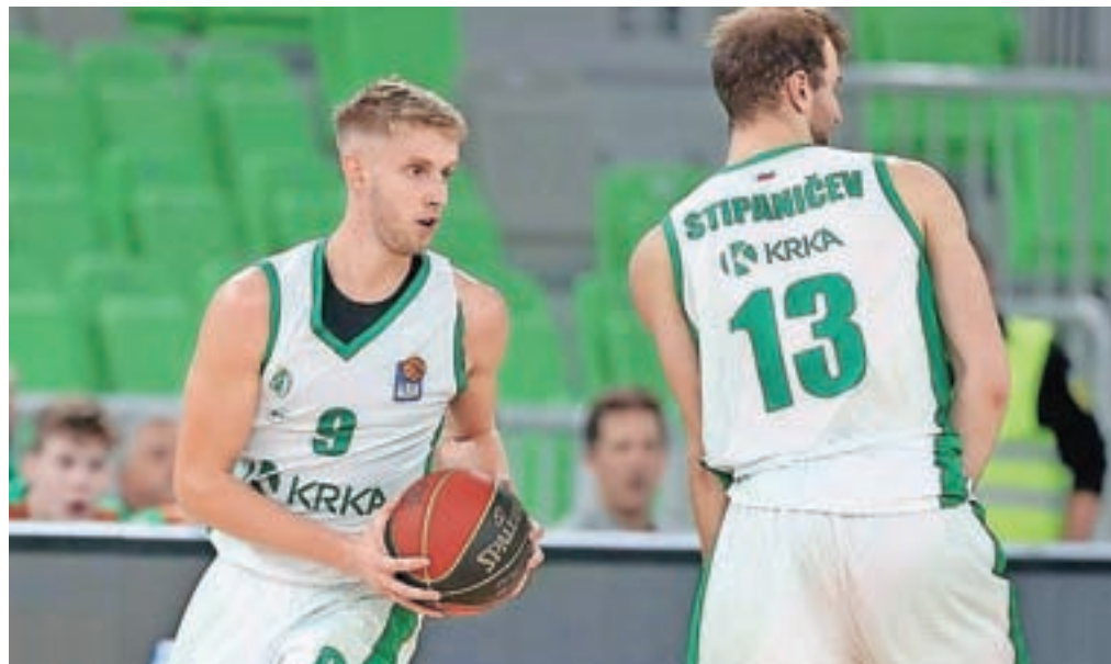
V dresu novomeške Krke

sim za kakršenkoli nasvet, mi z veseljem pomaga in svetuje.