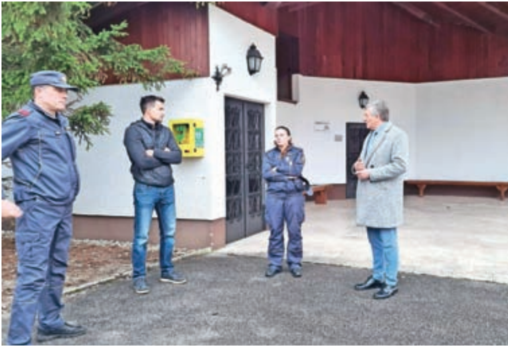
Avtomatski eksterni defibrilatorji so bili v vseh petih predlaganih krajih v KS Podnart, tudi na Ovsišah, nameščeni lani.

AED (avtomatskih eksternih defibrilatorjev) je ključnega pomena za reševanje življenj krajanov, kajti bistveno skrajša čas od vpoklica prvih posredovalcev do uporabe enote AED pri pacientu. Zato se predlaga nakup petih AED-enot s postavitvijo v krajih Poljšica, Ovsiša, Prezrenje, Zaloše in Rovte.