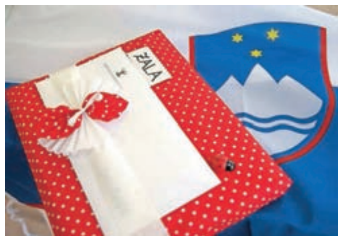
Knjižnemu darilu bo še naprej priložena slovenska zastava.

pomoč, nakazano na račun. Vrednost se zvišuje, in sicer na 200 evrov za prvega, 250 za drugega in 300 evrov za tretjega ter vsakega nadaljnjega otroka.