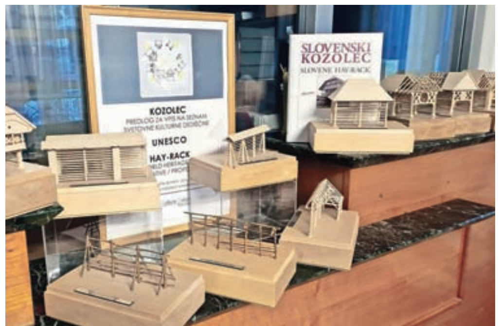
Razstava bo konec marca spet na ogled, tokrat na sejmu Alpe-Adria na Gospodarskem razstavišču v Ljubljani, kjer je doslej gostovala že petkrat.