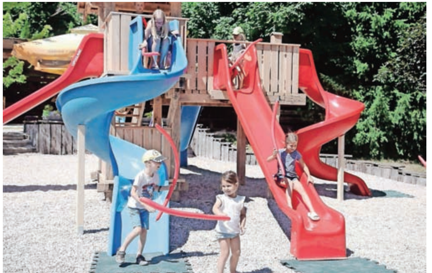
Projekt obnove otroškega igrišča Krpin je bil v sodelovanju z družbo Elan izveden v letu 2021, za igrišče je pridobljena tudi izjava o skladnosti z varnostnimi standardi.

Stanje: V letu 2021 je bil izveden ogled na terenu za določitev točke priklopa na obstoječe omrežje javne razsvetljave ter pripravljen predlog poteka kabelske kanalizacije za javno razsvetljavo in lokacij za postavitev svetilk. Po pridobitvi soglasij lastnikov zemljišč je izvedba predvidena v letu 2022.