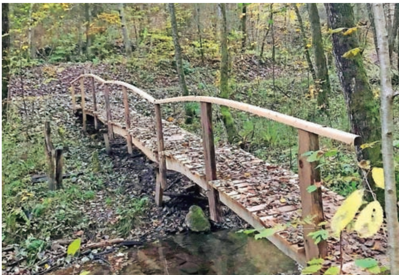
Vodna učna pot Grabnarica je bila obnovljena v letu 2021. Zamenjani so bili vsi dotrajani elementi, predvsem mostovi in ograje.

Opis projekta: Razvejana mreža razpoložljivih aparatov