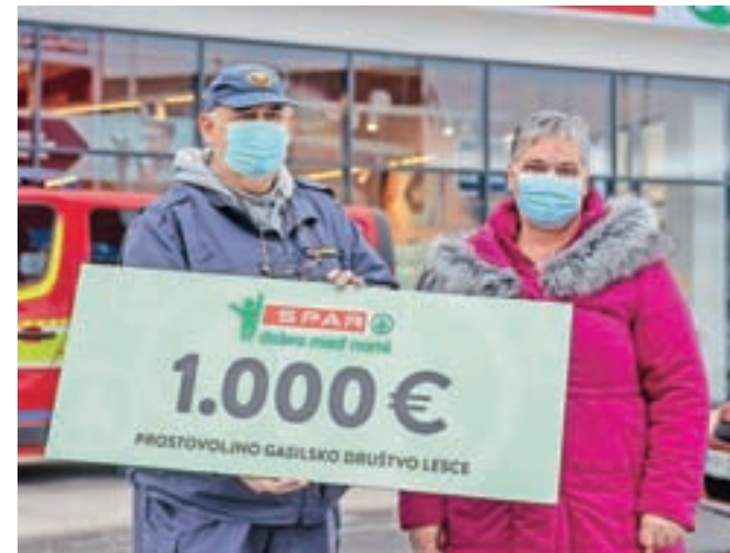
Med tremi lokalnimi organizacijami, ki so prejela donacijo ob odprtju nove trgovine, je tudi Prostovoljno gasilsko društvo Lesce.

zaposleni izbrali tri organizacije, ki jim je namenjena donacija, kupci pa so z glasovanjem določili višino sredstev, ki jih je prejela posamezna organizacija. Za donacijo v višini 1.500 evrov so izglasovali Varno hišo Gorenjske, ki bo sredstva namenila nakupu oziroma za mame in otroke, žrtve nasilja. Donacijo v višini tisoč evrov je prejelo Prostovoljno gasilsko društvo Lesce za nakup novega vozila, petsto evrov pa Center za usposabljanje, delo in varstvo Radovljica, ki bo sredstva namenil nakupu igral ter športnih pripomočkov.