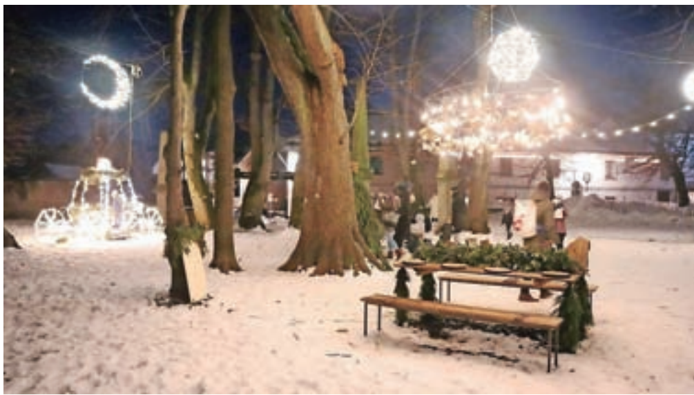
Čarobna decembrska družinska dogodivščina Potep k vilinskemu drevesu popelje po štirih točkah v mestu in se zaključi v pravljicnem parku s kočijo in praznično mizo.

"Na poti iz parka v mesto, ob krožišču pred mestnim jedrom, ne pozabite zaviti v čokoladnico Radolška čoko-