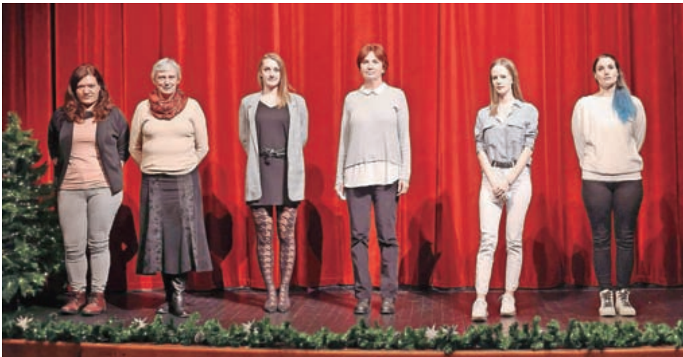
ProstoVOLJKJE v Domu dr. Janka Benedika

Učenci soustvarjajo različne prireditve, kot so proslave krajevnega praznika, prireditve ob materinskem dnevu in novem letu. V času epidemije se je šola uspešno prilagodila delu na daljavo ter s pomočjo staršev in učencev izvedla