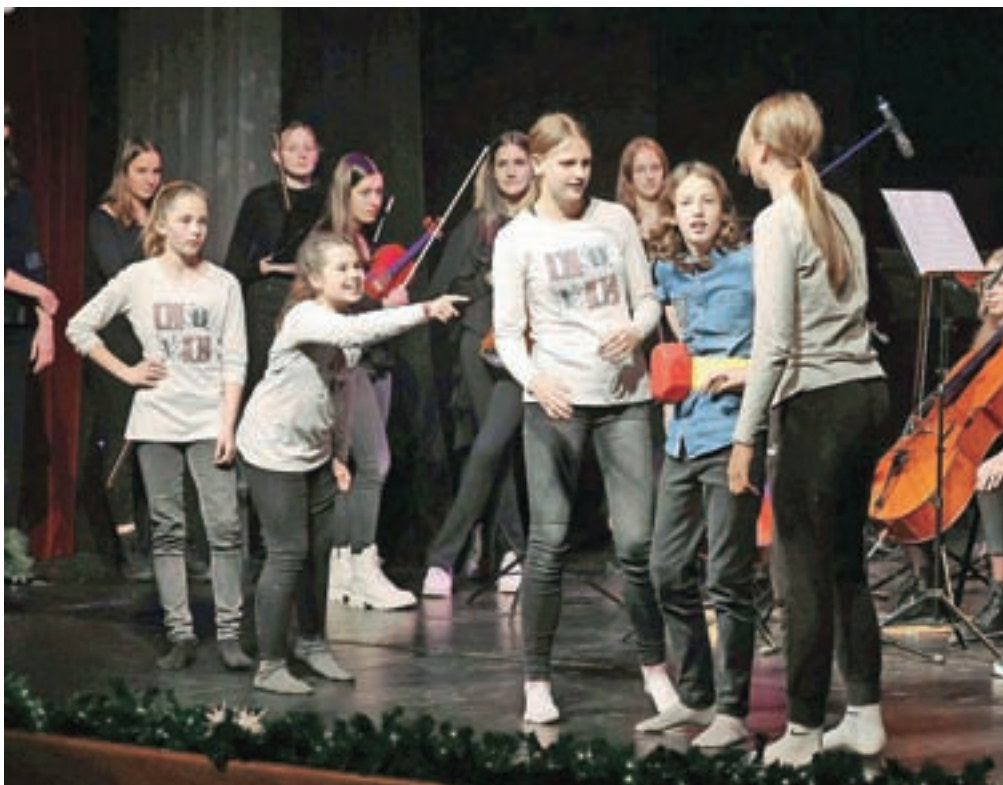
V programu je sodelovala dramska skupina Linhartovi čuki.