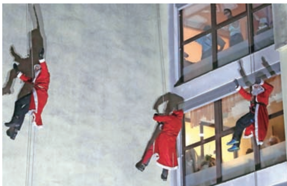
V veliko veselje stanovalcev, zaposlenih in obiskovalcev so se nekaj dni pred božičem z vrha domske stavbe spustili trije Božički.