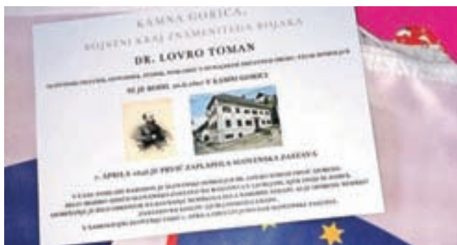
Voščilnicam, ki so jih prejeli v vseh gospodinjstvih, so letos dodali še zastavo, prijazen nagovor in posvetilo.