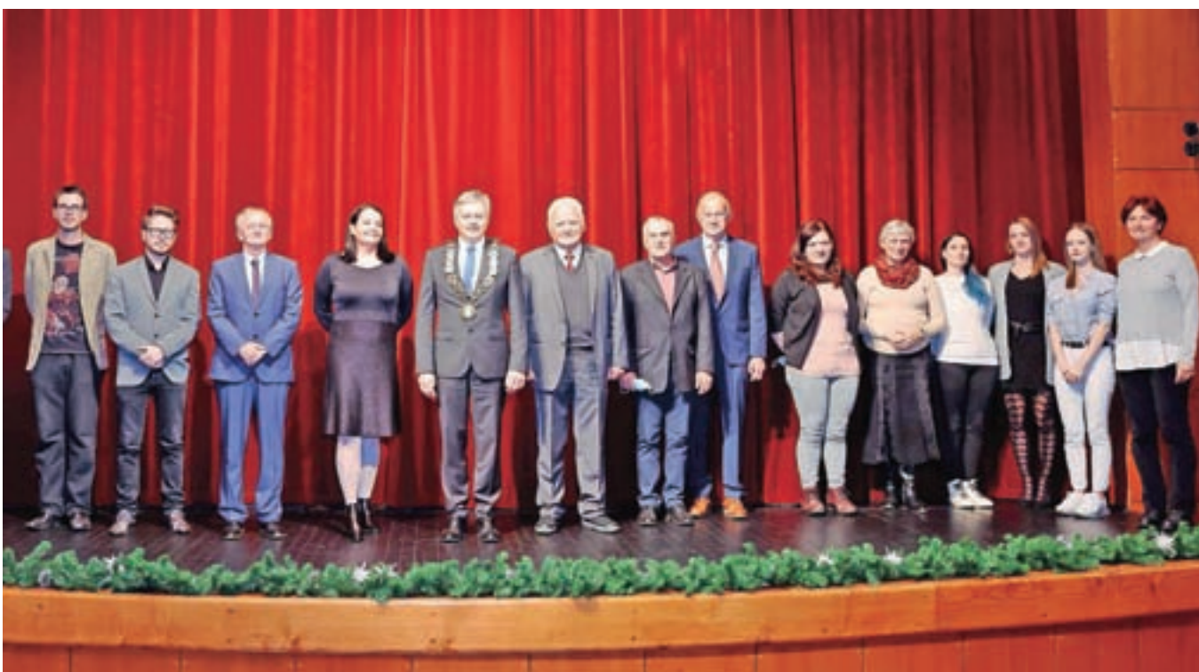
Nagrajenci z županom na odru Linhartove dvorane, kjer so na predvečer občinskega praznika prejeli občinska priznanja