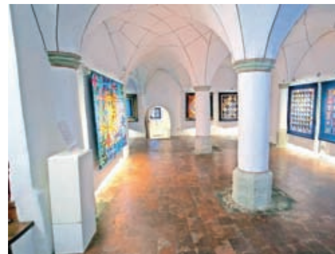
Razstava krpank je v galeriji Šivčeva hiša na ogled še do prihodnjega četrтка, 6. januarja.