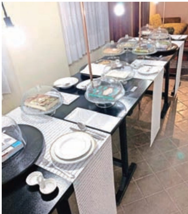
Knjige so predstavljene na mizi, pod pokrovi steklenih posod za pecivo, na prtih pa so natisnjeni Ivačičevi recepti.

Knjige so po zaslugi oblikovalke Tanje Devetak predstavljene malo drugače, kot je običajno pri muzejskih postavitvah. So na mizi, pod pokrovi steklenih posod za pecivo. Na prtih so natisnjeni njegovi recepti, mizo pa krasijo tudi krožniki in pribor, ki je bil v uporabi v časih, ko je kahal mojster