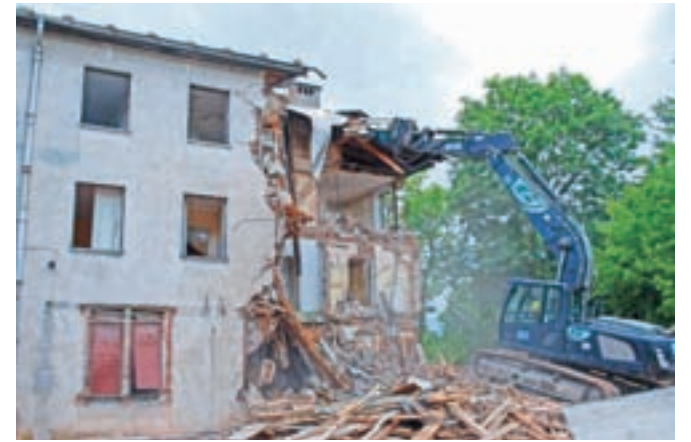
Skoraj osemdeset let staro stavbo ob radovljiškem vrtcu, ki je bila v osnovi zgrajena kot stanovanjska vila, po drugi svetovni vojni pa je bil v njej zdravstveni dom ter kasneje center za socialno delo in uprava vrtca, so v soboto porušili.

Na objektu so bili vgrajeni portali iz tufa iz sedemnajstega stoletja. Te so še pred rušitvijo stavbe skrbno odstranili in shranili. Celotno območje se bo po rušitvi objekta zatravilo, prostor pa bo namenjen za nadaljnje potrebe vrtca, so še pojasnili na radovljiški občinski upravi.