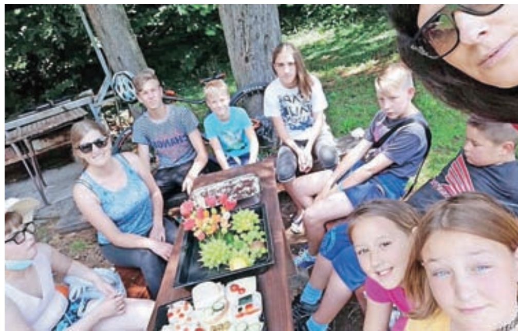
Ob spoznavnih igrah so prebili led, se spoznali in povezali, v naslednjih dneh pa postali že pravi prijatelji.

Otroke in mladostnike še vedno vabijo, da se jim pridružite. "Da se z nami naučite kaj novega, zabavnega, uporabnega, spoznate nove prijatelje in si popestrite počitniške dni. Spremljate nas lahko na spletni strani, FB-strani in profilu na Instagramu Mladinskega dnevnega centra KamRa. Za vse informacije in prijave pa smo vam na voljo na info@kamra-radovljica.si in telefonski številki 040 823 003."