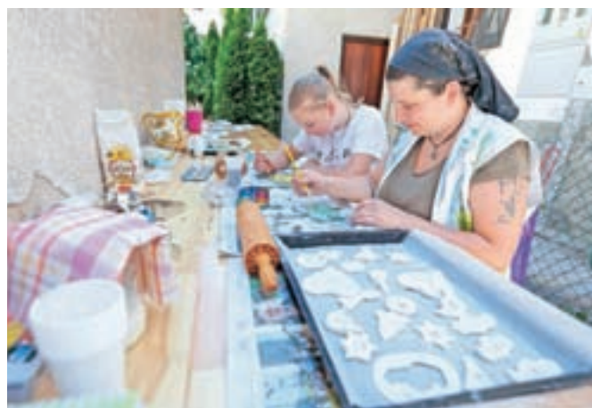
Program je bil razmeram navkljub zelo pester, letos prvič tudi na t. i. gosposki ulici.