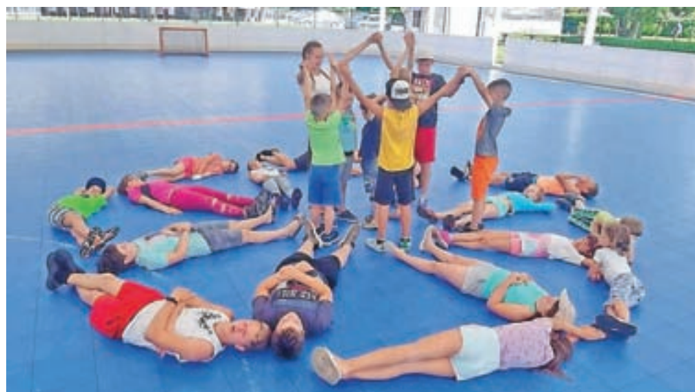
Veliko so se gibali zunaj, v naravi in ob športnih aktivnostih.