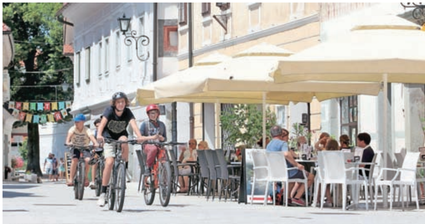
Destinacije v radovljiški občini obiščejo številni turisti, letos predvsem iz Slovenije, domačini pa imajo priložnost uživati v poletnem utripu mesta in lepotah narave.

bo turističnih bonov, ideje za družine in pakete za kulnarični oddih. Destinacije v radovljiški občini tako vendarle obiščejo številni turisti, letos predvsem iz Slovenije, domačini pa imajo priložnost uživati v poletnem utripu mesta in lepotah narave.