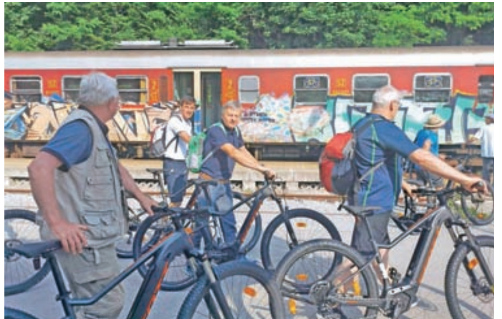
Zgornjegorenjski župani so kolesa na Bledu naložili na vlak in se odpravili v Posočje.