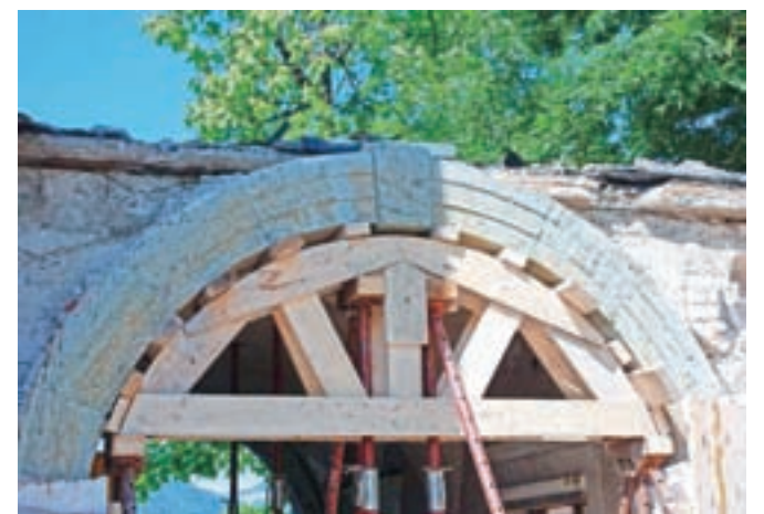
Portale iz 17. stoletja so s stavbe pred rušenjem odstranili in jih shranili, območje pa bo v nadaljevanju zatravljeno in namenjeno potrebam vrtca.

NAJBOLJŠA PONUDBA ZA VAS v salonu JUNIK-M, d.o.o., na JESENICAH!