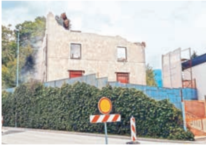
Stavba brez večjih rekonstrukcijskih posegov ni bila več primerna za daljšo uporabo, zato se je občina odločila, da jo poruši.

Od konca druge svetovne vojne do sredine sedemdesetih let je bil v stavbi zdravstveni dom, kjer so ambulante radovljiških zdravnikov delovale, vse dokler niso v