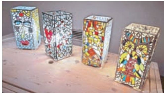
Na eni od delavnic so izdelovali lučke v steklenem mozaiku.

gramiranja, ponavljali angleščino in izrazili svojo kreativnost pri ustvarjalnicah. Ker tudi med počitnicami radi izvedemo kaj novega in se kaj naučimo, smo obiskali Lekarniški in alkimistični muzej Radovljica, Čebelarški razvojno-izobraževalni center Gorenjske in se s TIC Radovljica podali na voden ogled mesta. Da nam ni zmanjkalo energije, je