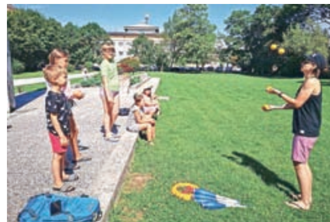
Začeli so tudi tečaj žongliranja.

poletje spodobi, pa smo si privoščili tudi skok v vodo in veliko čofotanja v Kampu Šobec, Bazenu Radovljica in ob Savi. Veseli smo, da se otroci tako veselijo aktivnosti in da so največ navdušenja požele športne igre in aktivnosti na prostem. Otroci so spoznali in se navdušili nad igro softball, se razmigali ob jogi, bili zagnani pri tekmovanjih, štafetah in poligonih, se potrudili pri miselnih igrah, se učili pro-