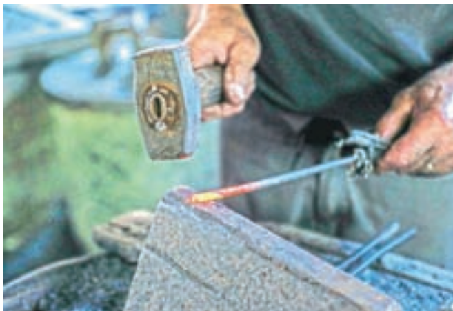
Odprt je bil tudi vigenjc Vice, kjer so mojstri obrti pokazali, kako so nekoč ročno kovali žeblje.

Odprt je bil tudi vigenjc Vice, kjer so mojstri obrti pokazali, kako so nekoč ročno kovali žeblje, prireditev pa se je proti večeru zaključila z nastopom Pihalne godbe Vodice. Letos so se posebej izkazali