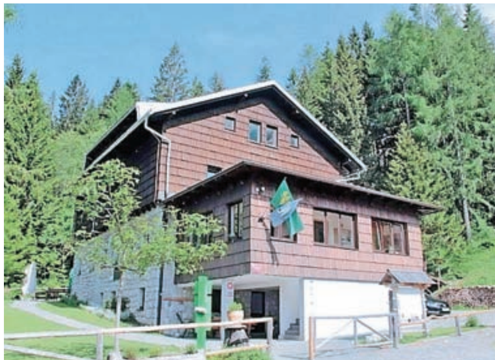
Valvasorjev dom pod Stolom

Dom je odprt vse dni v letu, pozimi od sedme zjutraj do osme zvečer, v petek in soboto do devetih, poleti pa od šestih zjutraj do desetih