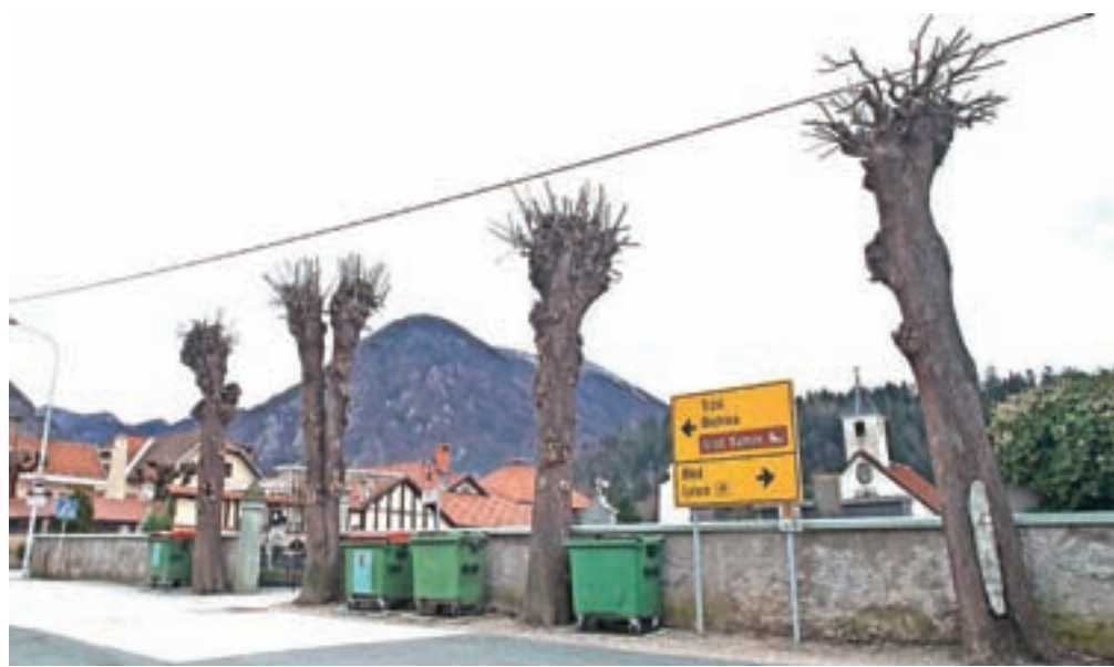
Nestrokovno obrezana drevesa v Begunjah

Kot so na občinski upravi zapisali v odgovoru svetnici, je občina z namenom doseganja še višjih standardov na področju ravnanja z odpadki s Komunalo Radovljica in združenjem Ekologi brez meja pristopila k mednarodni zavezi Zero Waste. Odbor za spremljanje aktivnosti zaveze je na zadnjem sestanku med drugim razpravljal tudi o uporabi bombažnih nakupovalnih vrečk. "Bombažne vrečke se pojavljajo na trgu v različnih oblikah in akcijah. Večina gospodinjstev tako s takšnimi vrečkami že razpolaga. Občina kot promocijsko darilo uporabljata tudi vrečke iz blaga s potiskom Vurnikovih vzorcev. V naši občini je vzklila tudi zanimiva pobuda, to je izdelava vrečk za nakup sadja in zelenjave iz rabljenih zaves. Vrečke so lično oblikovane in opremljene z okoljskim spo-