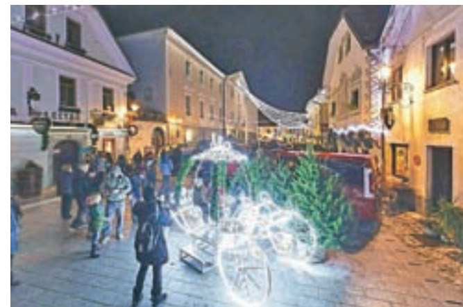
Otroci so navdušeni nad prazničnim vzdušjem na trgu.

ljev od 14. do 17. ure ter od 17. do 20. ponudba ulične hrane Okusov Radol'ce. Ob 17.30 se bo začel koncert priljubljenega Andreja Šifrerja, med peto in sedmo popoldan pa bo v graščini delavnica in poslikava obraza. V nedeljo, 29. decembra, ob petih na trg prihaja Ana Snežna, ob 18. uri pa se bo začelo Radovljiško koledovanje s pevske skupinami in Linhartovim odrom.