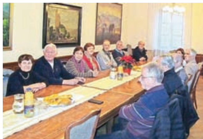
Prostovoljci na delovnem srečanju na občini