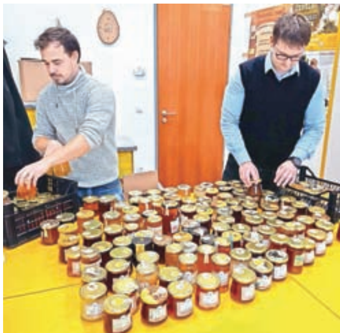
Med so zbirali v Čebelarškem razvojno izobraževalnem centru Gorenjske.

kovna sodelavka z Rdečega križa, Območnega združenja Radovljica, je prepričana, da so čebelarji marsikateri družini vsaj nekoliko polepšali praznične dni: "Hvala vsem čebelarjem, ki so prispevali med in s tem osrečili