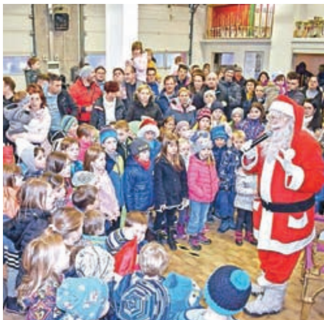
Božiček se je tokrat v Begunje pripeljal kar z gasilskim vozilom.

Po nekajdnevem deževju in brez snega se je na obisk otrok v Begunjah dobri mož pripeljal kar z gasilskim vozilom. Otroci so ga bili veseli, še bolj daril, pa tudi lutkovna predstava jih ni pustila ravnodušnih. Za obisk Božička in obdarovanje so poskrbela domača društva in organizacije s pomočjo različnih donatorjev.