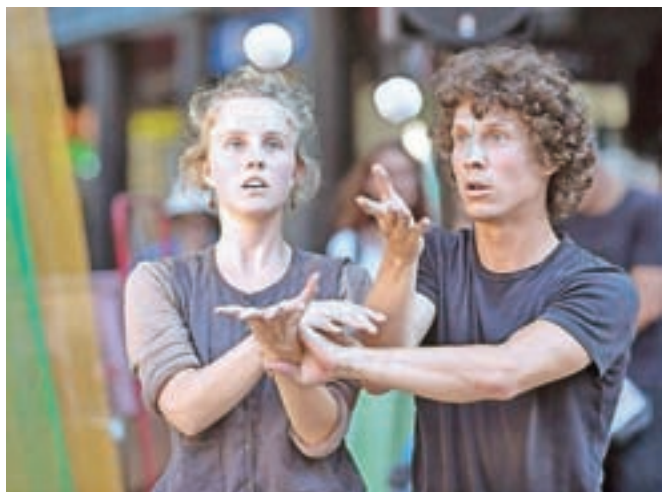
Predstava Undertree, ki združuje žongliranje, manipulacijo predmetov, gibanje in glas, bo na sporedu v nedeljo.

Radovljica, pa ob tem pripravljajo bogat program kulturnih in zabavnih dogodkov. Tako bo danes ob 16. uri nastopila Folklorna skupina Lesce, uro zatem pa bo otroke v graščini razveselil Dedek Mraz, ki ga je v Radovljico povabilo domače turistično društvo. V soboto bodo otroci lahko od 12. do 15. ure uživali v pravljčnih konjih z ranča Sitar, sledila bo Kroparska delavnica izdelovanja žeb-