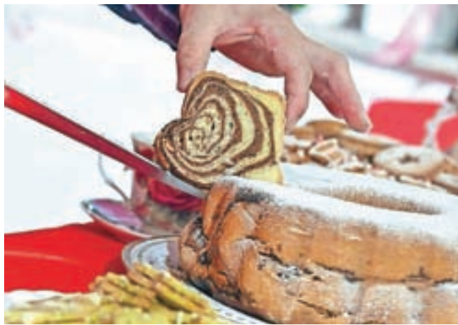
Rožičeva s figami in dateljni, za katero je lani dobila naziv najbolj kreativna potica, letos pa je zanj dobila še dva naziva: najbolj inovativna in najboljša potica po izboru publike

Ko je pečena, jo pustimo še nekaj časa v modelu, potem pa jo zvrnemo na desko, da se počasi do konca ohladi.