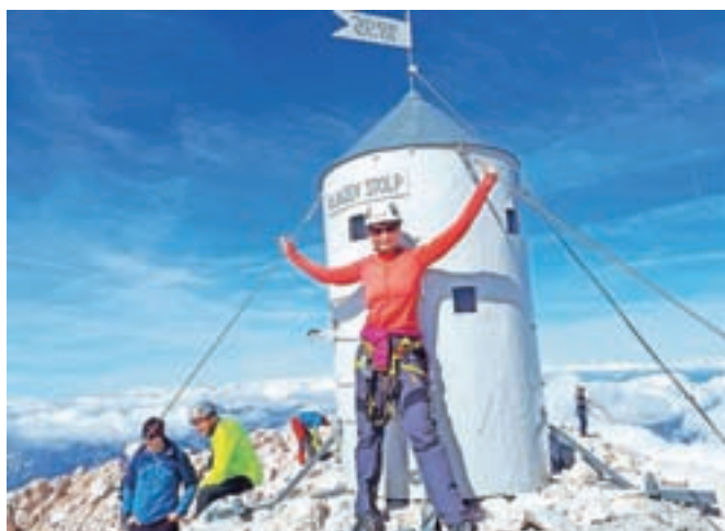
Le nekaj dni po tem, ko je postala slovenska državljanica, se je povzpela na Triglav in se tako še na simboličen način povezala z novo domovino.

obrok v dnevu kosilo. Pravi, da je po njem zaspana in težko zbrano dela naprej. Ne kuha goveje juhe, našo navado nošenja copat je pa hitro vzela za svojo. Ko sem jo obiskala, me je tipično slovensko pozdravila s: »Kaj ti lahko ponudim?« »Čaj,« sem odgovorila in priznam, na tihem pričakovala pravega, angleškega. »Zeliščnega ali sadnega?« je bila vsa izbira, ki sem jo imela na voljo. Črnega z mlekom, pravi, ni nikoli pila.