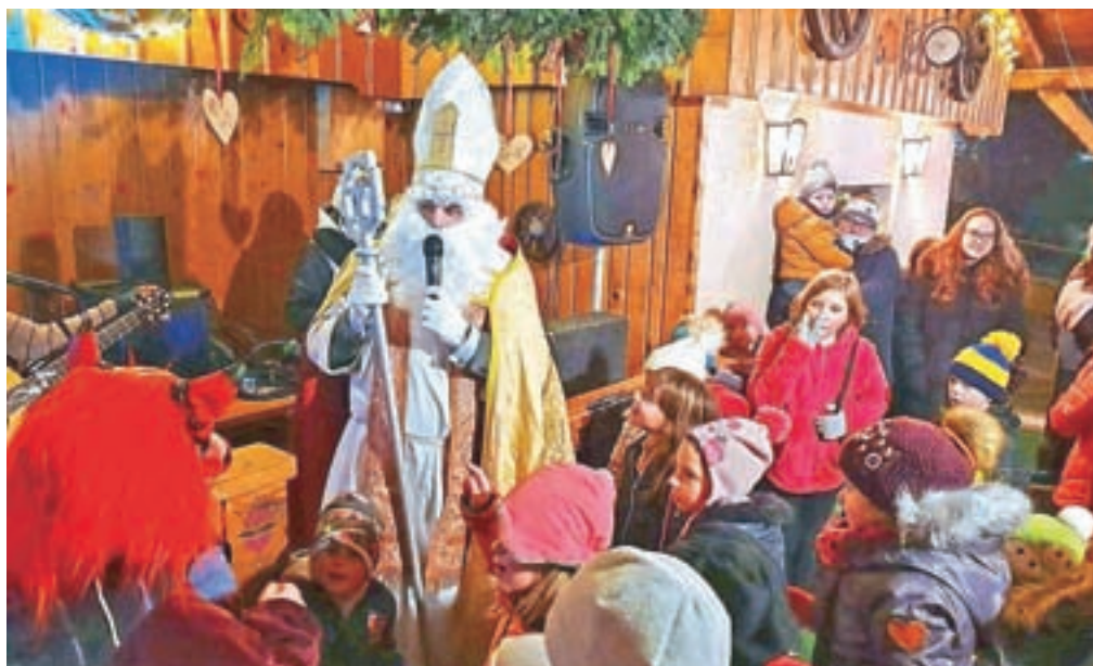
Leščani so se na Miklavžev večer družili na prostoru pri Majdneku.