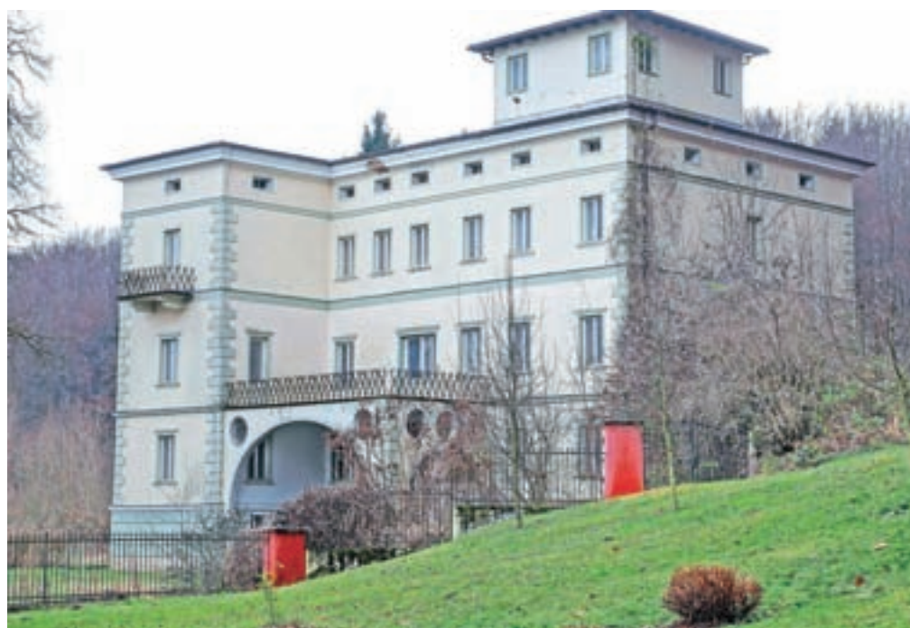
Propadajoči dvorec bi radi spremenili v butični hotel, zraven pa na posestvu zgradili še okoli sedemdeset apartmajskih enot.