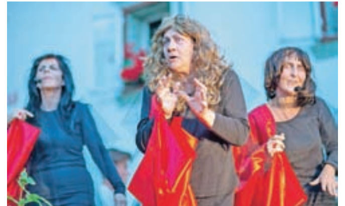
V nedeljo, 29. decembra, bodo domači gledališčniki na oder kulturnega doma spet postavili Lov na čarovnice.

"Literarno-glasbeni večer, na katerem so nastopili člani dramske skupine Čofta in