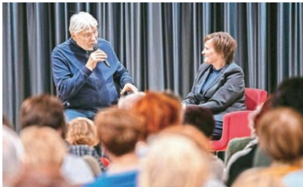
Gost večera Boris Cavazza je pritegnil ogromno obiskovalcev, ki so popolnoma zapolnili dvorano Knjižnice A. T. Linharta Radovljica.