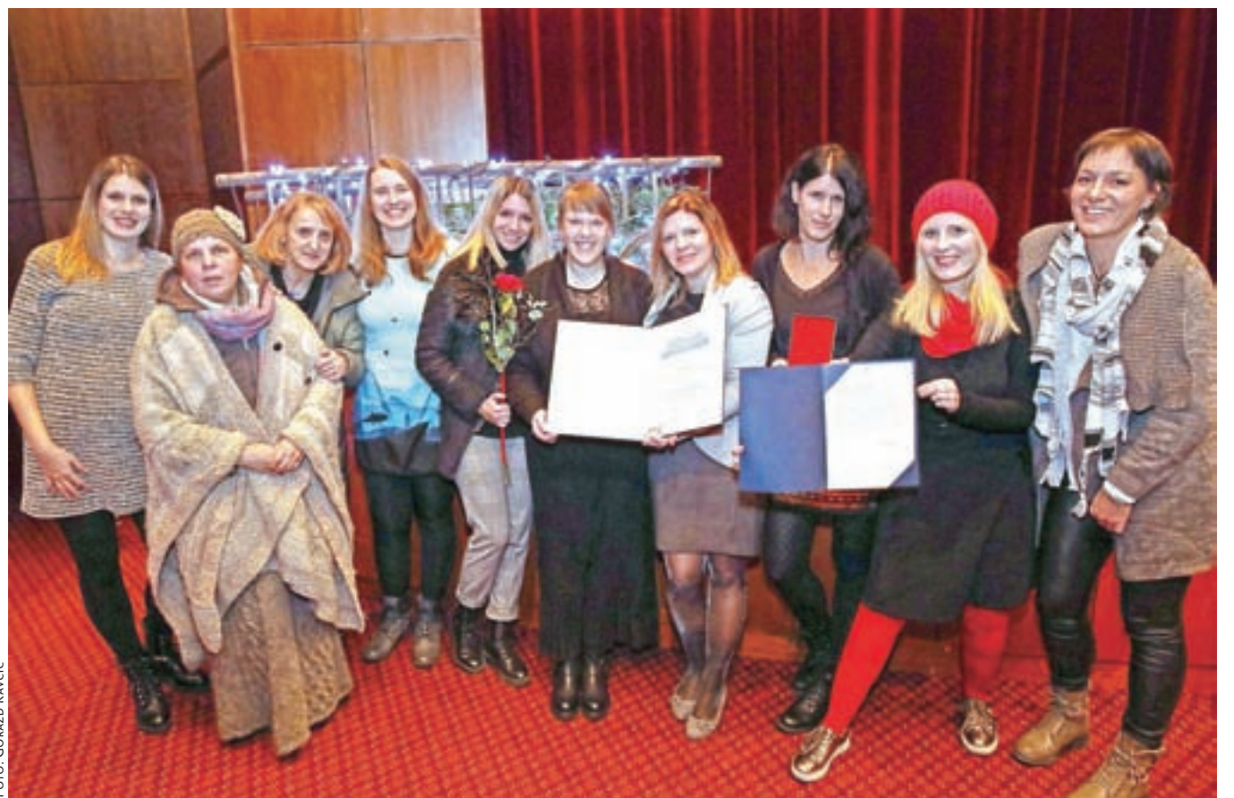
Takole so se priznanja ob 60-letnici delovanja razveselili na Ljudski univerzi Radovljica.

Deželne novice izhajajo enkrat na mesec v nakladi 23.400 izvodov, brezplačno jih prejemajo vsa gospodinjstva in drugi naslovniki v občini Radovljica, priložene so tudi izvodom Gorenjskega glasa. Tisk: Delo, d. d., Tiskarsko središče. Distribucija: Pošta Slovenije, d. o. o., Maribor. Deželne novice so vpisane v Razvid medijev pod zaporedno številko 315. Nenaročenih prispevkov in pisem bralcev ne honoriramo. Pisma bralcev so omejena na največ 3000 znakov s presledki. Prispevke za naslednjo redno številko, ki bo izšla v petek, 24. januarja 2020, morate oddati najkasneje do srede, 15. januarja 2020.