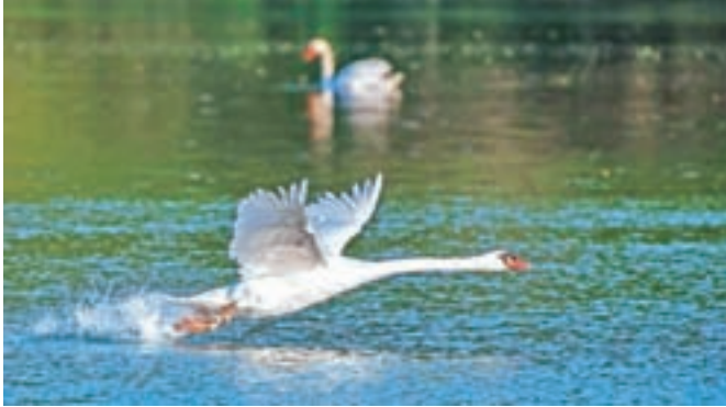
Labodov vzlet

V galeriji Pasaža v Radovljiški graščini je na ogled razstava fotografij članov Fotografskega društva Radovljica.