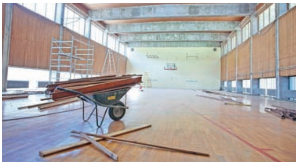
Izvajalec je ta teden že začel dela v športni dvorani.

Živimo na vasi in doma je vedno kakšno opravilo, če ne v hiši pa na vrtu ali njivi. Z mojim zelo rada hodiva v hribe, enkrat tedensko tudi na našo Lipniško planino. Poleg tega rada odkrivava kraje, kjer še nisva bila. In kot tipična učiteljica zelo rada tudi berem.