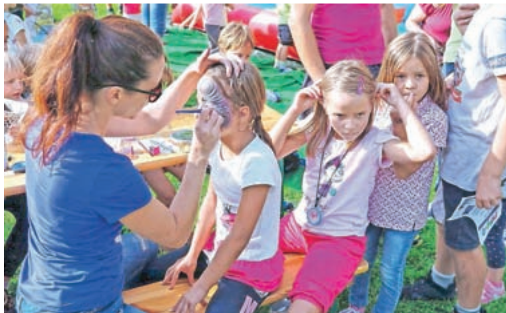
Ena najbolj obiskanih je bila delavnica poslikave obraza.