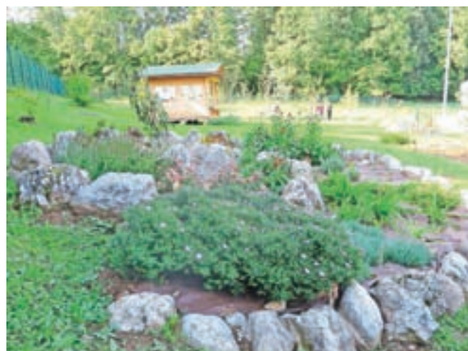
Kozmični skalnjak z medovitimi rastlinami, ena od letošnjih novosti na šolskem biodinamičnem vrtu