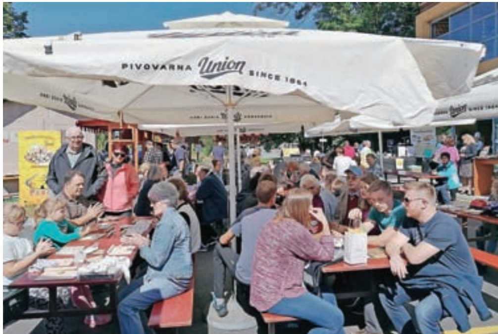
Živahno dogajanje pred čebelarstvom muzejem so popestrile družabne igre, delavnice, tržnica z bogato ponudbo pridelkov in izdelkov z lokalnih kmetij.

skovalci so bili navdušeni tudi nad letošnjimi novostmi, to sta bili delavnica izdelovanja jesenskih šopkov z dr. Sabino Šegula ter ogled sveta čebel skozi virtualna očala, ki ga je za obiskovalce v napihljivem čebelnjaku pripravila Čebelarstva zveza Slovenije. Kot je povedala Špela Razinger Kalan, je Festival medu poleg prireditve, namenjene promociji