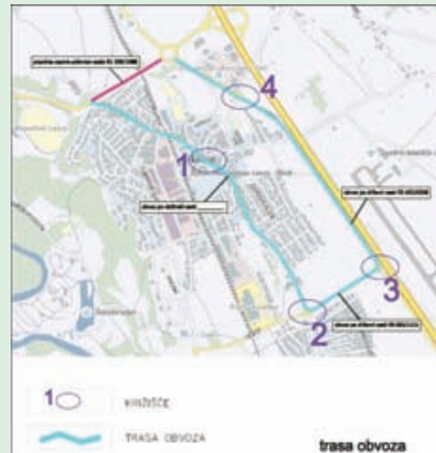
Trasa obvoza v času postavitve protihrupnih ograj

Obveščamo vas, da bo zaradi postavitve protihrupnih ograj popolna zapora prometnega pasu državne ceste R1-209/1088 Lesce–Bled iz smeri Bleda proti AC, od semaforiziranega križišča – smer Lesce do dvopasovnega križišča ob AC, pri Lescah, v obdobju od 1. 10. 2019 do 30. 11. 2019. Obvoz v času trajanja zapore bo urejen preko Lesca, po lokalni cesti LC 348033 "Lesce – stara državna c." in državnih cestah R3-635/1121 "Lesce–Kamna Gorica–Lipnica" ter R2-452/0208 "Lesce–Črni-vec".