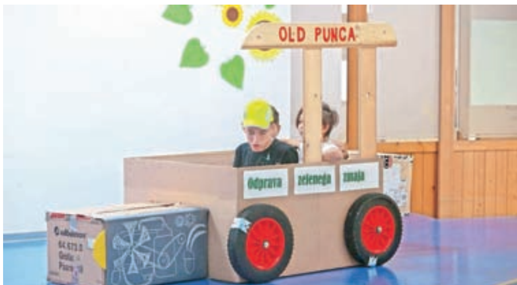
Leški osnovnošolci so na prireditvi za goste in vrstnike uprizorili kratek odlomek iz priljubljenega Preglovega mladinskega romana Odprava zelenega zmaja.