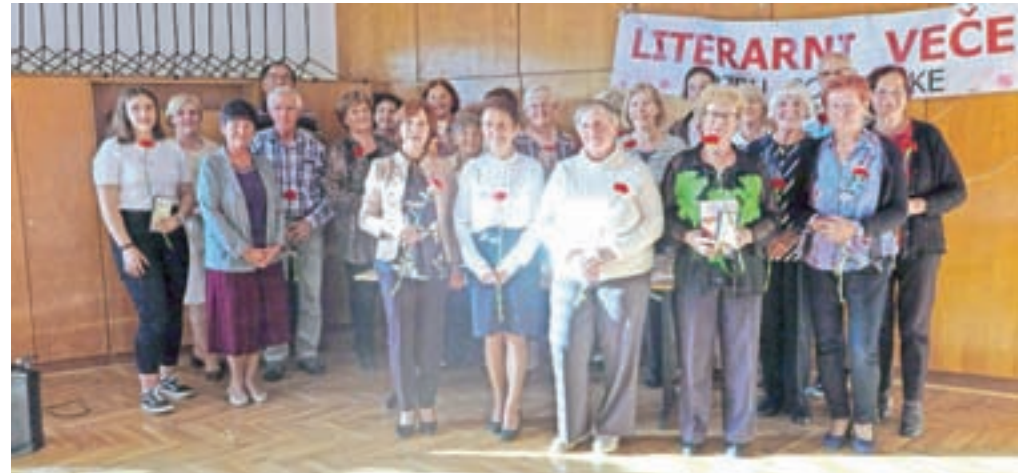
Udeleženci literarnega srečanja upokojencev, ki je bilo prejšnji teden v dvorani družbenega centra v Lescah