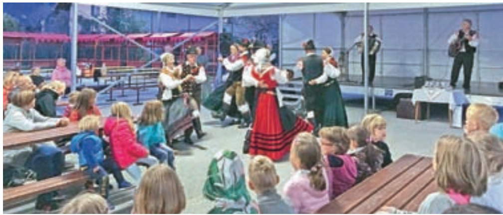
Petkov kulturni program je bil posvečen obujanju starih plesov in pesmi.

Mošnje, za otroke pa posljkavo obraza. Potekale so športne igre – prstomet, vlečenje vrvi in skakanje z vrečami, za glasbeno in plesno doživetje so poskrbele Kumske punce in Ansambel Saša Avsenika.