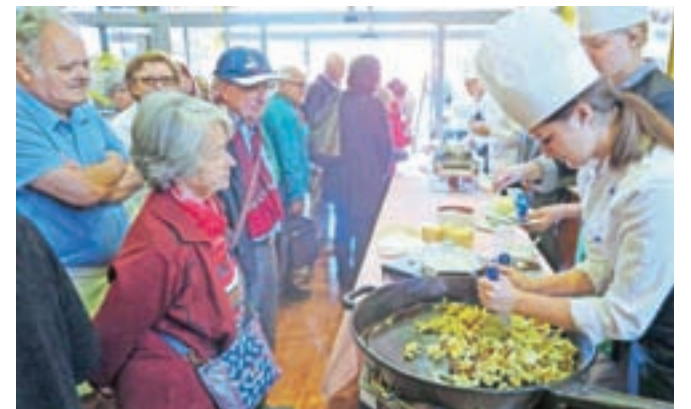
Dijaki srednje gostinske in turistične šole so postregli praženec in bučno juho.