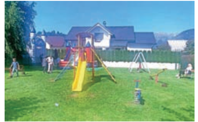
Prenovljeno otroško igrišče je bogatejše za nova igrala, poleg tega je ograjeno in varnejše za otroke.