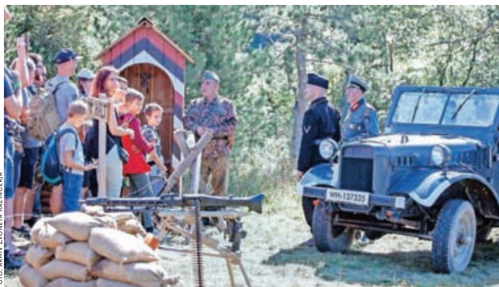
Na Festivalu vojaške zgodovine v Pivki so bili v uniformah nemške vojske.

Bitko so uprizorili tudi v Ribnici na Pohorju, oktobra pa že tretje leto zapored odhajajo v hrvaško Vižinad, kjer se vsako leto poklonijo spominu na film Kellyjevi junaki, ki so ga leta 1970 snemali prav v tej istrski vasi. V spomin na film, v katerem so nastopile filmske legende, kot so Clint Eastwood, Donald Sutherland in Telly Savalas, v Vižinadi namreč še danes uprizorjajo prizore iz filma, ki še vedno navdušuje ljubitelje tega žanra.