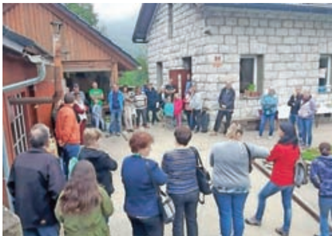
Na dnevu odprtih vrat Skupnosti Žarek, ki deluje v okolici Bohinjske Bistrice