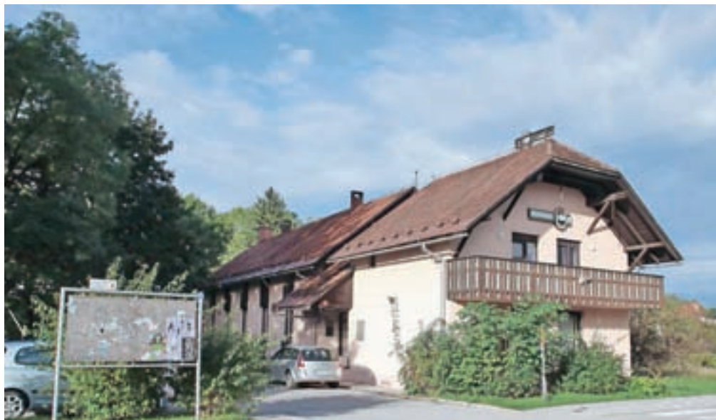
Pisarno društva upokojeencev so iz stavbe za policijsko postajo preselili v prostore na Gorenjski 25, to je stavba ob nekdanji knjižnici.

Prostore za upokojeence je občina zagotovila v objektu ob nekdanji knjižnici, pred časom na novo postavljeno streho nad baliniščem pa bodo prestavili na balinišče v starem športnem parku, to je v neposredni bližini nekdanjega doma TVD Partizan, ki je, čeprav ne v lasti občine, še ena velika prazna stavba v središču Radovljice. Zgrajena z udarniškim delom v času pred drugo svetovno vojno je kasneje z zakonom prišla v last Športne zveze Slovenije, ki jo je prodala zasebniku, ta pa naprej.