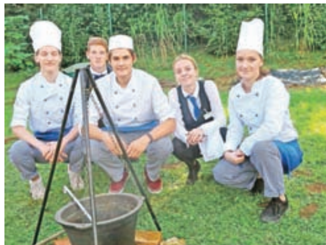
Mineštra s stročnicami in bučna juha, ki so ju pripravili dijaki srednje gostinske in turistične šole, sta še zlasti teknili kolesarjem in pohodnikom.

Gorenjske v Lescah in si ogledali Semenjalnico, ekološko hranilnico semen. V Semenjalnici hranijo več vrst semen stročnic, ki jih pridobijo od okoliških kmetov. Vsa semena se pridelujejo na ekološki način. Udeležencem so predstavili način pridelave in hranjenja semen. Skrbijo tudi za ohranjanje starih sort stročnic. Tako so letos skupaj z Inštitutom za ekosemena poskrbeli za vpis stare sorte visokega fižola, poimenovane kloster, v vrtničarsko sortno listo.