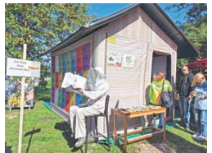
V napihljivem šotoru so si obiskovalci lahko skozi virtualna očala ogledali svet čebel.