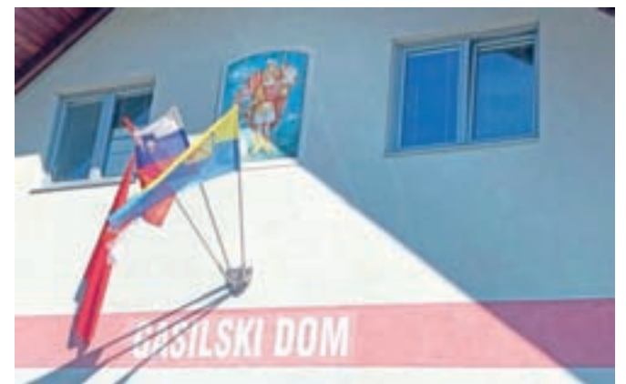
Odkrili in blagoslovili so fresko sv. Florjana na gasilskem domu.

lavo daroval petsto evrov. V soboto so obiskovalci okušali domače jedi, od ajdovih žgancev, štrukljev in jagrskega golaža do rib iz lokalne ribogojnice in podobno. Ponudili so tudi brezplačni ogled Etnološkega muzeja