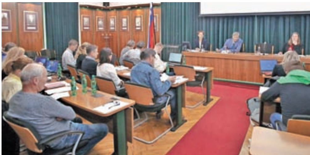
Občinski svet se je v sredo sestal na sedmi redni seji v tem mandatu.

Med naložbami, vključenimi v program, so rekonstrukcija Ceste za Verigo, ureditev priključka z regionalne ceste na Mlako, nadaljevanje obnove Ceste sodele, druga faza ureditve Šerčerjeve ulice v Radovljici, sanacija Gradnikove ceste in odseka Spar – Filipič Radovljici, ceste Prezrenje–Sp. Dobra va ter Lesce–Hlebece–Begunje, rekonstrukcija Železniške ceste v Lescah in Ljubljanske ceste v Radovljici, program sanacije lokalnih cest, ki se nanaša na usad na cesti v Mišačah in na Lancovem, ureditev priključkov občinskih cest na rekonstruirano državno cesto na Lancovem, obnovo ceste mimo Elana do pokopališča v Begunjah ter sanacijo cest Češnjica–Rovte in Brezje–Peračica, rekonstrukcija