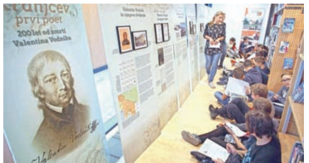
Razstava z naslovom Kranjcev prvi poet je v prostorih radovljiške knjižnice na ogled še do konca meseca.

V radovljiški knjižnici je še do konca meseca na ogled razstava o Valentinu Vodniku, ki jo je ob letošnjem Vodnikovem letu, ko obeležujemo dvestoto obletnico njegove smrti, pripravil Gorenjski muzej iz Kranja. Posebej z zanimanjem si razstavo ogledajo šolarji, za katere knjižnica v sodelovanju z muzejem pripravlja tudi vodstva po razstavi. Vodnik velja za eno najpomembnejših slovenskih osebnosti 19. stoletja. Udeleževal se je na številnih področjih; bil je jezikoslovec, časnikar, pesnik ... Leta 1758 rojeni ustvarjalec je med drugim sestavil prvo slovnico v slovenščini, se podpisal pod eno prvih slovenskih pesniških zbirk in napisal prvo slovensko kuharico Kuharske bukve ter babiški priročnik v domačem jeziku. Leta 1797 je začel izdajati tudi prvi slo-