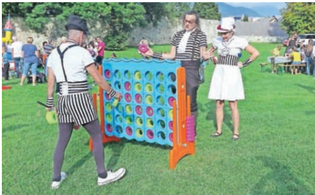
Za popestritev praznovanja je poskrbela leška žonglerska in ognjena skupina Čupakabra.