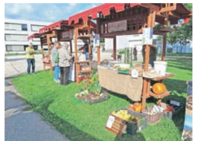
Na stojnicah tik ob šolskem vrtu je bila na voljo bogata ponudba ekološke hrane in pridelkov z okoliških kmetij.