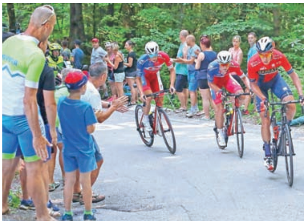
Tekma za državne naslove je vsekakor največji kolesarski dogodek v naši občini.