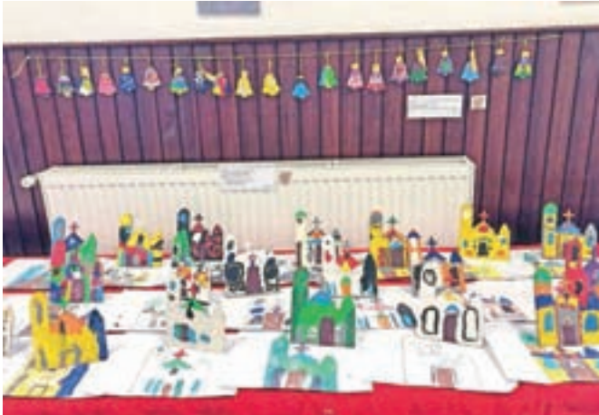
Razstava izdelkov ob zaključku projekta: Brezje skozi otroške oči