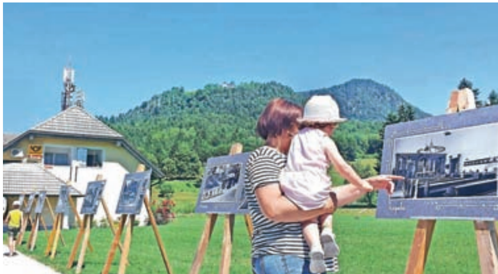
V Begunjah so prav Plečnikovi dediščini tematsko posvetili letošnji Urhov semenj. Na ogled so postavili zanimivo razstavo na prostem.

V sklopu prireditve Urhov semenj je sicer Turistično društvo Begunje tudi letos pripravilo Begunjsko avanturo – tokrat že osmo rekreativno, pohodniško in zabavno prireditev z zanimivimi, sproščujočimi in interaktivnimi točkami na poti, povezanimi s spoznavanjem kraja in okolice, popoldan pa se je Urhov semenj na prizorišču nasproti Avsenikove domačije nadaljeval z druženjem ob glasbi Veselih Begunjanov. Sejemske dogajanje so zaokrožile stonjice z dobrotami in izdelki domače obrti.