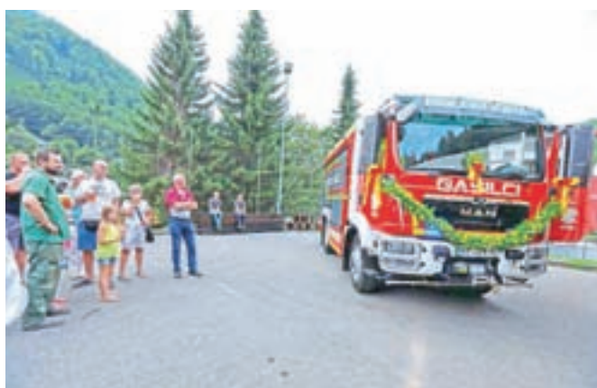
Prostovoljno gasilsko društvo Kropa je prevzelo novo gasilsko vozilo.