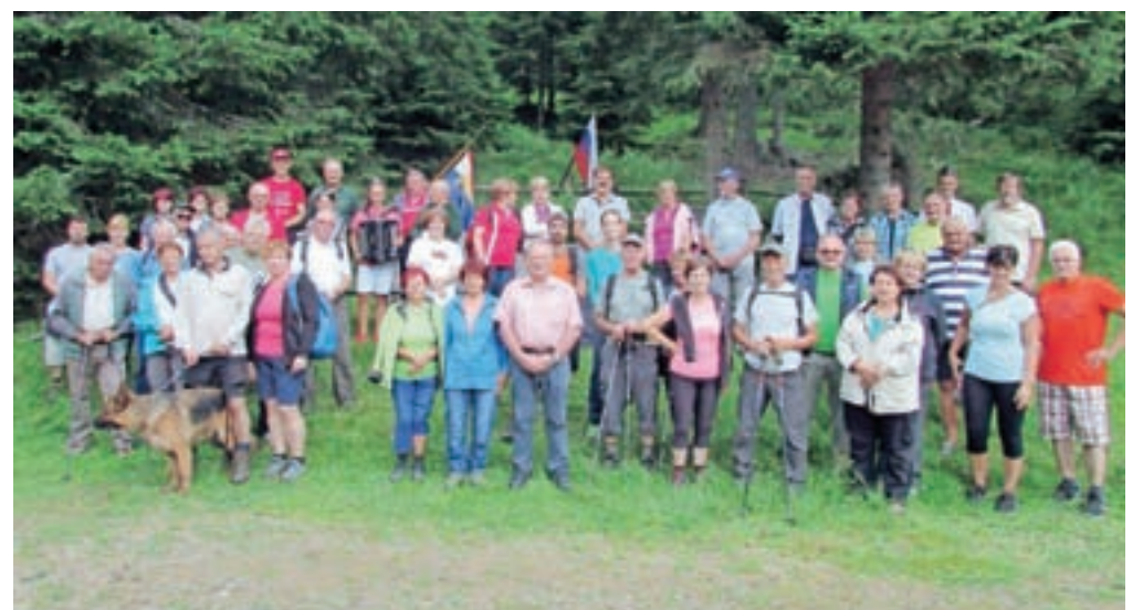
Pohodniki so se na pot odpravili že sedemindvajseto leto zapored.