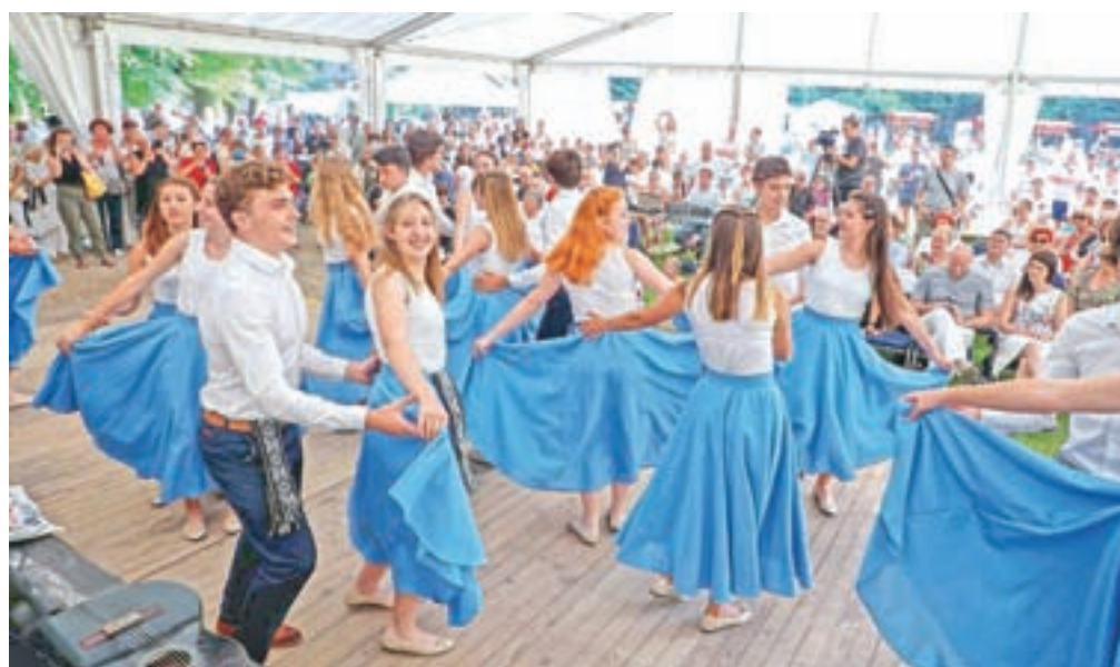
Kulturni program so pripravili člani kulturnih društev, med njimi tudi maturanti iz Argentine z imenom Rast 48, ki so bili na enomesečnem spoznavanju domovine svojih prednikov.

Med udeleženci so bili tudi številni mladi, med njimi denimo 18 maturantov iz Argentine – Rast 48, to je že 48. generacije dijakov srednješolskega tečaja slovenskega jezika, ki so na enomesečnem spoznavanju dežele babic in dedkov. Pred prihodom v Slovenijo so si ogledali Rim in Vatikan in se srečali s papežem Frančiškom, v Sloveniji pa obiskujejo poletno šolo slovenskega jezika, obiskujejo največje znamenitosti, sprejel jih je ljubljanski nadškof Stanislav Zore, družijo se s slovenskimi sorodniki, povzpeli se bodo tudi na Triglav. Navdušili so tudi v kulturnem programu.