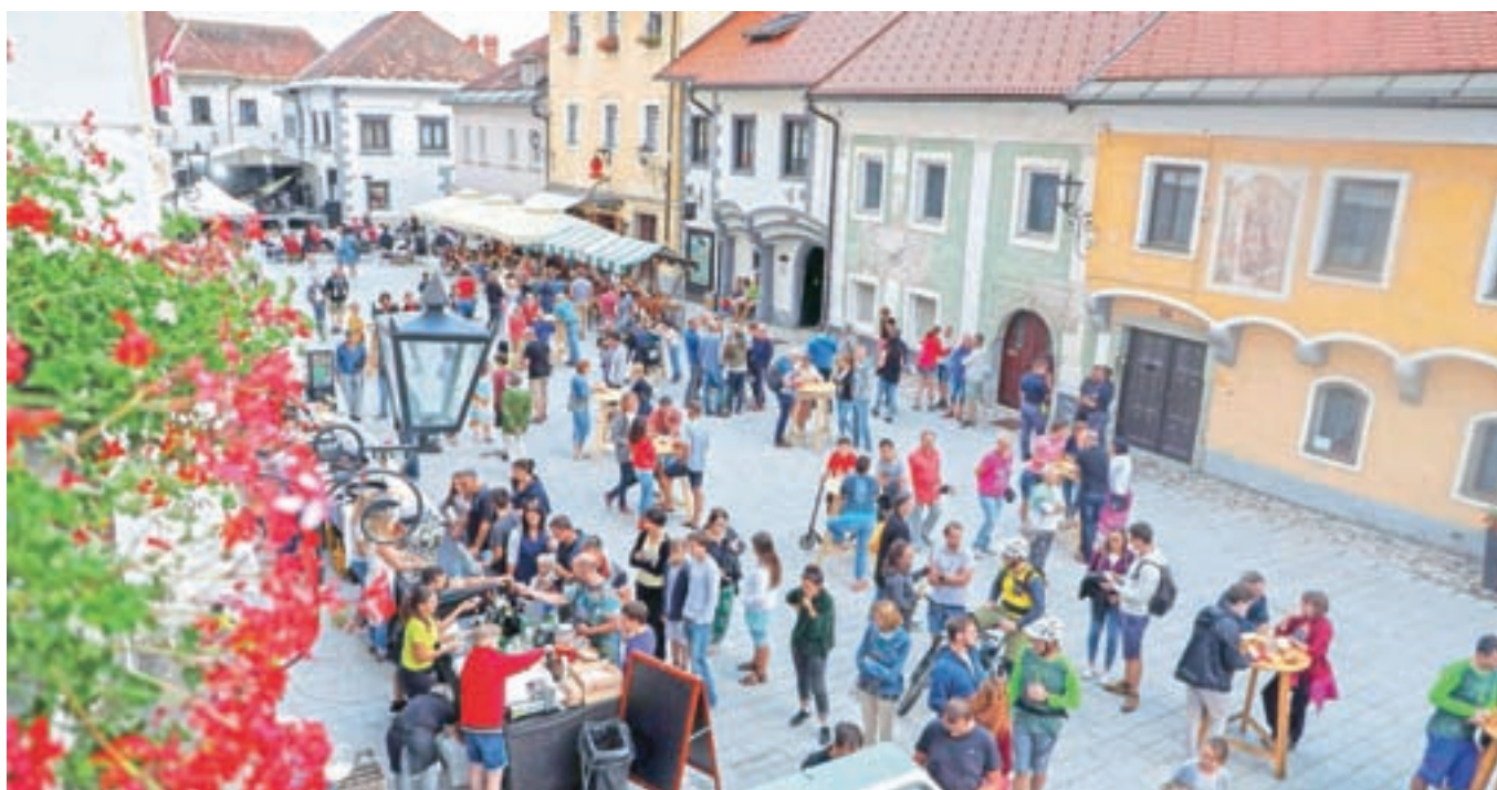
Posebej živahno je na Linhartovem trgu ob četrtkih, ko dobra glasba in ponudba Okusov Radol'ce v staro mestno jedro Radovljice privabita številne domačine in turiste.