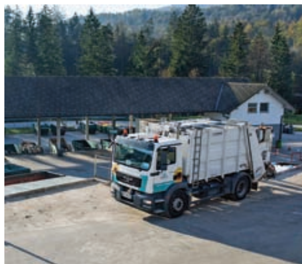
Večje količine zbranih komunalnih odpadkov vplivajo na višje stroške.

Cenik storitev je objavljen na www.komunala-radovljica.si .