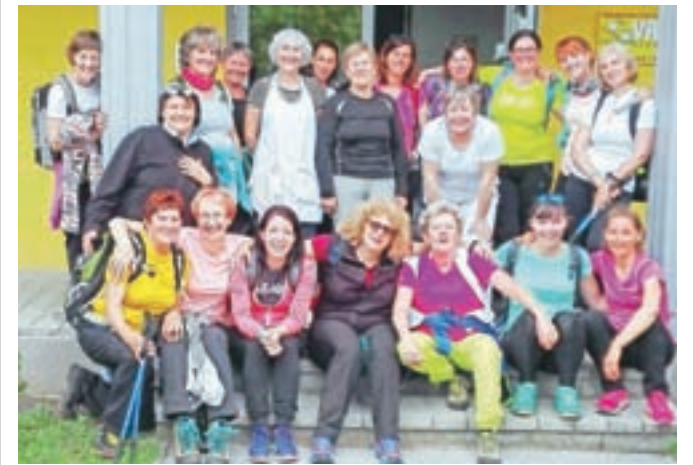
Udeležence pohoda ob svetovnem dnevu gibanja

Od tu dalje jih je čakal najzahtevnejši del pohoda – do enote Begunje in od tam dalje proti cilju, ki se je že kazal v daljavi. Pod podplati