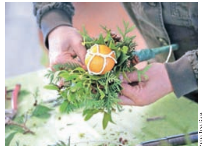
Največji problem pri izdelavi butarice predstavlja pritrjevanje sadja, običajno pomaranč, mandarin in jabolk.