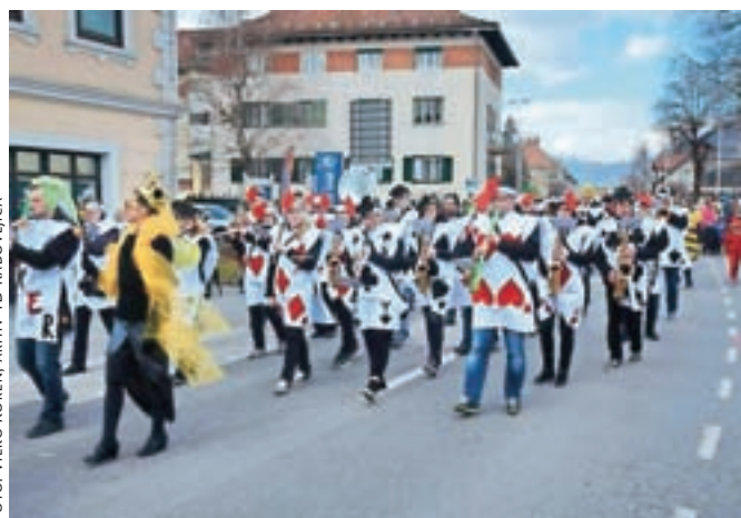
Na čelu sprevoda so korakali godbeniki.