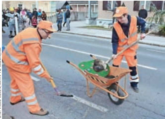
Tudi letos je bilo veliko aktualnih mask.