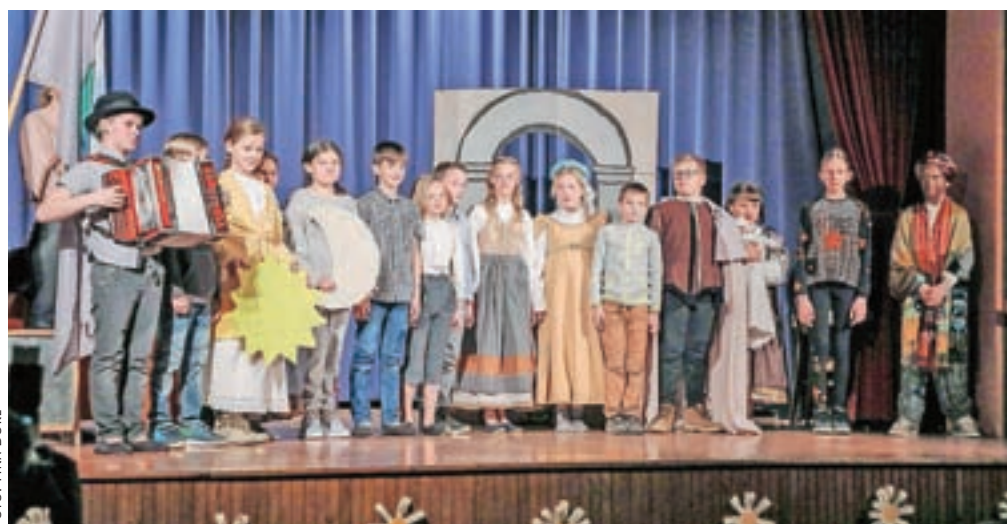
Učence in učencevske osnovne šole so pripravili interpretacijo Prešernove Lepe Vide.