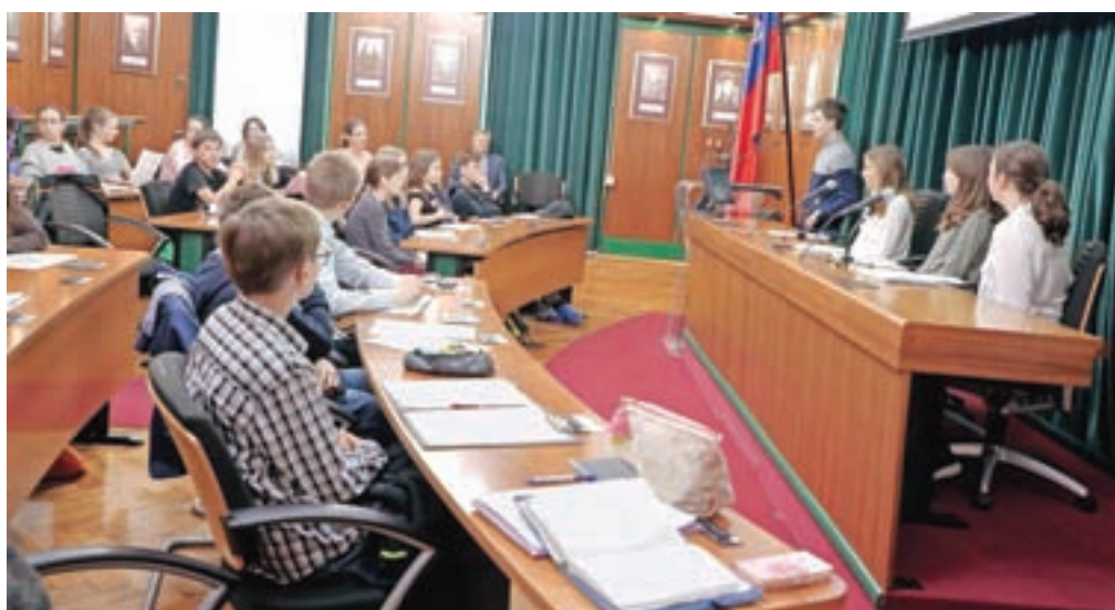
Mladi parlamentarci štirih osnovnih šol so v veliki sejni dvorani Občine Radovljica razpravljali o temi šolstvo in šolski sistemi.