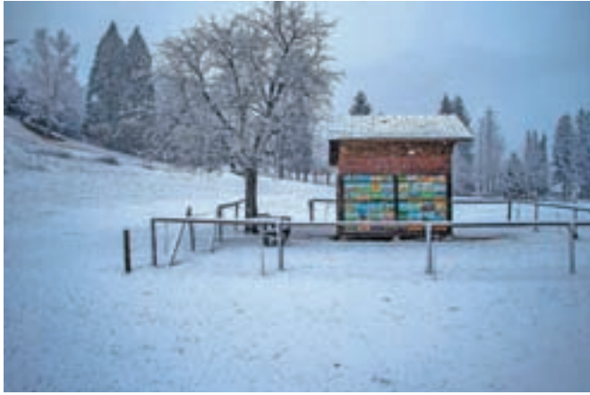
Dogodki v občini Radovljica 2018, tema Čebelnjaki in panji v občini Radovljica, avtor: Jasim Suljanović, 2. nagrada