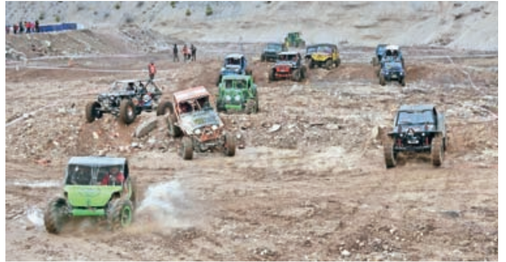
Začetek težavnostne preizkušnje, ki je za gledalce najbolj zanimiva

Vozniki so se tudi letos pomerili v dveh preizkušnjah, hitrostni in težavnostni. »Hitrostna preizkušnja je namenjena klasičnim terenskim vozilom, čeprav so tudi ti že precej divje predelani. To je tekmovanje na čas. Najboljši vozijo slabi dve minuti,« je hitrostno preizkušnjo na kratko