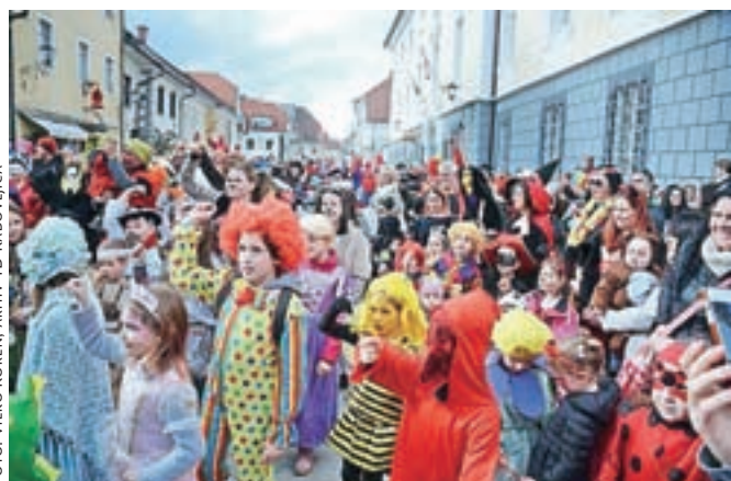
Pustne maske so napolnile Linhartov trg.

Obeta se nam zanimiv dogodek kot nalašč za živahni predkresni čas. Turistično društvo Radovljica se zahvaljuje vsem, ki so za pustni sprevod vložili v svoje preobleke idejo, trud, domiselnost, ure šivanja in oblikovanja ter voljo, da se nadaljuje tradicija, ki je 1996 obudila spomin na prvi pustni sprevod v Radovljici 1932.