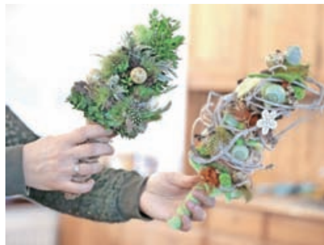
Tradicionalnim butaricam dandanes dodajajo moderen pridihi in pri oblikovanju domišljiji prepustijo prosto pot.

balizacija je nedvomno zajela našo deželo in skrb vzbujajoče je, da postajata valentinovo in noč čarovnic bolj popularna kot običaji, ki imajo pri nas dolgoletno tradicijo. Vrniti se moramo h koreninam, se zavedati in spoštovati našo kulturno dediščino, kamor sodi tudi velika noč, in jo – ne zgolj s krščanskega vidika, temveč tudi s stališča naše identitete – ohranjati in gojiti. To je vendarle običaj, ki poveže družino, in je čas, ki ga namenimo eden drugemu."