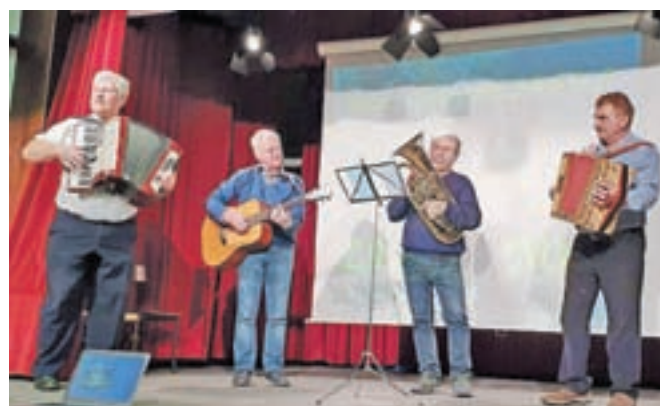
Zbrano občinstvo so posebej navdušili domači glasbeniki.

vzdrževanju infrastrukture in urejanju prometa, je še povedal Šmitek. »Aprilske čistilne akcije se je udeležilo skoraj osemdeset krajanov, kar je prav gotovo največ v vsej občini, na kar smo zelo ponosni. Tudi to pomlad jo bomo organizirali, in sicer prvo sredo v aprilu.« Načrtujejo, da bodo letos s pobiranjem parkirnine in prodajo spominkov zaslužili približno toliko kot lani, v srednjeročnem načrtu pa je seveda zagotavljanje sredstev za investicijo v drugo fazo prenove gostilne na Brezjah, ki bi jo, če bo šlo vse po načrtih, radi zaključili do leta 2022. Še naprej bodo obnavljali in označevali učne poti in parkirišče, organizirali akcije ter skrbno vzdrževali lastnino društva, ki ima trenutno več kot tristo članov.