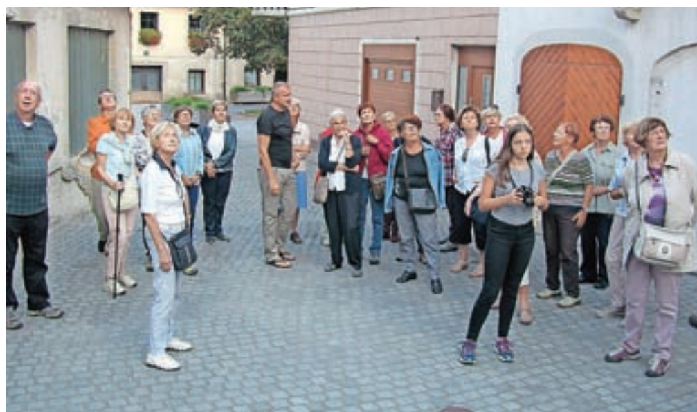
Stari del Škofje Loke je bil zadnja postaja Vurnikove poti.