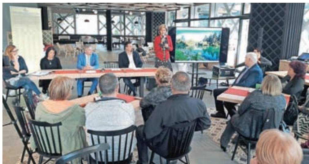
Ponudniki turističnih storitev so se letos zbrali na srečanju v novi restavraciji Kampa Šobec.

»Samo urejena soba že dolgo ni dovolj,« ob tem poudarila opozarja Mikljevca. »Gost potrebuje in pričakuje še marsikaj več. Za začetek pristen osebni stik. To in kompetentna informacija je tisto, kar pomembno vpliva na zadovoljstvo gosta s celotno izkušnjo. Dokazano je, da gost mnogo lažje sprejme kakšno tehnično pomanjkljivost nastanitve, če jo nadomesti prijazen sprejem.«