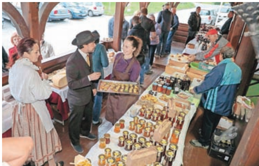
Dogodek ob odprtju je organizator Okusov Radol'ce zavod Turizem in kultura Radovljica letos pripravil v Joštovem hramu v Podnartu.

ki povezuje lokalne dobavitelje z devetimi gostilnami in restavracijami Okusov Radol'ce, bo potekal ves november in se zaključil s prireditvijo ob prižigu prazničnih luči prvo soboto v decembru na Linhartovem trgu v Radovljici.