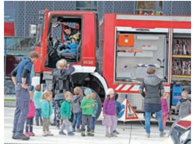
Za otroke so najbolj zanimivi veliki tovornjaki – in seveda lučke.

kulturnih prireditve, prav tako pa mesto omogoča lažji dostop do aktivnosti, od športa do glasbe. »Zato je pomembno, da se te službe predstavijo tudi v mestu. Meščani se zaradi vsega drugega dogajanja niti ne zavedajo, koliko služb obstaja. Ne zavedajo se tega, da te službe morajo biti in da so nekatere prostovoljne. Dobi-ti prostovoljca v mestu pa je bistveno težje kot na vasi. Zato je pomembno, da že otrokom pokažemo, kako je to zanimivo, kakšna je oprema in se jim tako približamo,« je razložil Marijan.