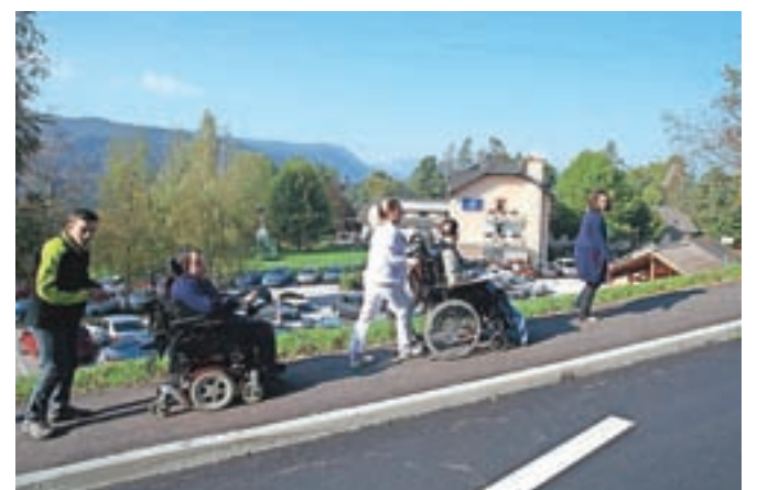
Pot do središča Radovljice je zdaj tudi za gibalno ovirane uporabnike CUDV Radovljica bistveno varnejša kot v preteklosti, ko ob cesti še ni bilo pločnika.

to, da potrebujejo pločnik, opozarjali že vse od začetka delovanja centra. S pločnikom se je namreč upakovost življenja in bivanja uporabnikov močno dvignila, prav tako pa so na boljšem njihovi starši in zaposleni v centru, saj je bila pot v Radovljico ob robu ceste doslej res nevarna in zahtevna. »Center je sicer od središča Radovljice oddaljen le nekaj sto metrov zračne razdalje, ki pa jo morajo predvsem gibalno ovirani varovanci na invalidskih vozičkih premagati po dobra dva kilometra dolgi glavni cesti, ki povezuje Radovljico z Lipniško dolino. Uporabniki CUDV se v središče Radovljice odpravijo v