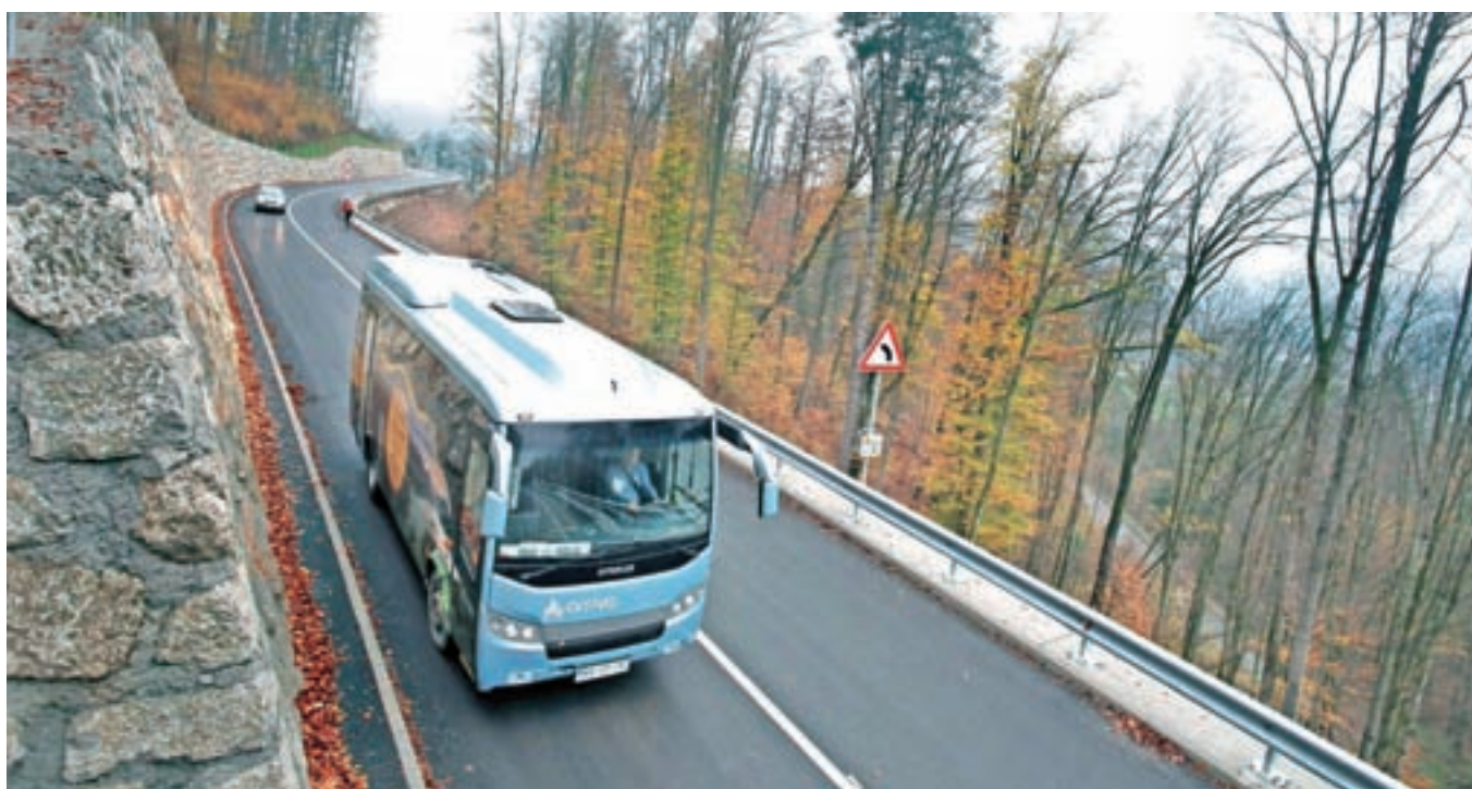
Po praznikih je stekel promet po obnovljeni državni cesti na Lancovem, ki je bila za ves promet zaprta vse od začetka februarja.

Ena od prioritarnih nalog občine v prihodnjem letu pa bo rekonstrukcija regionalne ceste v Podnartu, kjer bo Občina Radovljica sofinancirala gradnjo hodnika za pešce od gasilskega doma do prehoda čez železniško progo ter sočasno obnovila komunalne vode.