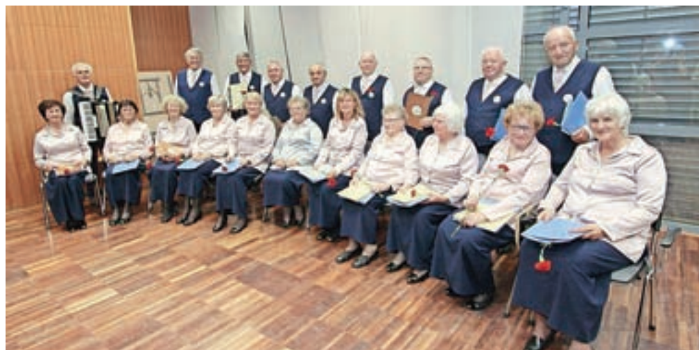
Mešani pevski zbor Slavček Društva upokojencev Lesce