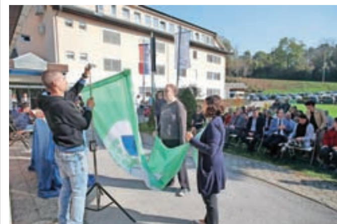
Tudi pred stavbo CUDV Radovljica od letošnje jeseni plapolja zelena zastava Ekošole.

Od sredine prejšnjega meseca tudi pred stavbo Centra za usposabljanje, delo in varstvo (CUDV) Radovljica visi zelena zastava Ekošole, programa, ki razvija odgovoren odnos do okolja, narave in bivanja nasploh. Temelji na metodologiji sedmih korakov, ki je primerljiva z okoljskim standardom kakovosti ISO 14001. Predstavlja postopek dela posamezne ustanove, da pridobi oziroma ohrani t. i. zeleno zastavo kot najvišje priznanje oziroma prepoznavni znak, da spada v mednarodni program Ekošola.