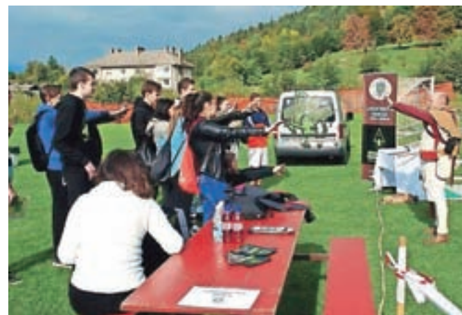
Športnega dne se je udeležilo okoli sedemdeset mladih iz Radovljice in Škofje Loke.

Mladi so tipali po zaščitnih jopičih Slovenske policije, odvezemali prstne odtise, uporabljali simulator streljanja, si ogledovali vojaško vozilo, učili so se osnov lokostrelstva in streljanja s klasičnim lokom ter samoobrambe s pridihom kikkoksa. V drugem delu športnega dneva je sledil orientacijski pohod skozi vas Begunje do trim steze Krpin. Krožno pot so udeleženci prehodili prek čim več ovir in v skupni raz-