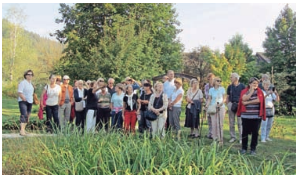
Udeleženci Vurnikove poti na Kržišnikovem vrtu v Žireh