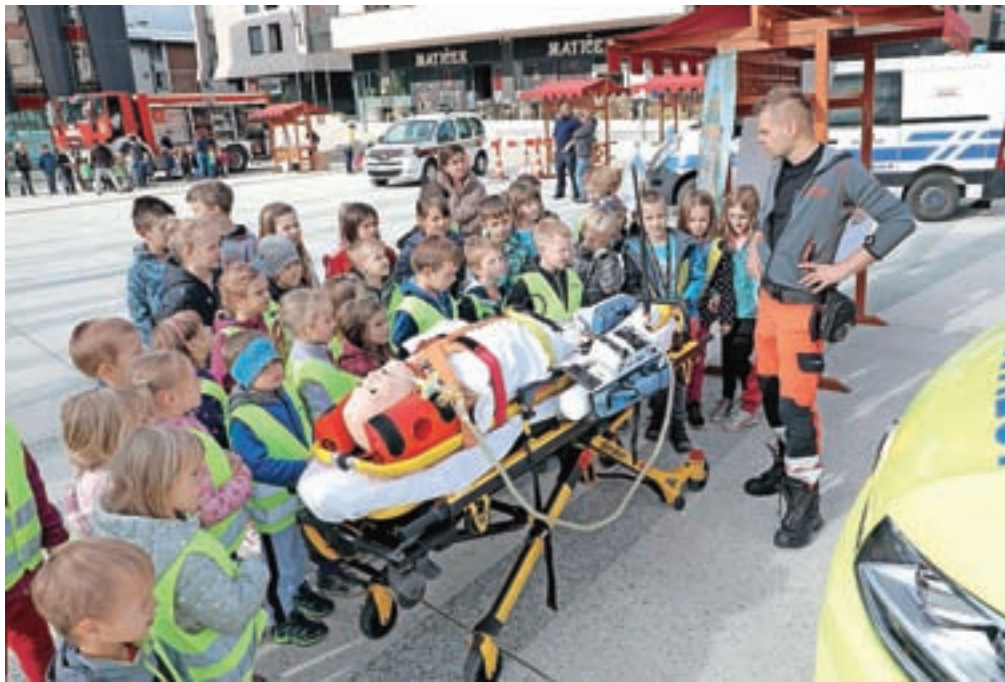
Svoje delo je predstavila tudi služba nujne medicinske pomoči.

V dopoldanskem času so si predstavitve ogledali vsi vzgojno-varstveni zavodi v Radovljici – predvsem vrtci, nekaj je bilo tudi skupin