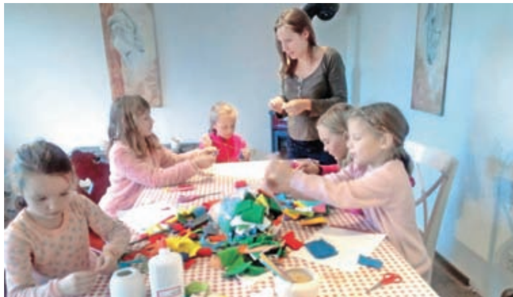
Najmlajši se z likovno umetnostjo seznanjajo na ustvarjalnicah.

miselnih spretnosti, ki jih likovni material in tehnika ponujata. Z nekoliko starejšimi (od desetega leta dalje) in odraslimi se dogovarjam za tečaje individualno. Tečaje popolnoma prilagodim posameznikovim željam in ambicijam, pa naj bo to slikanje ali kiparstvo, namenjeno sprostitvi ali preprosteemu pridobivanju ročne spretnosti, osredotočanju na trenutek tukaj in zdaj, kar je v tem hitrem svetu izjemno pomembna veščina.« Tečaji so primerni za vse, tako za tiste, ki se ob ustvarjanju želijo umakniti od vsak-