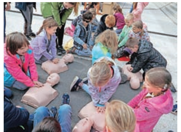
Temeljne postopke oživljanja so lahko otroci in drugi obiskovalci preizkusili na lutkah.