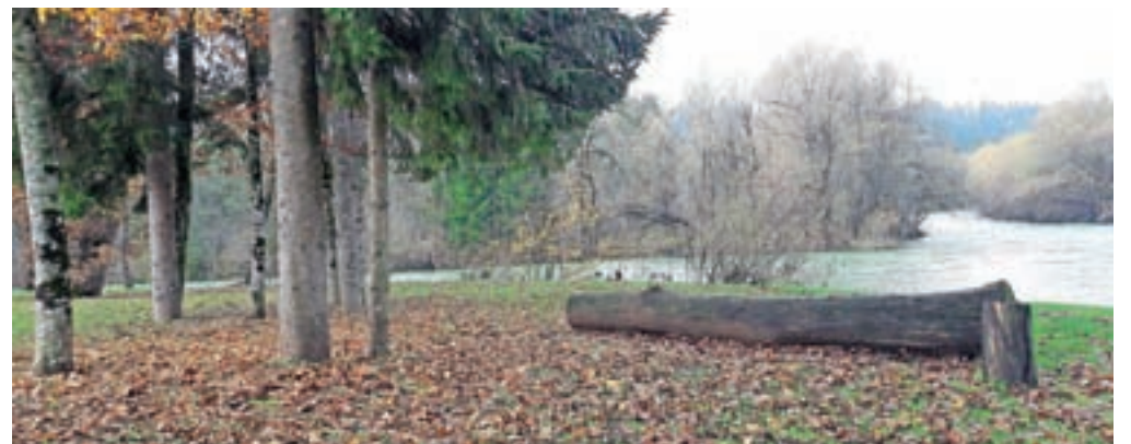
Na Lancovem so zelo zadovoljni s pred časom urejenim parkom ob sotočju Save Bohinjke in Save Dolinke.