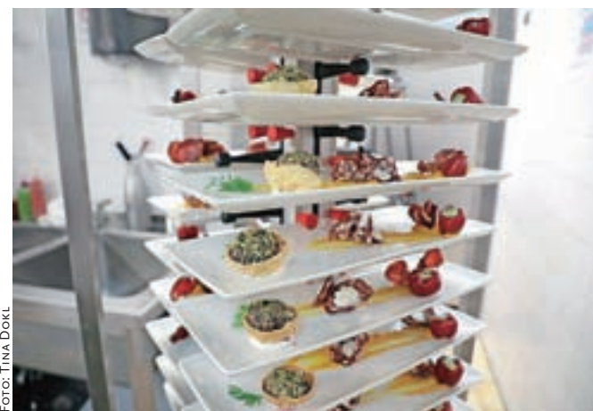
... so v kuhinji pripravljali slavnostno večerjo ob odprtju. Na fotografiji je hladna predjed: Tulipanova divjačinska pašteta in Meglenova salama s humusom Likozarjeve buče ter hrustljava špehovka z mini Likozarjevo papriko, ki so jo pripravili mojstri iz Gostišča Draga in Gostilne Tulipan.