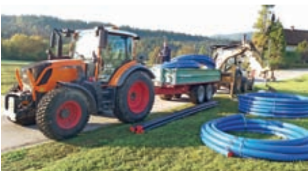
Delavci Komunale Radovljica, d. o. o., pri izvedbi montažnih del za vodovod in vodovodne priključke.

Ugotavljamo, da naši uporabniki zaznavajo prizadevanja Komunale Radovljica, d. o. o., za zanesljive in kakovostne komunalne storitve. Ocena zadovoljstva uporabnikov je bila lani na najvišji ravni doslej. Nenehna rast ocene zadovoljstva nam daje potrditev, da delujemo v pravi smeri.