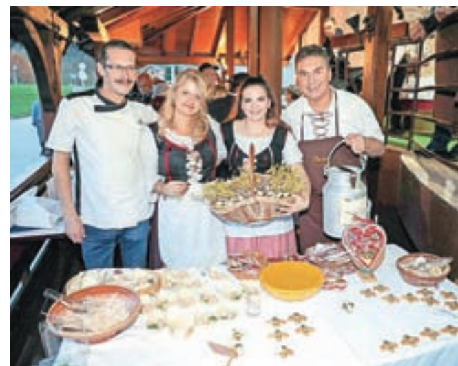
Lectarjevi so se na degustaciji predstavili z okusnimi in privlačnimi lectovimi čebelicami v medenem mleku.