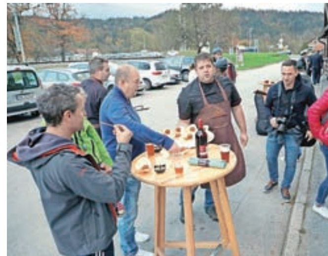
Medtem ko so obiskovalci na terasi pred Joštovim hramom okušali dobrote, ki so jih sodelujoče restavracije in gostilne pripravile za degustacijo ...

Okusi Radol'ce bodo še ves november v Radovljici in okolici z meniji po enotni ceni 18 evrov skrbeli za pestro kulinarčno ponudbo. V soboto, 1. decembra, pa organizatorji, zavod Turizem in kultura Radovljica, na Linhartovem trgu med 17. in 20. uro, pripravljamo zaključni dogodek Okusov Radol'ce. Ta dan bodo v Radovljici prižgali praznične luči, za glasbo bo skrbelo zasedba Kranjci, pripravili bodo še zanimivo otroško delavnico.