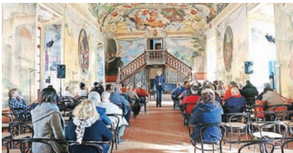
Viteška dvorana z Rembovo poslikavo

Kolegi Posavskega muzeja so se izkazali kot odlični gostitelji. Tudi oni obeležujejo leto pomembnega slikarja. V soboto, 13. oktobra, dopoldne nas bodo zato obiskali v Radovljici in v Mestnem muzeju, da поблиže spoznajo njegovo rojstno mesto. Bralce Deželnih novic vabimo, da se nam pridružijo.