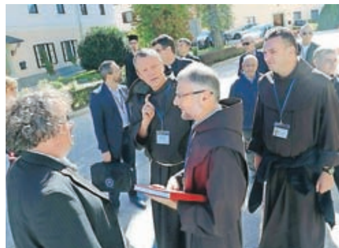
Predstavniki evropskih Marijinih svetišč so prvič zborovali na Brezjah.

k duhovni rasti človeka. Zato jih uvrščamo med temelje naše vere. Nadškof je, tako kot drugi rektorji in predstavniki svetišč, med bivanjem na Brezjah obiskal tudi