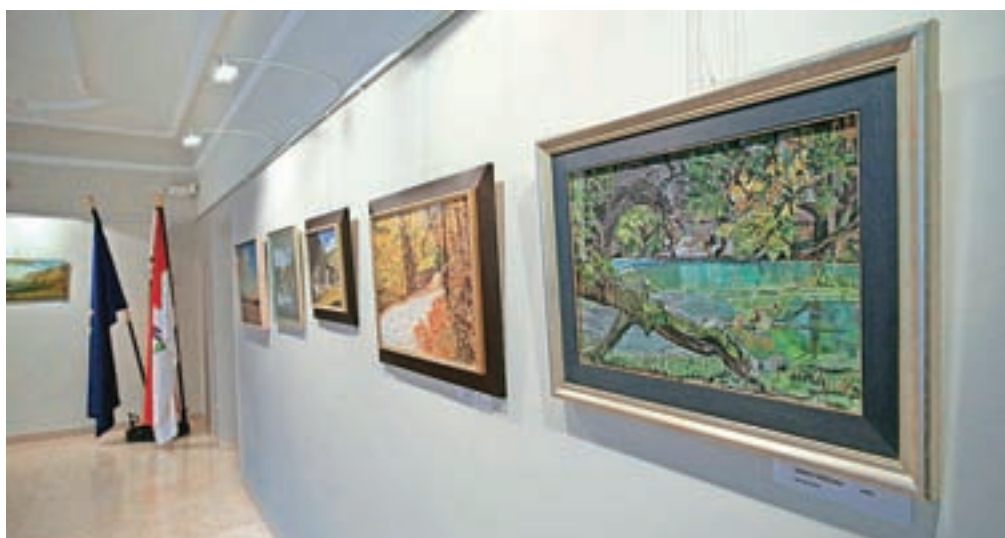
Razstava bo v Galeriji Avla v prostorih radovljiške občine na ogled še do sredine prihodnjega meseca.

Na prvi dan letošnjega leta je bil v tej skupini že vsak peti prebivalec Slovenije. V enem letu se je število starejših povečalo za 11 tisoč. Že več zaporednih let pa se zmanjšuje število stoletnikov. Glavna razloga za to sta manjše število rojstev med prvo svetovno vojno ter epidemija španske gripe tik po njej. Upadanje števila stoletnikov se bo počasi umirilo, po letu 2020 pa se bo njihovo število začelo spet skokovito povečevati. Po statističnih podatkih živi v Sloveniji 187 stoletnikov (od tega kar 154 žensk), kar je petkrat več kot leta 1990, čez 15 let pa se bo število povzpelo že čez tisoč.