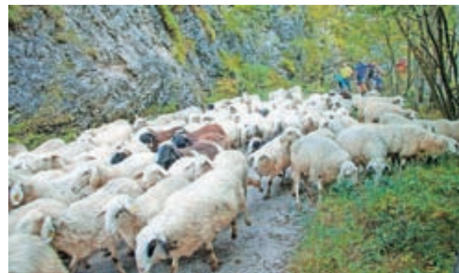
Na poti, avtor Jasim Suljanović, diploma