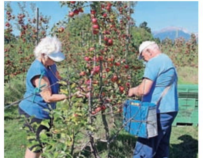
V nasadu Resje so sadje začeli obirati sredi avgusta, končali pa naj bi v prvih novembrskih dneh.

sadovnjakih je sadje tudi kakovostno, v slabše oskrbovanih pa so imeli težave z boleznimi in škodljivci, še zlasti z jabolčnim zavijačem. Takšno sadje bo rado gnilo. V nasadu Resje ocenjujejo letošnjo letino jabolk na osemsto do devetsto ton. Približno polovico je zlatega delišesa, dobro so zastopane še sorte idared, jonagold, elstar, gala, breburne, pinova in fuji, veliko je tudi povpraševanje po carjeviču in majdi. "Prodaja za zdaj dobro poteka. Hladilnica za dve sto ton sadja ne bo zadoščala, zato bo treba pohiteti s prodajo. Klasične sindikalne ozimnice ni več, vse več pa je podjetij, ki kupijo jabolka za zdravo prehranjevanje svojih delavcev. Med potrošniki narašča povpraševanje po jabolkih iz ekološke pridelave," pravi Zupanova in dodaja, da v sadovnjaku Resje ekološka pridelava poteka na površini 1,3 hektarja, v prihodnje pa jo bodo še povečali. Celotni nasad obsega trideset hektarjev, od tega je v rodnosti 24 hektarjev. Letos spomladi so na novo zasadili