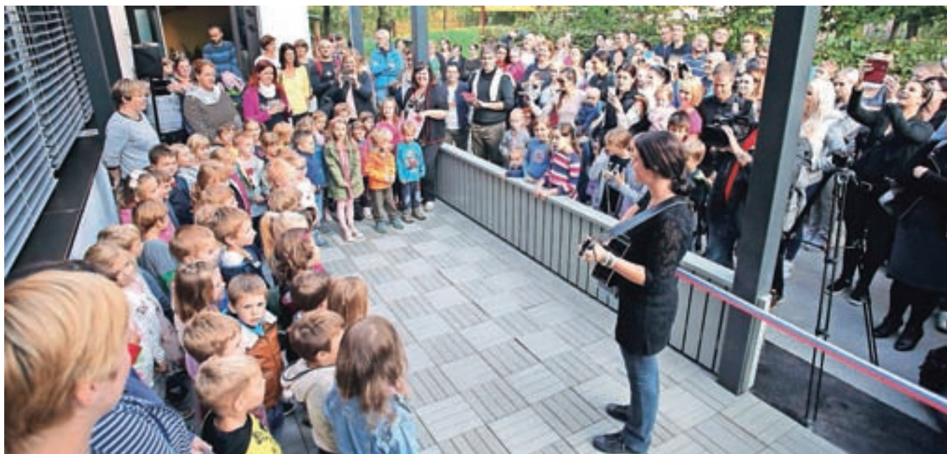
Na slovesnosti, ki so jo pripravili na novi pokriti terasi pri spodnjem vhodu v vrtec, je nastopil pevski zbor radovljiške enote Vrtca Radovljica.