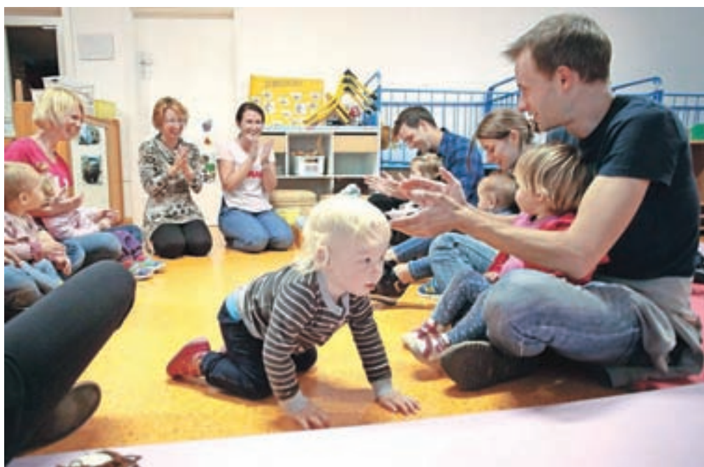
V sklopu slovesnosti ob zaključku prenove radovljiškega vrtca so pripravili tudi različne delavnice, na katerih so sodelovali otroci in starši.

Radovljiške vrtce sicer v sedmih enotah v Radovljici, v Lescah, Begunjah, Kamni Gorici, Kropi, na Brezjah in Posavcu obiskuje 747 otrok v 42 oddelkih. Občina je za investicije v predšolsko vzgojo in varstvo v zadnjem desetletju namenila znatna sredstva: leta 2009 je bil zgrajen novi vrtec na Posavcu, leta 2014 obnovljen in s prizidkom povečan vrtec v Lescah, lani pa je bila končana energetska sanacija vrtca v Kropi. V vrtcu v Kamni Gorici je bila pred šestimi leti urejena kotlovnica na lesno biomaso. Občina Radovljica projekte izboljšanja energetske učinkovitosti svojih stavb izvaja v sklopu lokalnega energetskega koncepta. Za njihovo izvedbo v obdobju od 2013 do 2020 je na razpisih ministrstva za infrastrukturo iz Kohezijskega sklada pridobila 2,6 milijona evrov, so pojasnili na občinski upravi.