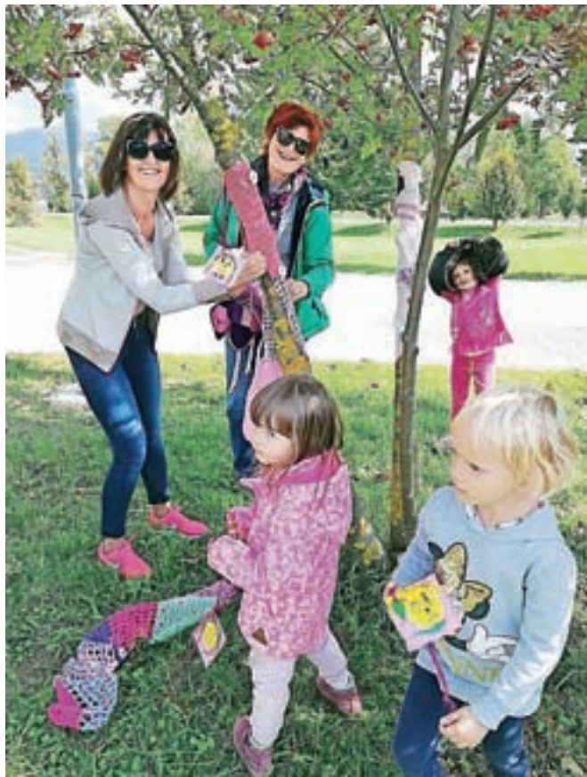
Dogodek je bil tudi priložnost za povezovanje generacij – starejši so izdelovali pletenine, deklice iz bližnjega Vrta Lesce pa risbice, s katerimi so nato skupaj okrasili drevesa in grmičevje v bližnjem parku.