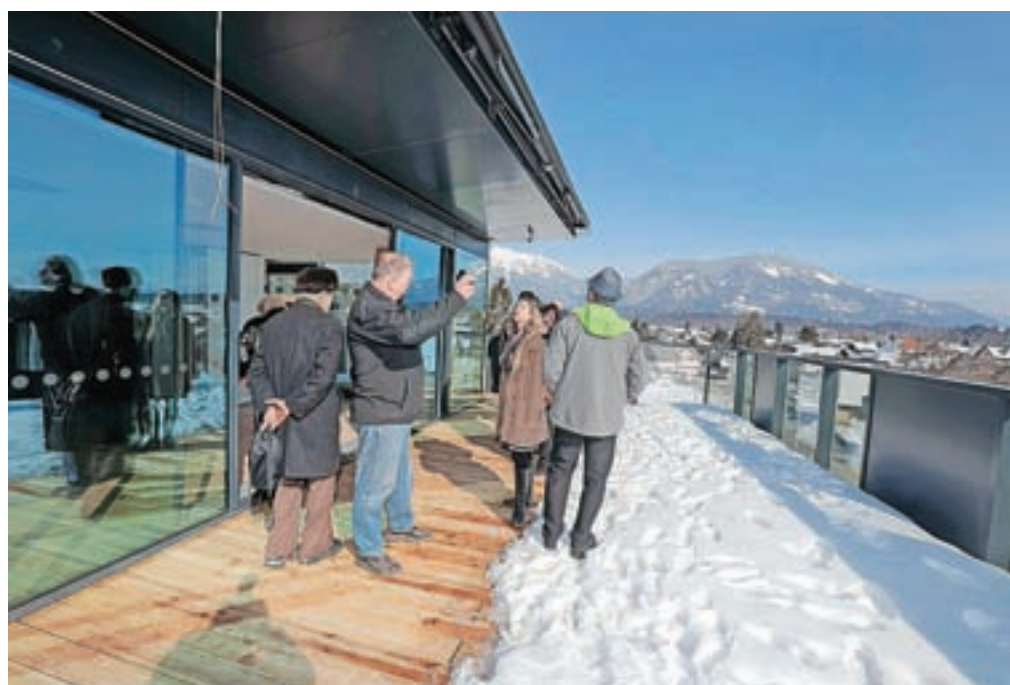
Terasa v najvišjem nadstropju knjižnice, kjer je tudi prireditveni prostor, ima enega najlepših razgledov v Radovljici.