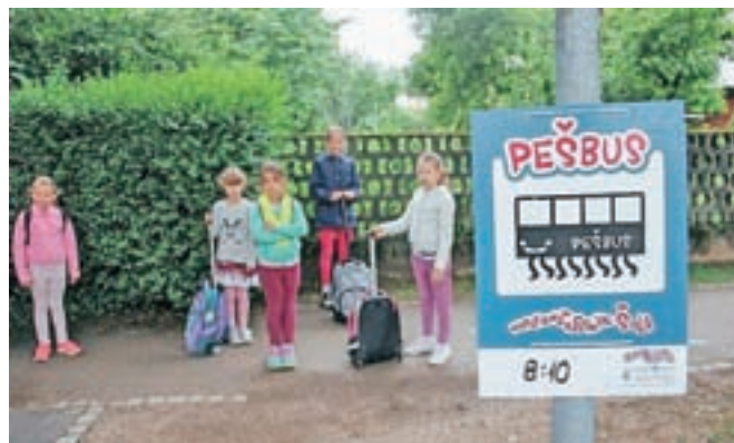
Otroci se bodo v šolo odpravili peš, po določenih poteh in stalnem urniku v organiziranih skupinah.

V Sloveniji projekt Pešbus izvajajo v sklopu programa Aktivno v šolo ( www.aktivnovsolo.si ), ki ga podpira ministrstvo za zdravje. Akti-