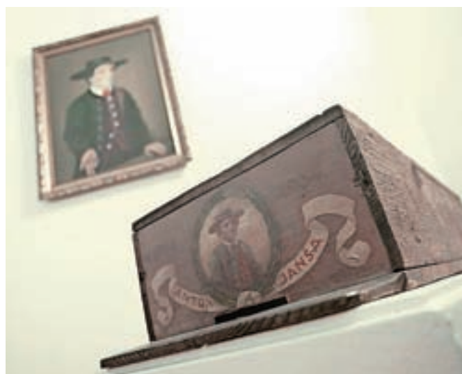
Anton Janša se je rodil 20. maja 1734; njegova neposredna materialna dediščina se žal ni ohranila, je pa zavedanje o pomenu njegovega dela še danes prisotno v zavesti slehernega slovenskega čebelarja.

V radovljiških muzejih bodo razstavo jeseni pospremili še s pedagoško delavnico, Muzeji radovljiške občine pa so ob tej priložnosti tudi v drugih enotah – v Mestnem muzeju, Šivčevi hiši in Kovaškem muzeju v Kropi – stalne razstave dopolnili z vsebinami, povezanimi z Antonom Janšo in čebelami.