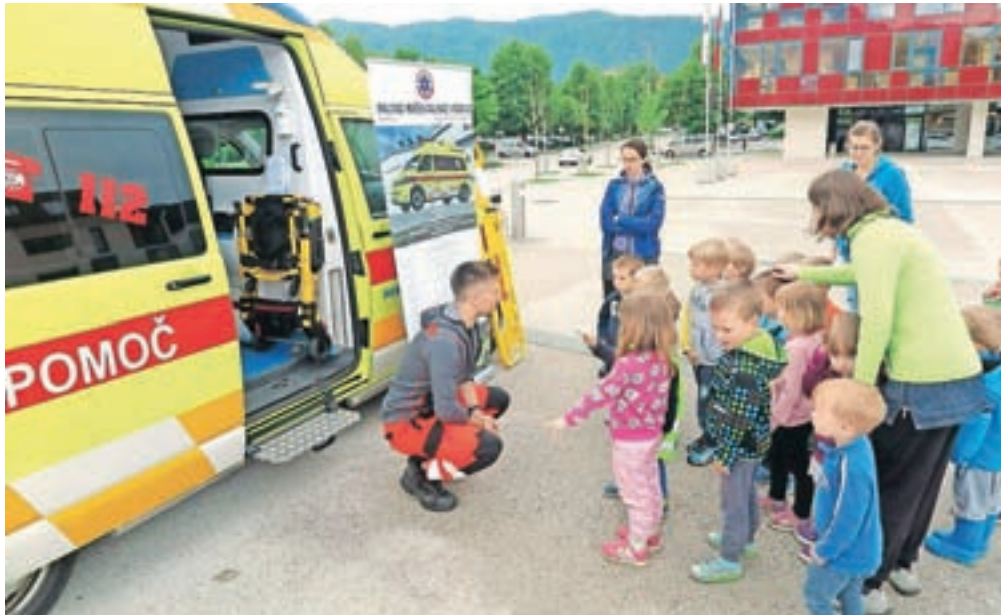
Na katero številko pokličemo, če se kaj zgodi! "Na 112!" so vedeli malčki iz vrtčevske skupine Ribice.

Na kar 23 stojnicah so obiskovalci lahko dobili najrazličnejše zdravstvene nasvete, lahko so si brezplačno izmerili krvni tlak in krvni sladkor, se naučili temeljnih postopkov oživljanja in uporabe avtomatskega zunanje defibrilatorja. Na modelih so se lahko naučili tipati rakave spremembe na dojkah in modih, se učili uporabljati eterična olja, si pravilno umivati in razkuževati roke ... Na dogodku so sodelovali zdravstveni domovi Radovljica, Bled in Jesenice, Psihiatrična bolnišnica Begunje, Nacionalni inštitut za javno zdravje, Državna programa ZORA in DORA, Hospic, Gorenjske lekarne, Fakulteta za zdravstvo Angele Boškin, različna društva, ki se ukvarjajo s preventivo oziroma združujejo bolnike in njihove svojce ... Obiskovalci so se lahko tudi posladkali s slastnimi, zdravimi ajdovimi palačinkami z