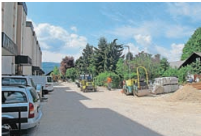
Ob cesti bodo urejena bočna parkirna mesta, obnovljeni bosta komunalna infrastruktura in javna razsvetljava.

Marca se je začela obnova dela Gradnikove ceste v Radovljici. Gre za odsek pri zadnji vrsti blokov od hišne številke 63 do 75. Ob cesti bodo urejena bočna parkirna mesta, obnovljeni bosta komunalna infrastruktura in javna razsvetljava. Sočasno z rekonstrukcijo cestnega odseka bo asfaltirano makadamsko parkirišče, ki ga je občina uredila že predhodno, so sporočili z občinske uprave. Prometni režim bo na tem odseku Gradnikove ceste po novem urejen enosmerno. Izvajalec bo dela v vrednosti 126 tisoč evrov zaključil do konca meseca, nadaljevanje obno-