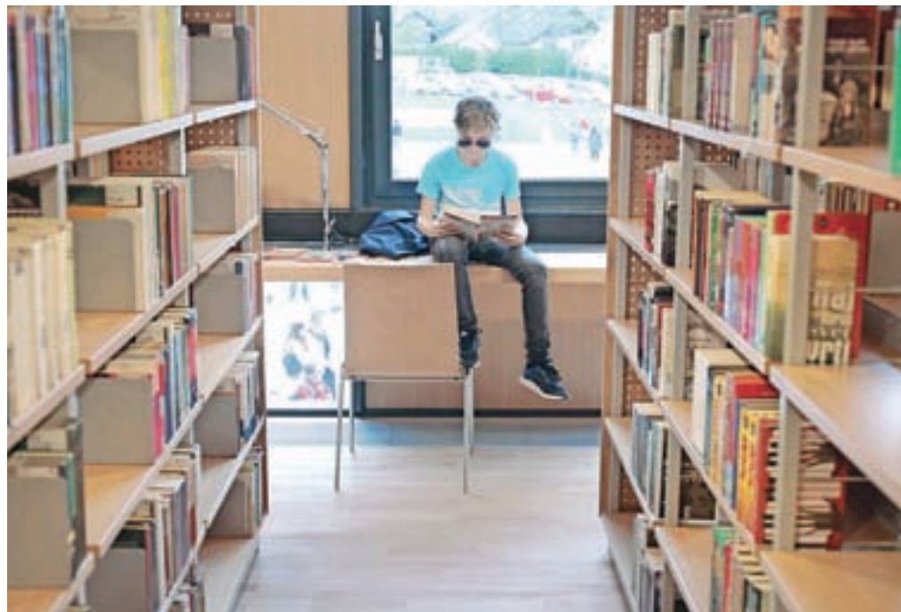
Prvi trenutki v novi knjižnici

V stari stavbi knjižnice je na voljo okoli tisoč kvadratnih metrov prostora. Ko bodo preverili stanje objekta, se bodo na občini glede na prošnje društev in drugih zainteresiranih odločili, katere bodo umestili v objekt in kako se bodo lotili njegove prenove. Prioriteto pa bo imel medgeneracijski center, je že pred časom zatrdil župan.