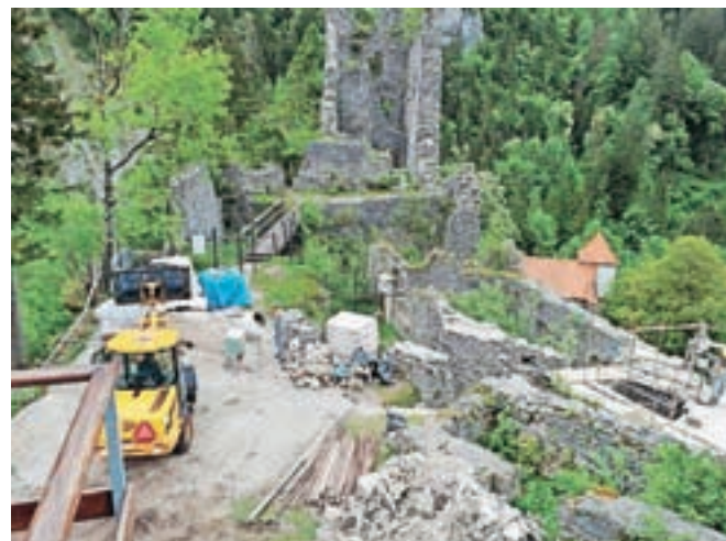
Sanacija polkrožnega zidu in notranjih prostorov pri spodnjem dviznem mostu bo zaključena do konca junija.

bo del pa 20. junij, so sporočili z občinske uprave. Doslej so bile ob poteh na grad v sodelovanju s Turističnim društvom Begunje postavljene nove lesene ograje, delno so bili prenovljeni tudi mostovi. Saniran je bil severni vogal jugozahodnega obrambnega zidu, razširjena dostopna pot na glavno dvorišče in urejene notranje stopnice s terase k severnemu stolpu.