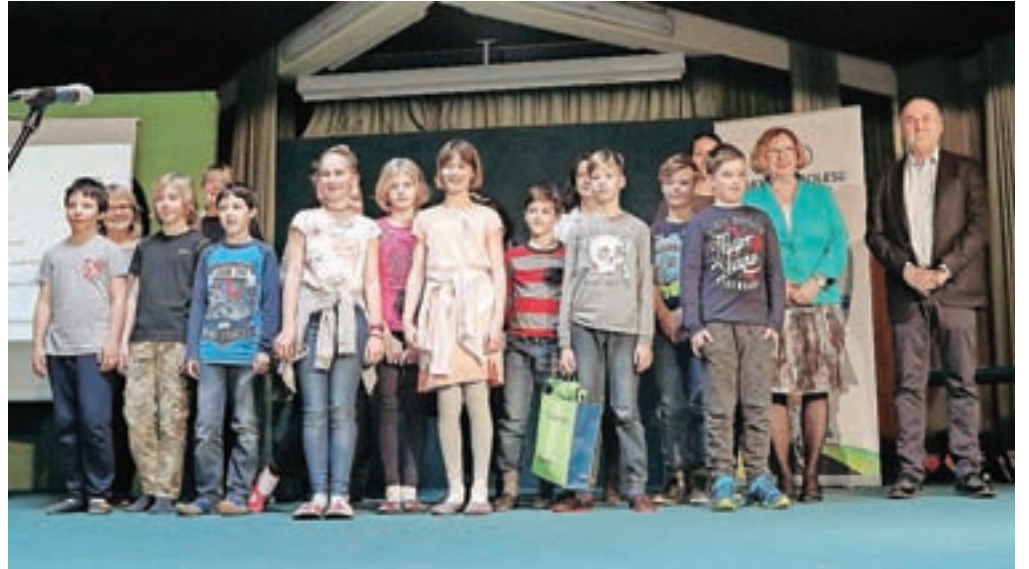
Zaključno slovesnost so tokrat pripravili na Osnovni šoli Antona Tomaža Linharta Radovljica.

Program Varno na kolesu že šesto leto zapored združuje kolesarje iz različnih osnovnih šol s ciljem, da so čim boljše pripravljene na samostojno vožnjo s kolesom v prometu. Obenem jih prek programa spodbujajo k varnemu kolesarjenju v vsakdanjem življenju in jih poučijo