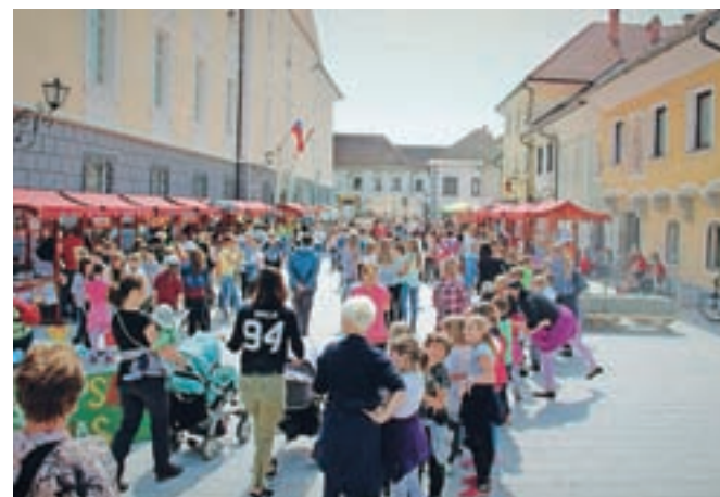
Linhartov trg se je ob tej priložnosti spremenil v pisan cvet držav Evrope.