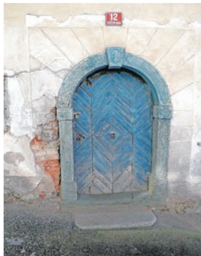
Fotonatečaj Dogodki v občini Radovljica 2017, tema Peračički tuf v naravi in arhitekturi; avtor Ljubo Jančič, 2. nagrada

Društvo fotografije za razpis sprejema do 31. januarja 2019. Najboljše fotografije bodo razstavljene v marcu prihodnje leto v Galeriji Avla Občine Radovljica. Razpis Dogodki v občini Radovljica 2018/10 je objavljen na spletnih straneh Fotografskega društva Radovljica ( www.fd-radovljica.si/ ) in Občine Radovljica ( www.radovljica.si/ ).