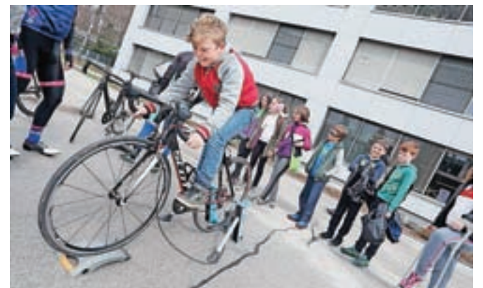
Na kolesarskem poligonu, ki ga je pripravila agencija za varnost prometa, so si ogledali predstavitev radovljiških policistov ter s predstavniki Kolesarske zveze Slovenije spoznali kolesarjenje na trenerju.

Program Varno na kolesu poteka na pobudo družbe Butan plin s podporo Javne agencije Republike Slovenije za varnost prometa, Zavoda Republike Slovenije za šolstvo, Policije, Kolesarske zveze Slovenije, podjetja Telekom Slovenije, družbe BTC in Zavarovalnice Triglav. Program podpirajo tudi številna kolesarska društva in uspešni kolesarji.