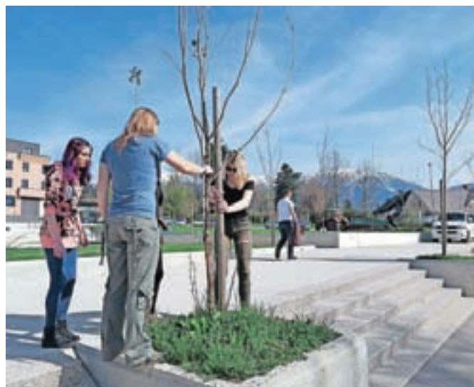
Na Vurnikovem trgu so pumovci posadili nova drevesa.

Udeleženci programa PUM, ki deluje v okviru Ljudske univerze Radovljica, so pred nedavnim 18 posušenih platan na Vurnikovem trgu zamenjali z novimi. Akcija, ki so jo izpeljali v sodelovanju z Občino Radovljica, javnim podjetjem Komunala in Vrtnarstvom Antolin, je potekala v sklopu praznovanja 18-letnice uspešnega delovanja programa, namenjenega mladim, ki so opustili osnovnošolsko ali srednješolsko izobraževanje in so brez dela.