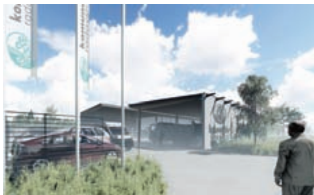
V prvi fazi je načrtovana izgradnja skladiščnega dela poslovnega objekta.

Komunalna Radovljica, d. o. o., bo z naložbo povežala glavno dejavnost ravnanja z odpadki, oskrbe s pitno vodo ter odvajanja in čiščenja odpadnih voda na enem mestu. Trajnostno grajeni objekti bodo ustrezno opremljeni in požarno varni. Prepričani so, da bodo boljši pogoji dela in možnost učinkovitejše organizacije poslovanja spodbudno vplivali na kakovost komunalnih storitev ter zagotavljali zadovoljstvo uporabnikov.