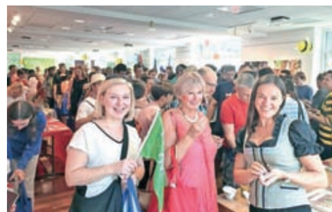
Radol'ca se je v prostorih slovenske ambasade v Washingtonu predstavila s slovenskim medom, cvetnim prahom, medenim likerjem in propolisom.