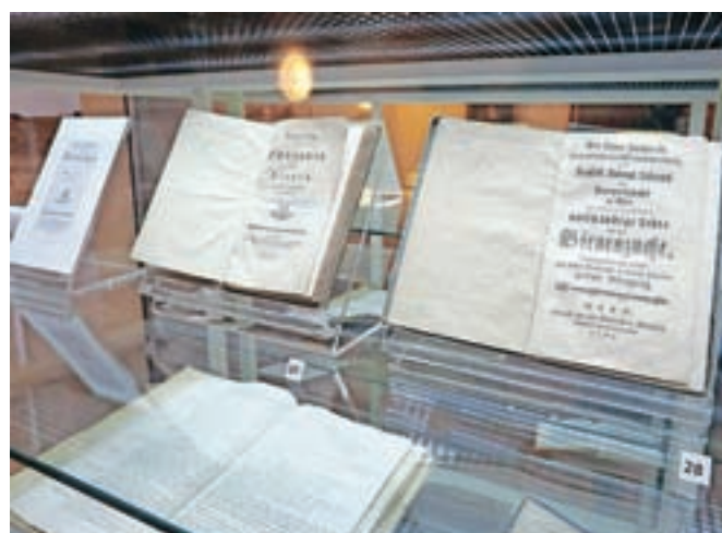
Janša je v nemškem jeziku napisal dve knjigi: Razpravo o rojenju čebel in Popolni nauk o čebelarstvu.