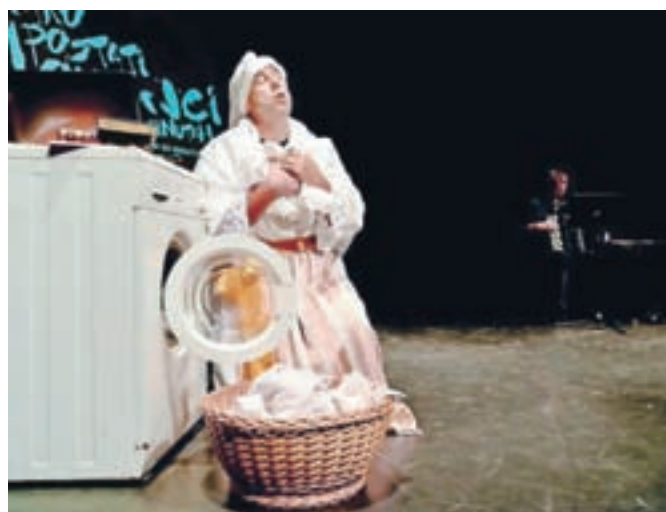
Uvodna predstava Slovenskega stalnega gledališča iz Trsta Kako postati Slovenci v 50 minutah

Že peti festival gledališča z naslovom Dnevi gledališča in glasbe bo Kropa letos gostila od sredine junija pa vse do prvega tedna v juliju.