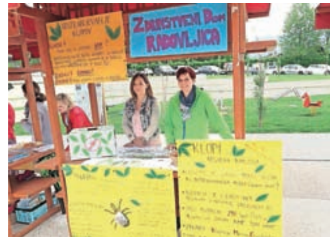
Zdravstveni dom Radovljica je predstavljal preventivo pred klopi in vse o cepljenju proti klopnemu meningoencefalitisu.

Bazar je namreč enkratna priložnost za občane, da na enem mestu dobijo veliko povsem konkretnih informacij in navodil za ohranjanje zdravja, in to povsem brezplačno.