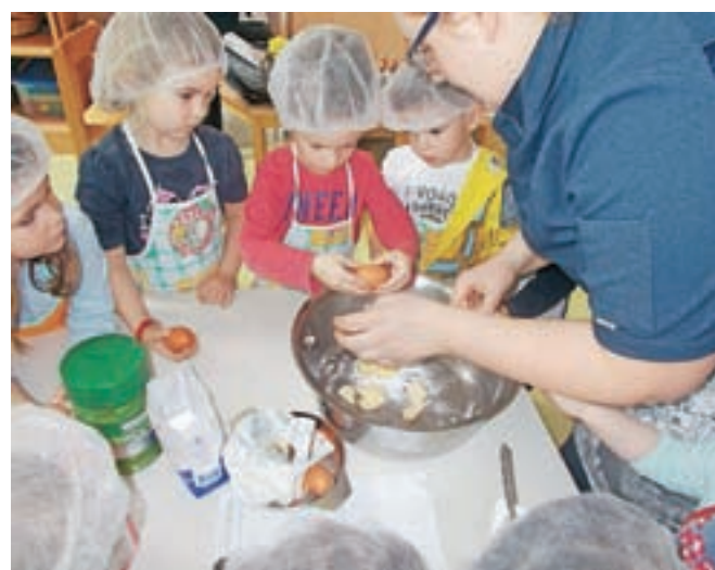
Otroci so uživali pri pripravljanju sladice.