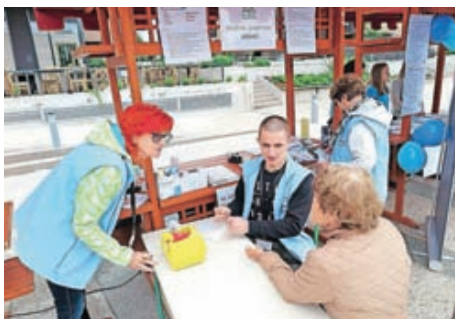
Obiskovalci so lahko brezplačno opravili različne meritve, tudi krvnega sladkorja, krvnega tlaka ...