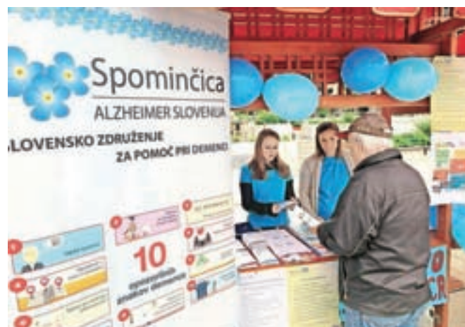
Slovensko združenje za pomoč pri demenci je predstavljalo tudi povsem praktične vaje za krepitev spomina.