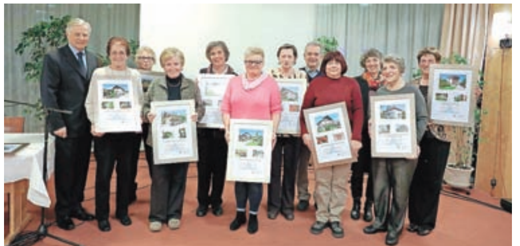
Prejemniki priznanj za lepo urejene hiše in vrtove