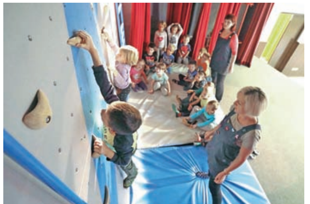
Otroci v teh jesenskih dneh pod nadzorom vzgojiteljic že uživajo v plezanju po novi plezalni steni.

Priložnost so izkoristili tudi za slovesnost ob zamenjavi strešne kritine na stavbi Doma krajanov, v kateri so