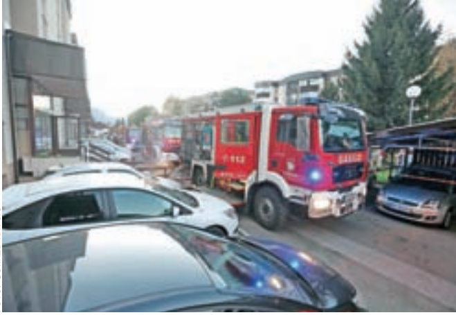
Dostop med prehodi je zaradi nadstreškov zelo otežen.

Radovljiški gasilci so v oktobru, mesecu požarne varnosti, pripravili gasilsko vajo, s katero so želeli preveriti, kako bi v primeru požara lahko posredovali v gosto naseljeni blokovski soseski na Gradnikovi ulici v Radovljici.