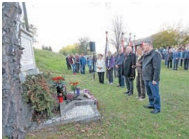
Poklonili so se spominu na ustreljene talce.

lili, da nam je hudo. Takrat se spomnimo, da so naše partizanke in partizani v mrazu in dežju, snegu in ledu pa tudi v neznosni vročini v rokah nosili svoje življenje za svobodo slovenskega naroda in domovino. Mnogi, ki so zanj padli, so nam s svojo žrtvijo omogočili, da danes to domovino tudi živimo. Zatorej imejmo jo radi, predvsem pa ravnajmo z njo smelo in previdno. Kajti domovina je kot čaša – iz nje lahko pijemo izvir zgodovinske modrosti ali pa jo razbijemo na tisoč koščkov. Imeti domovino, ki jo upravljaš sam, je zatorej velika odgovornost in prav je, da se tega tudi zavedamo.«