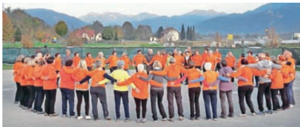
Na igrišču Vrtca Lesce je tokrat telovadilo kar 64 telovadk in telovadcev.