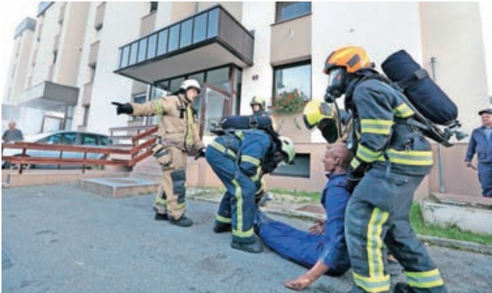
V gasilski vaji na Gradnikovi ulici je sodelovalo 39 gasilcev.

gasilske avtolestve, ki se na omejenem prostoru ne more vrteji tako, kot bi bilo treba za hitro in učinkovito posredovanje." Vaje se je udeležilo 39 gasil- cev iz prostovoljnih gasil- skih društev Radovljica, Lesce, Begunje in Hlebce ter jeseniški poklicni gasilci.