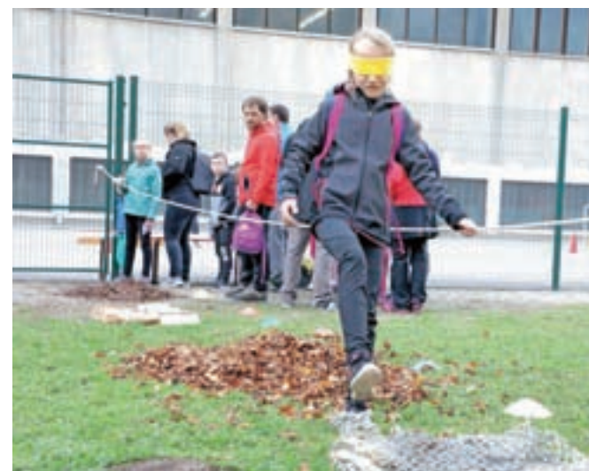
Vznemirljiva hoja po listju z zavezanimi očmi

Jesensko športno prireditev za učence so tokrat pripravili že četrto leto zapored, v prejšnjih letih so se jim pridružili tudi starši, osnovni namen jesenskega gibalnega društva pa je prav skupaj preživeti čas, naučiti se sodelovanja in se pri tem zabavati. "Pravkar začenjamo za našo šolo jubilejno, šestdeseto