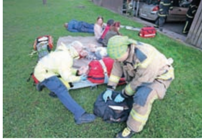
Del vaje je tudi oskrba ponesrečenih.

"Namen vaje je bil preveriti intervencijske poti na Grad-