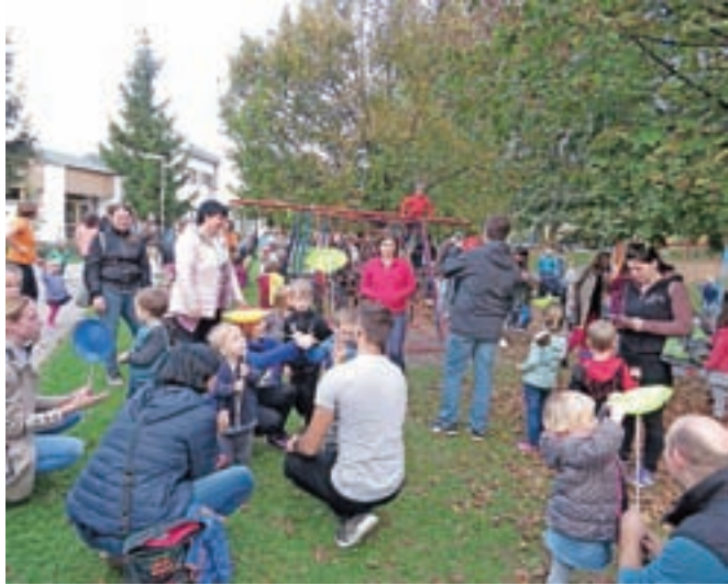
V program jesenskega srečanja so vključili veliko gibanja.

Na igrišču vrtca v Lescah so sredi oktobra pripravili popoldansko prireditev, jesensko srečanje staršev in otrok.