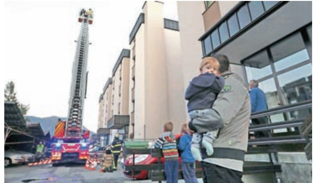
Posebej težko je bilo v ozkem prehodu upravljati gasilsko lestev.