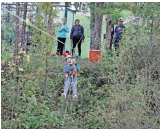
Užitek ob drznem spustu po jeklenici