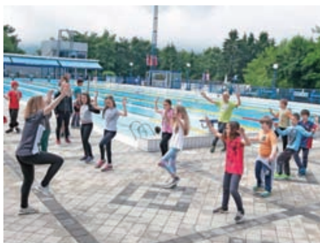
Ker je bilo vreme muhasto, so za otroke pripravili sklop aktivnosti ob bazenu, najpogumnejši pa so vendarle tudi plavali.

nedeljah pa od 10. do 19. ure. Rekreativno plavanje bo od ponedeljka do petka v juniju in juliju od 20. do 21. ure, avgusta pa od 18.30 do 20. ure. Cene vstopnic ostajajo na ravni lanskih, to je 5,5 evra za odrasle, 3,9 evra za otroke od 2. do 14. leta starosti in 3 evre za upokojenca, člane kluba. Pred začetkom poletne sezone so na kopališču opravili nekaj nujnih obnovitvenih del, je povedala Polona Rob s Plavalnega kluba Radovljica, novost je tudi novi najemnik okrepčevalnice na bazenu, saj se je dosedanj ž preselil v nove prostore na Vurnikovem trgu. »Lokal smo obnovili in na prostoru ob bazenu uredili