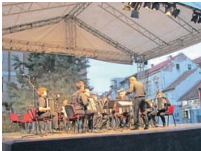
Harmonikarski orkester je navdušil poln Trg Stevana Sindelića v Svilajncu.