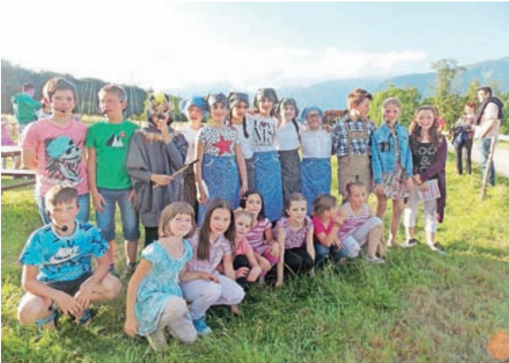
S spominom na kresno noč so se učenci mošenjske osnovne šole tudi poslovlili od šolskih klopi.

Poletni sončni obrat se zgodi okoli 21. junija, ko sonce doseže najsevernejšo lego na nebu. Posledično so to dnevi v letu, ko je dan najdaljši, noč pa najkrajša. V slovenski in evropski praznični tradiciji je na večer sončnega obrata, ki so ga povezovali z nočjo med 23. in 24. junijem, potekalo kresovanje, saj so naši predniki verjeli, da bo ogenj, zakurjen na kresno noč, pojemajočemu soncu pomagal ohraniti njegovo moč. V spomin na kresno noč so se tudi letos zbrali vaščani Mošenj in okoliških vasi, ki soncu niso dajali moči s kurjenjem kresov, ampak s smehom, ki ga je z narečno gledališko predstavo Žebjarjeve težave drugače sprožala dramska skupina Čofta, glasbenimi ritmi, za katere je