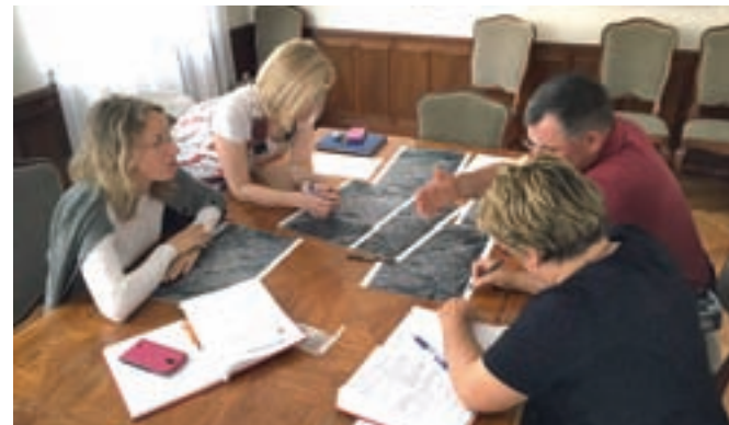
Prva delavnica v okviru CPS za zaposlene na občini

CPS je ključno orodje novega pristopa k načrtovanju prometa. Gre za nov način razmišljanja, ki pomeni korak k trajnostnemu načrtovanju prometa v občini. Ključnega pomena za uspešno izvedbo projekta je tesno sodelovanje strokovne projektne skupine z občinskimi predstavniki in z občani. S pripravo in uresničenjem CPS želi Občina Radovljica doseči boljše povezanost mestnega in podeželskega območja, povečati prometno varnost in izboljšati kakovost celotnega življenjskega prostora.