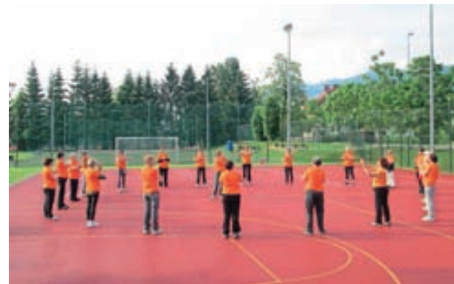
Vsak dan se okoli petindvajset udeleženk telovadbe 1000 gibov ob pol osmi zjutraj zbere na športnem igrišču v Radovljici, kjer dan začnejo tako, da dodobra razgibajo telo.