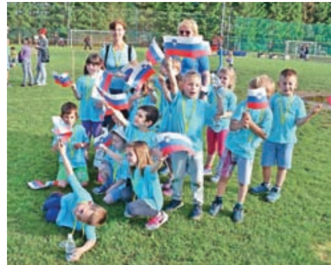
Vsaka skupina je tekmovala v majici posebne barve in se trudila na vso moč.

vila devet raznolikih gibalnih postaj, kjer so otroci urili različne gibalne sposobnosti. Preizkusili so se v zanimivih športnih vsebinah, prilagojenih njihovi starosti in zmogljivostim, ki so otroke hkrati tudi zelo zabavale. Starši, bratci, sestre in znanci so poskrbeli za športno navijanje. Vsak otrok je prejel majico v barvi svoje skupine, ki ga bo še po odhodu iz vrtca spominjala na ta dogodek in preživete dni v vrtcu. Otroci so se res trudili uspešno opraviti vseh devet nalog in zato so si na koncu vsi prislužili kolajno, ki so jim jih podelile vzgojiteljice. Sledil je svečan zaključek s himno. Druženje smo nadaljevali v sproščnem vzdušju, kjer so se lahko vsi otroci vključevali v raznolike delavnice. Zabavali so se s Plesno šolo Studio ritem, Plesno šolo Miki, v pokritem športnem parku