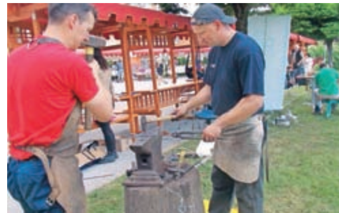
Tradicionalno kovaštvo so prikazali s kovanjem žbljev.

bi se naši obrtniki in podjetniki predstavili lokalni skupnosti s svojimi izdelki in storitvami. Ideja je padla na plodna tla in lansko leto smo prvič organizirali Tržnico obrtnikov, kjer je sodelovalo 11 naših članov. Izrazili so željo,