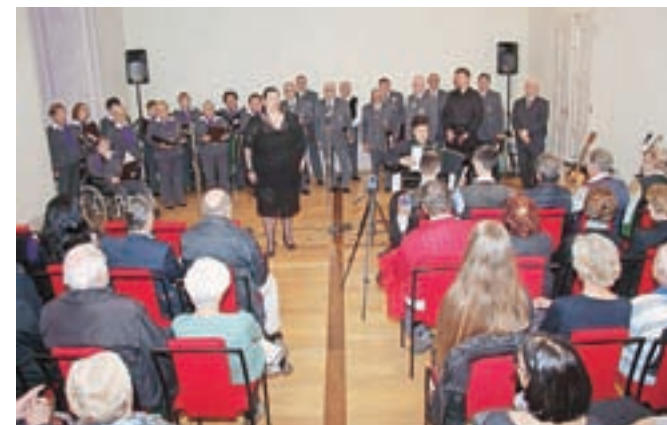
Koncert veteranskega pevskega zbora