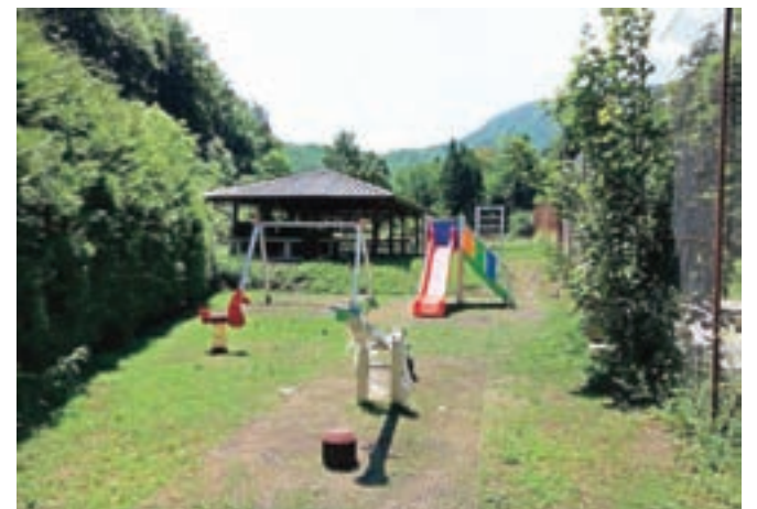
Ob bazenu v Kropi so postavili nova, privlačna igrala za najmlajše, letošnja novost je tudi ponudba prigrizkov v lokalu.