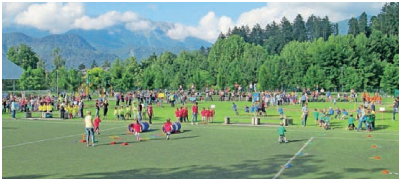
V športnem parku se je na prireditvi Gibajmo se skupaj zbralo sto šestdeset otrok iz vseh sedmih enot VVZ Radovljica, skupaj s starši, brati, sestrami in seveda vzgojiteljicami.