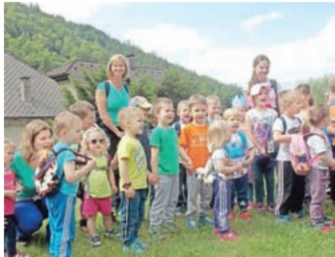
Pri ureditvi so z otroško domišljijo sodelovali otroci kroparskega vrtca.

Vzgojiteljice vrtca v Kropi so se skupaj z otroki in njihovimi starši odzvale povabilu Turistične zveze Slovenije na projekt Turizem in vrtec. Osnovali so idejo o pravljici pešpoti, združili moči in v kovaški Kropi uredili Kovačkovo pot, kjer prebivajo pravljica bitja, ki vabijo na obisk vse generacije rekreativnih pohodnikov.