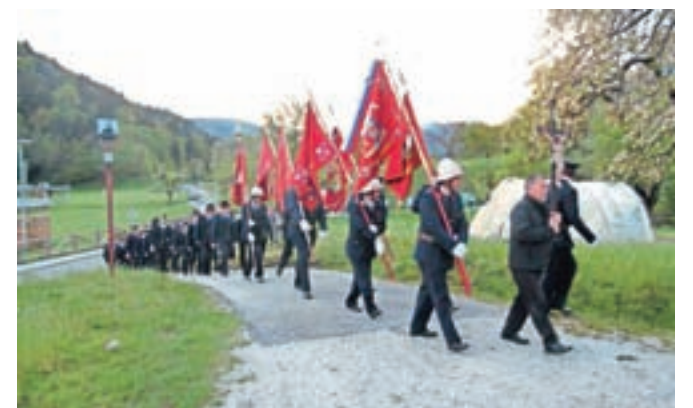
Gasilska povorka na praznik svetega Florjana