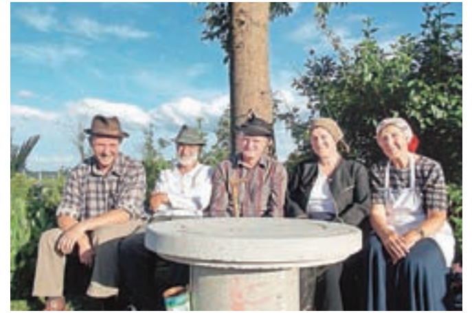
O žebjarjevih težavah so v narečno-humornem jeziku spregovorili člani dramske skupine Čofta.

poskrbela mlada glasbena zasedba Dar Mar, in recitacijami, petjem ter poučnimi dejstvi o kresni noči, s čimer so se predstavili učenci mošenjske osnovne šole. »Že peto leto zapored smo obudili spomin na star praznik in običaje kresne noči. Vse prireditve v Mošnjah posvečamo starim praznikom, običajem in kulinariki, saj se ponašamo s staro zgodovino in to zgodovinsko noto želimo poudarjati. Vsako leto prireditev O kresi se dan obesi povežemo tudi z zaključkom šolskega leta za učence mošenjske osnovne šole, saj v okviru te prireditve