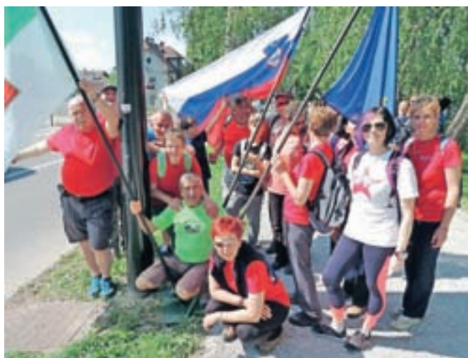
Pohodniki v Ljubljani