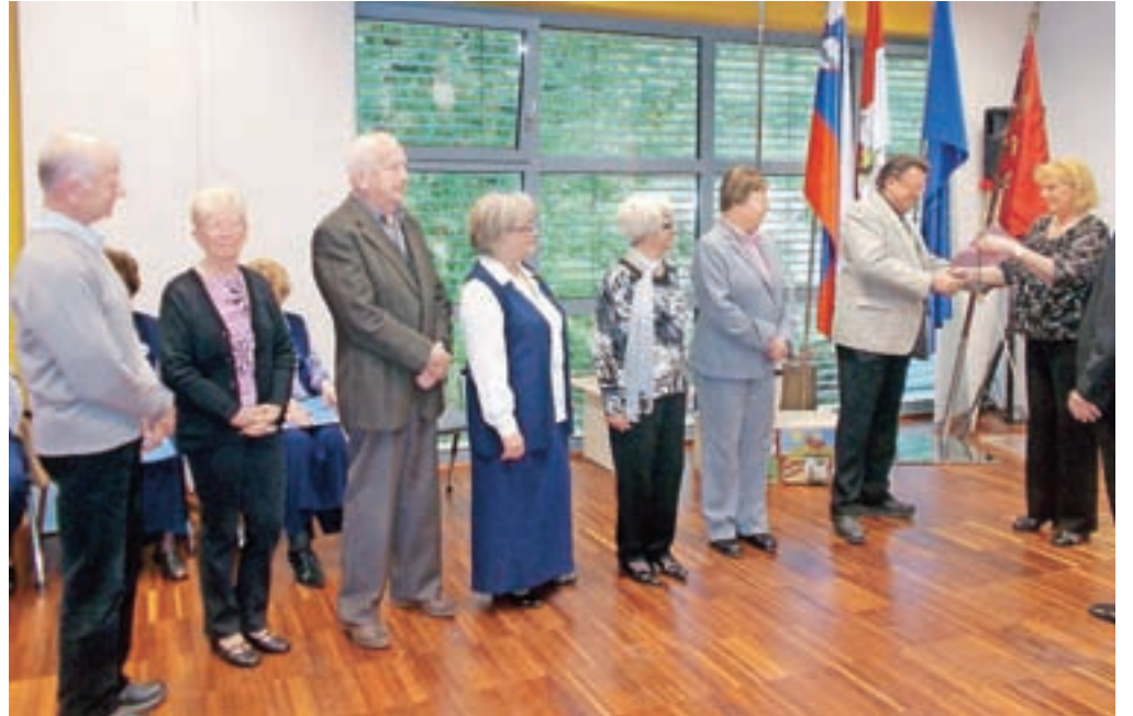
Nagrajenci Društva upokojencev Lesce

Delo v društvu je zasnovano na prostovoljni bazi. Najbolj prizadevnim prostovoljcem so za njihov doprinos in požrtvovalno dolgoletno delo podelili priznanja. Pre-