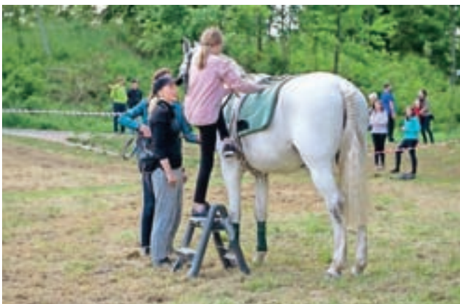
Kar dvajset različnih delavnic so pripravili organizatorji, med najbolj obiskanimi je bila tista, na kateri so se otroci lahko povzpeli na konja.

Prireditve se je skupaj udeležilo okoli 1300 otrok in odraslih, ki so z nakupom vstopnic in srečk pomagali šolarjem do boljših delovnih pogojev.