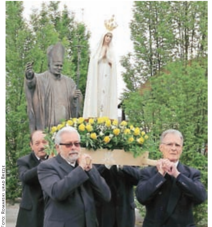
Fatimska Marija pred kipom papeža Janeza Pavla II