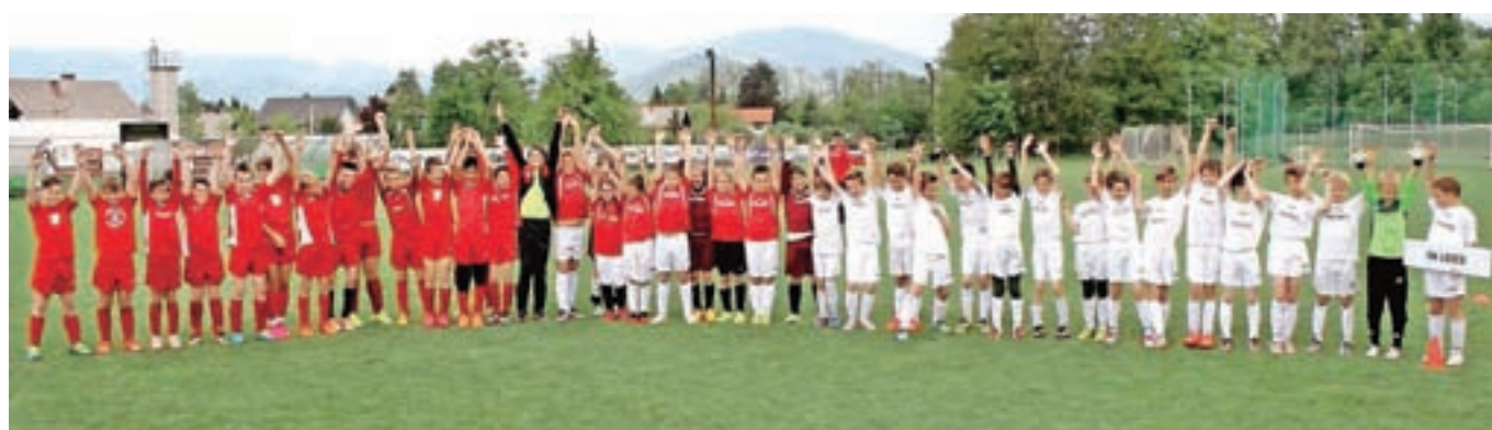
Selekciji U-12 in U-10, ki sta v Lescah na turnirju osvojili tretje mesto.

Kljub ne preveč obetavnim napovedi je vreme »pokazalo zobe« le v soboto popoldne. V obeh dneh smo bili priča številnim zanimivim tekmam, lepim golom, dobrim posameznikom, veliki želji in borbenosti mladih nogometašev. Pri vseh udeležencih je bilo opaziti nasmešek na obrazu in to je gotovo največja nagrada za prizadevnega organizatorja. Verjamemo, da bomo nečemu podobnemu priča tudi naslednje leto.