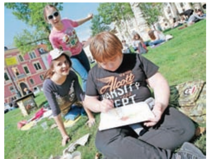
Mladi so uživali pri ustvarjanju.