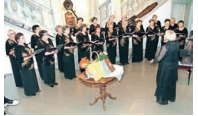
Ženski pevski zbor Lipa, ki deluje v okviru Društva upokojencev Radovljica