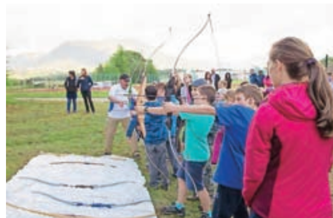
Streljanje z lokom je večšina, v kateri se nimamo zelo pogosto priložnosti preizkusiti, zato so tokrat mnogi izkoristili priložnost.