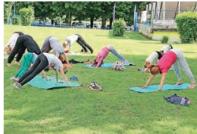
Delavnice so se odvijale tako v šoli kot na igriščih in športnih objektih v okolici.