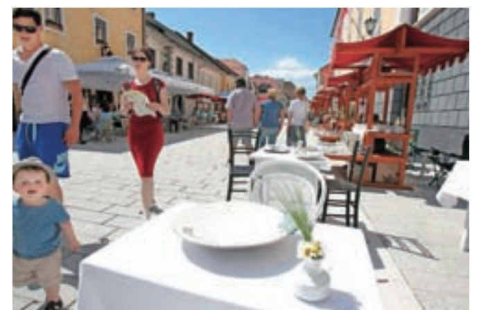
Zmagovalni krožnik po izbiri obiskovalcev festivala je delo Darinke Lapajne.