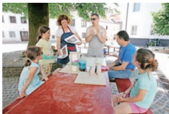
Delavnice oblikovanja gline so pripravili mojstri iz varstveno-delovnega centra CUDV Radovljica.