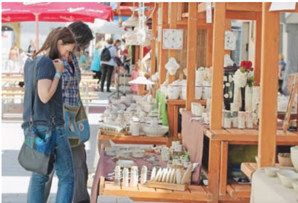
Številni domačini in obiskovalci Radovljice so soboto preživeli po pohajkovanju v starem mestnem jedru.