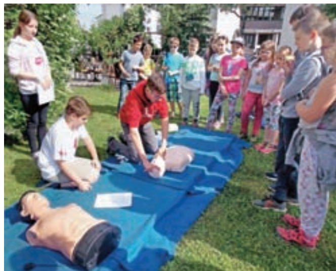
Prikaz pravilnega postopka oživljanja odrasle osebe