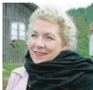
Jennifer Clement je bila lansko leto kot prva ženska v zgodovini izvoljena za predsednico Mednarodnega združenja PEN.