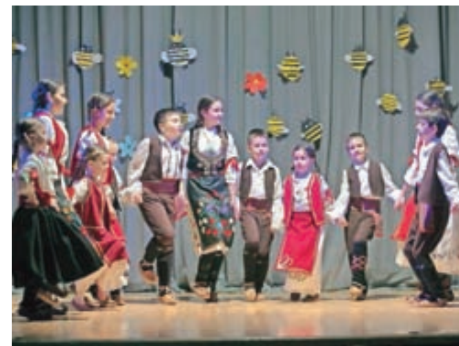
V goste so Č'belce povabile skupino Vukove ptičice, ki se je predstavila s plesi iz Dimitrovgrada in ostale Srbije.