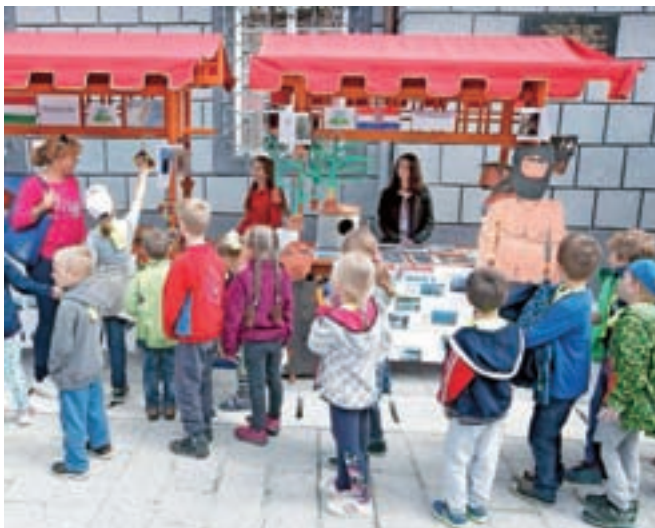
Čudovit sončen dan je v Evropsko vas na Linhartovem trgu privabil številne šolarje in druge obiskovalce. Šola gostiteljica je na svoji stojnici predstavila kulinarčne, geografske in zgodovinske značilnosti Grčije, Estonije in Portugalske.