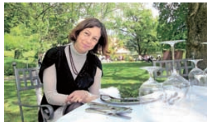
Tisti, ki jih je tržnica utrudila, pa so si na čudovit pomladni dan takole privoščili počitek.