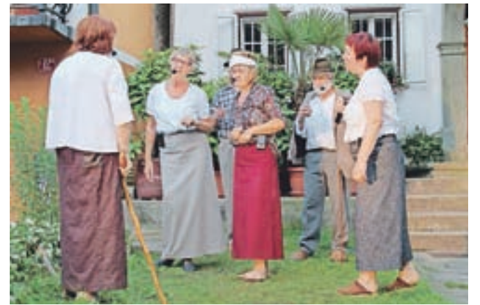
Lanska predstava Pej no hodiče past v izvedbi domače dramske skupine iz Kroke.

pretežno obarvan s komedijami. "Festival se obrača k vsem generacijam, nastopajo otroci, mladi, odrasli in starejši in prav vsem tem skupinam je program namenjen, vsak mora najti kaj zase. Usmeritev je preprosta – v program uvrščamo amaterske in polprofesionalne skupine, ki se kulturno udeležujejo na višji ravni. Prvi namen je prav gotovo predstaviti lokalni publiki dejavnost od drugod pa tudi izmenjava mnenj, pogledov in načinov dela. Drugi pa omogočiti gostovanja izven domačih krajev vsem skupinam, ki rade in pogosto gostujejo, pa tudi onim, ki tega ne počnejo oz. za to nimajo možnosti. Obenem pa ugotoviti položaj domačih kulturnih deležnikov, ki z vsakoletnimi nastopi na festivalu ohranjajo kondicijo in stik z domačim občinstvom."