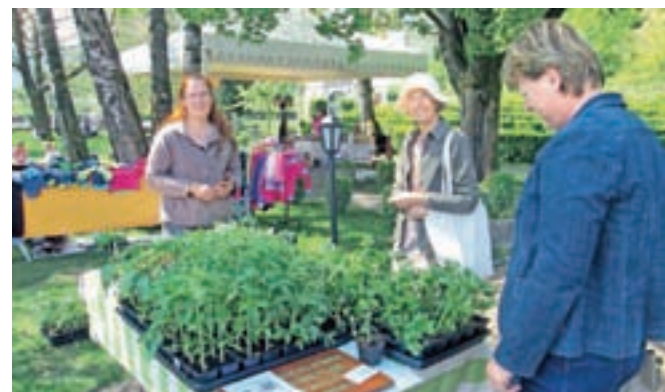
Prejšnjo soboto je bila navdušenim obiskovalcem na voljo pestra ponudba sadik.