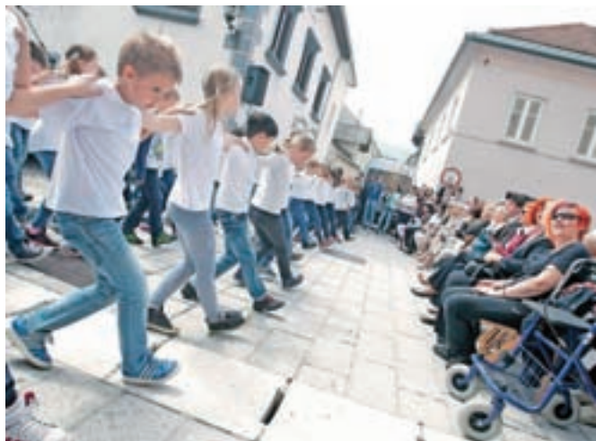
Organizatorji so pripravili tudi zanimiv spremljevalni program.