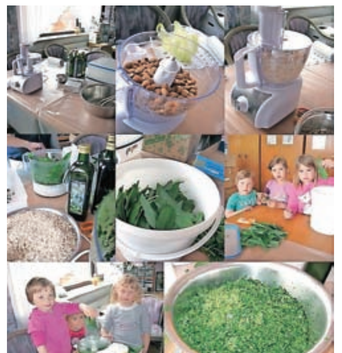
Letos so že izdelali naraven čemažev pesto.