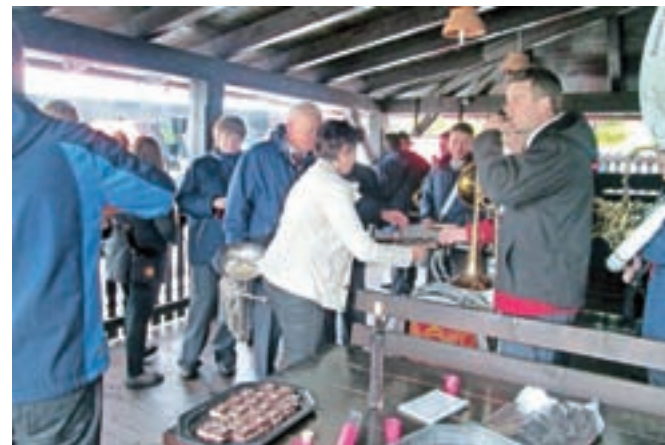
Ker je bilo vreme deževno, so gostitelji poskrbeli, da so glasbeniki igrali pod nadstreški, na suhem.