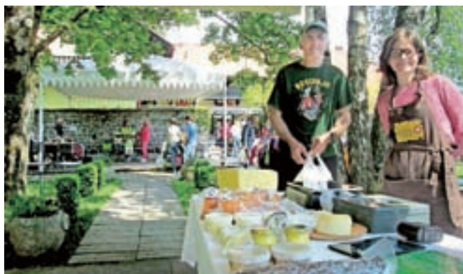
Na tržnici se vsako prvo soboto v mesecu predstavljajo lokalni dobavitelji.

so odprta, za sodelovanje na tržnici ne zaračunavamo nobenih najemnin ali česa podobnega; pravzaprav pa mislim, da so vsi, ki pridejo sem, predvsem pa ponudniki, zadovoljni, ker jim podvinska tržnica ponuja možnost druženja in povezovanja."