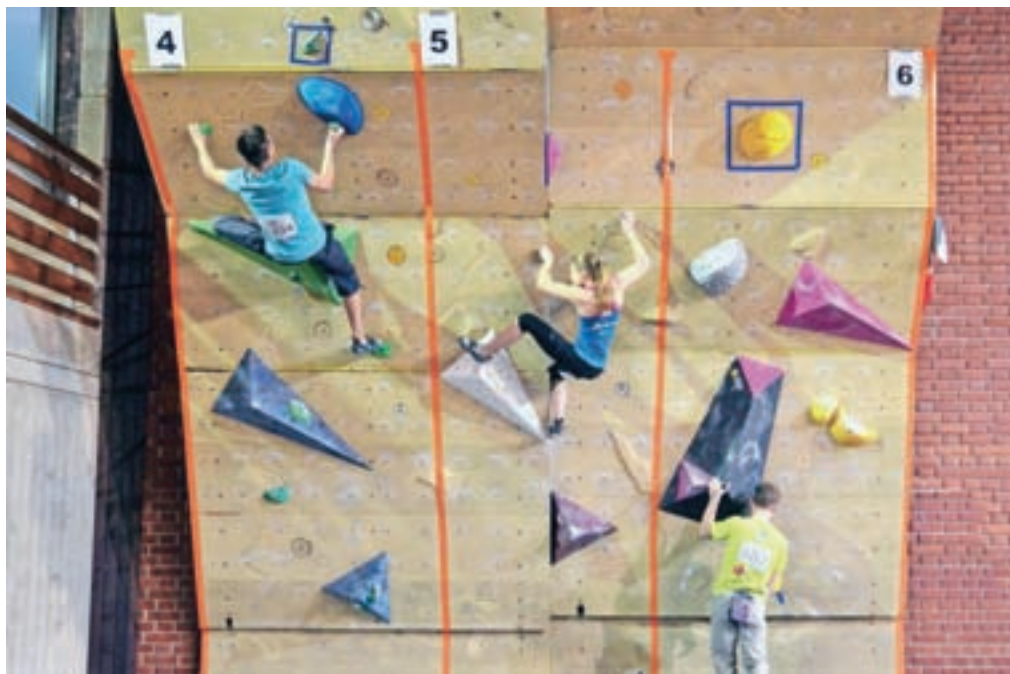
Plezanje, avtor Simon Senica, diploma