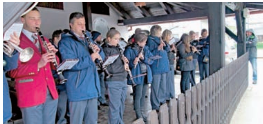
Tudi v Mošnjah, kjer so letos igrali že peto leto zapored, so jih pogostili z domačimi dobrotami.

Pred prihodom v Mošnje so igrali še na Selu, v Žirovnici, Hrašah in še enkrat v Lescah, tokrat na Trati. Sledila je Radovljica, kjer so jih posebno z navdušenjem poslušali v Domu dr. Janka Benedika, nato Mošnje, Brezje, Črnivec, Ljubno, Podnart, Kropa in Kamna Gorica ter Lancovo, praznično budnico pa so popoldne tako kot vsako leto sklenili s koncertom v Kampu Šobec.