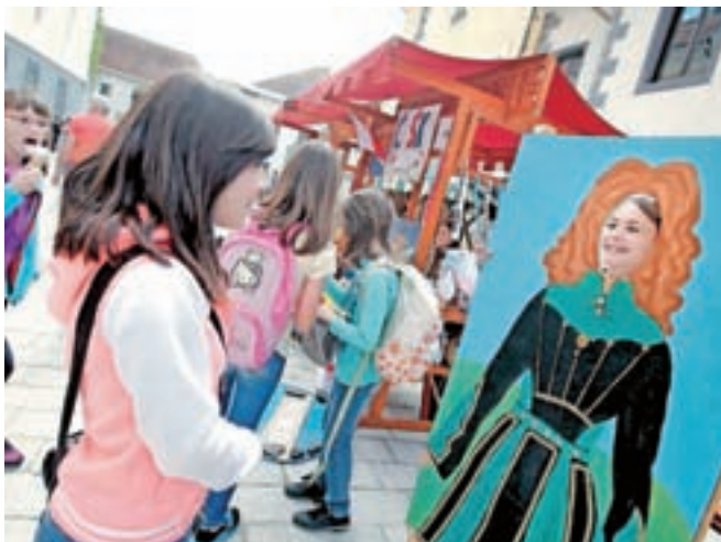
Učenci so si izmislili tisoč in eno zanimivo predstavitev evropskih držav.