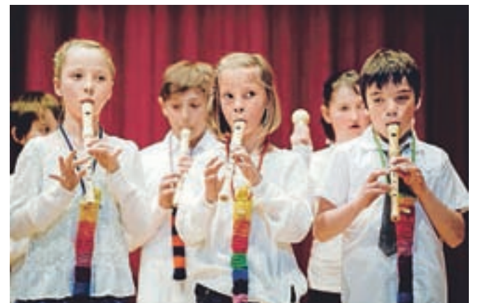
Etuije za flavte so si spletli sami. / FOTO: IZTOK ZUPAN