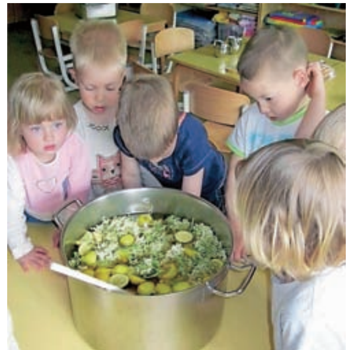
Otroci so skupaj z vzgojiteljicami pripravili šabeso.

lave »zdravil domače lekarne vrtca« pa spoznajo tudi njihove zdravilne učinke in jih skupaj s starši uporabijo.