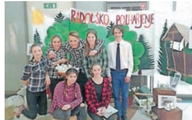
Člani turističnega krožka Osnovne šole A. T. Linhartar