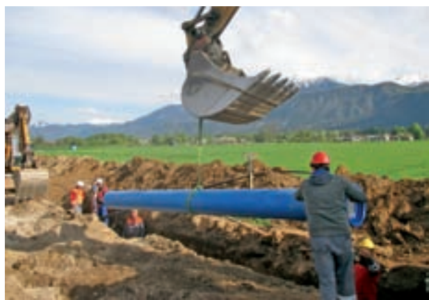
Povezovalni vodovod Hraše-Ledevnica bo pomembno vplival na kakovost pitne vode

Omrežnina oskrbe s pitno vodo se zaračunava glede na zmogljivost vodovodnega priključka, kar je določeno s premerom vodometra v milimetrih (DN) in izraženo s faktorjem omrežnine. V ceno omrežnine za vodo so vključeni stroški najema in zavarovanja infrastrukture, ki je potrebna za izvajanje javne oskrbe s pitno vodo.