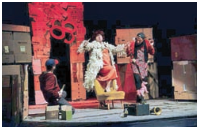
Predstava Gledališča 2B, Bomba v bordelu

Med 11. in 16. majem bo radovljiška Območna izpostava Javnega sklada RS za kulturne dejavnosti organizirala že 19. Linhartov gledališki maraton.