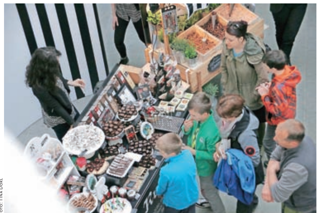
Kljub rekordnemu številu obiskovalcev tokrat niti v Graščini ni bilo neznozne gneče.