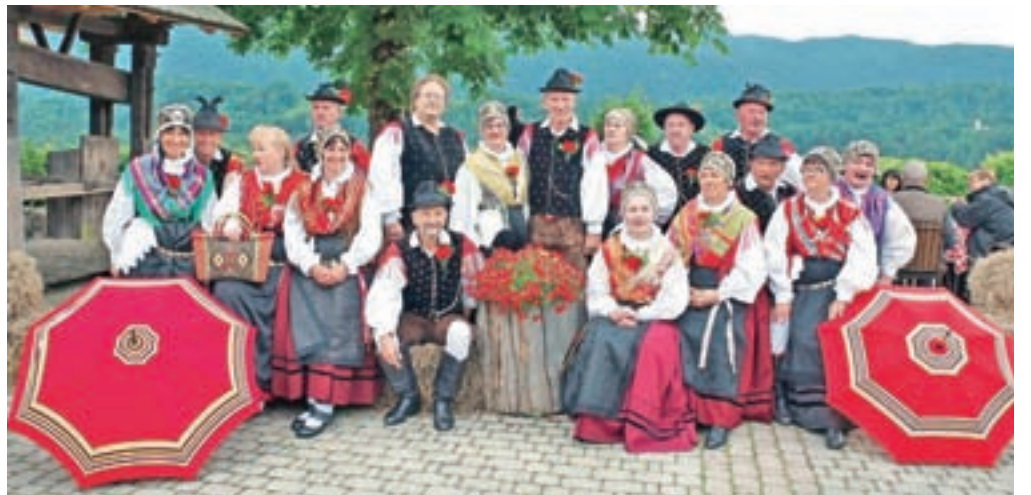
Folklorna skupina Lesce

je. Lani nam je uspelo kupiti majice in jakne, tako da smo enotno oblečeni tudi kadar smo 'v civilu'. Izdali smo tudi koledar z lepimi slikami.« Vaje imajo dvakrat na teden v Centru v Lescah, in sicer ob ponedeljkih in sredah od 18. do 20. ure. Že kmalu jih čaka več nastopov, prvi večji bo na območnem srečanju, ki ga v Bohinju organizira javni sklad, načrtujejo tudi ponovni obisk Francije in še druge nastope v bližnji in daljni okolici. Stane Frelj je dodal še to, da jih publika povsod lepo in toplo sprejme. Članom skupine pa je pomembno zlasti druženje, s katerim si popestrijo čas, gledalcem pa prikažejo kulturno dediščino ljudskega plesa in običajev. Zaključil je z mislijo: »Pleše srce, in ne noge!«