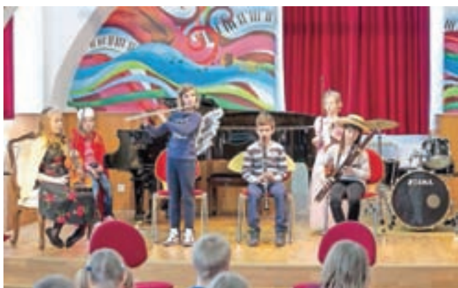
Glasbena pravljica v izvedbi učencev Glasbene šole Radovljica