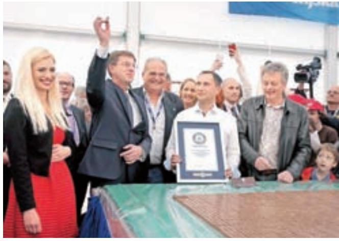
Prvi košček 142,32 kvadratnega metra velike čokolade, ki so jo izdelali v čokoladnici Cukrček, uradno izmerili za vpis v Guinnessovo knjigo pa na Vurnikovem trgu, je odlomil predsednik vlade Miro Cerar.