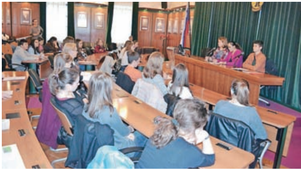
Mladi so tudi letos zasedli klopi velike sejne sobe Občine Radovljica.

V anketah, ki so jih opravljali med vrstniki, mladi ugotavljajo pretirano uporabo računalnika, mobitela in televizije pri osnovnošolskih, ki se dnevno šteje v urah. Nekaj osnovnošolcev že redno kadijo, kar nekaj jih je bilo tudi že opitih, nekateri pa so že poskusili prepovedane droge. Ugotovili so tudi, da se učenci z višjo zaključeno oceno ukvarjajo z več izvenšolskimi dejavnostmi, kar pomeni, da je neaktivno preživljanje prostega časa povezano z neuspehom v šoli, ki pa največ-