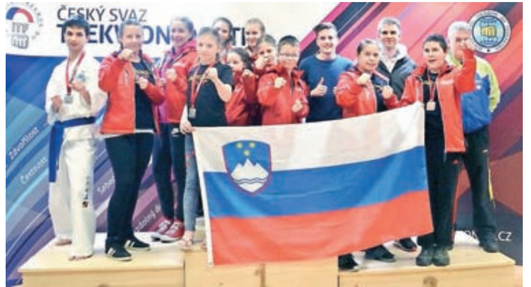
Na tekmovanju na Češkem

del treningov taekwon-do-ja je vzgoja športnikov, kar terja od trenerjev neprestano izpopolnjevanje, v prvi vrsti znanja tehnike in teorije, pa tudi večine vzgoje in pedagogike. Zato se člani in trenerji kluba nenehno izobražujemo ter obiskujemo seminarje doma in v tujini, saj smo le tako lahko kos razvoju športa. Izobraževanje vključuje učenje tehnik taekwon-do-ja, spremljanje novosti, pridobivanje trenerskih in pedagoških veščin, vse s ciljem, da v klubu zagotavljamo izobražen in certificiran športno pedagoški kader. Na ta način zagotavljamo kakovostno delo in čim boljše možnosti ter izhodišča, tako za tekmovalce kot za rekreativce v klubu." Nekateri člani kluba so se prejšnji mesec udeležili udeležili mednarodnega prvenstva in kvalifikacijske tekme za Češko ITF reprezentanco v Teakwon-Do-ju ITF verzije, Czech open 2016. V visoki konkurenci preko 400 tek-