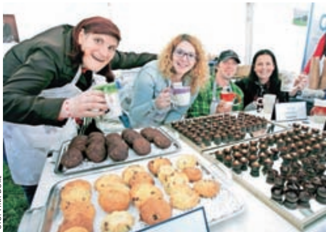
Na stojnici CUDV Matevža Langusa Radovljica so ponujali sladke dobrote in čudovite lončke za vročo čokolado.