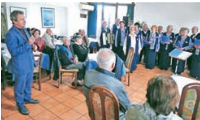
Nekdanjim izgnancem je na občnem zboru zapel pevski zbor Slavček.