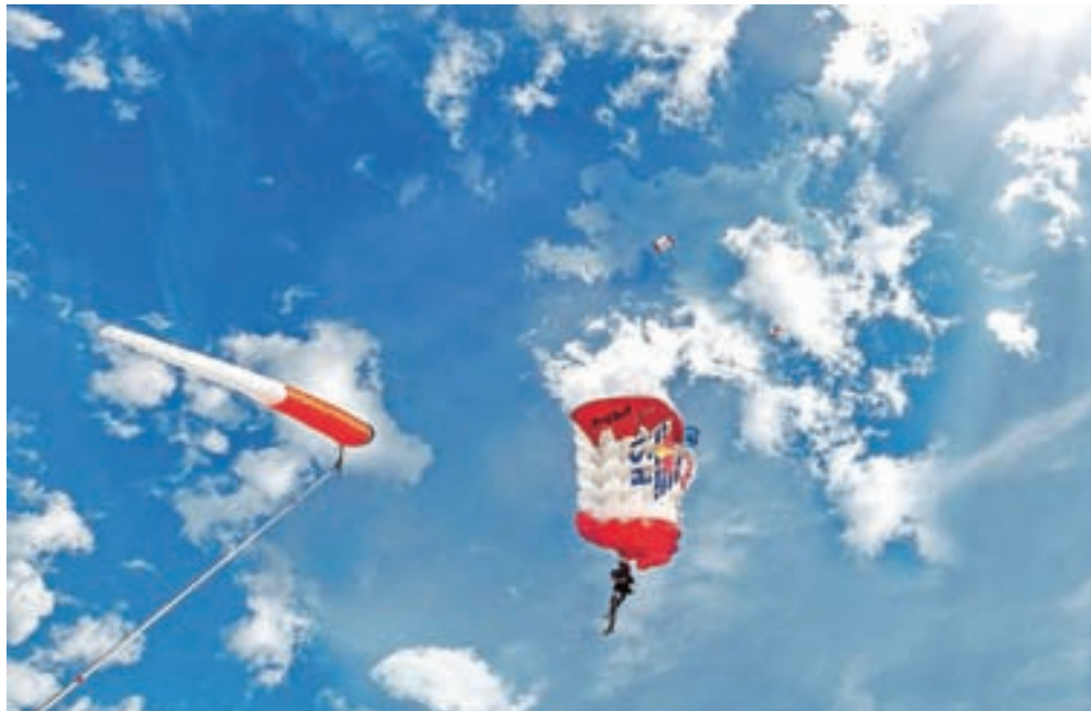
Prava smer, avtor Bor Rojnik, 3. nagrada na natečaju Dogodki v občini Radovljica 2015

Fotografsko društvo Radovljica že osmo leto zapored zapisuje natečaj Dogodki v občini Radovljica. Tema natečaja so letošnji dogodki v vseh krajih občine, prvič pa je razpisana dodatna tema, in sicer Čebelarstvo in čebele v občini Radovljica. Na natečaju lahko sodelujete z dokumentarnimi fotografijami javnih prireditvev, kot so proslave, športni in kulturni dogodki, pomembni obiski ..., ter večjih arhitekturnih oziroma okoljskih sprememb. Vsak lahko sodeluje s fotografijami za največ deset dogodkov, za vsak dogodek z največ štirimi fotografijami, na temo Čebelarstvo in čebele v občini Radovljica v letu 2016 pa vsak avtor lahko sodeluje s šestimi fotografijami. Tema zajema človeka pri delu s čebelami, čebelnjake, proizvode medu, čebele ... Organizator sprejema samo digitalne fotografije v formatu jpg, je sporočila Manca