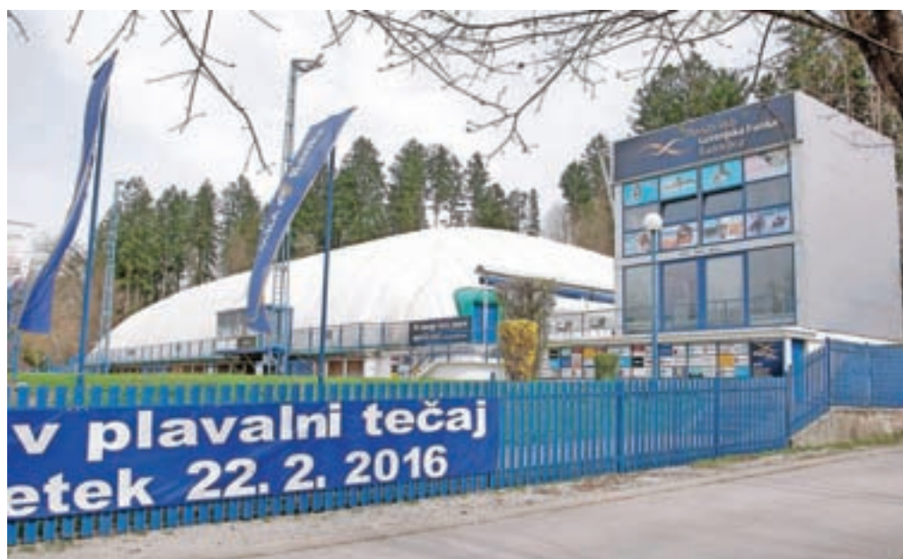
Radovljiško kopališče je že dalj časa potrebno temeljite prenove. Pridobljeno gradbeno dovoljenje in status olimpijskega športnega centra, ki ga ima Radovljica, sta dober temelj za uspešno pridobivanje sredstev, potrebnih za izvedbo projekta.

Izvedba je načrtovana v dveh fazah v obdobju 2017–2019, še pojasnjujejo, v načrtu razvojnih programov je v tem obdobju za ta projekt predvidenih 7,4 milijona evrov. »Izvedba je predvidena pretežno z nepovratnimi sredstvi. Tako je dejanski začetek gradnje odvisen od pridobitve sredstev na razpisih za državna in evropska sreds-