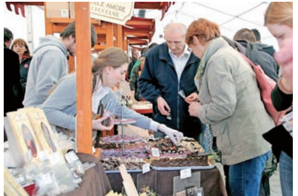
Ker se je letošnja prostorska širitev festivala izkazala za pravo odločitev, organizatorji razmišljajo, da bi v prihodnje s čokoladno ponudbo zapolnili še kakšno od stranskih ulic Linhartovega trga.

»V Radovljico prihajamo vse od prvega festivala naprej. Med štirimi do petimi tovrstnimi prireditvami, ki se jih udeležimo, je radovljiška prav gotovo naša najljubša,« je povedala Danijela Šegula iz koprške čokoladnice Da