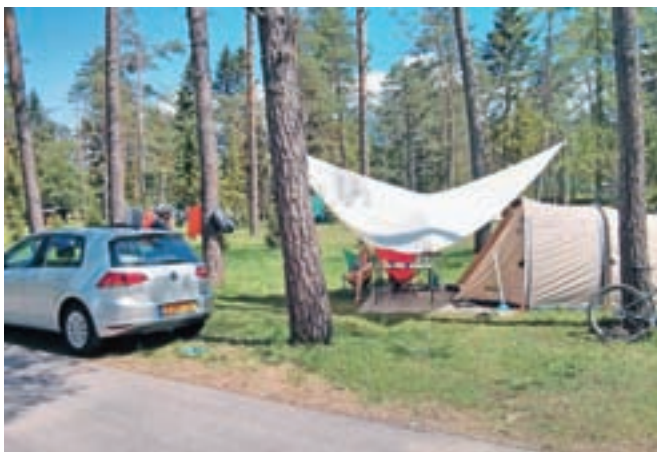
Pomladno vzdušje v kampu Šobec

Priprava razvojnih načrtov seveda ne preprečuje ambiciozno zastavljenih načrtov za letošnjo sezono. Predlansko je zaznamovalo neurje z žledolomom, zaradi katerega so morali ogromno energije in sredstev vložiti v prenovu kampa, ki so jo uspešno zaključili še pred začetkom lanskega poletja. V letošnjo sezono tako stopajo pripravljeni in optimistični. Načrtujejo 13-odstotno povečanje števila turistov, med katerimi sicer tradicionalno