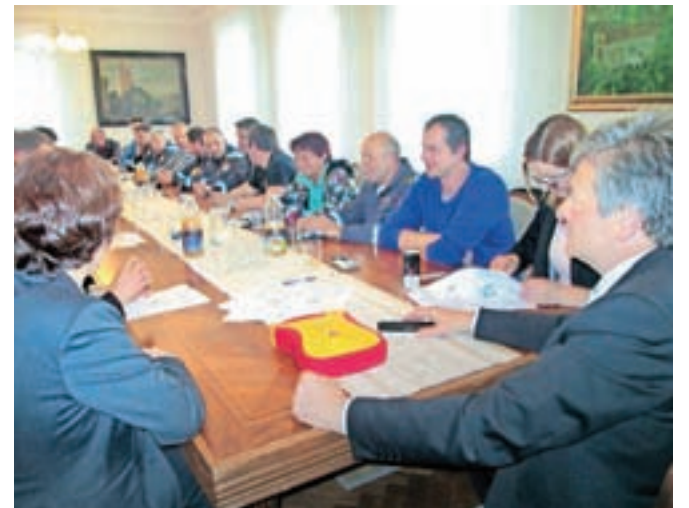
Ob podpisu dogovora

Občina Radovljica načrtuje tudi postopno vzpostavitev učinkovite mreže javno dostopnih avtomatskih defibrilatorjev, ki bo omogočala oživljanje v času znotraj petih minut po nenadnem srčnem zastoju kjerkoli na območju občine Radovljica. Občina Radovljica za izvedbo projekta zagotavlja ustrezno opremo za izvedbo izobraževanja (lutke, učne defibrilatorje) ter opremo za prve posredovalce (žepne