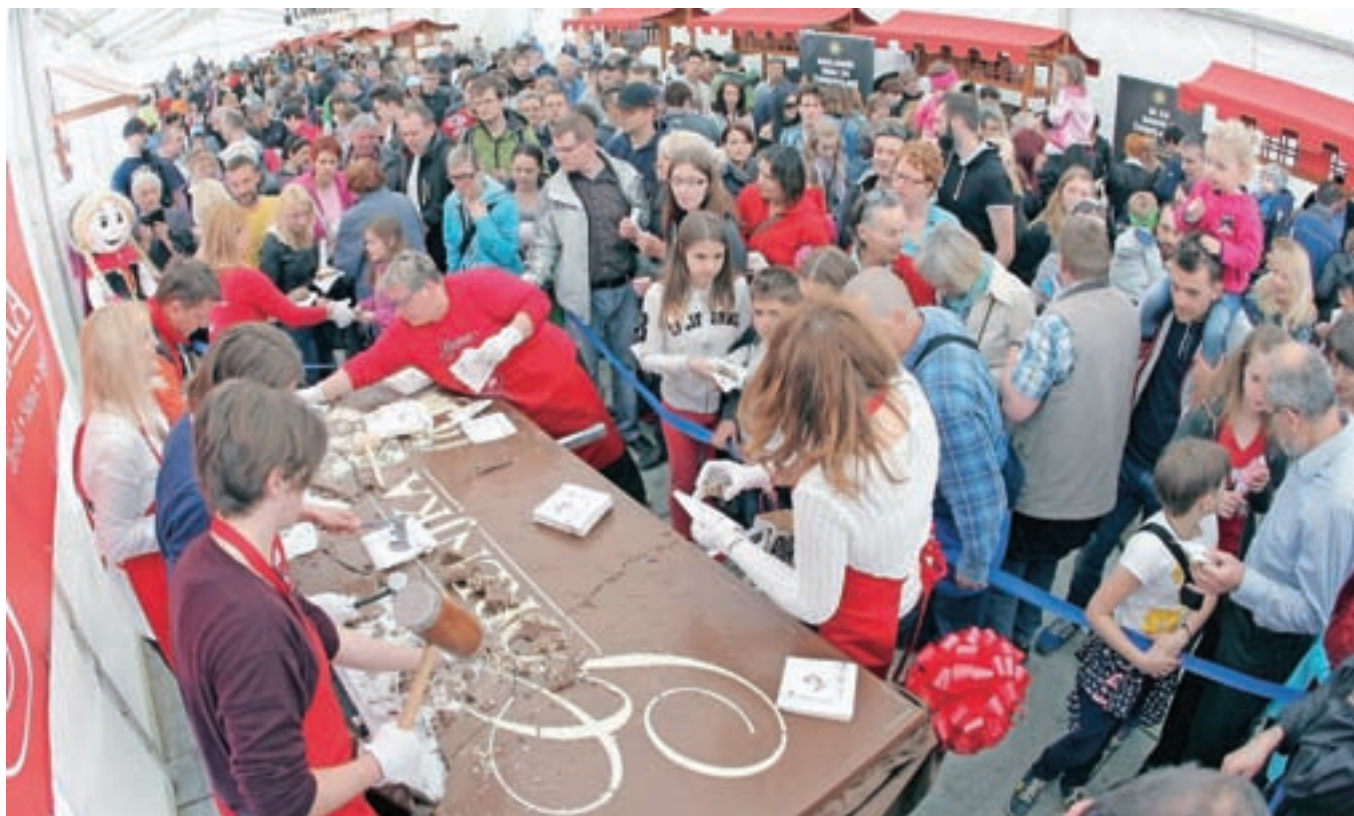
Festival čokolade je letos obiskalo okoli 60 tisoč ljudi, to je desetkrat več kot prvega pred petimi leti.