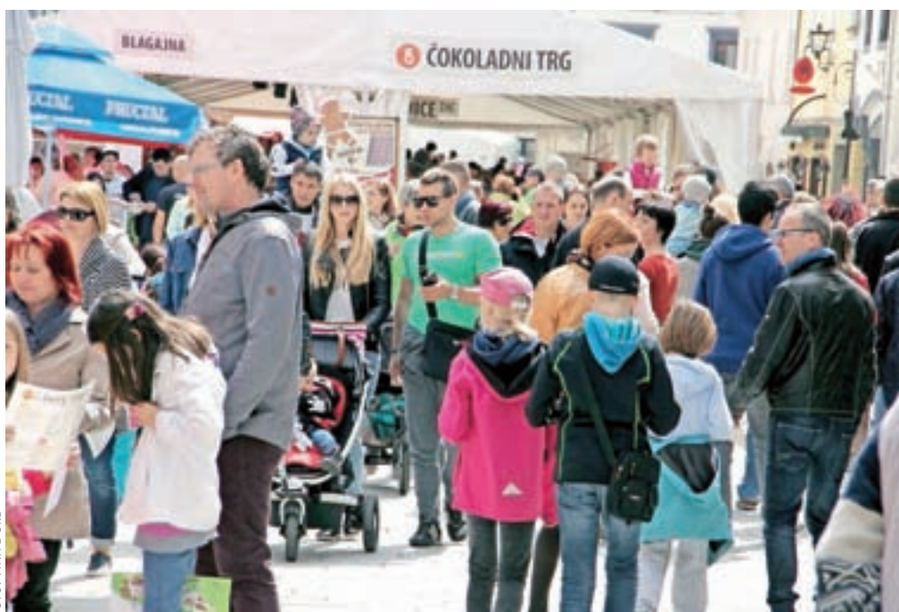
Obiskovalci od blizu in daleč so uživali v čudovitem dnevu v starem delu Radovljice.