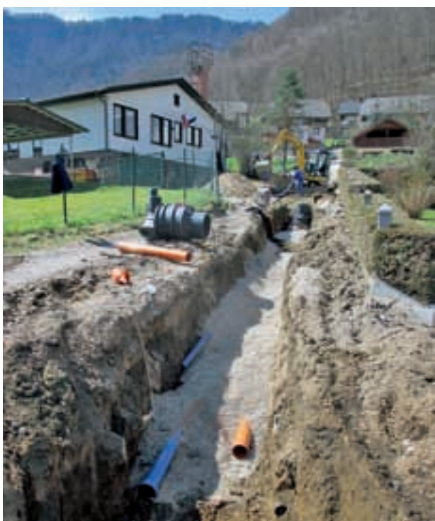
V letu 2015 je bila v Kropi dokončana gradnja kanalizacije s hišnimi priključki in večina vodovoda.

Komunala Radovljica, d.o.o. Ljubljanska cesta 27, 4240 Radovljica tel.: 04 537 01 11, faks: 04 537 01 12 e-naslov: info@komunala-radovljica.si www.komunala-radovljica.si