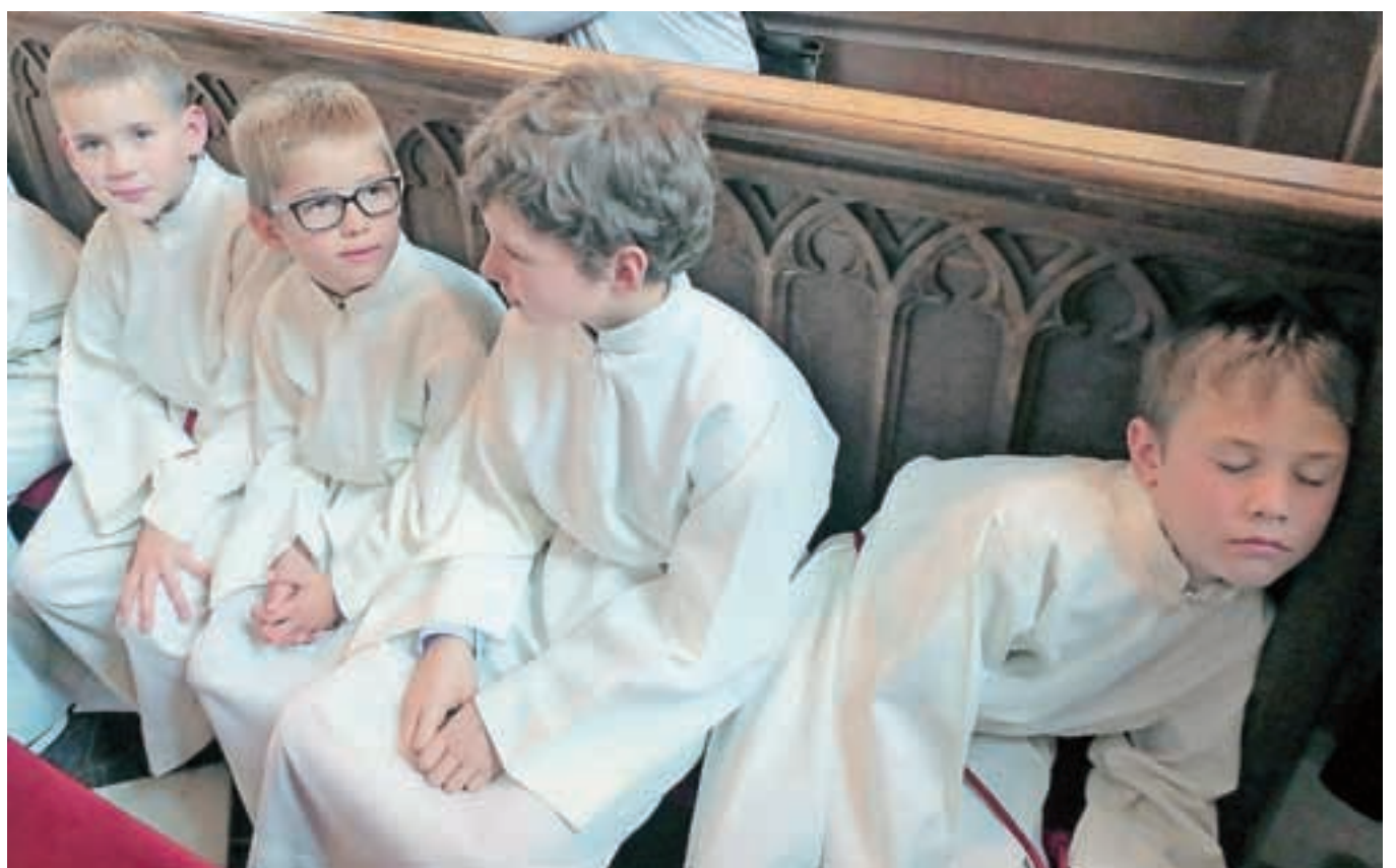
Speči ministrant na novi maši, avtor Ljubo Kozic, 2. nagrada