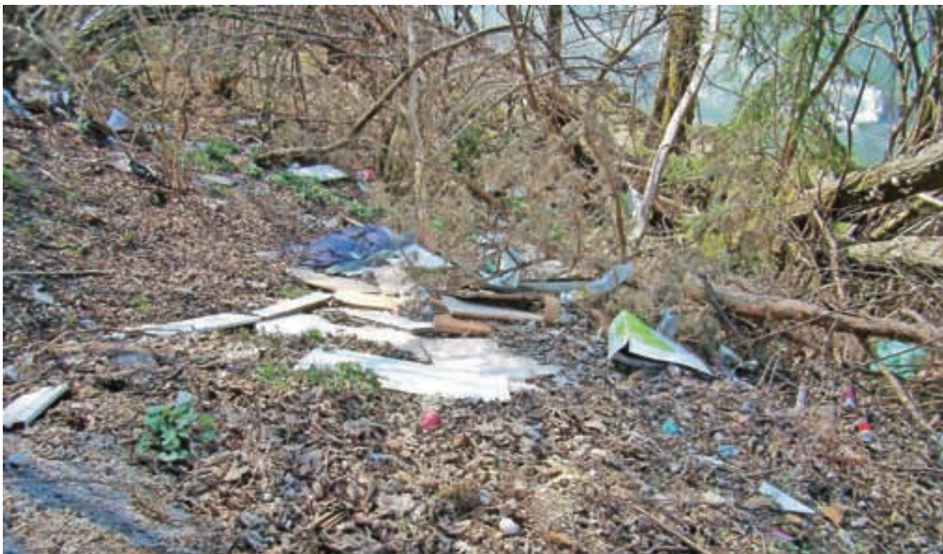
Odpadke ob Savi na Posavcu so občina in ribiči že večkrat odstranili, vendar jih neznan nevestneži kljub temu spet odložijo.

Graščini, s tem da bodo na Linhartovem trgu stojnice nameščene le po eni strani trga, stojnice s ponudbo čokoladnih sladk, ki so lani stale v grajskem parku, pa se bodo nadaljevale na trgu pred cerkvijo. Na parkirišču pred hotelom Grajski dvor bodo tudi letos kuharske delavnice.