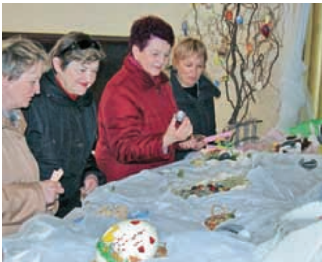
Razstava je bila priložnost za marsikatero novo idejo.