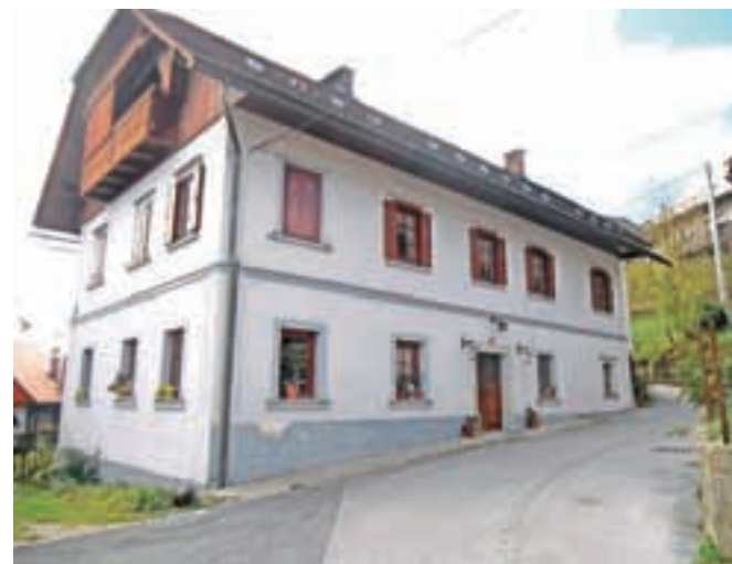
Domačija Pri Maševčku v Ljubnem