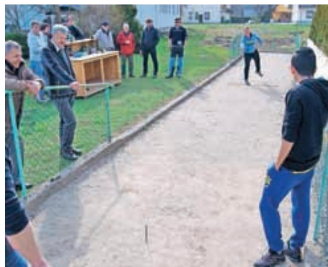
Kdo si bo pridobil največ kovancev in zmagal?