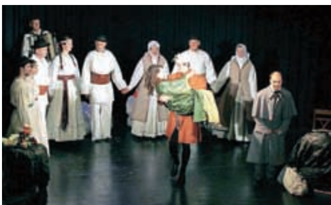
Ti si kriva, ljubezniva, deklica neusmiljena...: predstava Turjaška Rozamunda na odru na Breznici