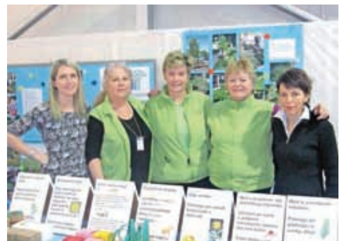
V leškem vrtcu z ekološko vzgojo začenjajo že v najzgodnejših letih.