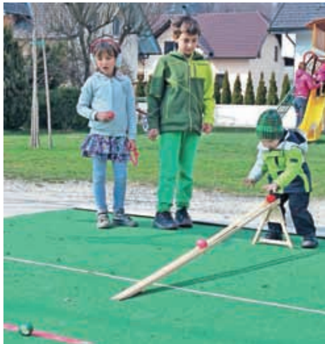
Kako daleč se bo odkotalil pirh?

so jih izdelale domače roke, ter velikonočne igre, ki imajo dolgo tradicijo. Pirhanja so bili najbolj veseli najmlajši, starejši pa so se pomerili v fucanju, stari igri meta kovancev. Pri tem pa je bilo bolj kot dober rezultat pomembno druženje s sokrajanji.