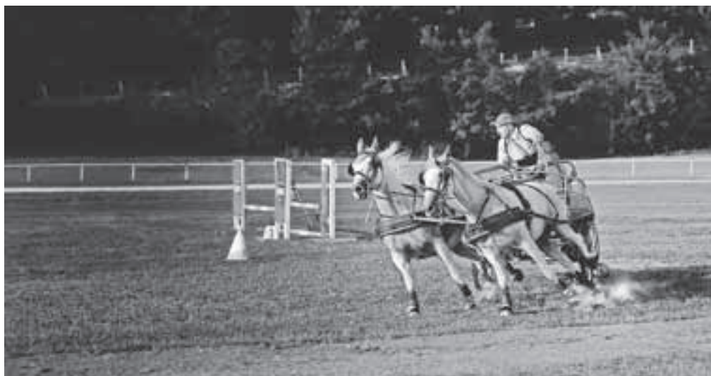
Prvonagrajena fotografija avtorja Tomaža Sedeja: Konjeniški dan 4.

Prvo nagrado na natečaju Dogodki v občini Radovljica 2015 je za fotografijo z naslo-vom Konjeniški dan 4 prejel Tomaž Sedej. Žirija v sestavi Jakob Gnilšak (Fotografsko društvo Radovljica), Gorazd Kavčič (fotograf na Gorenj-skem glasu) in Manca Šetina (predstavnica Občine Radov-ljica) je izbirala med 288 fotografijami, ki jih je na temo Dogodki v občini Radovljica v letu 2015 posla-lo trinajst avtorjev. Žirija je sprejela 61 fotografij, 50 med njimi pa je na razstav-ljenih v Galeriji Avla v prvem nadstropju Občine Radovlj-ica. Drugo nagrado je prejel Ljubo Kozinc (Speči minis-trant na novi maši), tretjo pa