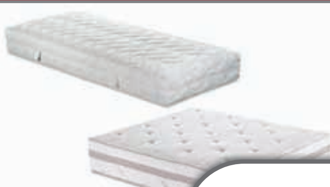
vzmetnice in posteljnina