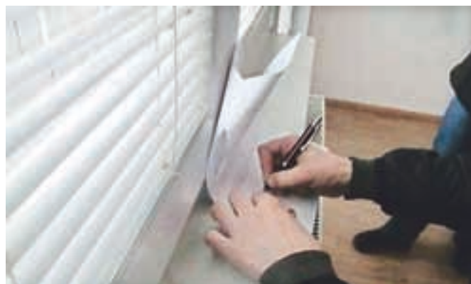
Prvi upravičenki je župan Ciril Globočnik ključne za neprofitno stanovanje za dve osebi izročil februarja, v marcu bodo stanovanja prevzele še tri družine.

Občina Radovljica trenutno razpolaga s 168 neprofitnimi najemnimi stanovanji. Glede na starost stanovanj njihovo ohranjanje zahteva