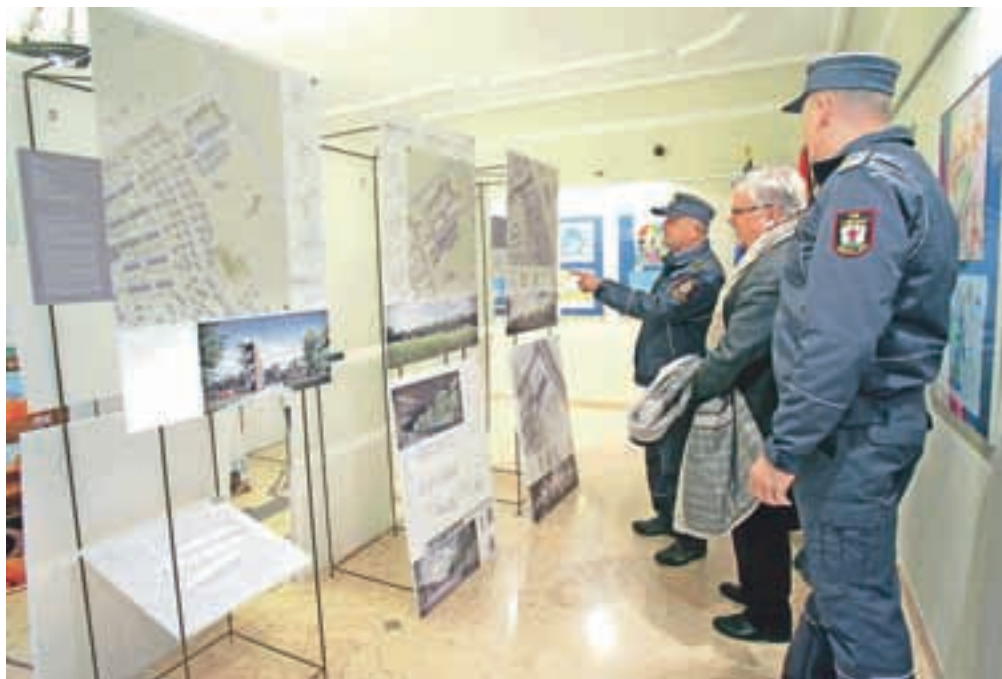
Predstavitve projekta regijskega reševalnega centra s podelitvijo nagrad za najboljši rešitvi je vzbudila veliko zanimanja med strokovno javnostjo in tudi sicer.