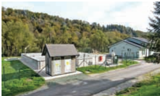
Čistilna naprava Kropa prispeva k varovanju naravnega okolja, predvsem k čistoči okoliških potokov, tal in podtalnice.

V letu 2015 je bila dokončana gradnja preostalega dela primarne in sekundarne kanalizacije s hišnimi priključki na območju celotne Kroepe ter večina primarnega in sekundarnega vodovoda (približno 5,5 km) in hišnih priključkov (skoraj 2 km). V Kropi se bo urejanje preostale infrastrukture (ceste, trg, javna razsvetljava, elektroenergetski vodi in meteorna kanalizacija) in gradnja zadnjega dela primarnega vodovoda (na državni cesti v Kotlu) predvidoma zaključila v prvi polovici leta 2016. Naložbo sofinancira Evropski sklad za regionalni razvoj.