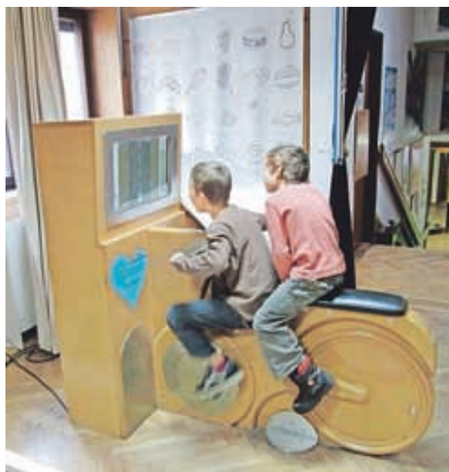
Navdušenje v hiši eksperimentov v Ljubljani

Hišo eksperimentov. Pot smo si popestrili z različnimi igrami, tako da je hitro