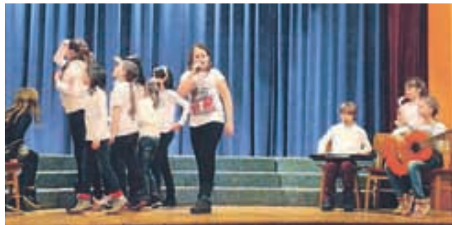
Usodo sodobne Urške so prikazali učenci ovsiške osnovne šole.

bogato kulturno življenje, in nosilno temo bo tokrat predstavila Dramska skupina