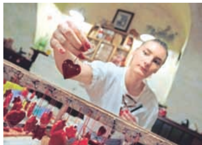
Rdeča barvna podlaga lecta izraža ljubezen in strast.

okrasitve so tudi najrazličnejša dodana besedila, primerna za razne priložnosti, za katere je bil lect izdelan. Nekoč so lectova srca še zlasti radi okrasili z ogledalci. "Lahko si predstavljamo, da v 18. in 19. stoletju po tedanjih domovih ni bilo mnogo ogledal. Zato so srčki z ogledali med dekletih predstavljali zelo zaželena in praktična darila. Srca z ogledali so bila še posebno značilna med zaljubljenimi in kažejo na to, da so imeli fantje v tistih časih tudi lep smisel za