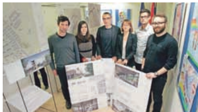
Prvonagrajena ekipa z izbrano najboljšo rešitvijo

Glede na izhodišča natečaja bodo v center umeščeni združeni Policijski postaji Radovljica in Bled, nujna medicinska pomoč, Gasilska zveza Občine Radovljica, katere prostori naj bi služili tudi za delo štaba Civilne zaščite in podporne službe ter občinskega centra za obveščanje. Prostore v novem centru naj bi po načr-