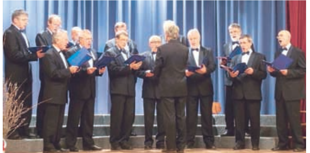
Domači Moški pevski zbor Podnart

"Za letošnjo rdečo nit smo si izbrali vodilo Poglejmo v Kropo. Povezali smo se s svojimi sosedi, ki imajo zelo