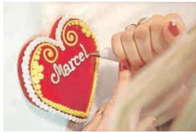
Za krašenje je potrebna mirna in natančna roka.

pa več kot deset dni. Takrat je zrelo za nadaljnje mesenje in valjanje na ustrezno debelino," pojasni Šlibar. "S pomočjo pekarskih modelov iz testa nato oblikujemo različne figure v pečici, pri temperaturi 180 stopinj jih pečemo od 10 do 15 minut. Kot iz pečice prijetno zadiši, je čas, da nekaj pečenih lectov namenimo za sladkosneda usta. Sveži svetlorjavi lecti so prijetno mehki ter hrustljavi. Lecte, ki so se izognili pokušini prisotnih obiskovalcev delavnice, nato pustimo sušiti še dan ali dva, tako da postanejo trdi in pripravljeni za okraševanje. V Sloveniji lecte tradicionalno najprej pobarvamo rdeče in nadaljujemo z dekoracijo v obliki rožic, napisov ali ogledalc. Tudi polno okrašeni lecti so še vedno jedilni, saj se za dekoracijo uporablja krompirjev škrob s sladkorjem in jedilnimi barvami, ki se uporabljajo v slaščičarstvu.« Značilne dekorativne barve vključujejo rdečo, rumeno in zeleno barvo, med katerimi ima vsaka svoj pomen: rdeča barvna podlaga lecta izraža ljubezen in strast, rumena barva skupaj z rdečo govori o večni ljubezni, zelena z dodanimi cvetovi pa predstavlja rast, bogastvo in plodnost. Del značilne