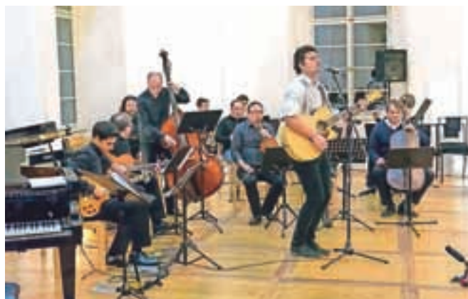
Muziciranje učiteljev je izjemna vzpodbuda za njihove učence in tudi starše mladih glasbenikov.

V zvoneči pajčevini celotnega večera je bilo čutiti talent, predanost glasbi, suvereno obvladovanje instrumentov, vztrajnost, uglašenost in voljo.