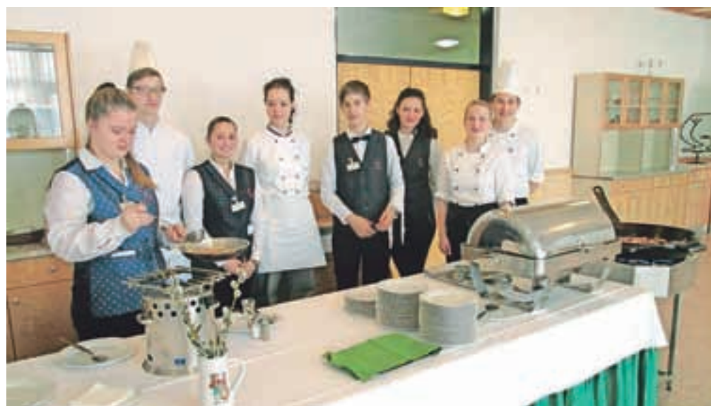
Dijaki so pokazali, kakšne dobrote znajo pripraviti, in jih nato tudi postregli.