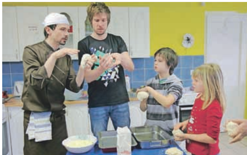
Na Dnevu odprtih vrat mladinskega centra KamRa so na eni od delavnic pokazali, kako se pripravljajo burek.

"Glavni cilj mladinskega dnevnega centra je nuditi prijeten, varen in ustvarja-