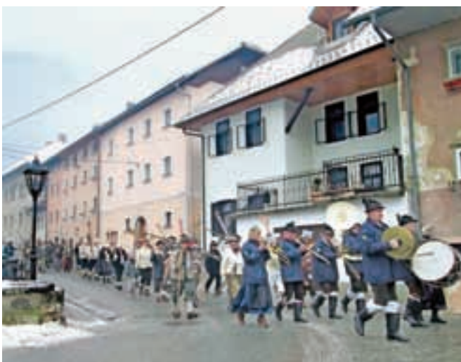
Povorka z Godbo Gorje in vsemi udeleženci se je v soboto zjutraj odpravila na pot po Kropi.