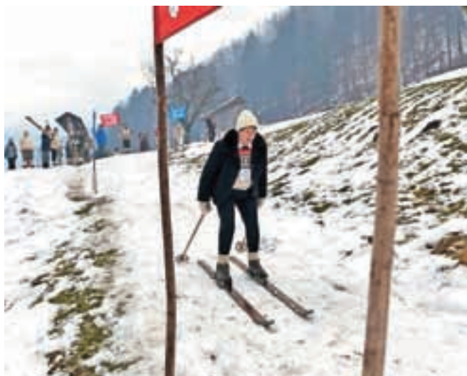
Ne le fantje, tudi dekleta so se korajžno spustila po pobeljeni strmini. Nekatera v hlačah, druga celo v krilih, vse pa z volnenimi kapami na glavah.

poleg pomanjkanja snega pesti tudi pomanjkanje sredstev. »Godba Gorje je sodelovala brezplačno, prav tako jih je v Kropo kot znak dobre volje pripeljalo podjetje Rozman bus, za kar smo jim zares hvaležni. Brez prostovoljnega dela in tovrstnih donacij nam ne bi uspelo.«