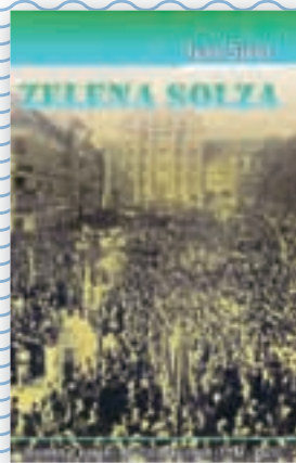
knjiga Zelena solza