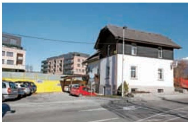
Stavbo Zavarovalnice Triglav, ki se bo kmalu selila v nove prostore na Vurnikovem trgu, bodo spomladi porušili.

ce, čakati še nekaj let. Zato ves ta čas intenzivno iščemo rešitve, kako priti do preostanka potrebnih sredstev, to