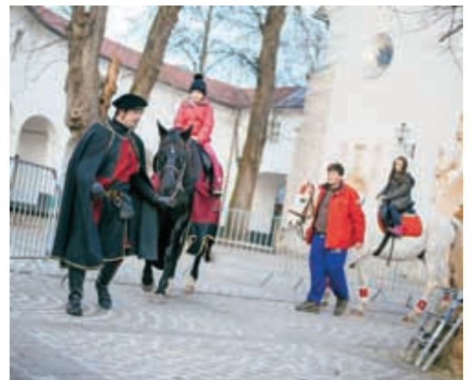
Trg so tradicionalno obiskali pravljčni konji z leškega hipodroma.

Leto na trgu se je tudi letos zaključilo s silvestrovanjem na prostem v organizaciji društva Večno mladi fantje iz Radovljice. Letos so za dobro glasbo poskrbeli člani Hišnega ansambla Avsenik, na trgu pa je novo leto pričakalo veliko domačinov.