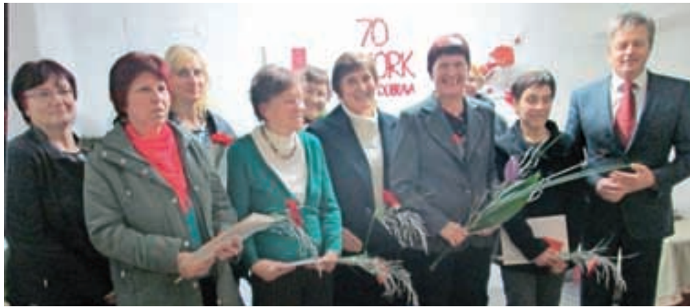
Na slovesnosti ob 70-letnici krajevne organizacije Rdečega križa so podelili priznanja za dolgoletno predano delo.

"Tudi v naših vaseh so bile posledice druge svetovne vojne zelo vidne. Večina vaščanov je bila izseljena, domovi so bili prazni, izropani ali naseljeni s sorodniki izseljenih družin. Prav te razmere so botrovale ustanovitvi Osnovne organizaci-