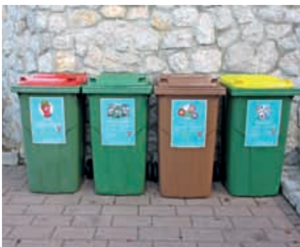
Ločevanje sveč, cvetja in embalaže že poteka na pokopališču v Lescah.

Le skupaj lahko poskrbimo, da se bodo odpadki ustrezno predelali in se ne bodo po nepotrebem odlagali na odlagališče.