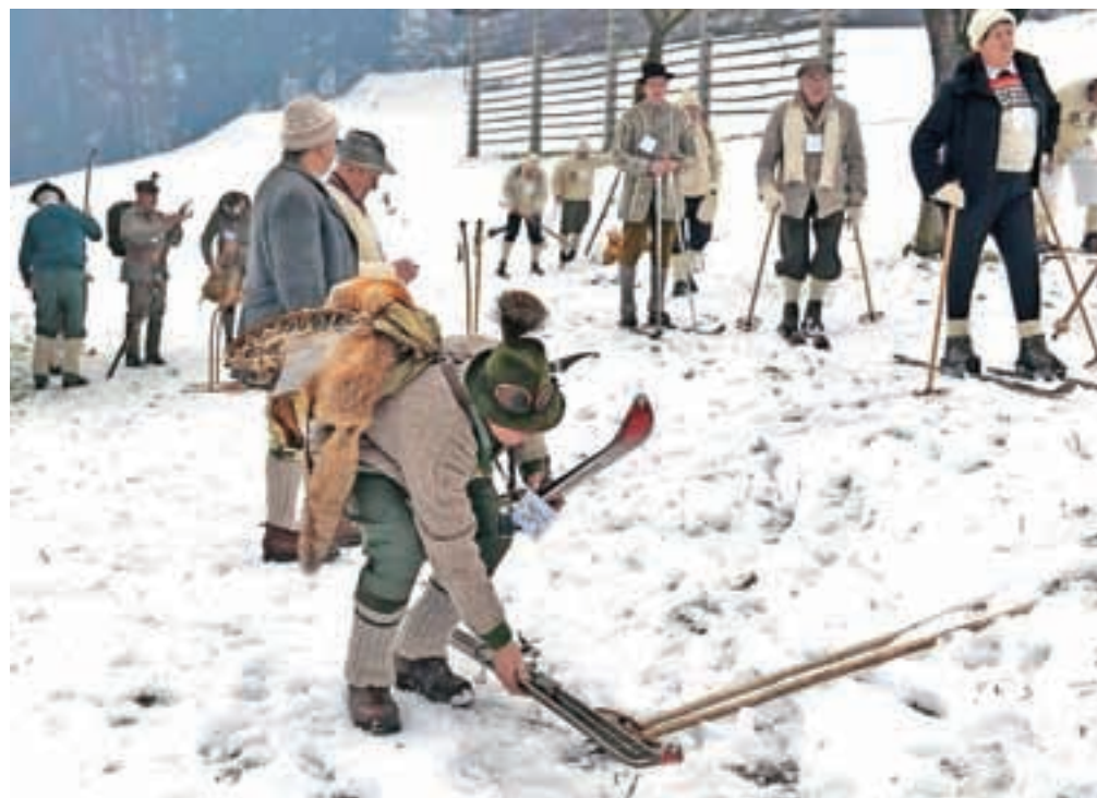
Letos so na tekmovanju za pokal Koledniki našli 34 udeležencev. Priznanja so dobili prav vsi.

Prvo tekmovanje na starih smučeh so v Kropi organizirali leta 1996, a je, ker so pač odvisni od naravnega snega, večkrat odpadlo, zato so petnajstega pripravili šele letos. Kljub temu da je bilo udeležencev manj kot v najboljših časih, ko se je po hribu za gostilno med vratci spustilo blizu sto tekmovalcev, so v Kropi veseli, da jim je uspelo