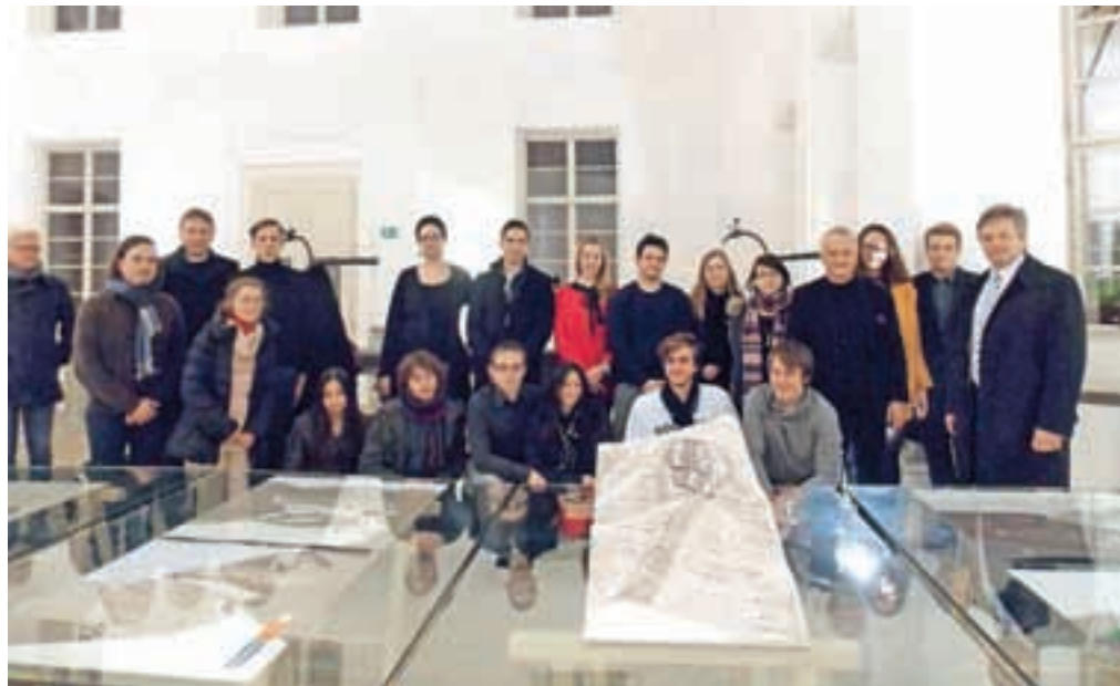
Študentje so svoje predloge v obliki modelov in kolažnih prikazov razstavili v prvem nadstropju Radovljiške graščine, kjer bodo na ogled postavljeni do konca januarja.

Glede opuščene občinske deponije odpadkov Črničev DIRO so študentje arhitekture pripravili predlog sanacije v treh fazah. Opozorili so, da deponija stoji na občutljivih tleh in ob zaščitenem območju, zato so predlagali novo učno pot, ki bi opozarjala na nevarnost divjih deponij in na pomembnost ločevanja odpadkov, hkrati pa bi pomenila dostop in predstavitev naravne vrednote Peračica. Predlog preureditve kamnoloma Kamna Gorica je vezan na prihodnost, saj temelji na preobrazbi danes še delujočega kamnoloma v aktivno turistično in kultur-