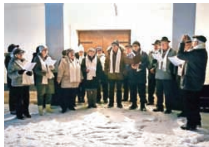
Moški pevski zbor Kropa pred vhodom v Župnišče