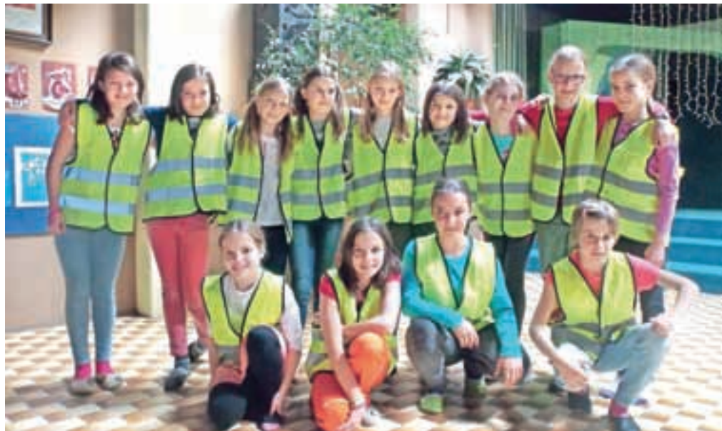
Petošolci Osnovne šole Antona Tomaža Linhartar Radovljica so opozorili na manj varne predele kolesarskih poti, na katere morajo biti kolesarji še posebej pozorni.

Učenci so uredili tudi kolesarski kotiček, predstavili samo delovanje kolesa, prometne znake, ki jih mora vsak kolesar dobro poznati in upoštevati, ter pripravili zemljevide kolesarskih poti znotraj radovljiške občine. Zemljevidom so dodali slikovno gradivo, s katerim so nazorno pokazali, na katerih križiščih oziroma slabše preglednih točkah morajo biti kolesarji še posebno previdni, opozorili pa so tudi na pomembnost dobre vidnosti kolesarja.