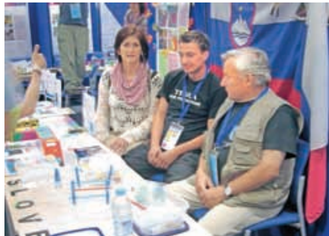
Učitelji na festivalu v Londonu