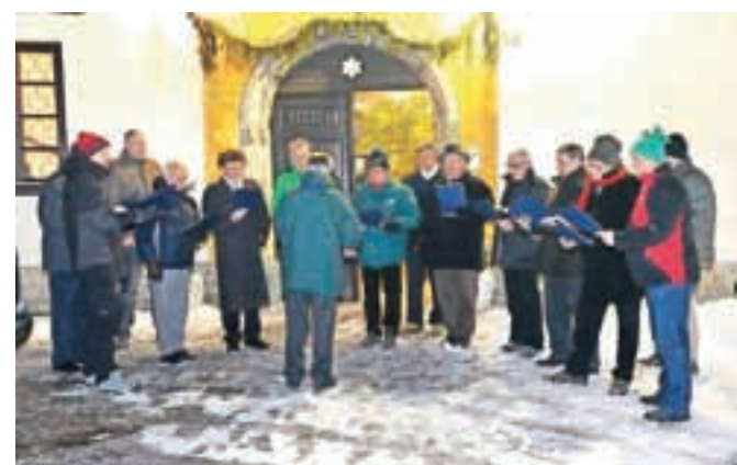
Veteranski pevski zbor pod arkadami na cerkvenem trgu.