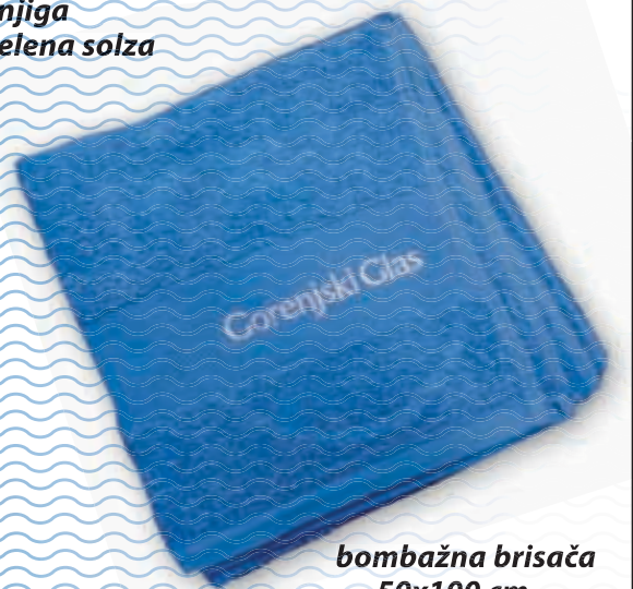
bombažna brisača 50x100 cm

Popust in darilo veljata le za fizične osebe. Daril ne pošiljamo po pošti. Količina daril je omejena.