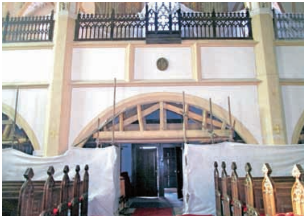
Kor so podprli, stebre zavarovali; zdaj čakajo na denar za obnovo.

"V začetku lanskega oktobra se je izkazalo, da so razpoke zelo nevarne, saj segajo do sredine posameznih stebrov in grozijo z rušenjem pevskega kora, posledično pa lahko tudi zahodnega dela cerkve. Sprva smo menili, da je vzrok zanje posedanje in da bo postopoma potrebna le razbremenitev obokov. Ob minimalnem odpiranju razpok pa smo ugotovili, da so skoraj vsi nosilni stebri popokali."