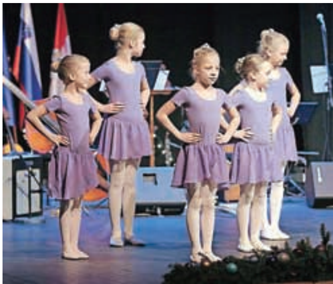
Plesna pripravnica letos prvič deluje v sklopu Glasbene šole Radovljica.

Glasbeno šolo Radovljica, ki deluje na območju občin Radovljica, Bled, Gorje in Bohinj, v letošnjem šolskem