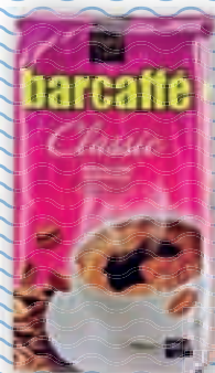
kava Barcaffé 250 g