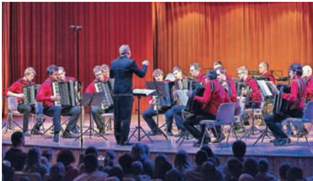
Harmonikarski orkester na božično-novoletnem koncertu decembra v Festivalni dvorani na Bledu

"V Glasbeni šoli Radovljica zelo spodbujamo igranje v orkestrih in komornih zase-