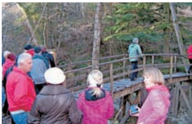
Most, ki so ga poimenovali po pokojni sokrajanki.