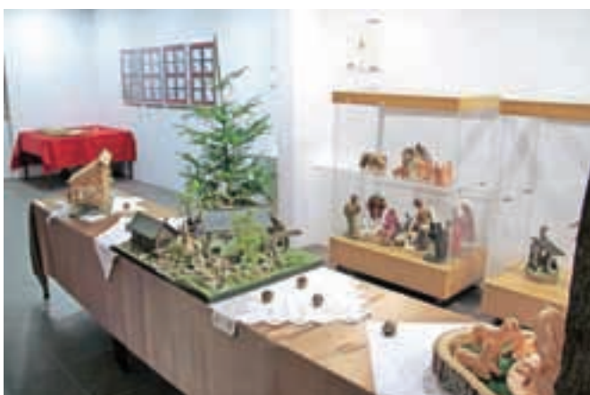
Razstava božičnih znamk, jasic in adventnih okrasov bo odprta do 6. januarja prihodnje leto.

V galeriji Romarskega urada na Brezjah bo do 6. januarja prihodnje leto odprta razstava jasic, adventnih okrasitev in božičnih znamk s naslovom Luč nam zasije z Gospodovim rojstvom. Razstava je vredna ogleda tudi zato, ker so na ogled tudi nekatere jaslice iz muzeja na Brezjah, ki je zaradi obnove zaprt. Razstava obiskovalca med drugim pouči, da so prvo znamko z božičnim motivom leta 1935 izdale britanske enote, nastanjene v Egiptu. Med znamke pa so bile božične znamke uradno uvrščene leta 1960. Slovenija je izdala prvo božično znamko leta 1992, po tem letu pa v Sloveniji letno izideta ena ali dve znamki na temo božiča. Na ogled so tudi jaslice nekaterih slovenskih avtorjev. Na Brezjah se že pripravljajo na drugi velik dogodek. Marijino narodno svetišče je bilo uvrščeno med tiste cerkve, v katerih bodo v svetem letu usmiljenja odprli tako imenovana »sveta vrata«. Ta čast bo doletela vrata, ki vodijo iz atrija v baziliko. Vrata so delo kiparja Mirsada Begića, po načrtih arhitekta Matica Suhadolca pa pred njimi že stojita dva stebra, ki so ju klesali delavci Marmorja iz Hotavelj. Odprtje svetih vrat bo v petek, 1. januarja, po maši, ki jo bo ob 16. uri daroval ljubljanski nadškof metropolit Stanislav Zore.