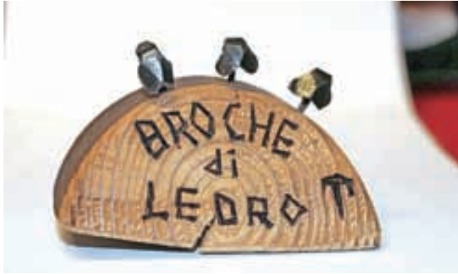
Spominek iz Pieve di Ledra

Skupina 47 udeležencev se je na dvodnevno ekskurzijo odpravila letos 11. septembra zgodaj zjutraj. Pot nas je vodila po furlanski nižini v območje asiške in lavaronске planote. Skozi glavno mesto Asiago z mogočnim spomenikom žrtvam tistega časa nas je avtobus peljal naprej v območje gore Ortigara. Med 10. in 23. junijem 1917 so se tam odvijali hudi boji za njen vrh (2105 m), ki so ga nazadnje zavzeli Avstrijci. V bitki je Avstrija izgubila čez 8800 vojakov, italijanska armada pa preko 25.000. Območje z mnogimi obeležji je zdaj spomeniško zavarovano in preprejeno z mnogimi gorskimi potmi. Hodeč smo sprejemali vtise. Gora, sredi čudovite kamnite pokrajine, razrezana s strelskimi jarki, tudi predori, na poti kapelica in kip Matere Božje na visokem stebri, pokopališče, v Dolini Slovencev (Dolina degli Sloveni) sledi zgradb, na kamnu slovenski