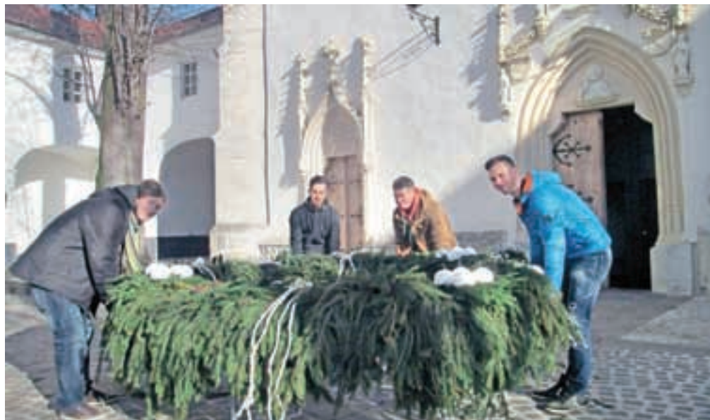
Njeni študentje so adventni venec izpred cerkve prenesli na rondo pred starim mestnim jedrom.

sta svoje delo javnosti predstavila v radovljiški cerkvi sv. Petra. Na praznični dan se bosta vrnila domov. Še prej