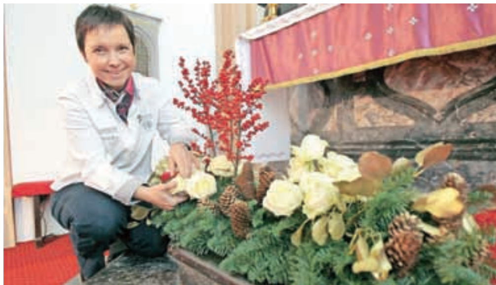
Svoje delo je pred odhodom v Vatikan predstavila tudi v cerkvi sv. Petra.