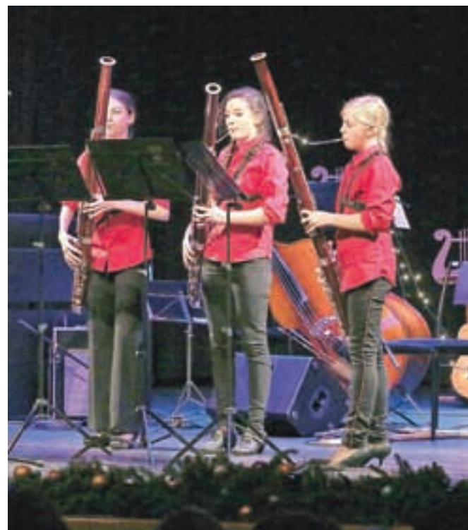
Nastopile so tudi fagotistke Glasbene šole Radovljica.