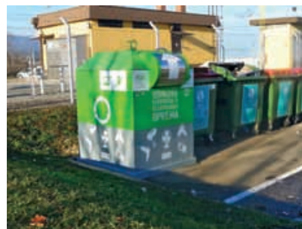
Zabojsnik pred TNC Mercator v Lescah vas vabi, da e-odpadke in baterije pravilno odložite.

Da prebivalci radovljiške občine sodijo med ekološko bolj osveščene, dokazujejo vse od leta 2009, saj na prebivalca letno zberemo od 4,3 do 5,5 kilograma odpadne električne in elektronske opreme. Komunalna Radovljica, d.o.o., je ob desetletnici organiziranega ravnanja z odpadno električno in elektronsko opremo od družbe ZEOS, d.o.o., prejela priznanje za največje zbrane količine odpadne električne in elektronske opreme na prebivalca.