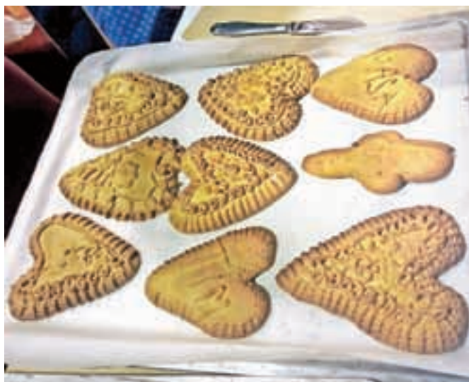
Okusni dražgoški kruhki