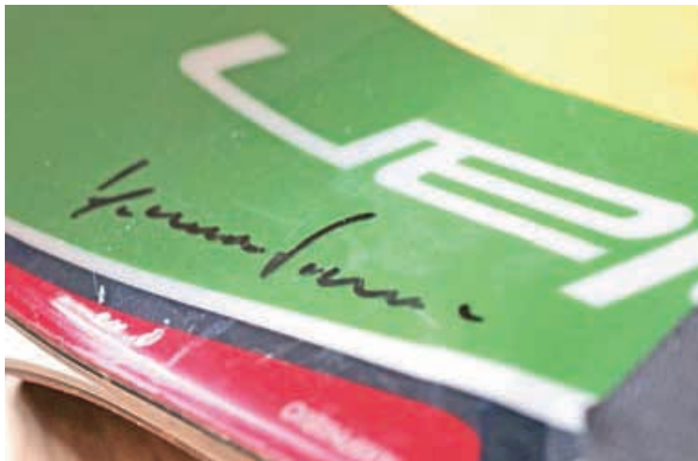
Elan in Stenmark sta bila desetletje in pol neločljivo povezana.