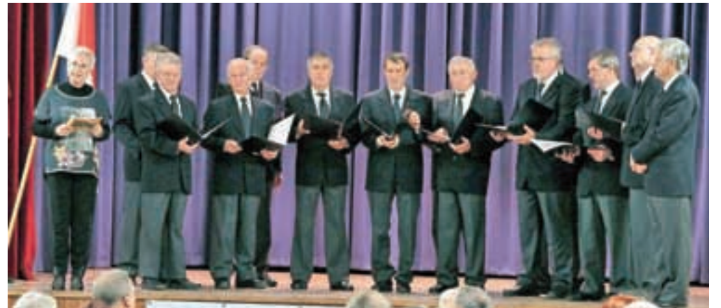
Na slovesnosti so prepevali člani Moškega pevskega zbora Podnart.

roču kegljanja, malce kas-neje pa tudi želja po smuča-nju. Člane društva od nekdanj navdušujejo tudi gorenjski vrhovi, na katere se radi povzpnejo, zlasti ženski del društva pa še vedno v veli-kem številu organizira in obiskuje telovadbo. Dogradi-tev dvosteznega balinišča v