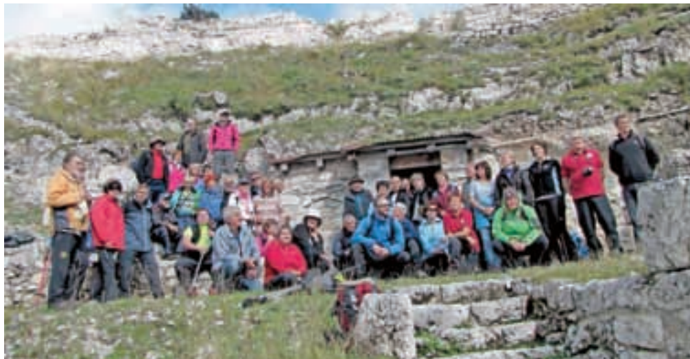
Pohodniki v Dolini Slovencev

Poučna potovanja po poteh Radovljičanov, rojakov naše občine, bomo v naših muzejih še organizirali ter udeležence spodbujali, da jih soustvarjajo, kakor so letošnje in tudi že nekatere prej.