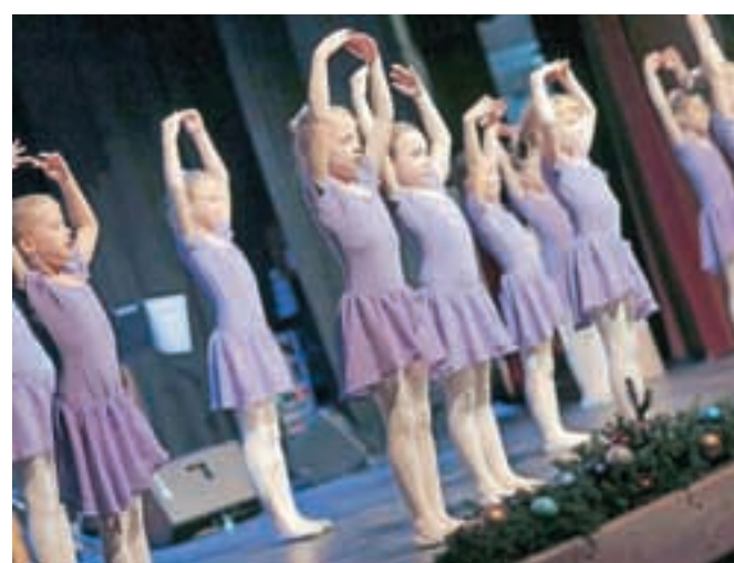
Na prireditvi so se prvič predstavile tudi najmlajše balerine.