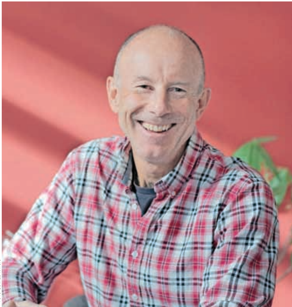
Ingemar Stenmark, smučarska legenda, je letos po dolgem času spet obiskal Radovljico.

Kako si sploh vozil z njimi, Ingemar?« se je obrnil k danes 59-letnemu, še vedno zelo resnemu in umirjenemu gospodu. Prvih Elanovih smuči ni dobil za darilo, je zanikal zgodbo, ki jo je bilo pogosto slišati v javnosti. »Kupil sem jih, tri pare. Za zares majhen denar, kake tri, štiri evre za par. S prijateljem