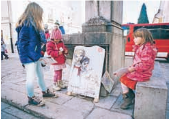
Decembrski potep po Radovljici je namenjen družinam z mlajšimi otroki.

Turizem Radovljica je v prazničnih dneh za družine z otroki pripravil enostavno, a zanimivo aktivnost, ki so jo poimenovali Poišči nabiralnik Dedka Mraza. Z odzivom, ki se kaže v številu pisem, zbranih v nabiralniku, so zadovoljni.