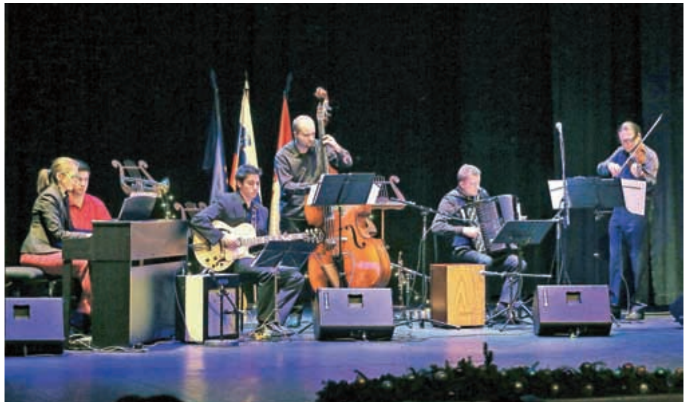
Učitelji Glasbene šole Radovljica so poskrbeli za zares imeniten glasbeni program na proslavi.