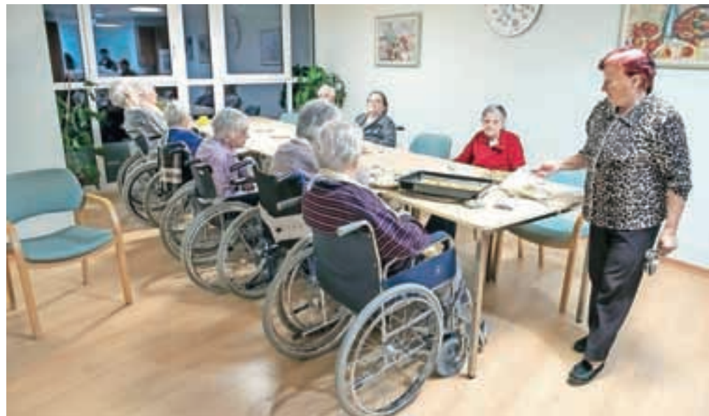
Stanovalci so se razveselili prenovljenih prostorov.

Že lani so tako prostore negovalnega oddelka v četrtem nadstropju prenovili in jih spremenili v oddelke gospodinjske skupnosti, ki predstavljajo najsodobnejšo obliko varstva starejših. Nato so se lotili še gradnje prizidka na severovzhodnem delu hiše, kjer so v tretjem in četrtem nadstropju uredili polzaprte in zaprte terase, kar tistim stanovalcem, ki ne morejo na dvorišče, omogoča dostop na prosto. V prvem in drugem nadstropju prizidka so nadstandardna stanovanja – po en dvoposteljni apartma in ena enoposteljna garsonjera. Dom ima tako skupaj že 12 nadstandardnih stanovanj, ki so večje kvadrature od običajnih sob in imajo svojo kuhinjo. Osnovna cena oskrbe za samostojno bivanje brez pomoči v nadstandardnih stanovanjih je 20,56 evra, v običajnih pa 16,61 evra.