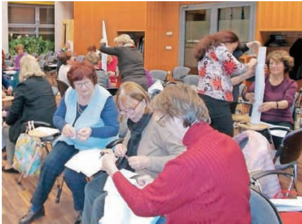
S pomočjo domišljije se lahko ustvari marsikaj

V okviru projekta 3FIT, ki ga izvaja Ljudska univerza Jesenice s podporo norveškega finančnega mehanizma, potekajo zelo zanimive delavnice, predavanja in telesne vadbe za ohranjanje zdravja starejših.