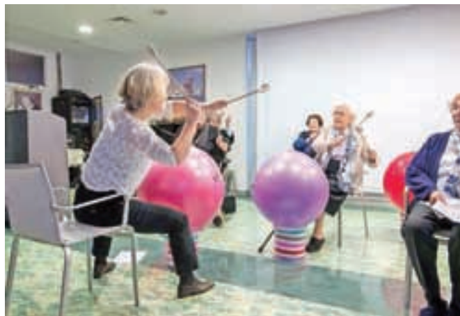
Na prireditvi ob 38-letnici doma so s posebej zanimivo točko na žogah nastopili stanovalci ...

V Domu dr. Janka Benedika je trenutno 222 stanovalcev. Investicija v obnovo in prizidek je vredna okoli 1,2 milijona evrov.