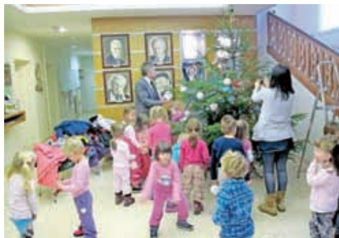
Pri krašenju se jim je za kratek čas pridružil tudi župan Ciril Globočnik.

Otroci iz radovljiškega vrtca so v torek okrasili smrečici v prostorih Občine Radovljica z okraski, ki so jih v vrtcu izdelali sami. Radovljiški vrtec pri krasitvi novejete smreke na občini sodeluje že peto leto zapored, tokrat je pri tem veselem opravilu sodelovalo štirideset otrok.