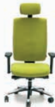
pisarniški stoli in mize