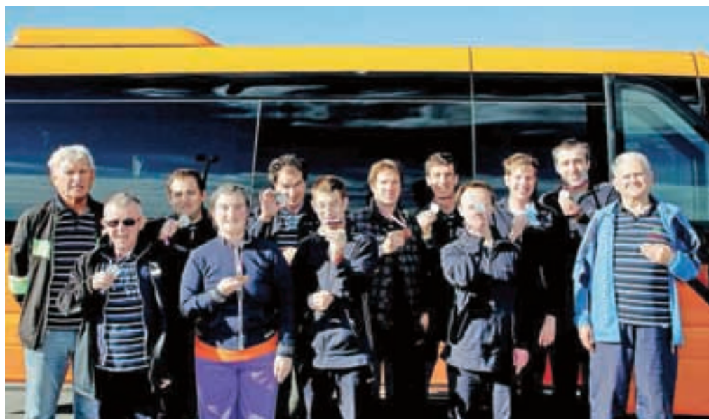
Odlični radovljiški balinarji

Uvrščajo se v sam vrh tekmovalcev Specialne olimpijade Slovenije.