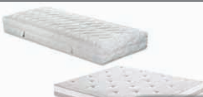
vzmetnice in posteljnina