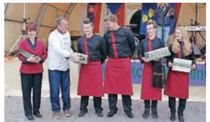
Dijaki Srednje gostinske in turistične šole Radovljica