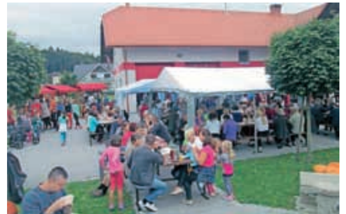
Mošenjski dnevi v kraj privabijo iz leta v leto več ljudi.