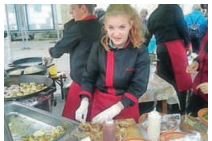
Radovljičani so že vajeni, da so stojnice kaj hitro prazne.