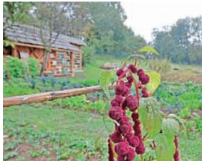
Biodinamični učni vrt se počasi pripravlja na zimo.