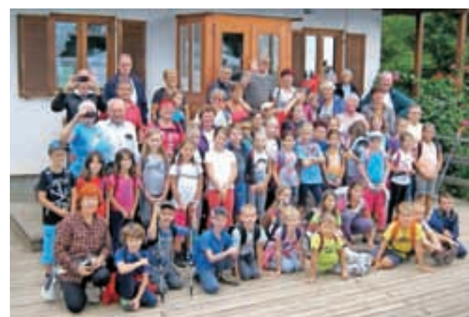
Leški tretješolci s svojimi starimi starši pred Sankaško kočjo