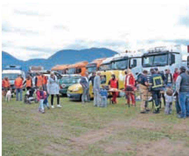
Prireditelj je v Radovljico pritegnila več kot dva tisoč obiskovalcev.