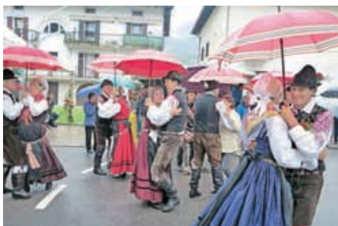
Plesalcev vreme ni motilo; ko je začelo deževati, so se zavrteli kar pod dežniki.

Folklorna skupina Bled je poleti na povabilo TNP v sklopu sodelovanja parkov Alpskega predgorja nastopila v vasi Moznica (Moggio Udinese) v Italiji. S posebnim žarom in ponosom nastopamo med zamejskimi Slovenci in v veselje nam je, da se lahko z njimi družimo, sklepamo nova poznanstva in poglobljamo medsebojne vezi, so po nastopu povedali plesalci. Konec avgusta so odšli še v Libuče (Loibach) na avstrijskem-koroškem pod Peco. V kraju, ki je le slaba dva kilometra oddaljen od slovenske meje in kjer si slovenski Korošci močno prizadevajo ohraniti slovenski jezik in kulturo, so zaplesali na tradicionalnem, 30. Libuškem žeganju.