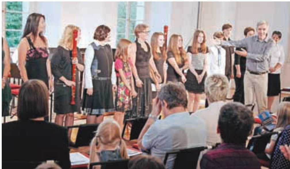
Zaključni koncert udeležencev mojstrskega tečaja kljunaste flavte