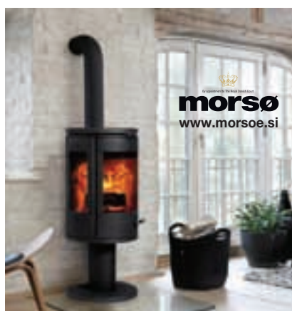
MODEL 7948 MORSO