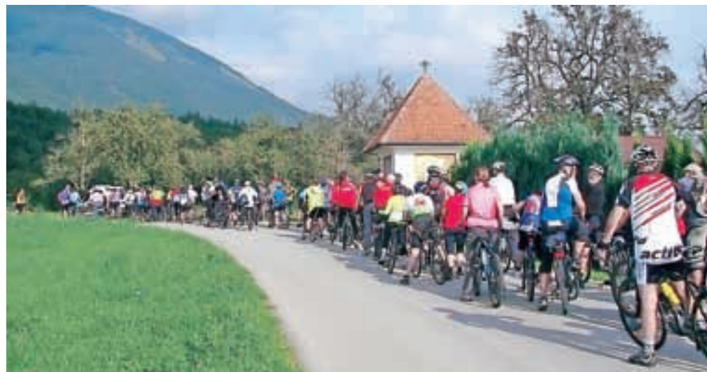
Kolona kolesarjev, avtorica Vida Markovc