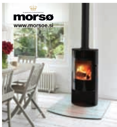
MODEL S1040 MORSO

Vedno več ljudi se zaradi različnih razlogov vrača k ogrevanju z drvmi. K temu pripomorejo tudi sodobne sobne peči in kamini na drva, ki izredno hitro in učinkovito segrejejo prostor, obenem pa potrebujejo zelo malo čiščenja in vzdrževanja. V salonu v Lescah se lahko prepričate o njihovem delovanju in izkoristite priložnost za ugoden nakup.