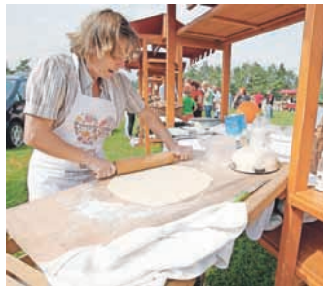
Na stojnicah so se predstavili številni lokalni pridelovalci hrane.