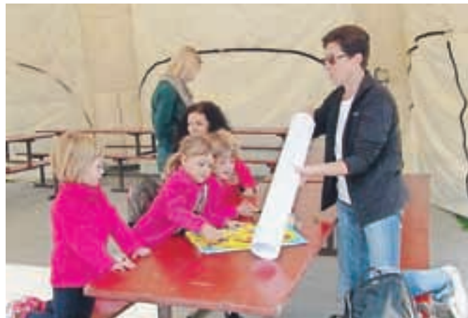
Ustvarjalne delavnice pod vodstvom likovne pedagoginje Biserke Mertelj