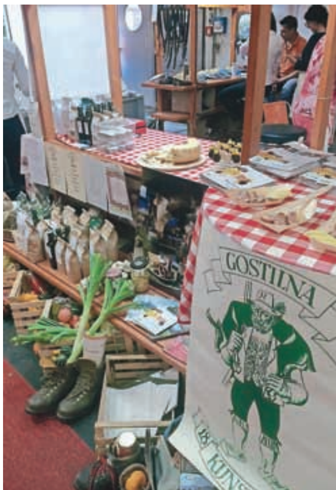
Te dni se Okusi Radol'ce v sodelovanju s Turizmom Radovljica in radovljiško obrtno zbornico predstavljajo na Jesenskem sejmu v Celovcu.

Prav te dni se Okusi Radol'ce v sodelovanju s Turizmom Radovljica in radovljiško obrtno zbornico predstavljajo tudi na Jesenskem sejmu v Celovcu, pretekli teden pa so se skupaj predstavili skupini novinarjev v Gostilni Kunstelj. Povezali so se tudi s Čebelarstvo zvezo pri praz-