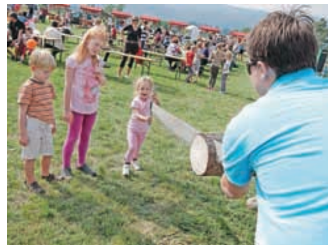
Najmlajši so se v družbi izkušenih sekačev pomerili tudi v gozdarskih spretnostih.

info@france-turbo.si www.france-turbo.si