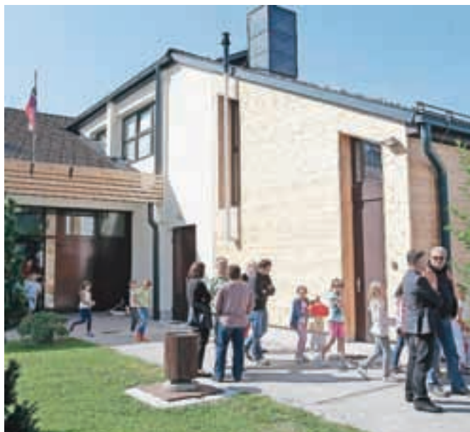
Podružnična šola v Begunjah

Občina Radovljica je namreč v zadnjih treh letih zagotovila sredstva za menjavo strehe in stavbnega pohištva ter obnovo fasade. Skupna vrednost izvedenih del znaša približno 325 tisoč evrov, od tega je občina zagotovila