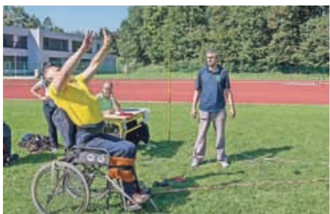
Če hočeš biti vrhunski, je temu cilju treba podrediti življenje ... / FOTO: PRIMOŽ PIČULIN