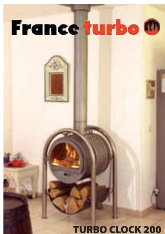
TURBO CLOCK 200

okusa, prepričani pa ste lahko, da bo prav vsaka peč v vaš dom prinesla toplino in domačnost.