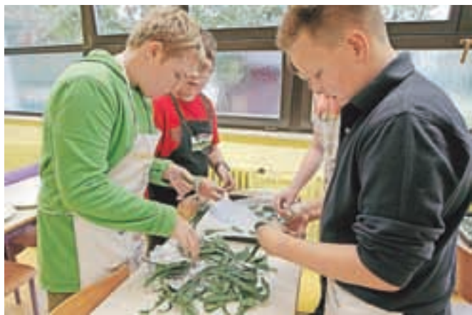
Fantje so se lotili zahtevne priprave slastnega ohrovtovega čipsa ...

nasekljan peteršilj in poper. Z rokami dobro premešamo. Dodamo drobtine, toliko, da masa ni premokra, da bomo lahko oblikovali polpete. Pustimo stati od 10 do 15 minut. Medtem pečico ogrejemo na 200 stopinj Celzija. Z roko oblikujemo ploščate polpete in jih zlagamo na pekač, obložen s papirjem za peko. Pečemo jih od 20 do 30 minut oziroma toliko časa, da lepo porumenijo. Pa dober tek!