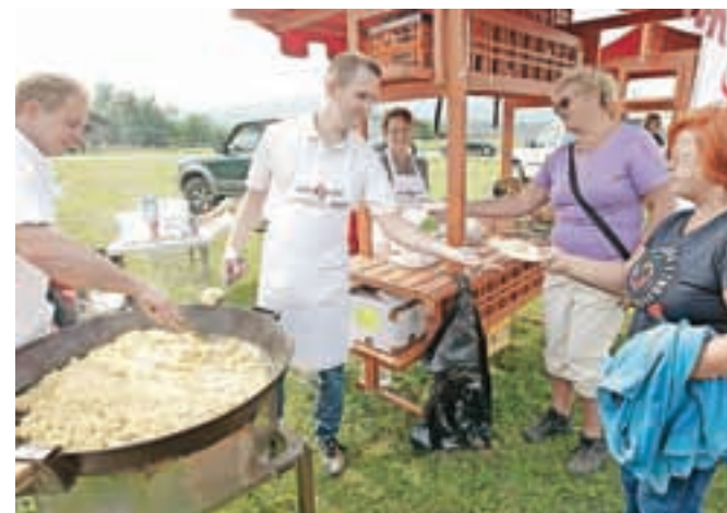
Degustacija praženega krompirja je bila ena od najbolj obiskanih točk prvega Podeželskega dne.