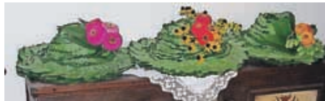
Nagrade za najboljše slaščičarje, čudovite klobuke, je izdelala Berta Artiček