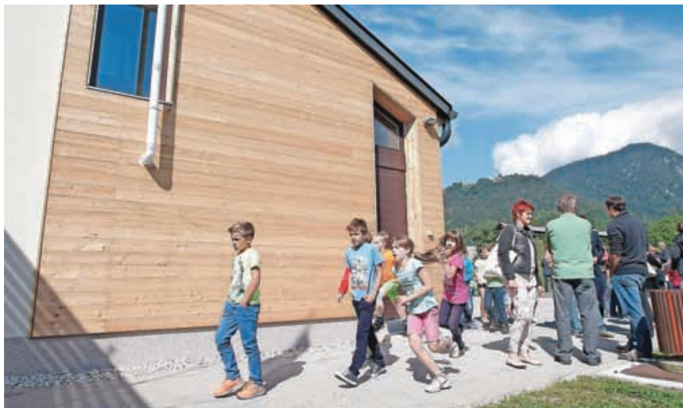
Prejšnji petek so slovesno zaključili energetska sanacija podružnične šole v Begunjah.