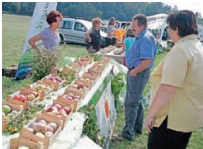
Obiskovalci so si lahko ogledali razstavo različnih vrst žit in sort jabolok.