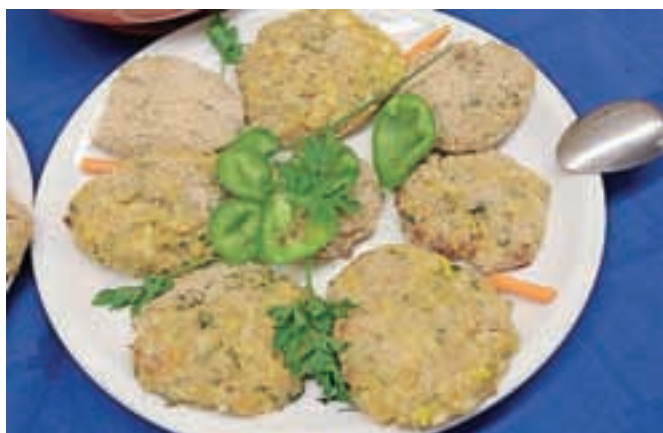
Takole so videti okusni bučni polpeti. / FOTO: GORAZD KAVČIČ