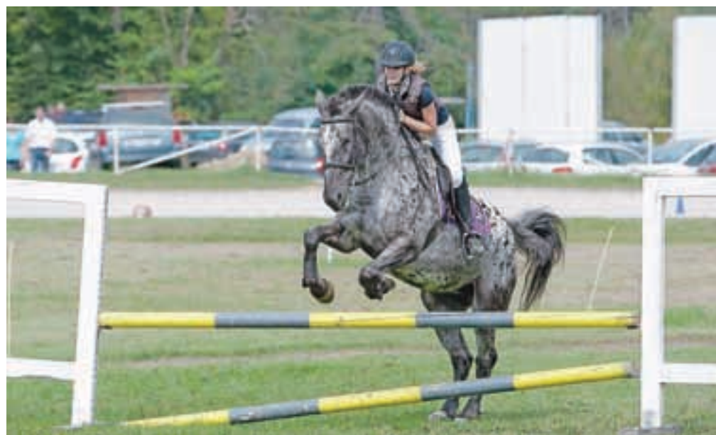
Člani Konjeniškega kluba Lesce Bled so predstavili šolo jahanja, različne jahalne točke in sinhrono jahanje ter se pomerili na tekmovanju 'jump and drive'.

leške godbe na pihala in predstavijo šole jahanja, so si tako obiskovalci lahko ogledali razstavo različnih vrst žit in sort jabolok, naku-