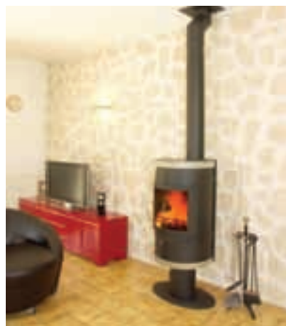
SUPER TURBO 200

Ob pogledu na veliko izbiro v salonu v Lescah je hitro jasno, da boste našli pravo peč za tradicionalno in sodobno opremljen dom. Za katero obliko in barvo se boste odločili, je odvisno od vašega