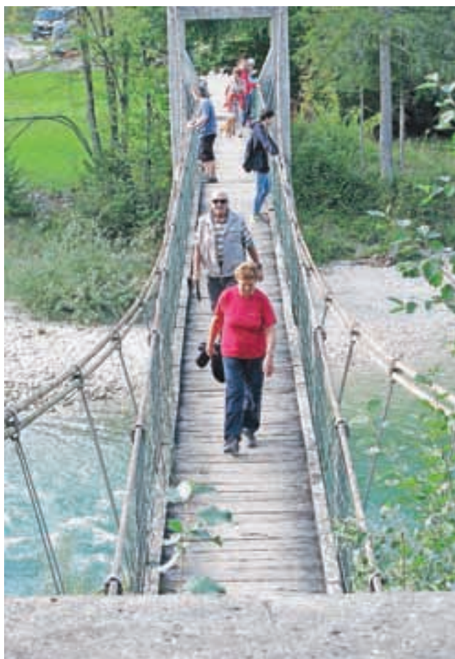
Nova tematska pešpot ob Savi

Za projekt rekonstrukcije mostov na državnih cestah bo Evropski sklad za regionalni razvoj v okviru izvajanja kohezijske politike 2007–2013 prispeval 3,5 milijona evrov. Kot pojasnjujejo na Družbi RS za ceste (DRSC), so sredstva namenjena za obnovo desetih objektov, med njimi je tudi most čez Savo v Podnartu, na katerih so gradbena dela večinoma že končana, projekt pa bo finančno in tudi formalno zaključen do konca letošnjega leta. Vrednost gradbenih del za vseh deset objektov znaša nekaj več kot štiri milijone evrov, pri čemer bo evropsko sofinanciranje kar 85-odstotno. Vrednost del pri obnovi mostu v Podnartu je nekaj manj kot štiristo tisoč evrov, dela so bila zaključena že lani. Naložba rekonstrukcije mostu, zgrajenega leta 1966, je obsegala njegovo celovito obnovo, razširitev z enostranskim pločnikom, obnovo javne razsvetljave ter sočasno preureditev uvoza javne poti do industrijske cone Podnart.