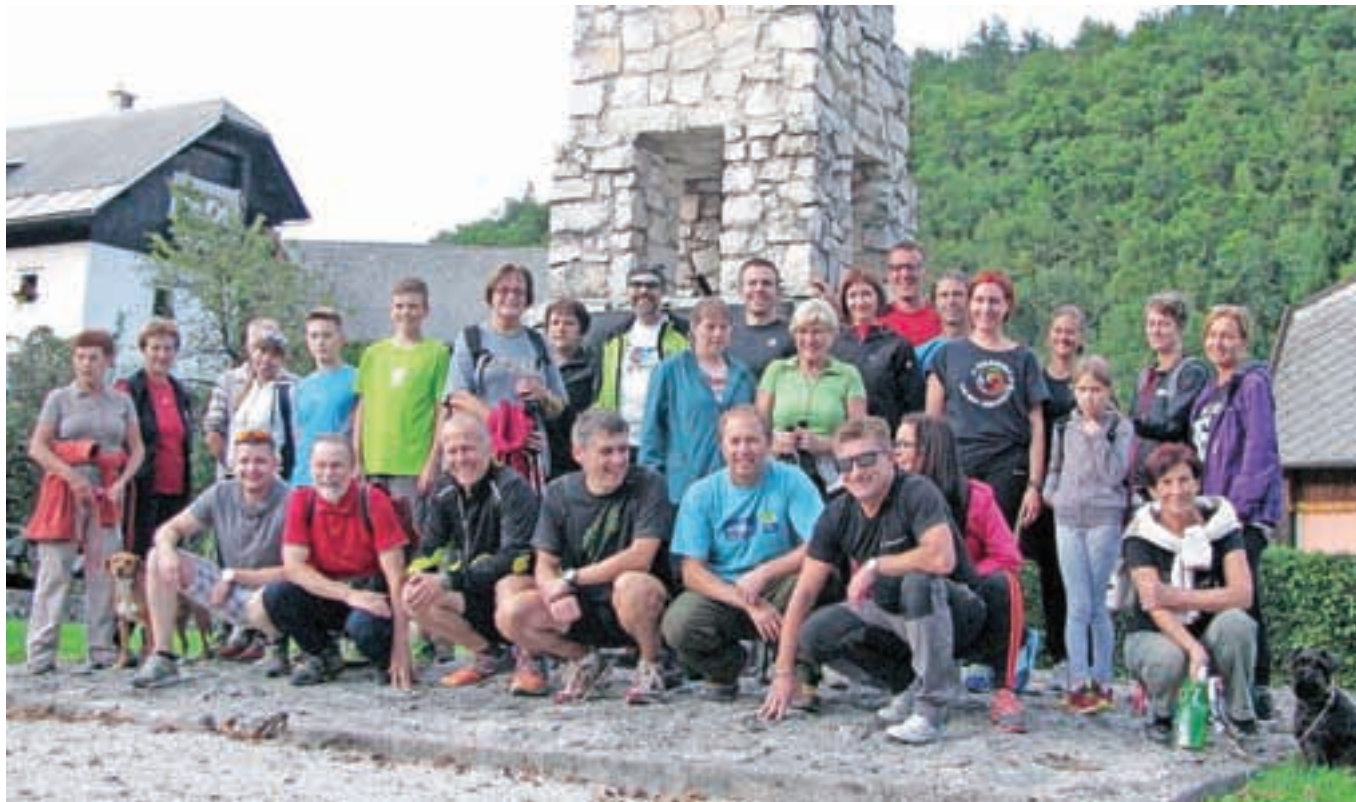
Pohodniki so se čez Fuksovo brv odpravili do Kamne Gorice.