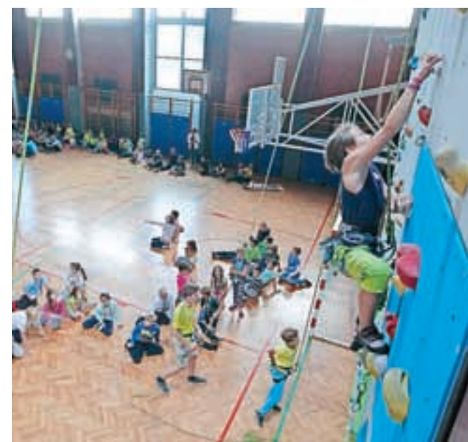
Športno plezanje je med mladimi, tudi v Radovljici, vse bolj priljubljen šport, k čemur prispevajo tudi odlični rezultati radovljiških plezalcev.