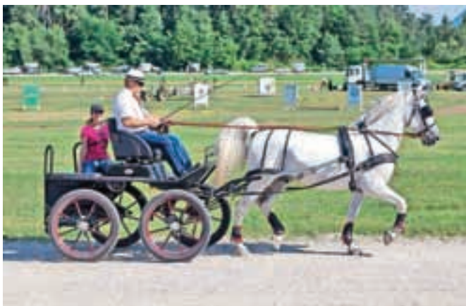
Pustite se zapeljati: elegantni kas plemenitih živali.

jahači pa so se prav za to priložnost opravili v posebna oblačila. Mnogi obiskovalci so se lahko poučili, da so se konji uporabljali za vožnjo veliko prej kot pa za jezdenje. Ko so vprežna vozila izgubila osnovno vlogo prevoza, se je vožnja spremenila v hitro razvijajočo se športno disciplino, ki vedno bolj navdušuje. Prireditev se je nadaljevala ob veselem druženju, uživali pa so tudi najmlajši, ki so lahko zajahali konjičke ali ponije.