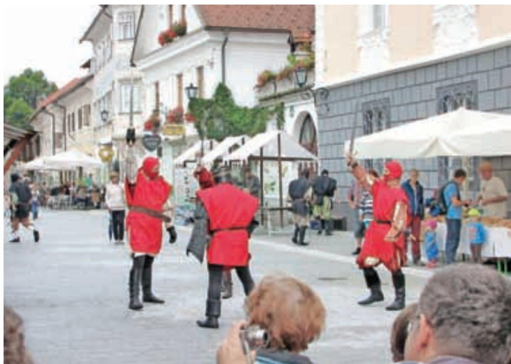
Mečevanje je najbolj navdušilo najmlajše obiskovalce.

ski, njegovo popotovanje pa je opisano v avtobiografski pesnitvi Ženska služba. Ulrik je bil med potovanjem namreč preoblečen v boginjo ljubezni Venero. Slavni vitez je nekaj časa preživel tudi na gradu Kamen pri Begunjah. Njemu v čast je zato KD Igralska skupina Gašperja Lambergarja uprizorilo nekaj srednjeveških iger (Meč za prestolonaslednika, Ženinove težave), pokazat pa so se prišli tudi iz KUD Radovljica – Linhartov oder, ki so skupaj s kvintetom Tivoli odigrali odgovor na vprašanje Kje pa je ta Venerina pot? in igro Grešnik z razlogom, ter KD Kropa – dramska skupina Čofta, ki je zabavala z igro Pej no hodiče past. Obiskovalce – tako tuje kot domače – je oklestilo slabo vreme, a samo do prvih rahlih sončnih žarkov, potem se je na Linhartovem trgu že trlo zgodovinskih navdušencev, ki so se hoteli ozaljšati s kakšno princeskino krono ali pa se opremiti s kakšnim urnim konjičem.