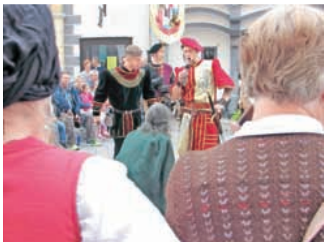
Vitezi so se spravili nad berača, ki je kradel s stojnic.