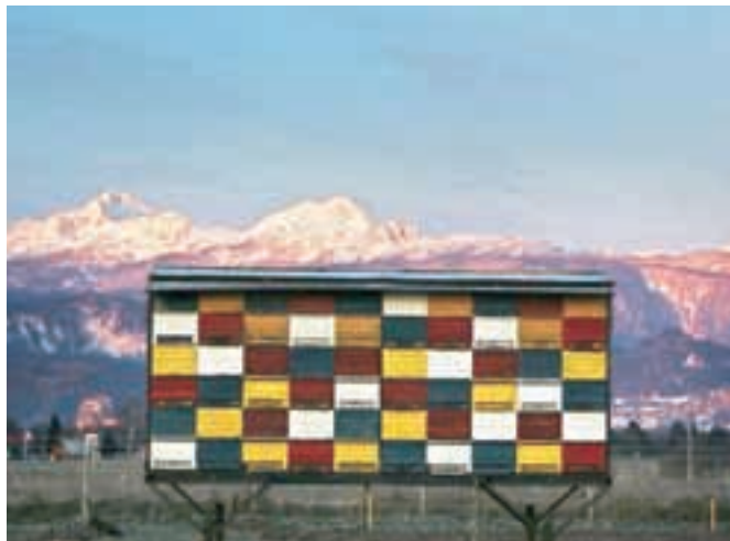
Prevozno čebelarstvo je značilno za naše kraje.

Po besedah Kozinca naj bi bil postopek vpisa v register žive kulturne dediščine, ki ga vodi ministrstvo za kulturo, končan do konca leta. Pobudo z imenom Prevozno čebelarstvo – tradicionalno slovensko čebelarjenje je delovna skupina že ocenila kot primerno za vpis v register. Koordinator in nosilec