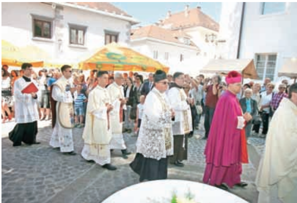
Slovesno dogajanje se je ves dan nadaljevalo tudi na trgu pred cerkvijo.

Cerkev v danem trenutku potrebuje in izmoli. Glede pomislekov pa vam odgovorim sledeče: Pomisleki so nekaj, kar človeka spremlja skozi celoto in na vseh področjih njegovega življenja. Poklic, stan, bivalno okolje, odločitve in iskanja, vse je zaznamovano s pomisleki. Ker človek nima uvida v lastno prihodnost, ga zaznamuje negotovost, ki je leglo pomislekov. Vendar, če človek odkrije smisel in poslanstvo svojega življenja in ga stalno ohranja živega v svoji zavesti, bodo tudi pomisleki ob tem temelju vedno znova zbledeli v nič."