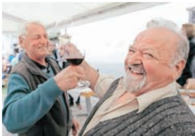
Čeprav Čebaškovi z vinom zalagajo velike hotele in restavracije ter na degustacijah gostijo skupine turistov z vsega sveta, v Sodček na kozarček zlahka pridejo tudi številni Radovljičani.

A pomemben del Sodčka so tudi domačini, ki tja enostavno zavijejo na kozarček ali dva. Tudi zanje vinoteka, v kateri sodov morda ni toliko, kot bi jih človek glede na ime pričakoval, se pa zato tako rekoč za vsakega najde prava steklenica vina, v teh dvajsetih letih postala pomemben del starega mesta. Tja zavijejo po buteljko za darilo, po "liter belega" za h kosilu, na požirek vina po koncertu ali enostavno na kozarček ob klepetu s prijatelji.