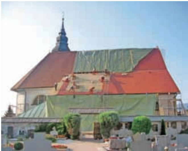
Cerkev v Lescah bo imela že do konca avgusta novo streho.