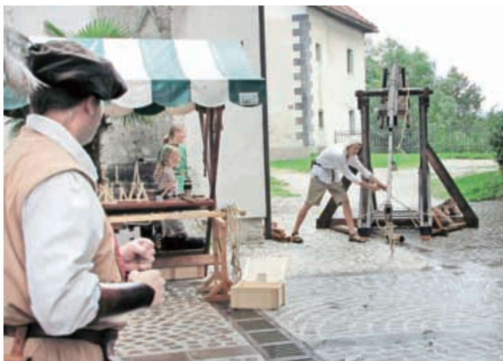
Nad sovražnika so se spravili s katapultom.