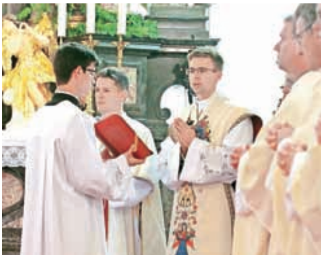
Nova maša v radovljiški cerkvi sv. Petra

"V prostem času, ki ga sicer ni veliko, se rad podam v hribe, preberem katero od bolj ali manj teoloških knjig ali poljudnoznanstvenih revij ter se ukvarjam z glasbo."