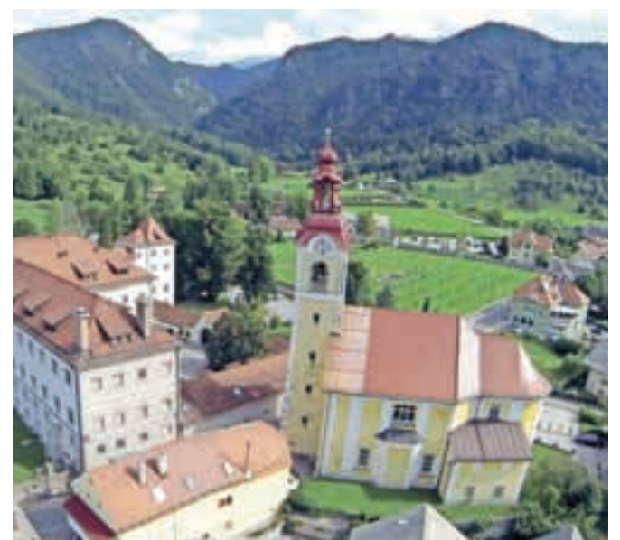
Begunjska cerkev je bila prvotno prekrita z opeko z gradu Kamen.