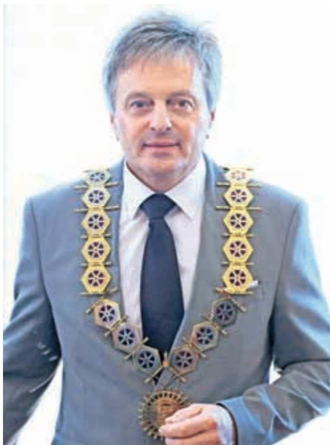
Župan Ciril Globočnik

»Največji naložbi v komunalno infrastrukturo v Kropi in Begunjah se bližata zaključnim delom. Po lani zgrajeni čistilni napravi in primarni kanalizaciji bo v Kropi do konca leta končana še gradnja vodovodnega omrežja in sekundarne kanalizacije. Skupaj je projekt vreden šest milijonov evrov in pol, več kot polovico sredstev pa smo pridobili od evropskega sklada za regionalni razvoj. Jeseni bomo zaključili tudi gradnjo kanalizacijskega omrežja v Begunjah, prav