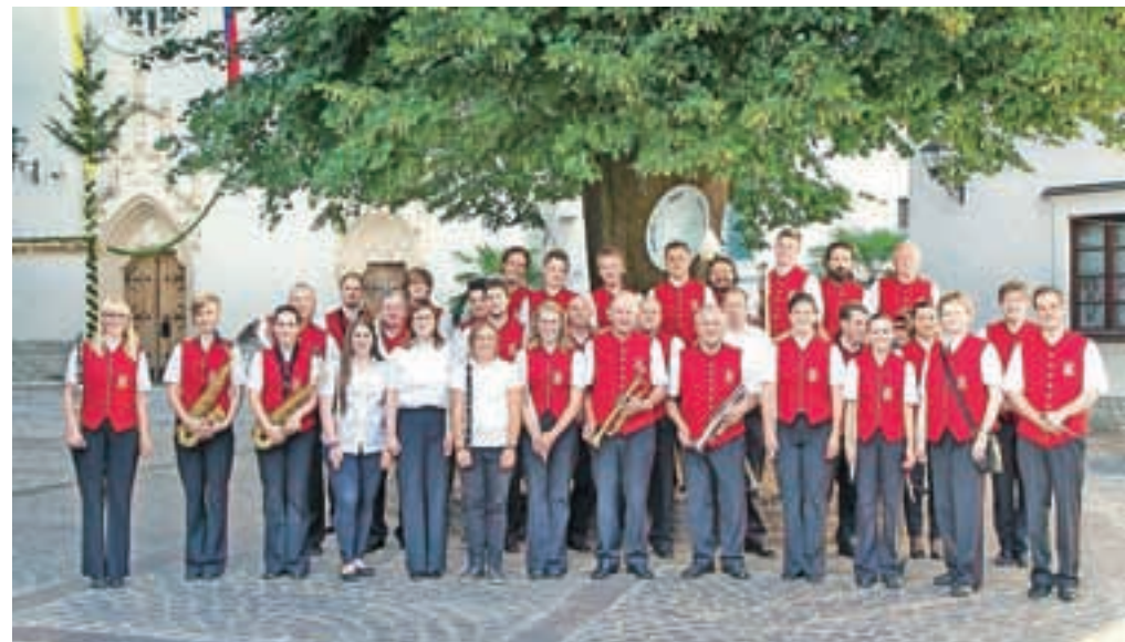
Pihalni orkester Lesce

Tam bo vsaka sodelujoča godba imela 12-minutni program. Na koncu bodo vsi prisotni zaigrali tri skupne skladbe, ki bodo posvečene spomenu Slavka Avsenika. Nato se veselica, ki jo organizira Rekreacijski klub večno mladih fantov, lahko začne ... Pihalni orkester vabi, da se udeležite tega glasbenega dogodka v Radovljici.