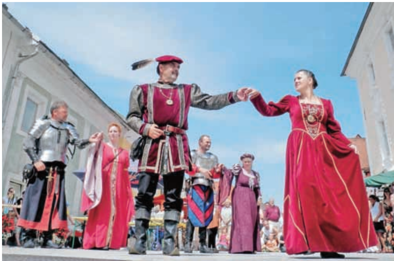
Gračakov ples, avtor Ljubo Jančič, diploma