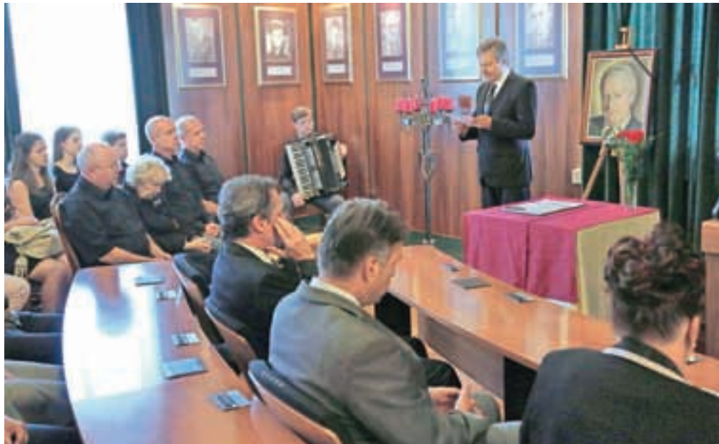
Žalna seja občinskega sveta je bila v dvorani Občine Radovljica.

Včasih smo v svojih razmišljanjih mislili, da so naša