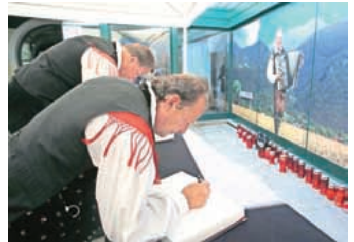
V žalno knjigo so se vpisali številni ljubitelji Avsenikove glasbe.