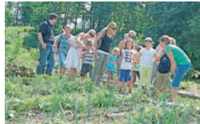
... na vrtu ...

sobotah in nedeljah od 10. do 19. ure. To soboto, 18., in v nedeljo, 19. julija, bo na Kopališču Radovljica Mednarodni plavalni miting Telekom Slovenije 2015. Tekmovanje bo v dopoldanskem času od 9. do