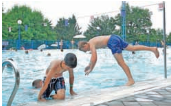
Vroče poletne počitniške dni je mogoče preživeti na bazenu ...

larski« so delali da Vincijevo padalo in druge mojstrovine, na nogometni so seveda igrali nogomet, na delavnici »skozi čas« pa so se s časovnim strojem podali v kameno dobo, v čas starega Egipta, srednji vek ipd. Po malici je sledila velika igra – tekmovanje med sedmimi skupinami, ki so se trudile, da bi najbolje in najhitreje opravile naloge, ki so jim jih zadali animatorji, skriti po župnišču in okolici. Skupine so se podale tudi po Radovljici in iskale animatorja, ki se je, preoblečen v Dominikovega mentorja sv. Janeza Boska, skrival in prek namigov v obliki fotografij (»snapchat«) izdajal, kje se giblje. Izvedli so tudi vodne igre, ki so se zaključile z vodnim bojem otrok proti animatorjem. Najbolj vroč dan pa je bil rezerviran za