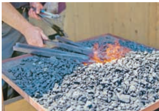
Osemletni otroci so včasih morali narediti do dva tisoč žebeljev na dan.