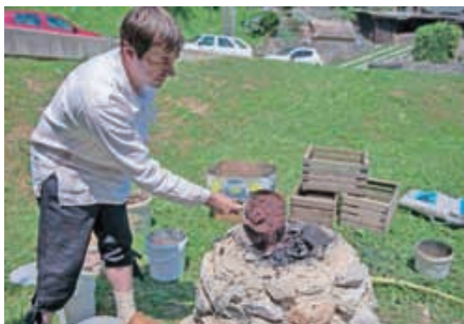
Železovo rudo so talili v peči, ki so jo zgradili pred vigenjcem.