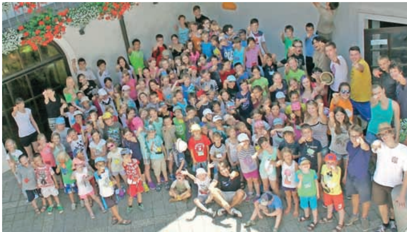
... ali na oratoriju.

izlet. Prehodili so dolgo pot do Kroke in se osvežili v tamkajšnjem bazenu. Svoje druženje so skupaj s starši zaključili s sveto mašo in veliko igro, kjer so starši prevzeli vlogo otrok, otroci pa vlogo animatorjev.