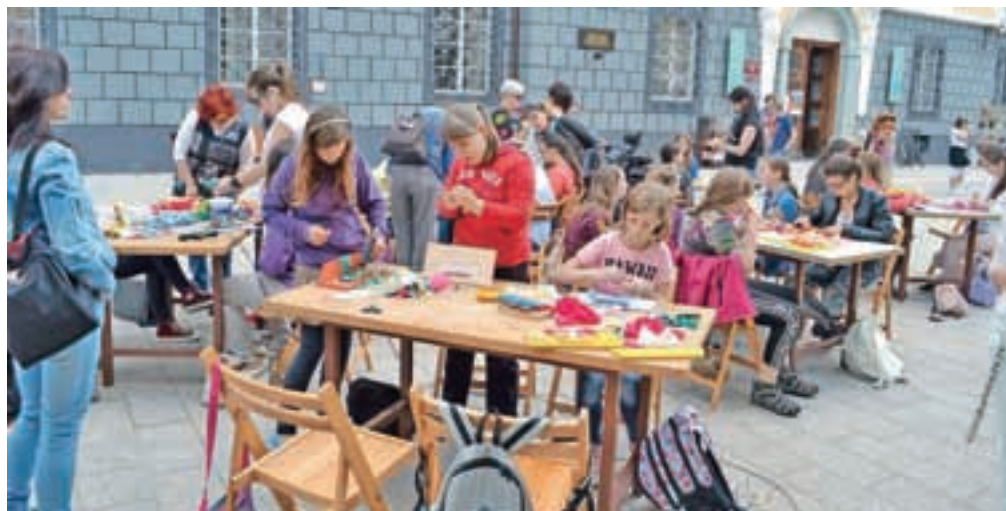
Vreme sončno in toplo, vzdušje živahno, iskrivo in delavno