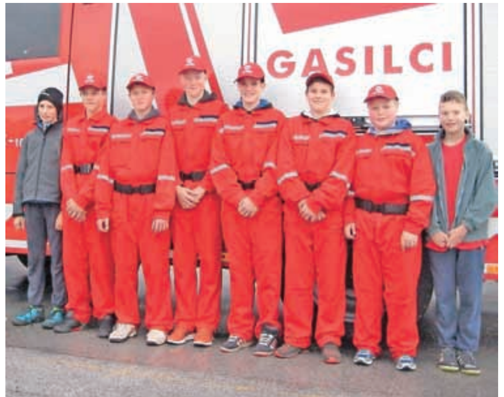
Mladi rod gasilcev iz Ljubnega, ki so se prav tako kot njihovi starejši vrstniki razveselili novega vozila.