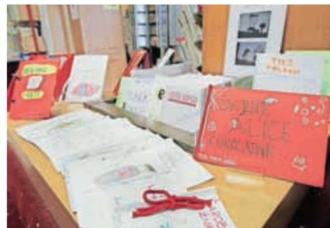
V prvi polovici junija je bila v radovljiški knjižnici na ogled razstava z naslovom Moja prva knjiga. Privlačne knjižice so izdelali učenci 5. a, 5. b in 5. c iz Osnovne šole Antona Tomaža Linharta.

Vse šolsko leto so radovljiški osnovnošolci pridno brali, na koncu pa so pri pouku še sami izdelali vsak svojo knjigo. Zbirko imenitnih idej in odličnih izvedb so v prvi polovici junija razstavili v prostorih Knjižnice A. T. Linharta v Radovljici.