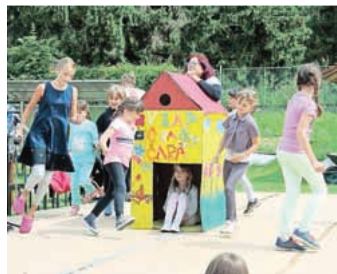
Na odru so se s kratko igrico Svetovne norice predstavili tudi otroci iz Otroškega in mladinskega centra Vila Čira iz Poljč.