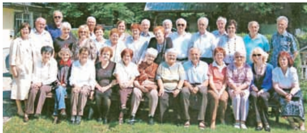
Šestdeset let po koncu osnovne šole so se spet zbrali.