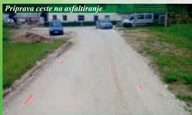
Priprava ceste na asfaltiranje

že dobrih 87 odstotkov vseh del, trenutno pa se glavna aktivnost odvija še pri izvedbi črpališč za potrebe priključevanja objektov. Pri sekundarnih in terciarnih kanalih 2. faze do zaključka vseh aktivnosti manjka le še nekaj odstotkov, v teh dneh pa na cesti ob pokopališču ter na Trati izvajamo obnovitvena dela po izgradnji kanalizacije. Do konca projekta moramo zgraditi še krajši odsek kanalizacije, obnoviti odseke občinskih cest ter državne ceste, urediti bankine in izvesti biotehnično ureditev. Projekt se bo formalno sicer zaključil konec leta 2015.