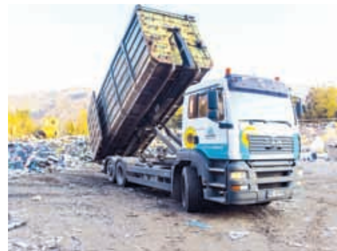
Z odlaganjem odpadkov na odlagališče onesnažujemo okolje in izgubljam dragocene surovine.

Komunala Radovljica, d.o.o. Ljubljanska cesta 27, 4240 Radovljica tel.: 04 537 01 11, faks: 04 537 01 12 e-naslov: info@komunala-radovljica.si www.komunala-radovljica.si