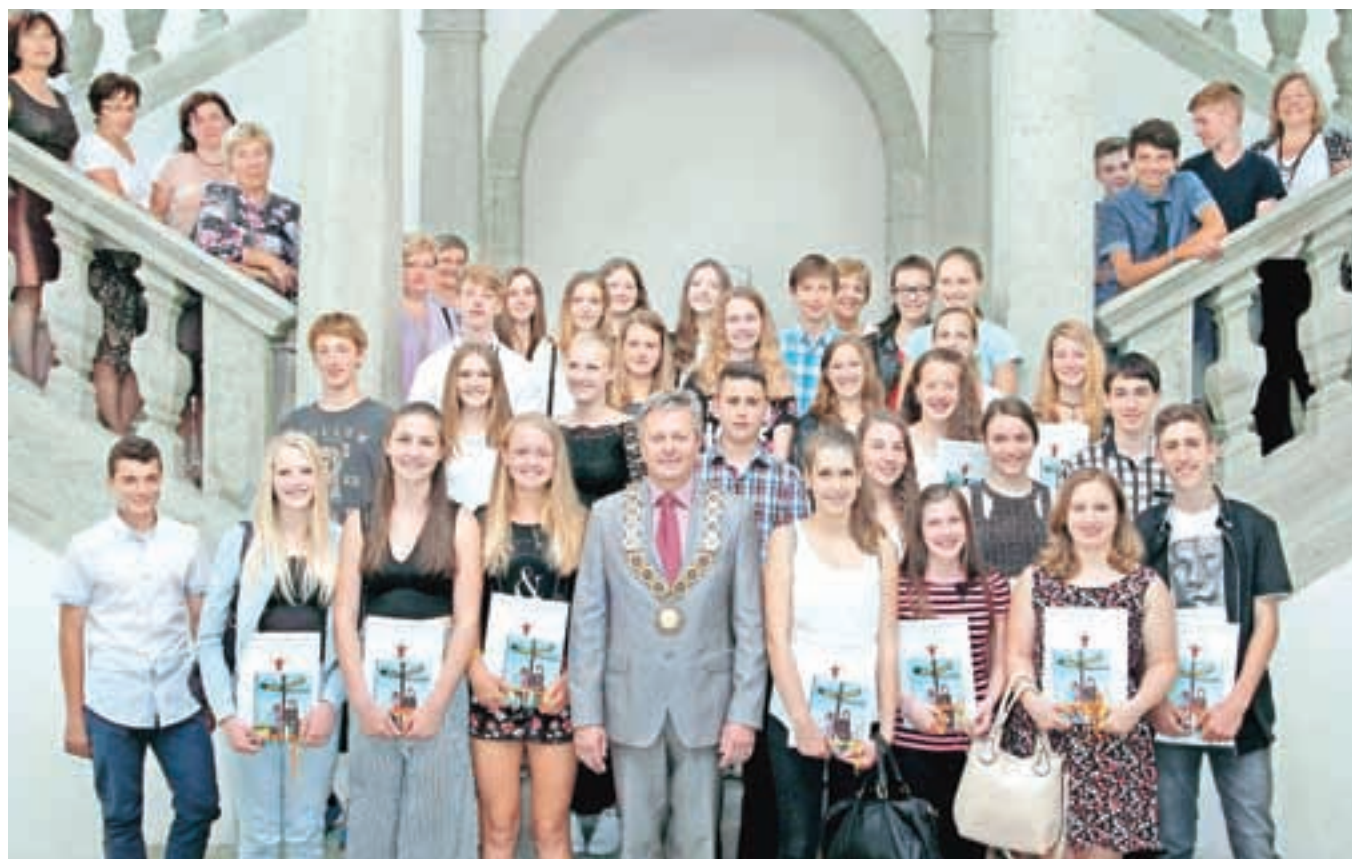
Učenci in učenke, ki so letos zaključili osnovno šolanje v radovljiški občini in so v vseh razredih dosegli odličen uspeh oziroma povprečno oceno najmanj 4,51. Letos je bilo takšnih 33.