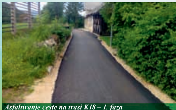
Asfaltiranje ceste na trasi K18 – 1. faza

V mesecu maju so dela potekala predvsem na sekundarnih in terciarnih kanalih 1. faze ter na treh črpališčih, kjer je potekala vgradnja in dobava potrebnih črpalk. Pri sekundarnih in terciarnih kanalih 1. faze smo tako do danes opravili