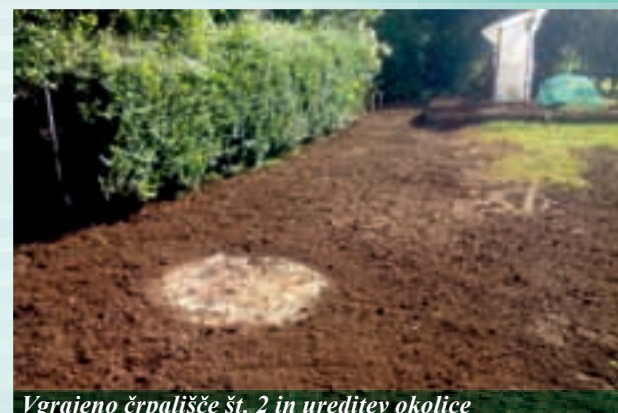
Vgrajeno črpališče št. 2 in ureditev okolice

Prav tako kot občani in drugi gostje, ki se na svojih poteh vozijo skozi našo občino, se tudi mi veselimo zaključka celotnega projekta, ko se bodo normalizirale vozne razmere in odpravili zastoji ter obvozi na cestah. Veseli nas, da prebivalci z veliko mero strpnosti in sodelovanja prenašate nastale neprijetnosti in razumete, da pri tako velikih infrastrukturnih posegih v okolje drugače žal ne gre. Zaradi pozitivnega vpliva, ki ga bo imel projekt na okolje v