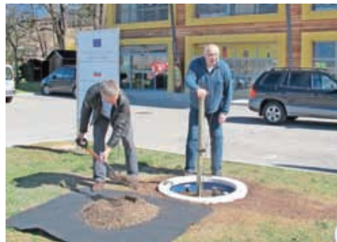
Obe lipi sta kot prvi v Sloveniji zasajeni v poseben sadilni obroč, sodobno okoljsko tehnološko rešitev, ki vključuje tudi sistem zalivanja ter gnojenja in je nastala v sodelovanju podjetij iz radovljiške občine GVT Štraus in Humko.