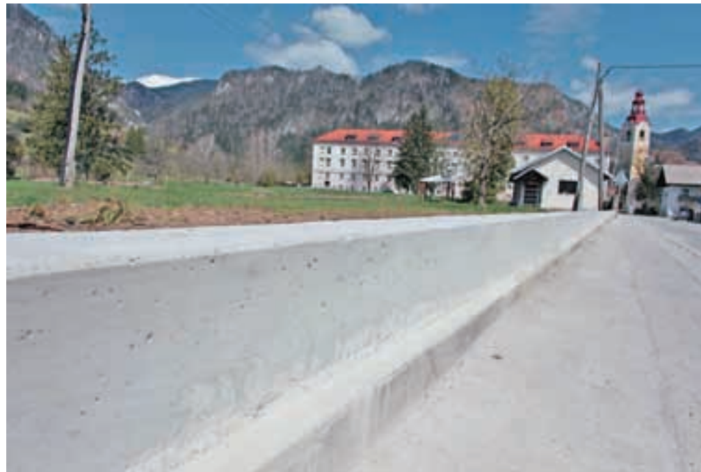
Psihiatrična bolnišnica Begunje se je lotila sanacije podrtga dela obzidja okoli gradu Katzenstein.

Prejšnji teden so sicer začeli odstranjevati del poškodovanega zidu, in kot pojasnjujejo v Psihiatrični bolnišnici Begunje, izvajajo sanacijo podrtga dela obzidja po vetrolomu. Zavod za varstvo kulturne dediščine je izdal kulturnovarstvene pogoje, ki določajo, da se zid ne sme odstraniti. »Park je v lasti Ministrstva za zdravje in v upravljanju Psihiatrične bolnišnice Begunje. Uporablja se v terapevtske namene in nudi varnost in zasebnost pacientom Psihiatrične bolnišnice Begunje. K temu nas zavezuje tudi Zakon o pacientovih pravicah. Kljub temu