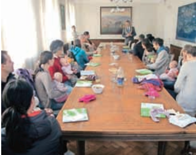
Na prvi letošnji sprejem pri županu je prišlo kar 41 novorojenčkov s starši.

V petek, 20. marca, so na občini pripravili prvi letošnji sprejem pri županu za novorojenčke. Prišlo je skupaj 41 otrok s starši, ki jim je župan čestital in izročil darilo občine – knjigo in darilni bon.