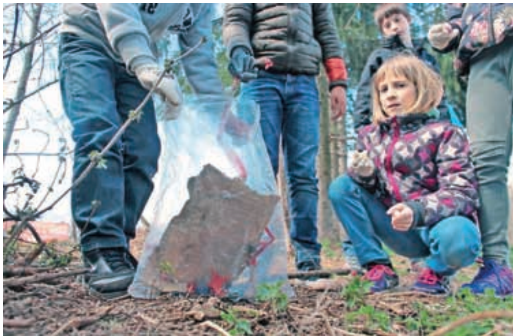
Takole so v iztekaajočem se tednu okolico šole že čistili učenci Osnovne šole Frana Saleškega Finžgarja Lesce.