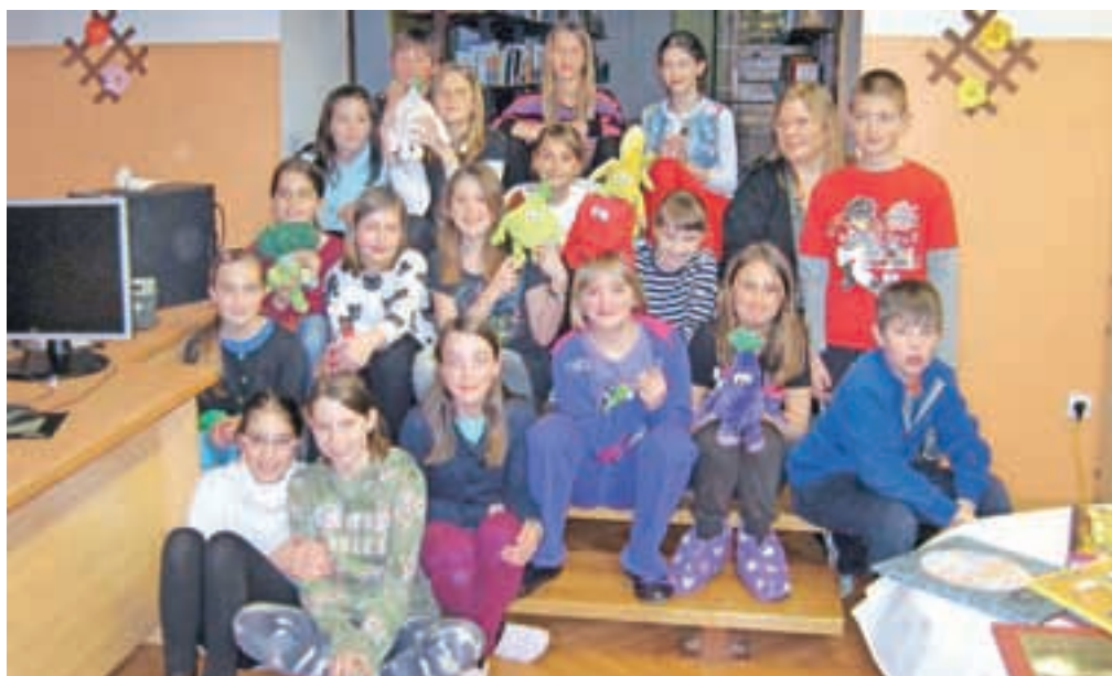
"Ponočevali" s knjigo so tudi na osnovni šoli F. S. Finžgarja v Lescah.

Vsak učenec posebej se je na kratko predstavil, kar je bil uvod v ogled skrbno zmontiranega in humornega filmčka o nočni pustolovščini. Za deseti rojstni dan je sledila še torta in ob koncu direktorčina obljuba, da bo 11. Noč z Andersenom 1. aprila prihodnje leto. Zares in ne za hec!