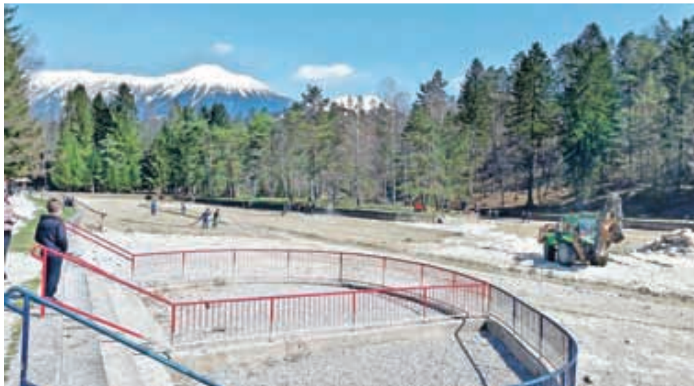
Prejšnji teden so izpraznili in očistili tudi jezero v kampu Šobec, ki je že pripravljen na prve goste v letošnji sezoni.

V Kampu Šobec so tako lani zabeležili 21.300 gostov, kar je 20 odstotkov manj kot leto poprej, ter 72 tisoč nočitev, kar je 23 odstotkov manj kot leto poprej. Kljub temu, poudarja Kavčič, je Šobec še vedno ustvaril večino vseh turističnih nočitev v občini. "Pri naravi smo brez moči in tako je bilo tudi februarja lani, ko je lomilo drevesa, a katastrofa nas je spodbudila, da smo investirali v tisto, kar je že dalj časa čakalo." Sana-