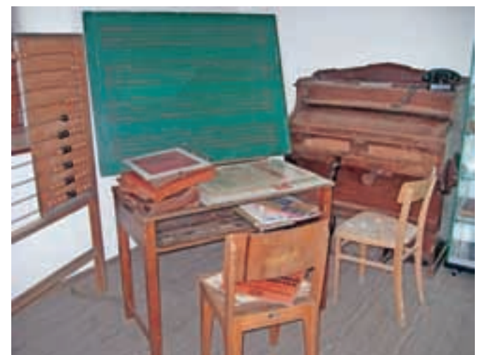
V večjem prostoru je del nekdanje šolske učilnice s tablo in klopjo.

predmetov, ki so jih tam našli arheologi, lahko postavili na ogled v vitrinah svojega muzeja. Muzej v Mošnjah so začeli v stavbi, ki jo je turističnemu društvu v uporabo prijazno odstopilo župnišče, urejati pred več kot desetimi leti na pobudo tedanjega predsed-