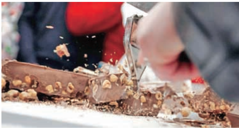
Ker je že lani Radovljica pokala po šivih, letos festival širijo z dodatnim dnevom ter prizoriščem v grajskem parku.

Druga velika novost letošnjega leta je dodaten festivalski dan. Festival se bo začel že v petek ob treh popoldan, z uvedbo dodatnega dneva pa želi organizator predvsem domačinom