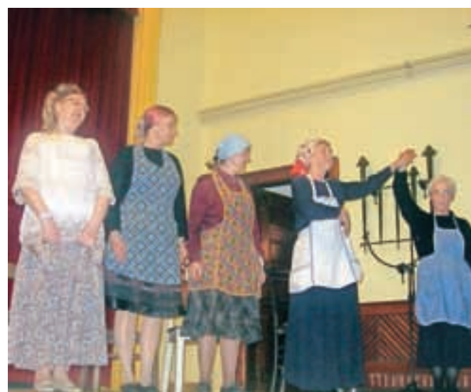
Občinstvo so nasmejale jezične Kroparice s skečem Kroparska čofta.