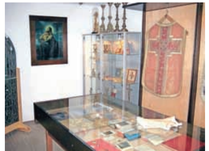
V sobi, namenjeni predstavitvi cerkve, so razstavljeni stara duhovniška oblačila, cerkveno posodje, knjige in slike ter jaslice iz žgane gline.

je poleti, pravi Pangerc. »Vsi, ki pridejo, so navdušeni nad tem, kar imamo pokazati. In v Mošnjah je kaj videti: poleg muzeja še čudovito renesančno cerkev sv. Andreja, sedemdeset let staro vaško lipo, staro Kvan-drovo hišo, eno redkih, ki je ostala po požigu vasi leta 1944, pa žago venecialko v grabnu in seveda arheološko najdišče Villa Rustica, ki je bilo odkrito in zavarovano ob gradnji gorenjske avtoceste pred leti. Domačinom je žal, da zaenkrat ni denarja, da bi najdišče prekrili s streho in tako uredili za ogled, zato si bodo prizadevali, da bi vsaj replike