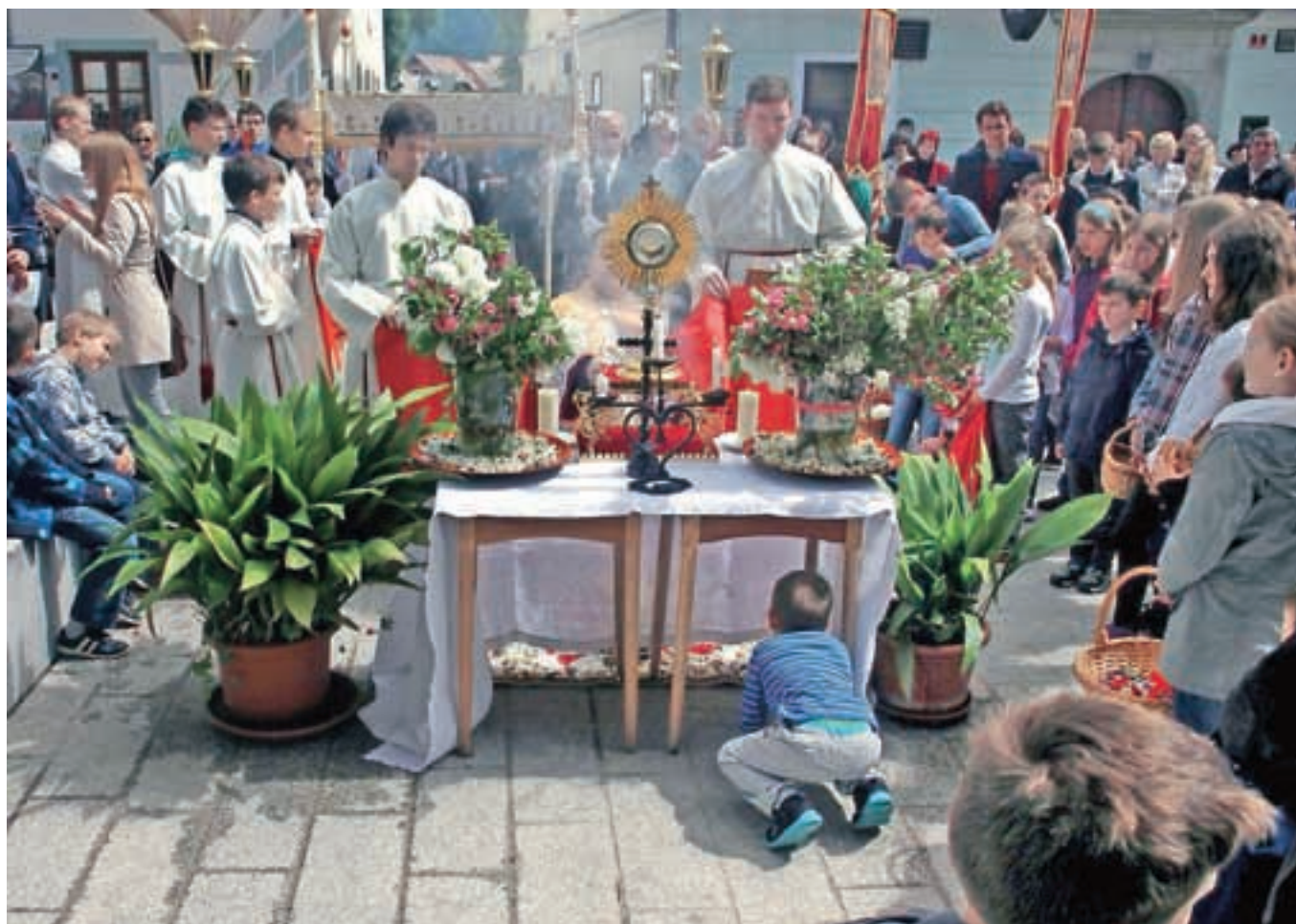
Kaj se le gredo – avtor Janez Resman, 2. nagrada