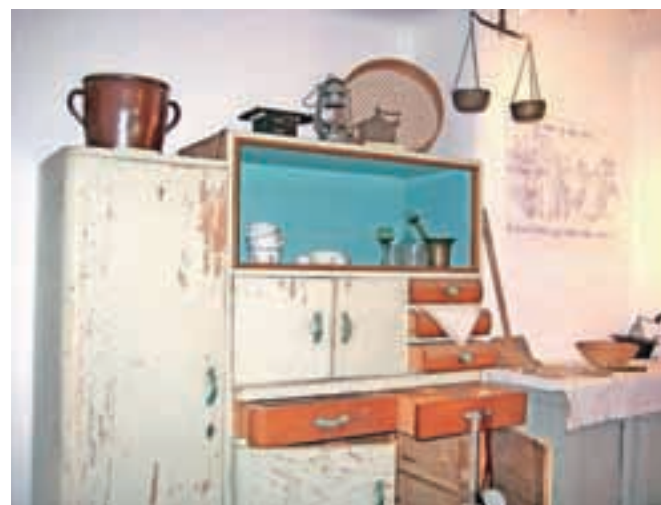
V zbirki so raznovrstni predmeti iz vsakdanjega življenja nekdanjega prebivalstva in vasi Mošnje.