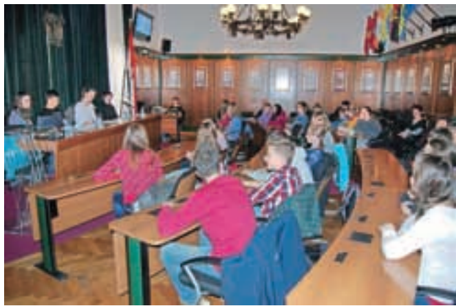
Mladi so predstavili številna vprašanja, s katerimi se srečujejo pred pomembnimi odločitvami, kaj početi v življenju.

Mladi so predstavili številna vprašanja, s katerimi se srečujejo pred pomembnimi odločitvami, kaj početi v življenju. Povedali so, da se za poklic odločajo na podlagi svojih sposobnosti, interesov, znanja, osebnostnih lastnosti pa tudi vpliva staršev in drugih dejavnikov. So pa kljub tem vprašanjem veči-