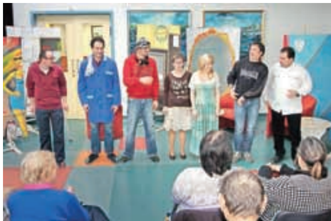
Skupina odraslih iz VDC je s predstavo Mala princesa poskrbela za lep uvod v srečanje.