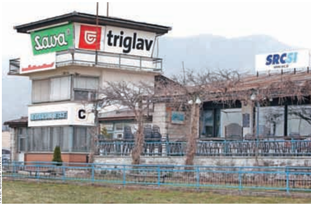
V leško letališče bo občina Radovljica v prihodnjih dveh letih vložila 100 tisoč evrov.

dokumentacijo in gradbeno dovoljenje za rušenje nekdanje Vovkove hiše, ki stoji tik ob letališki stezi in iz katere se je družina po obnovi steze v novo, nadomestno bivališče izselila pred dvema letoma. Staro stavbo bodo porušili prihodnje leto.