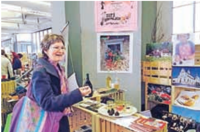
Turizem Radovljica se je predstavljala tako kot v preteklih letih v sklopu Slovenskih Alp na stojnici RDO Gorenjska.

V zadnjih dneh januarja se je na ljubljanskem gospodarskem razstavišču odvijal tradicionalni sejem Alpe Adria, Turizem in prosti čas. Na njem so se tokrat združeno predstavljala turistična društva Begunje, Brezje in Mošnje ter mesto Radovljica. Turizem Radovljica je sicer pobudo za sodelovanje poslal na vsa turistična društva v občini, a so se povabilu odzvali le omenjeni trije. Ob posameznih krajih so se s pogostitvijo predstavili tudi gostinski ponudniki, v Radovljici Lectar in Kunstelj, v Mošnjah Vila Podvin, v Begunjah Gostišče Draga ter skupaj z Brezjami Izletniška kmetija Globočnik.