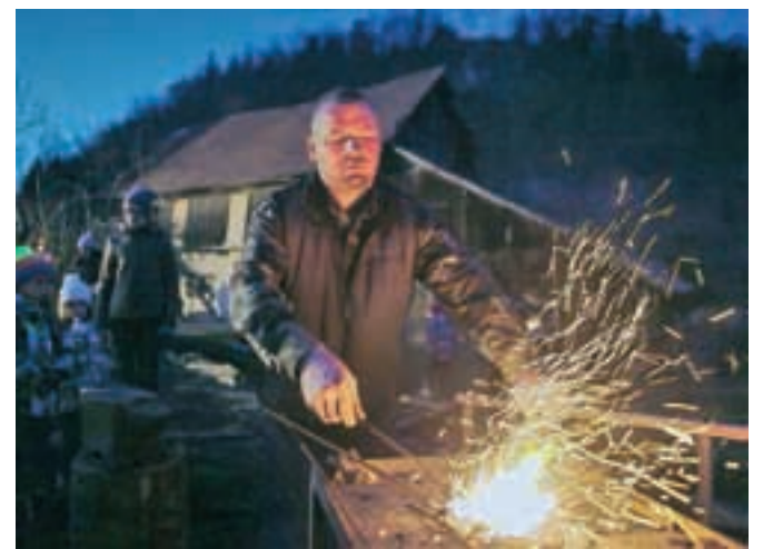
Pridih starih kovaških dni je v Kamni Gorici obogatilo kovanje žebeljev.