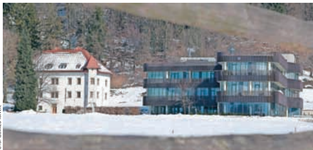
Hotel Lambergh po krajši prekinitvi normalno obratuje, vse odkar je od jeseni 2013 v najemu podjetja Lambergh. Dolgovi nekdanjih lastnikov pa bodo ostali nepoplačani.

lji pa tudi nekdanji zaposleni hotela, ostali brez vsega. Le Družba za upravljanje terjatev bank ima svojo nekaj več kot pet milijonov vredno terjatev zavarovano z nepremičninami podjetja Elba plus, od katerega je oktobra 2013 hotel v Dvorski vasi najelo podjetje Lambergh. Hotel je od takrat naprej tudi ves čas odprt.