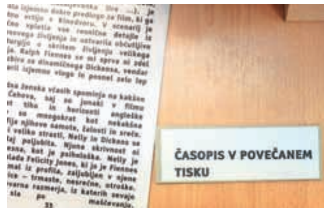
Razstavo so v torek odprli v knjižnici na Bledu, kjer bo na ogled še do konca meseca.

V sklopu projekta Knjižnica slepih in slabovidnih po slovenskih knjižnicah gostuje razstava z naslovom Svet drugačnih občutenj. Razstava se osredotoča na predstavitev tehničnih pripomočkov in gradiv, ki so dostopna slepim, slabovidnim in osebam z motnjami branja. Obiskovalci se tako lahko seznanijo, kako lahko beremo, ko gradiva niso dostopna našim očem, pa tudi, kako se je prilagajanje gradiva razvijalo v preteklosti in kateri so bili glavni mejniki razvoja.