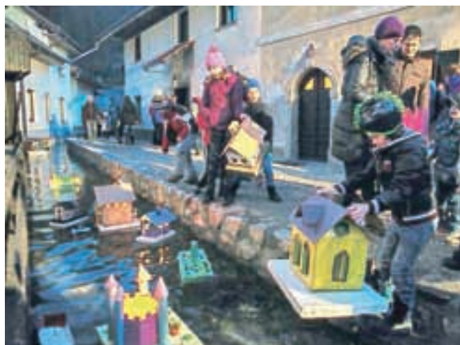
Tradicija spuščanja barčic v Kropi in Kamni Gorici sega več kot stoletje v preteklost.