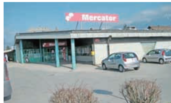
Najboljši v kategoriji manjših supermarketov v Sloveniji

ših supermarketov. Zanimivo je, da sta najvišji priznanji prejeli še dve trgovini na Gorenjskem, in sicer Market Mercator na Bledu v kategoriji manjših prodajal ter Hipermarket Mercator Primskovo Kranj v kategoriji hipermarketov.