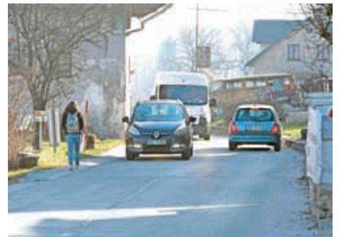
Nič ne kaže, da bodo v Podnartu že kmalu imeli pločnik na najožjem delu ob regionalni cesti.

Svetnica Rebernikova je na župana in direktorja občinske uprave naslovila tudi vprašanje o stanju v zvezi z gradnjo pločnika skozi naselje Podnart. Kot so ji pojasnili na občinski upravi, je bil za ureditev regionalne ceste oziroma izgradnjo pločnika skozi naselje Podnart že leta 2008 podpisan protokol o odstranitvi objekta na najožjem delu regionalne ceste. "Podpisniki protokola so Občina Radovljica, Cestno podjetje Kranj, d. d., in Ministrstvo za promet RS. Občina je v okviru možnosti svoje obveznosti izpolnila in