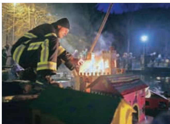
Barčice, ki jih je zajel ogenj, prižgan v notranjosti, so iz bajerja potegnili gasilci.