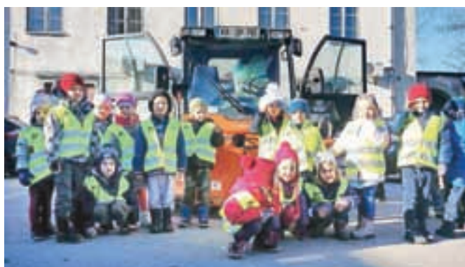
Otroci so izvedeli tudi, kdo pozimi pluži pločnike in ceste.