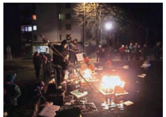
V Kropi so letos po bajerju spustili več kot 100 barčic.