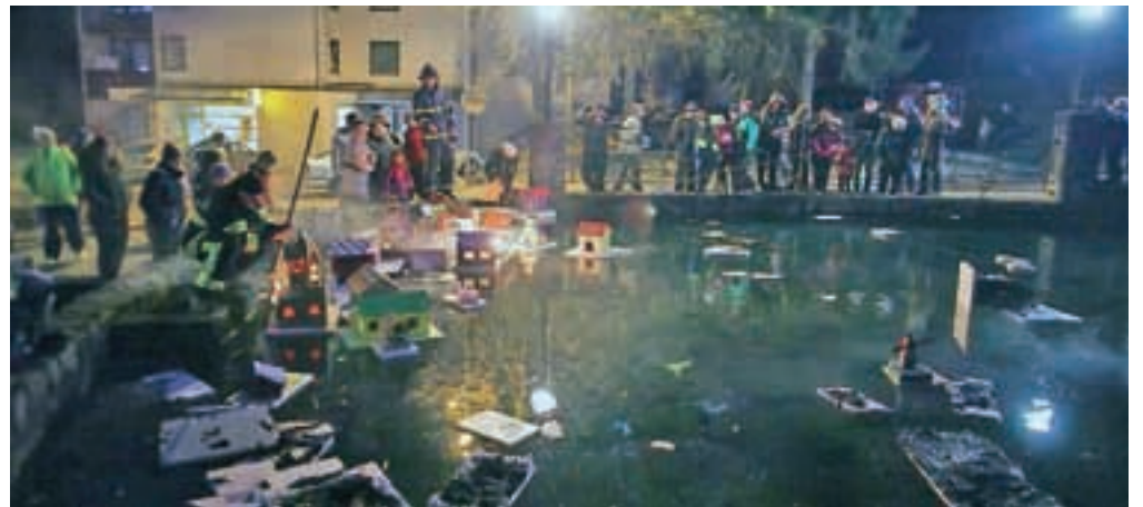
Veliko število ljudi se je na predvečer gregorjevega zbralo tudi v Kropi.