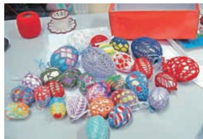
Pod spretnimi prsti so v delavnici, ki jo je pripravila sekcija ročnih del v okviru Društva upokojencev Kropa, nastale prave umetnine.