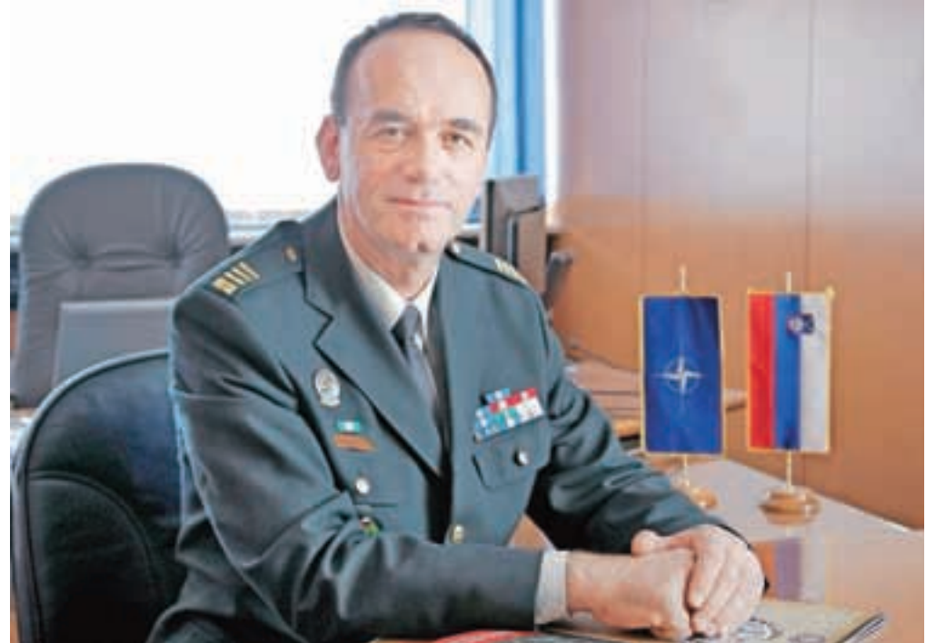
Polkovnik Boštjan Blaznik

“Zveza NATO za gorsko bojevanje nima razvite zmogljivosti, ustrezne institucije, izdelane doktrine, standardnih operativnih postopkov, zbranih izkušenj in predvsem dosežene ustrezne stopnje medsebojne povezanosti. Poslanstvo Centra odličnosti za gorsko bojevanje bo tako v zagotavljanju odličnosti in strokovnosti na področjih usposabljanja in urjenja posameznikov in enot, podpiranju razvoja doktrine, učenju iz izkušenj in z raziskavami, definiranju standardov ter