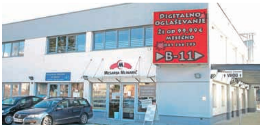
Moteči reklamni pano na poslovni stavbi v športnem parku zdaj ponoči ugašajo.

aktivnosti do nadaljnega zaustavljene zaradi pomanjkanja sredstev. Na posvetu o ključnih vprašanih razvoja cestne in železniške infrastrukture v RS, ki je bil januarja letos, smo izvedeli tudi, da trenutne finančne razmere na Ministrstvu za infrastrukturo ne dopuščajo realizacije njihovih obveznosti iz protokola. To za občino predvsem zaradi zagotavljanja prometne varnosti ni sprejemljivo, zato si bomo v okviru svojih možnosti še naprej prizadevali, da ministrstvo zagotovi sredstva za izpolnitev obveznosti, ki jih je sprejelo s podpisom protokola," pojasnjuje občinska uprava.