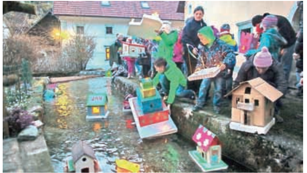
V Kamni Gorici so letos našli rekordnih 240 plavajočih umetnin.

Pridih starih kovaških dni je v Kamni Gorici obogatilo kovanje žebeljev in možnost ogleda notranjosti šparovčeve kovačnice v neposredni bližini. Poleg ureditve zunanosti kovačnice so bile za tiste, ki Kamno Gorico obiščejo le za gregorjevo, novosti tudi leseno kolo v vodi, urejena brežina in lična kovana ograja na mostu. V Kamni Gorici so dve barčici tudi nagradili: priznanje za najbolj "kroparsko" je dobila maketa stare fužinarske hiše, za najbolj izvirno pa "Stolpnica".