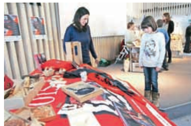
Škofjeloški pasijon se je z izbranimi pasijonskimi spominki nedavno predstavil na Bledu.

Škofja Loka – Do prve predstave Škofjeloškega pasijona, ki se na ulice in trge Škofje Loke vrača po šestih letih, nas ločita še dva tedna. Premiera bo na tiho soboto, 21. marca, ob 20. uri, naslednja takoj v nedeljo, 22. marca, ta mesec bodo še tri, 27. marca bo namenjena šolam, 28. in 29. marca znova vsem drugim. Pasijon bodo po veliki noči uprizorili še 6., 11. in 12. aprila. Škofjeloški pasijon predstavlja najstarejšo dramsko besedilo v slovenskem jeziku in edino evropsko ohranjeno režijsko knjigo iz baročnega obdobja. Leta 1721 ga je napisal pater Romuald Lovrenc Marušič iz loškega kapucinskega samostana in prikazuje svetopisemsko zgodbo od Adamovega in Evinega izgo- na iz raja prek Kristusovega trpljenja in smrti. Predstava Škofjeloškega pasijona, Processio Locopolitana, je spektakularna, v njej sodeluje okoli osemsto nastopajočih, med njimi skoraj stotinja otrok, okoli sedemdeset konjenikov, vseh, ki oblikujejo pasijonsko zgodbo, pa je kar tisoč. Uprizoritev je v primerjavi z drugimi pasijoni,