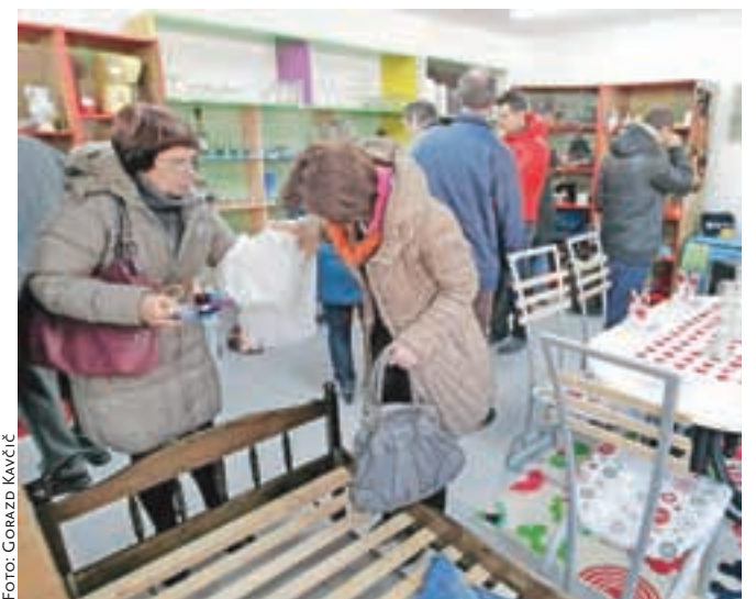
Veliko zanimanje za razstavljeno blago že od prvega dne.