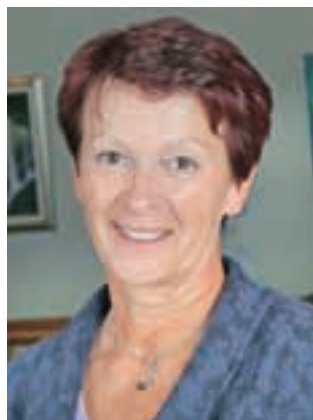
Tea Beton

"Predvsem se bom zavzemala za ljudi, torej je v ospredju kvaliteta življenja, v mestu in na vasi, v vseh življenjskih obdobjih. Hvaležna bom za pobude občanov, za njihove kritike in opozorila. Seveda bom pazila, da se bo dokončala obljubljena gradnja kanalizacije v