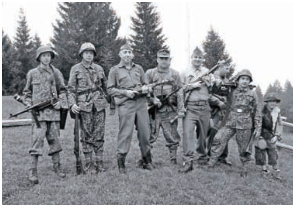
Člani društva v avtentičnih uniformah – kot bi čas premaknili za mnogo desetletij nazaj.

Eden takšnih dogodkov je bil pred tremi leti in pol na Vodiški planini, podobnega so uprizorili lani v Parku vojaške zgodovine v Pivki,