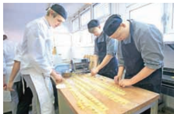
Skupna priprava idrijskih žlikrofov

Ko so bile jedi gotove, so mladi kuharji odložili predpasnike in uživali v slovensko-danskem kosilu. Dijaki drugega letnika SGTŠ Radovljica so se polni novega znanja in poznanstev vrnili k pouku, danski dijaki pa v hotelih Hit Alpinea teden dni opravljali gostinsko prakso.