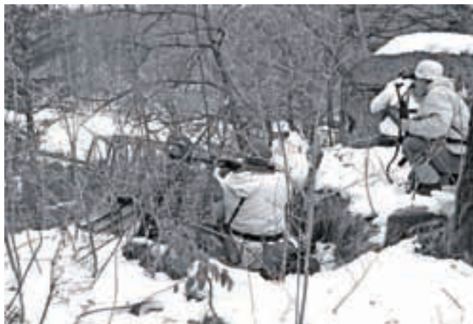
Med eno od uprizoritev bitk

na prireditvi, kjer si je njihovo predstavo“ ogledalo kar okoli 3500 gledalcev.