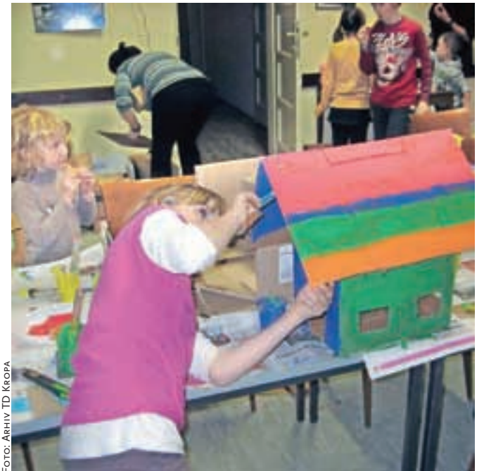
V mali dvorani Kulturnega doma v Kropi bo v petek, 6. marca, ob 16. uri za vse tiste, ki bi želeli pomoč in družbo pri ustvarjanju, delavnica z naslovom Ustvarimo barčico.

V Kamni Gorici se bodo letos prireditvi pridružili tudi člani Fundacije za razvoj Lipniške doline in ustanova Kultura-natura. Ob 17. uri ob Šparovčevi kovačnici pripravljajo tematsko fotografsko razstavo in predstavitev projekta Mladi – skrbniki dediščine. Sledilo bo kovaje žebeljev, ki se bo nadaljevalo tudi ob spuščanju barčic od 18. ure dalje.