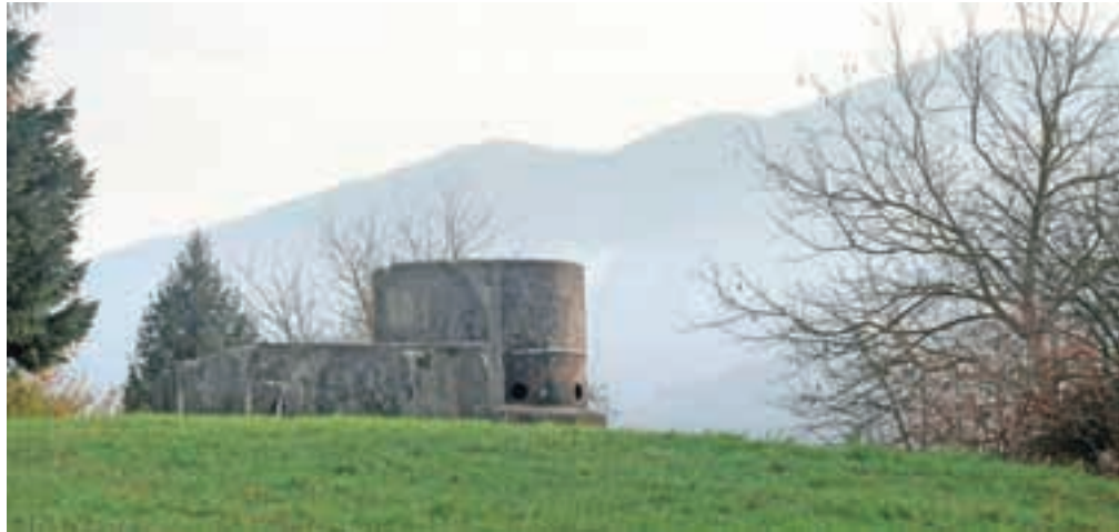
Stolpčni bunker ob Cankarjevi ulici v Radovljici

Del Rupnikove linije poteka preko Jelovice, Radovljice do Begunj. Objekti na tem območju niso doživeli »vojne krsta«, saj so bili predhodno zapuščeni. Majhni, večji in raznovrstnih tipov na svojih mestih stojijo še danes. Na omenjenem odseku linije je trenutno najdenih okoli 50 utrdbenih objektov. Nekateri stojijo na vidnih mestih, ki jih vsakodnevno prečka veliko ljudi, spet drugi pa so bolj »skriti« in posledično manj poznani. Ohranjeni so na Obli gorici, ob Volčjem hribu, pod starim delom mesta Radovljica, proti Lancovem, nad Begunjami. Nekaj jih je bilo porušeni, spet drugi so ohranjeni