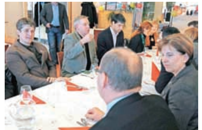
Delovno kosilo z župani v Lescah