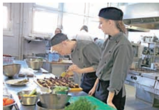
Danci so se predstavili z odprtimi obloženimi kruhki.