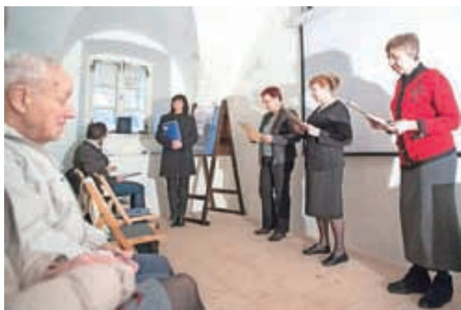
Na predstavitvi Vigenjca so članice gledališke skupine Čofta interpretirale zapiske iz župnijske kronike iz časa prve svetovne vojne.

Vsakoletni izid nove številke Vigenjca v Kovaškem muzeju v Kropi običajno pospremljajo s posebnim kulturno obarvanim dogodkom, ki je vselej dobro obiskan. Tako je bilo tudi letos ob slovenskem kulturnem prazniku, ko so v sodelovanju s Kovaškim muzejem kulturni program pripravili gledališka skupina Čofta, ki deluje v okviru KD Kropa, in združena moška pevska zbor Kropa in Podnart pod vodstvom Egija Gašperšiča. Članice gledališke skupine so interpretirale zapiske iz župnijske kronike iz vojnih let, zbor pa je med drugim zapel tudi znano kroparsko kolednico Preč je zdej to staro leto. In kakšno branje prinaša Vigenjca?