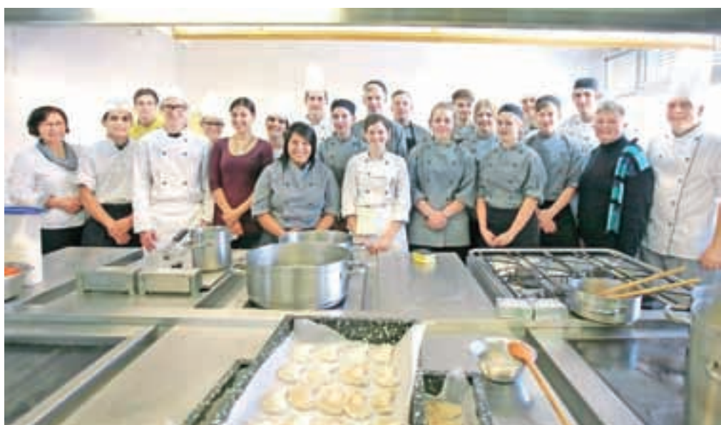
V prijetnem kuharskem vzdušju sta se združili slovenska in danska kulinarika.

Bo že držalo, da imajo stare tradicionalne slovenske jedi posebno mesto v vsaki slovenski kuhinji. Radovljiški