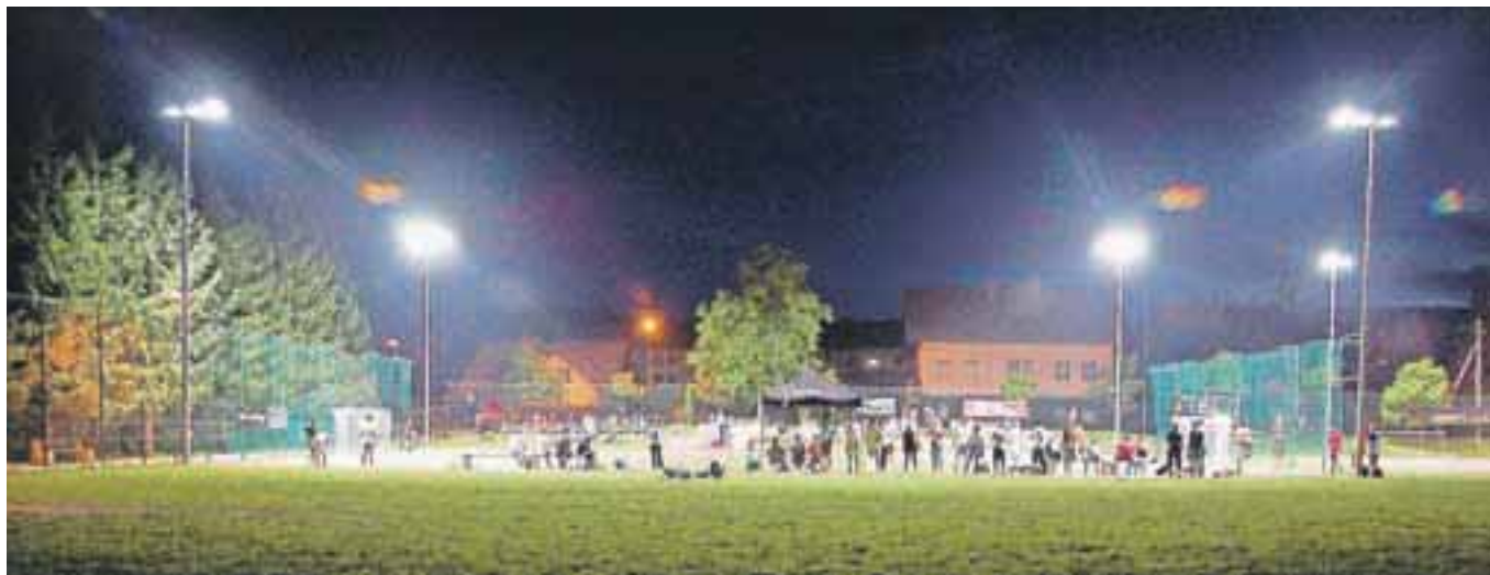
Nočna, avtor: Simon Senica

raj tako kot v Afriki ), Ljubo Kozinc ( Večerno vzdušje ), Bor Rojnik ( Ferrafolk 3 ).