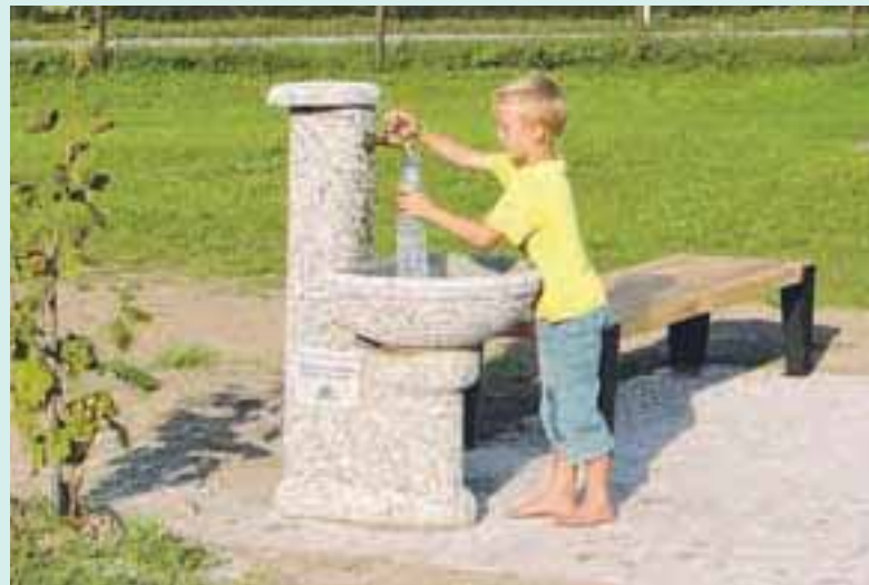
Tudi pitna voda na vseh enajstih odvzemnih mestih pitnikov je zdravstveno ustrezna in varna.

Število odvzetih vzorcev in obseg analiz sta odvisna od količine distribuirane pitne vode ter od njene pričakovane kvalitete. V letu 2012 je bilo na omenjenih vodovodnih sistemih odvzetih 208 vzorcev pitne vode, od katerih je večina ustrezala zahtevam Pravilnika o pi-