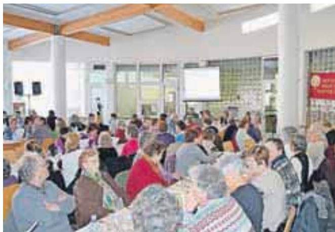
Letni zbor članov Društva invalidov občin Radovljica Bled