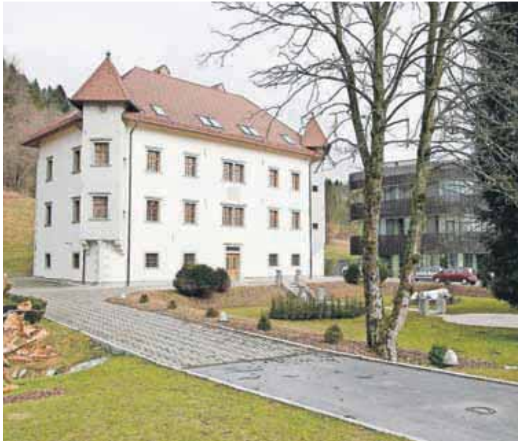
Bo hotel v Dvorski vasi z novim lastnikom vendarle zaživel?