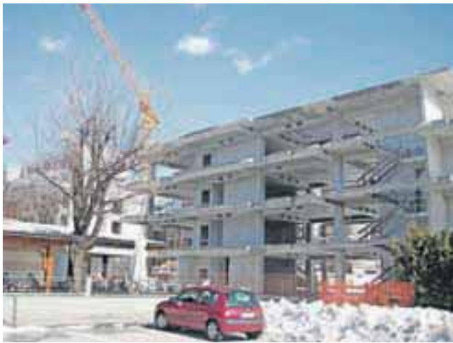
Občina Radovljica lani ni imela dolgov, letos in prihodnje leto pa se s sklepom občinskega sveta lahko zadolži za maksimalno 1,3 milijona evrov na leto, predvidoma za gradnjo vrtca v Lescah ter kanalizacije in vodovoda v Kropi, župan pa razmišlja tudi o najemu kredita za dokončanje knjižnice v Radovljici.

Svetniki so na seji potrdili tudi občinska podrobna prostorska načrta (OPPN) Brezovica 1 in Brezovica 2. Dokumenta urejata gradnjo skupaj 36 prsto stoječih enostanovanjskih stavb. Osnutek OPPN Zgornja Dobrava pa določa pogoje za novo pozidavo na robu Zgornje Dobreve, in sicer stanovanjskih hiš in kmetijskih stavb. Sprejeta je bila tudi obvezna razlaga 9. člena odloka o sprejetju ureditvenega načrta starega mestnega jedra Radovljice, ki je bila pripravljena na pobudo investitorja, ki načrtuje ureditev manjšega hotela v eni od sta-