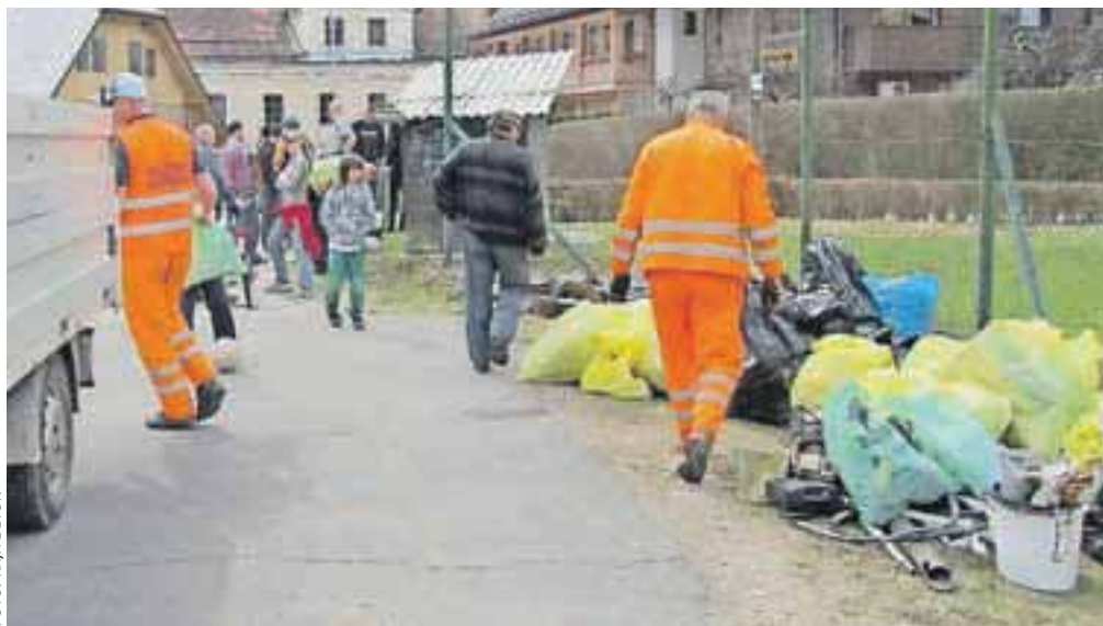
Lani smo v občini Radovljica zbrali približno 140 kubičnih metrov oziroma 30 ton odpadkov.

»Pomembno je, da že sproti ločujete odpadke, da bo ostane, ki se odloži na deponiji,