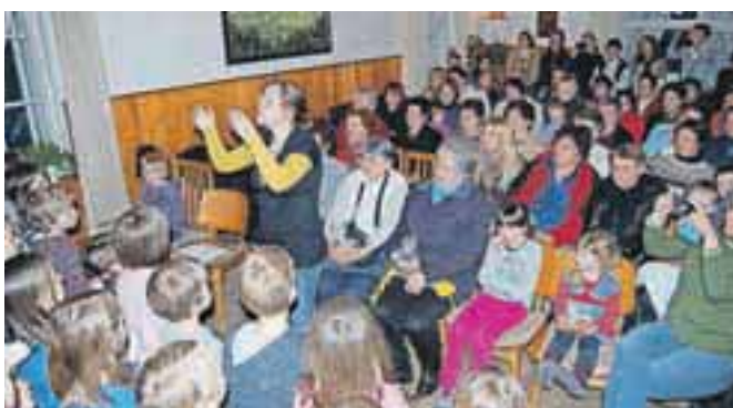
Najmlajši so obdarili mame in babice.

V društvu upokojencev Begunje so ob materinskem dnevu pripravili kulturno prireditev, ki je bila namenjena predvsem materam in ženam. Najmlajši, otroci domačega vrtca, so jim pripravili prav posebno presenečenje. Poleg prisrčnega pevskega nastopa so vse mame in babice tudi obdarili. Sami so s pomočjo vzgojiteljic spekli piškote in izdelali posode. Kot so povedale vzgojiteljice, že najmlajše učijo spoštljivega odnosa do starejših, od njih pa se vsi skupaj tudi učijo. Prisotne so v pesmi in besedi razveselili tudi učenci begunske osnovne šole, prireditev pa je zaključil mešani pevski zbor društva upokojencev iz Lesc. P. K.