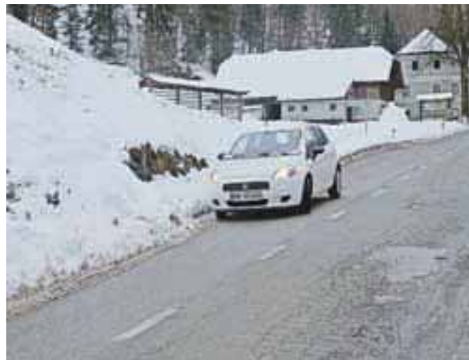
Direkcija za ceste zaščite pred snežnim plazanjem v Kropi za zdaj ne načrtuje, saj je na državnih cestah še veliko prednostnih mest, ki jih ogrožajo večji snežni plazovi.

Pred kratkim je na najbolj prometni cesti v Kropi prišlo do osipa snega s travnate brežine. Koncesionar: Gorenjska gradbena družba, d. d., Kranj, je sneg odstranil že naslednji dan po nesreči. »Zaradi osipa, do katerega je prišlo zaradi velike količine zapadlega snega na strmi travni brežini, je bila do odstranitve snega na cesti vzpostavljena polovična zapora,« je povedala Helena Petrina iz Direkcije RS za ceste, ki pravi, da posebne zaščite na tem območju za zdaj ne načrtujejo, saj je na državnih cestah še veliko mest, ki jih ogrožajo večji snežni plazovi, zato takšna mesta obravnavajo prednostno. Za postavitev zaščitnih ograj na vseh ogroženih mestih bi bila potrebna velika finančna sredstva, ki pa jih DRSC nima na razpolago. Na cesti Lipnica–Kropa–Rudno pa je v zelo slabem stanju tudi podporni kamniti zid ob vodotoku. V izdelavi je projektna dokumentacija za sanacijo tega zidu in ceste, za katero na Direkciji predvidevajo, da bo izvedena še letos. Sredstva za sanacijo so že zagotovljena. T. K.