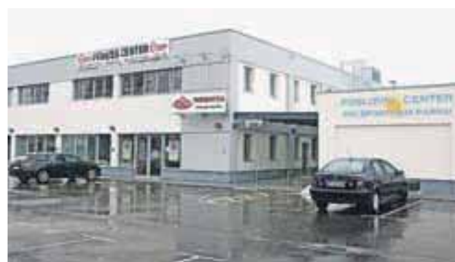
Med pogodbami, ki jih pregleduje protikorupcijska komisija, je tudi pogodba za gradnjo poslovnega objekta pri športnem parku v Radovljici.