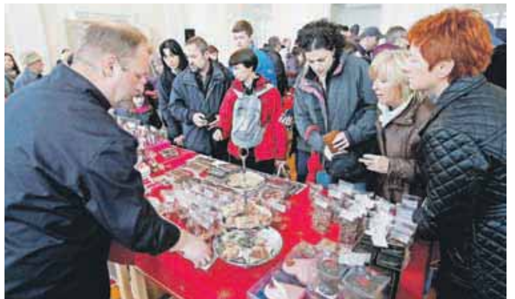
Lanski prvi Festival čokolade je bil kljub zelo slabemu vremenu izjemno uspešen, zato se organizatorji nadejajo, da ga bo letos obiskalo še več, kar okoli 20 tisoč ljudi.