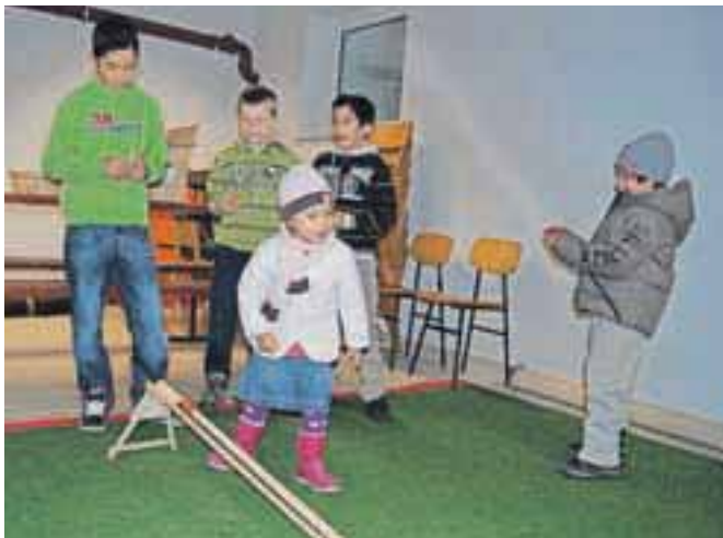
Popoldansko druženje ob velikonočnih igrah

Mladi in starejši pa se veselijo popoldanskega velikonočnega druženja na sam praznik, ko se srečajo ob velikonočnih igrah, pirhanju in fucanju.