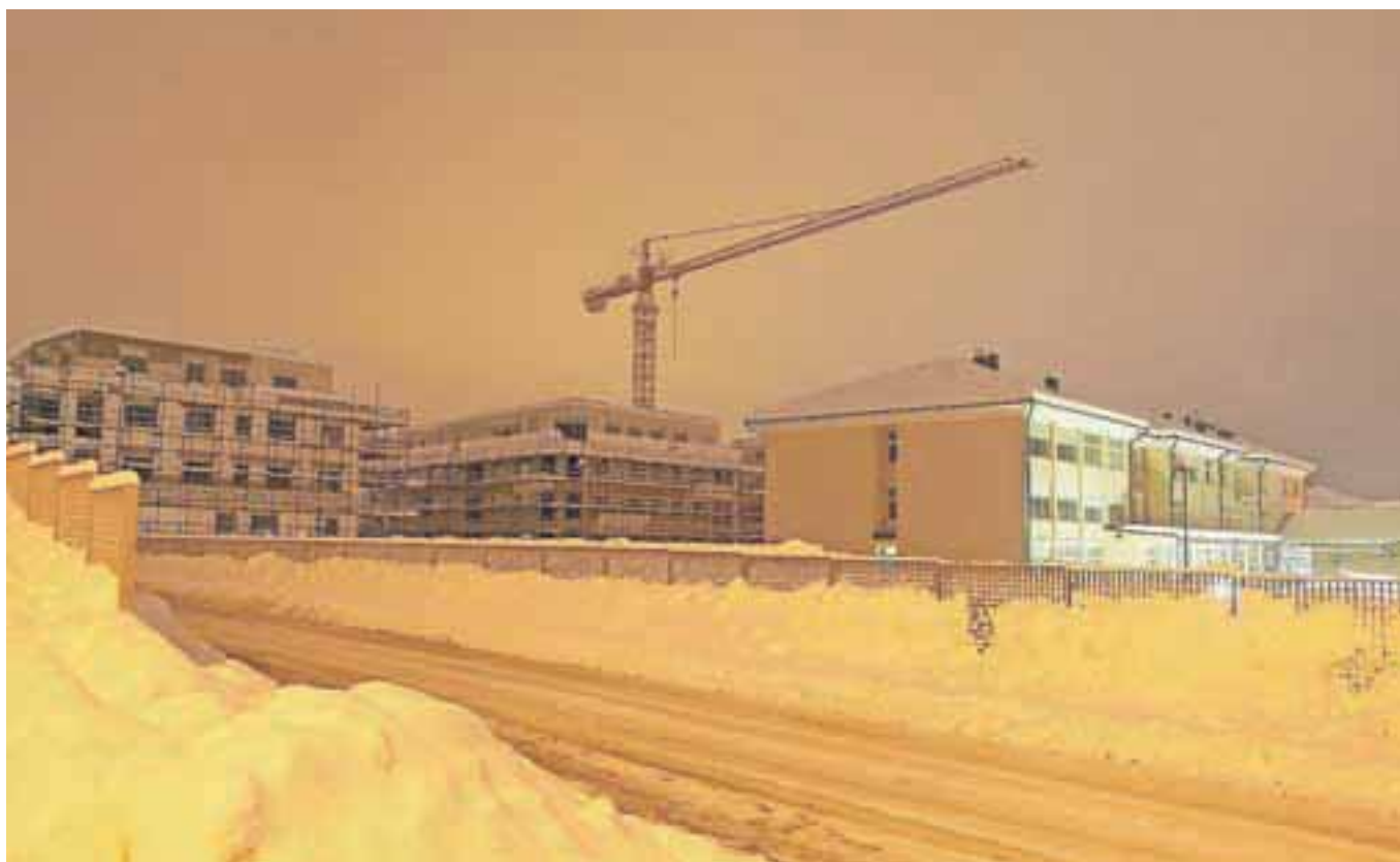
Gradnje 2, avtor: Marjan Resman