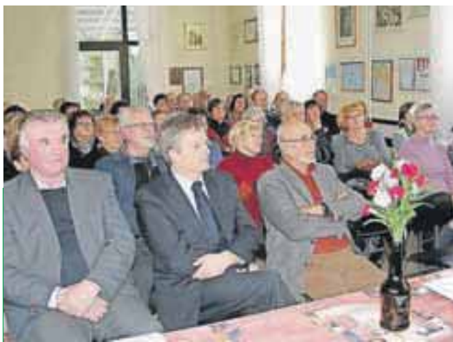
V društvu si prizadevajo za ohranjanje čim boljše psihofizične kondicije starejših, ki tako lahko ostanejo dlje časa v okolju, kjer se najbolje počutijo, aktivni in kar se da samostojni.