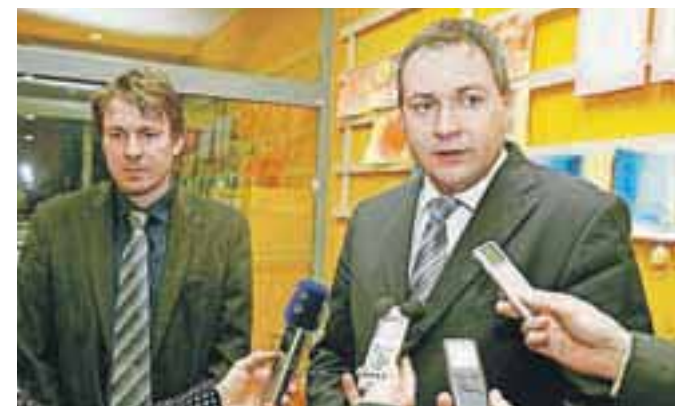
Predsednik ČZS Boštjan Noč in minister za kmetijstvo in okolje Dejan Židan

Minister Židan je ob obisku pohvalil delovanje leškega Čebelarško razvojnega centra v Lescah. »Veseli me, da se lahko del projektov, ki so pomembni v kmetijstvu in prehrani, financira tudi iz kohezijskih sredstev. To je mogoče zaradi soglasja regije in zavedanja, da je potrebno pridobljeno infrastrukturo uporabiti tudi v proizvodne namene.«