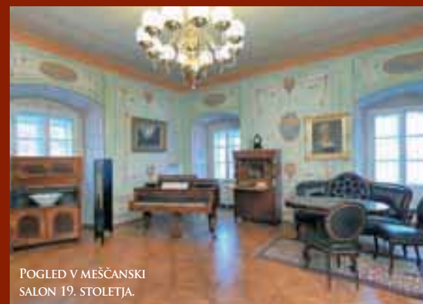
POGLED V MEŠČANSKI SALON 19. STOLETJA.

NOVA STALNA RAZSTAVA V GRADU KHISLSTEIN V KRANJU