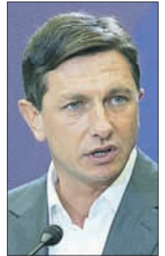
Borut Pahor

Tudi letos je kandidaturu napovedalo petnajst kandidatov in kandidat, toda do izteka roka za vložitev kandidatur so na situ ostali le trije, ki jim je uspelo zbrati bodisi dovolj podpisov volivcev bodisi dovolj podpisov poslancev.