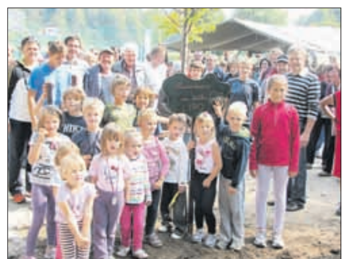
Septembra so ob nastajajočem športnem parku posadili lipo, ki jim jo je podarilo podjetje Vrtnarija Reš – Vrtko, d. o. o., občina Radovljica pa je ob njej postavila značilno radovljiško klopco.

bilo, smo se vaščani odločili, da sami zavijamo rokave. Izključno s prostovoljnimi delom in lastnimi sredstvi nam je uspelo narediti travnato nogometno igrišče in večnamensko asfaltno ploščad, ravnokar pa smo v fazi izgradnje večnamenske nadstrešnice in otroškega igrišča.« Na prostoru, kjer se že od nekdaj zbirajo domačini dveh vasi, bo tako, kot kaže, že kmalu res stal pravi športni park. »Ne ena ne druga vas za zdaj nimata prostorov za javno vsebino – ne trgovine, lokala, niti cerkve ne volišča. Zato si prizadevamo, za racionalno zgrajen kompleks, ki bo zadovoljeval tako rekreativne kot tudi nekatere druge javne interese in predstavljaj nekakšen novi skupni center obeh vasi.« Športni park bodo gradili postopoma: v prvi fazi bodo uredili vso potrebno doku-