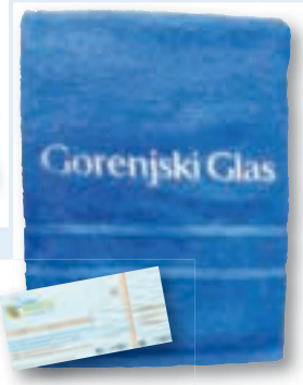
ali kopalna brisača s celodnevno vstopnico za Terme Snovik