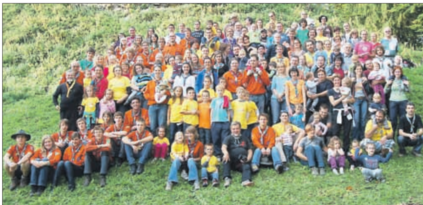
Ob 20-letnici so se na Pustem gradu srečali sedanji in nekdanji radovljiški skavti.