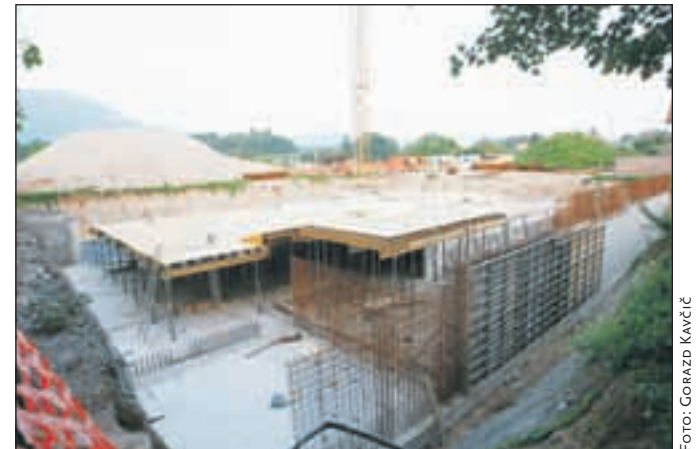
V neposredni bližini doma Dr. Janka Benedika v Radovljici so maja začeli gradnjo oskrbovanih stanovanj.