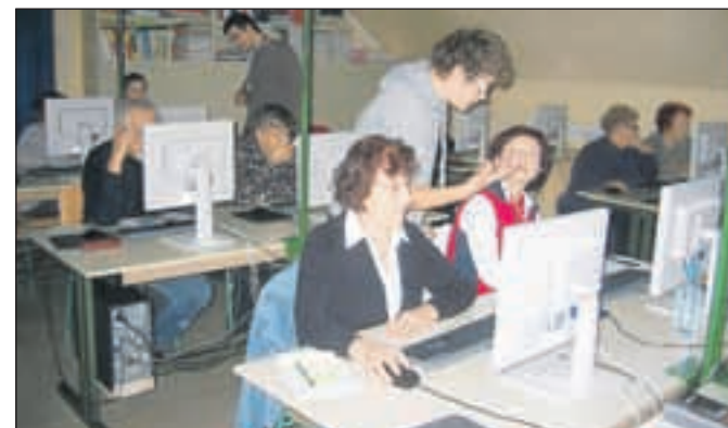
Na eni od delavnic v leški osnovni šoli