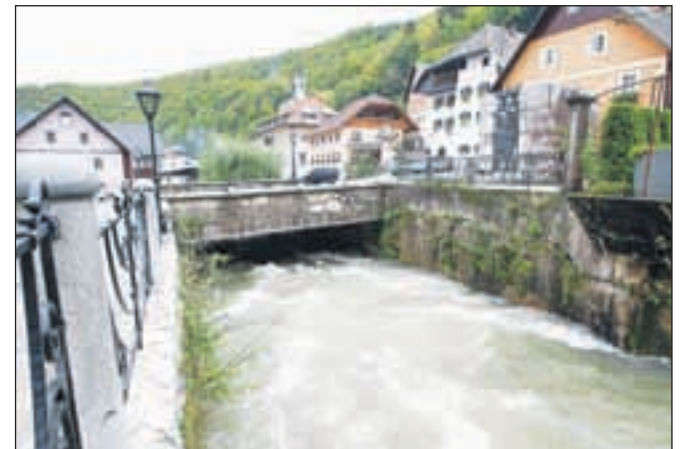
Ob vsakem večjem deževju se nivo Kroparice nevarno približa višini mostu čez reko.

»Niti meter več ne manjka, pa bo voda prišla do mostu in se bo ponovila katastrofa iz pred petih let,« je ob ponovnem hudem deževju in visokih vodah sredi oktobra opozoril domačin Damjan Šafner iz Krope. »Strugo Kroparice bi bilo nujno treba poglobiti. Če bi samo še kakšen dan deževalo in bi v reki pristala kakšna večja veja, bi se voda spet razlila po Kropi,« je prepričan domačin iz kraja, ki so ga pred petimi leti prizadele hude poplave. »V petdesetih letih, kar je bila Kroparica zadnjič poglobljena, je v strugo nanosilo vsaj tri četrta metra materiala. Ob tem so od prejšnjih poplav ostale skale in deli asfalta. Včasih so v Kroparici plavale ribe, zdaj pa je pogled na zanemarjeno dno reke prav žalosten,« je še opozoril Šafner. M. A.