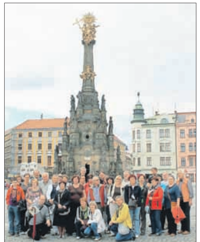
Udeleženci ekskurzije pred stebrom Svete Trojice na Gornjem trgu v Olomoucu

Med kratkim potepom po mestu sta nas vsaj prodajalni igrači in porcelana nazadnje lahko prepričali še o tem, da je na Moravskem med spominki ostalo tisto simpatično, pristno in nadvse uporabno, kar smo pri čeških prijateljih vedno občudovali, seveda pa se nismo mogli upreti niti klobasici, knedeljčkom in zelo dobremu belemu vinu, da o pivu seveda niti ne govorimo. Moravska, dežela na zahodu Češke republike, je ime dobila po reki Moravi, ki izvira v severno zahodnem delu pokrajine. Z drugima dvema zgodovinskima pokrajinama, Češko in de-