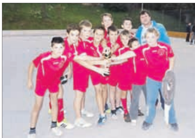
Zmagovalna domača nogometna ekipa

je zasedla ekipa Balinišče Kokelj, drugo mesto ekipa Prijatelji, tretje pa ekipa Graben. Prvič je bila med ekipami tudi ženska ekipa, ki je z balinanjem začela letos in zasedla šesto mesto.