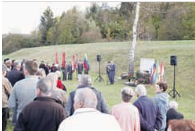
Spominska slovesnost ob spomeniku talcev

vila ekipa iz Begunj, pri starih 10 do 12 let pa domačini. Pomerili so se tudi veterani Zasipa in Lancovega, kjer so prav tako slavili domačini. V soboto je potekal balinarski turnir, na katerem je sodelovalo osem ekip. Prvo mesto