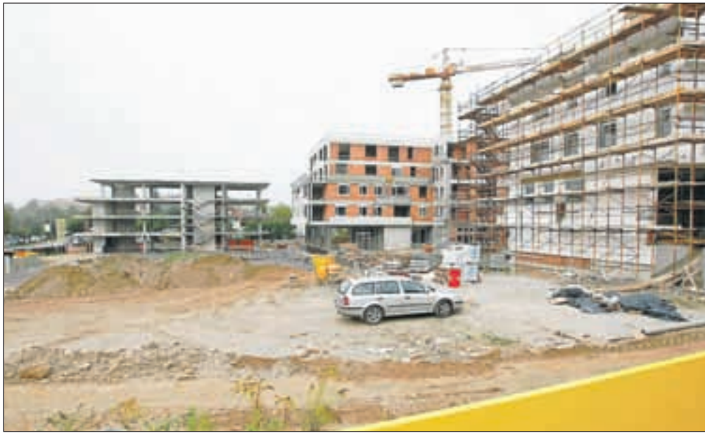
Gradnja nove knjižnice teče počasneje kot gradnja treh stanovanjsko-poslovnih objektov za njo.