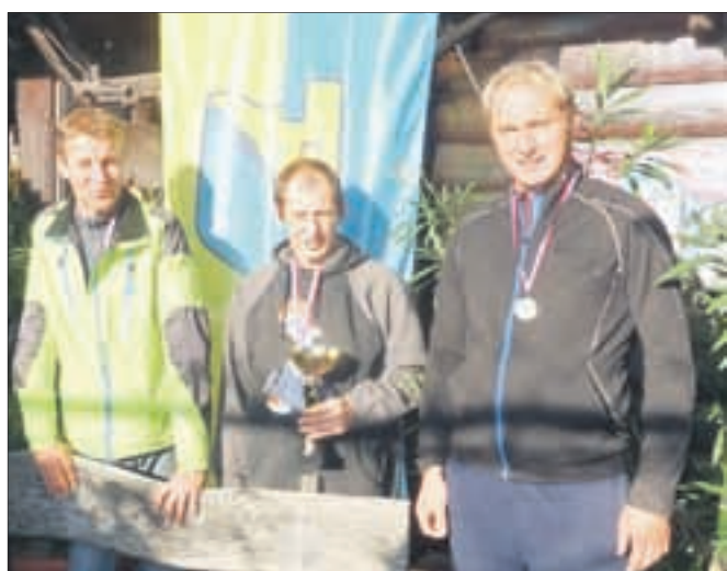
Na balinarskem turnirju je tudi letos zmagala ekipa Balinišče Kokelj.

V soboto so združili moči tudi gasilci, ki so popoldne v vasi Brda pripravili prikazno gasilsko vajo, v kateri so reševali otroke iz goreče hiše. Po uspešno izvedeni akciji so domačinom prikazali tudi rokovanje z gasilnim aparatom, krajanke pa so pripravile pravo domačo pogostitev.