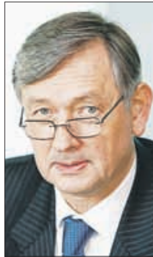
Danilo Türk

Sedaj je tudi že znan vrstni red, kako bodo kandidati razvrščeni na glasovnicah. Državna volilna komisija je namreč izžrebala naslednji vrstni red: Borut Pahor, Dani-