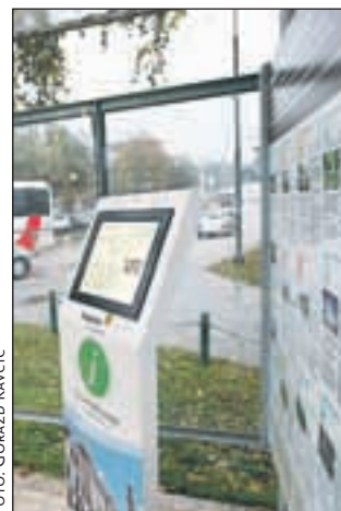
V okviru projekta so letos uredili informacijske točke.

evrov, kar 95 odstotkov nepovratnih sredstev je prispeval Evropski sklad za regionalni razvoj. V okviru programa Leader, ki poteka od leta 2007 do 2013, pa je bila letos označena romarska pot od Brezij do Brezij pri Trziču ter hišna imena in nakupljena oprema za prireditve, vse skupaj v vrednost 36 tisoč evrov, pri čemer je polovica nepovratnih sredstev Evropskega kmetijskega sklada.