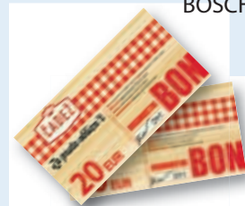
ali darilni bon mesarstva Čadež v vrednosti 20 EUR