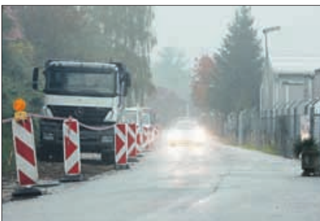
Načrtovane rekonstrukcije ceste za Verigo tudi prejšnji pešci niso mogli dokončati.

občinske uprave za izvedbo nujnih del za zagotovitev prometne varnosti na tem odseku so dela poskušali izvesti še pretekli petek, a so jih morali na podlagi zavrnitve pritožbe občine na sodno odredbo znova zaustaviti. »Od vsega začetka del je eden od služnostnih upravičencev na različne načine pravno in fizično blokiral vsa dela. Med drugim tudi tako, da je parkiral tovornjake na območju, kjer smo želeli izvajati dela, kljub temu da tam nikoli do sedaj ni izvajal svoje služnosti. Kot kaže, do zaključka sodnih postopkov, v katerih bo odločeno, v kakšnem obsegu lahko služnostni upravičenec izvaja svojo služnost in kakšno vrsto del občina na odseku ceste sploh lahko izvaja, načrtovane rekonstrukcije ne bo možno in dovoljeno izvesti, kljub temu da gre za služnost hoje, vožnje in parkiranja na javni cesti, ki jo zakonodaja ne dopušča več. Zato bo občina poskušala poiskati začasno nadomestno rešitev za nujno zagotovitev varnosti, predvsem pešcev, na tem odseku,« še pojasnjujejo na občini.