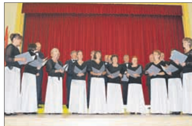
Na tradicionalnem koncertu v Kulturnem domu Kropa je zapel tudi domači Mešani pevski zbor Koledva.