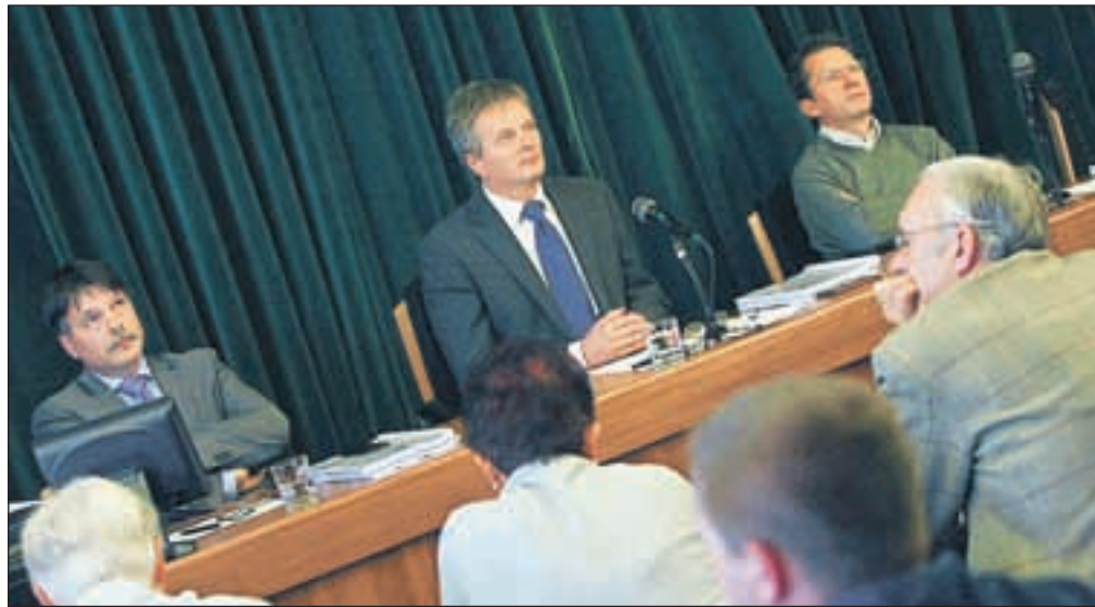
Na izredni seji je župan Ciril Globočnik svetnikom predstavil proračun za leti 2013 in 2014.

Svetniki bodo osnutek odloka o proračunu občine obravnavali na naslednji redni seji, ki bo prihodnje sredo, 7. novembra. Pred tem bodo proračun usklajevali na odborih. Če bo občinski svet predlagani dokument v fazi osnutka potrdil, ga bo župan v obliki predloga občinskemu svetu v obravnavo in potrditev posredoval na zadnji letošnji seji, ki bo 19. decembra.