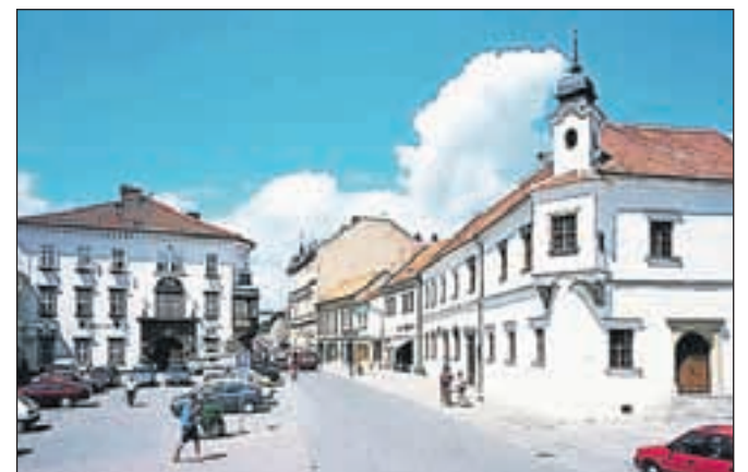
Ivančice, rojstni kraj Linhartovega očeta. V stavbi KIC, kjer je razstava Alfonza Muche, se je že predstavil tudi Čebelarški muzej iz Radovljice.