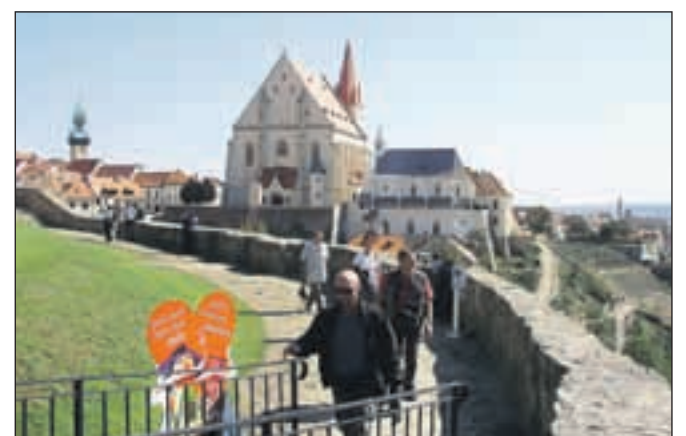
Sprehod ob obzidju grajskega griča v Znojmu