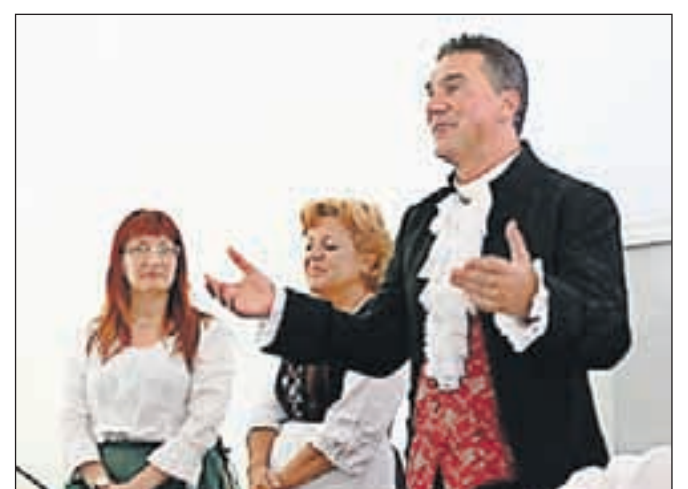
Z medom so tesno povezani tudi mojstri iz gostilne Lectar.