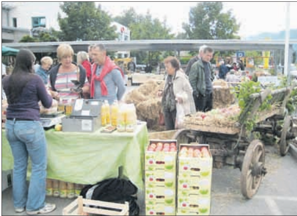
Pred upravno stavbo Kmetijsko gozdarske zadruge Sava Lesce so v okviru zadrugičnega dne pripravili bogat program za udeležence.

Zadruga še vedno največ prihodka ustvari z odku-