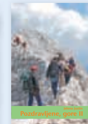
ali knjiga Pozdravljene gore II