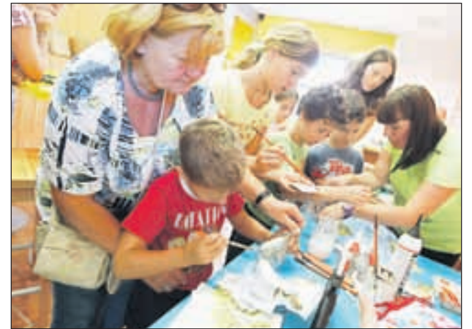
Otroci so vse dopoldne ustvarjali v delavnicah.