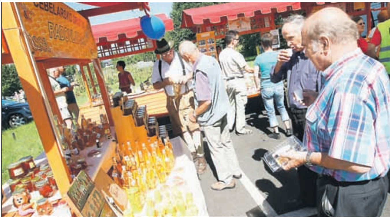
Na prvem Festivalu medu so posebno pozornost posvetili uporabi medu v kulinariki.