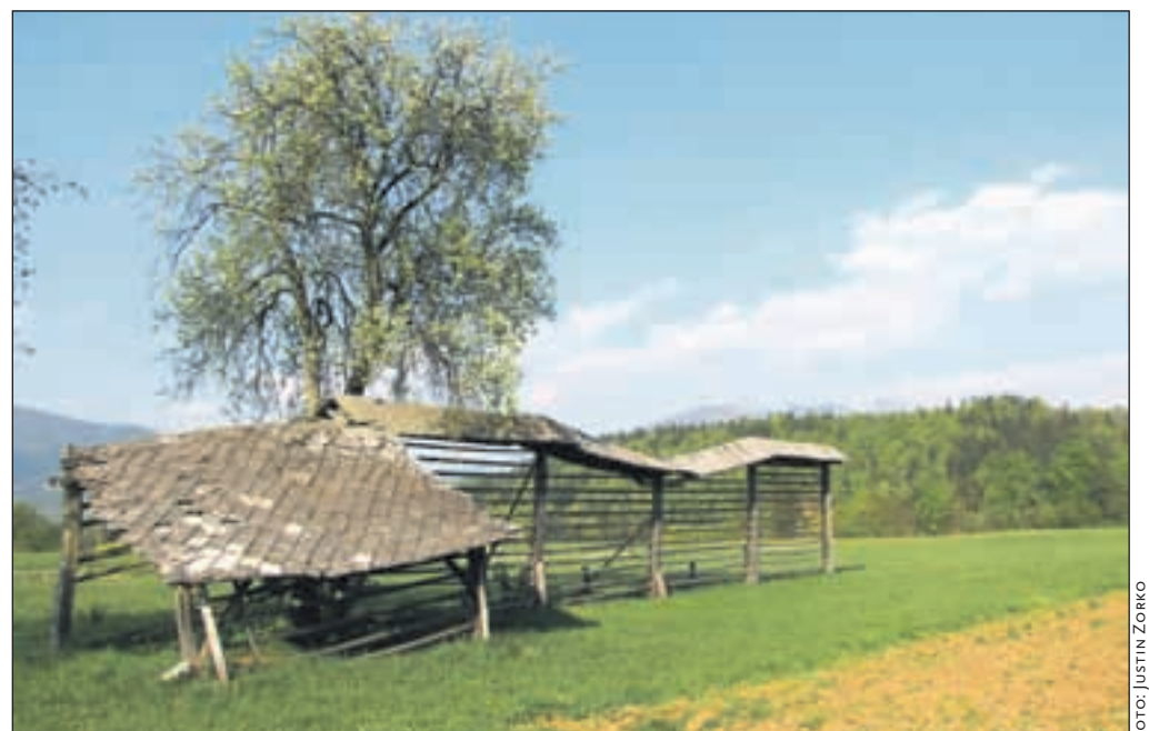
V galeriji Avla v stavbi Občine Radovljica je še do konca prihodnjega tedna na ogled razstava fotografskih del Justina Zorka z naslovom Ko mene več ne bo. Razstava je na ogled ob ponedeljkih, torkih in četrtek od 8. do 15. ure, ob sredah do 17. ter ob petkih do 13. ure.