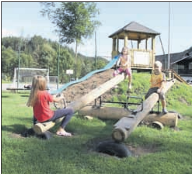
Nova igrala so večinoma lesena. Poleg so uredili še leseno lopo z mizo in klopni ter prostor s pitnikom vode.

Konec junija so začeli z deli ob športnem igrišču člani društva, starši otrok in drugi vaščani. Nova igrala so večinoma lesena: hišica s toboganom, traktor, različne gugalnice, mizica in stolčki. Poleg so uredili še leseno lopo z mizo in klopni ter prostor s pitnikom vode. Prva igrala so bila nared za igro že julija, uradno pa so jih odprli ob Langusovih dnevih v začetku septembra. Kmalu po postavitvi so bila igrala žrtev vandalizma, a so se tudi tokrat domačini vzeli skupaj in znova postavili stvari na svoje mesto.