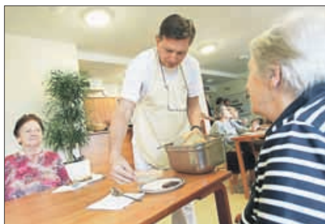
Borut Pahor je stanovalkam Doma dr. Janka Benedika takole postregel z zajtrkom.

in smehom postregel z zajtrkom. »Ne, tega si pa nikoli nisem mislila. Da bom