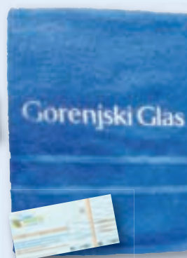
ali kopalna brisača s celodnevno vstopnico za Terme Snovik