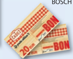
ali darilni bon mesarstva Čadež v vrednosti 20 EUR