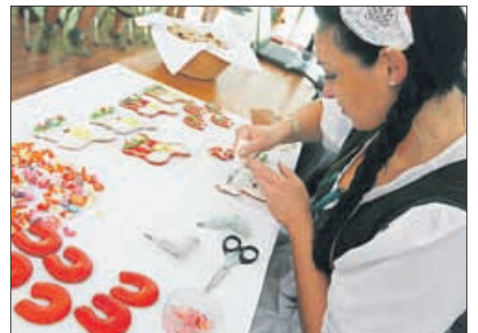
Prikaz izdelovanja medenih kruhkov in lectovih src