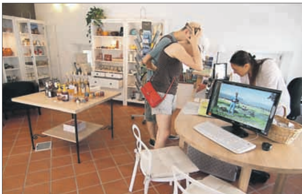
Številni gostje se v času bivanja večkrat vrnejo v TIC po nove informacije in ideje.