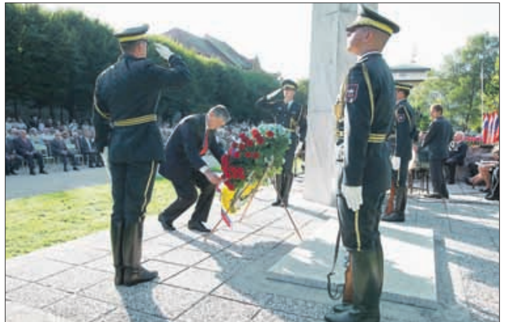
Slovesnost ob 70. obletnici smrti Janeza Gregorčiča je bila v petek pri spomeniku v grajskem parku. Venec na grob padlih partizanov je položil tudi predsednik republike Danilo Türk.

Kot je še dejal predsednik države, se je slovenski narod večkrat v svoji zgodovini znašel v težkem položaju. »To je bil veličasten trenutek slovenske zgodovine. Tako je