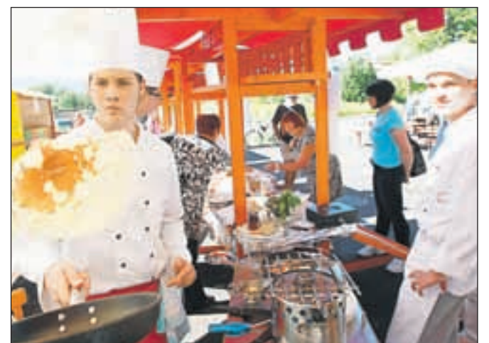
Zunaj je dišalo po medenih dobrotah.